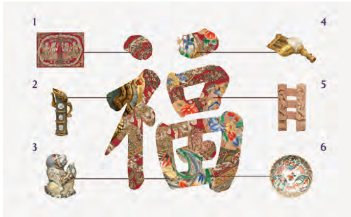
圖5 《大福字軸》設計分解示意圖 萬貳工作室設計