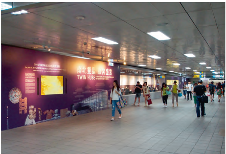
圖2 臺北車站捷運站藝文空間