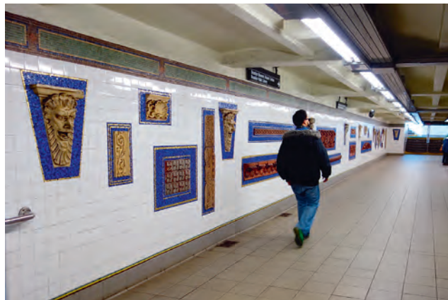
圖11 東公園路—布魯克林博物館站建築文物展示