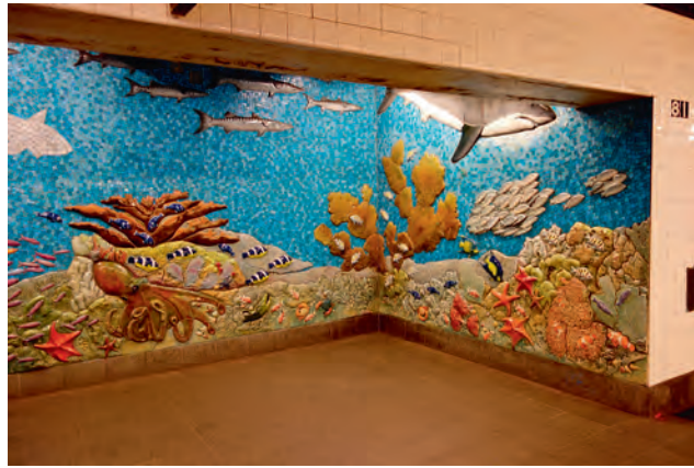
圖10 第81街自然歷史博物館站的馬賽克壁面