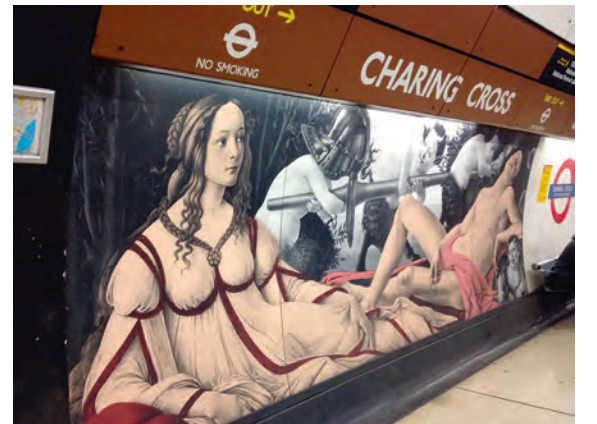
圖9 查令十字路口站月台上複製輸出國家藝廊館藏名畫

羅浮宮的舊地鐵站「羅浮宮—喜孚里站」(Louvre-Rivoli)開鑿壁龕，置放大作的複製品(註二)，月台壁面則模仿羅浮宮石壁，甚至連月台上擺置的座椅都與博物館內的一模一樣(註三)，營造博物館實境的氛圍，開啓巴黎地鐵藝文展示的先河。一九九八年開始，巴黎地鐵宣布將展開長達二十五年的地鐵美化工程(un métro + beau)，針對二百餘間地鐵站逐一更新。其中，「羅浮宮—喜孚里站」自二〇一五年九月開始進行十二周的整修工程，於十一月底重新開放，除了硬體建設翻新以外，藝文展示方面，於月台上展示博物館藏的埃及、希臘、羅馬與亞洲文物複製品，原先的月台石壁爲了方便維護，更換爲瓷磚壁面，玻璃座椅則更換爲更穩固安全的黑色座椅(註四)，呈現全新的展示景觀。(圖八) 英國倫敦地鐵的「查令十字路口站」(Charing Cross)，鄰近國家藝廊與國家肖像畫廊，在貝克盧線(Bakerloo Line)的月台壁面張貼了