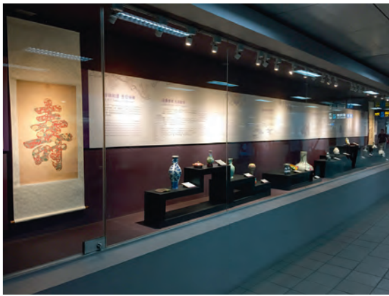
圖12 臺北車站捷運站的複製品展示

綜觀前述各博物館與捷運/地鐵合作的案例，由於選擇呈現的方式各異其趣，似乎也反映出各間博物館對於這些藝文空間的策劃方向，以及在迎賓、形象推廣、指引與教育展示之間的不同考量。