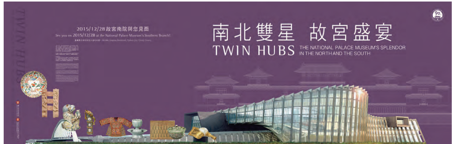
圖3 藝文空間主形象牆 萬貳工作室設計

本院與捷運站合作設置藝文空間，並非博物館首創，放眼國際，已有多項博物館與地鐵系統合作的案例。早在一九六八年，法國羅浮宮在當時的文化部長安德烈·馬樂侯(Andre Malraux)主政之下，就在