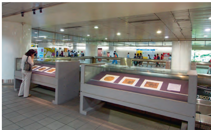
圖6 遊客觀賞書畫複製品展示