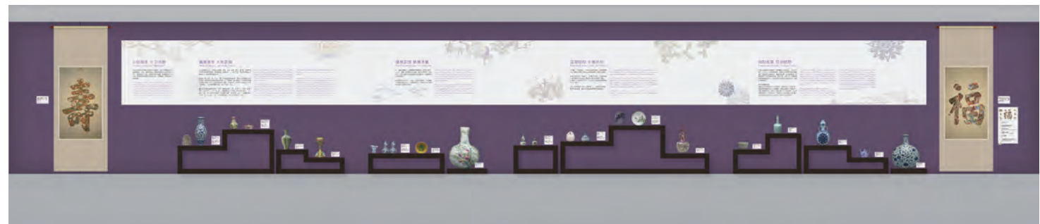
圖4 複製品長櫃示意圖 萬貳工作室設計