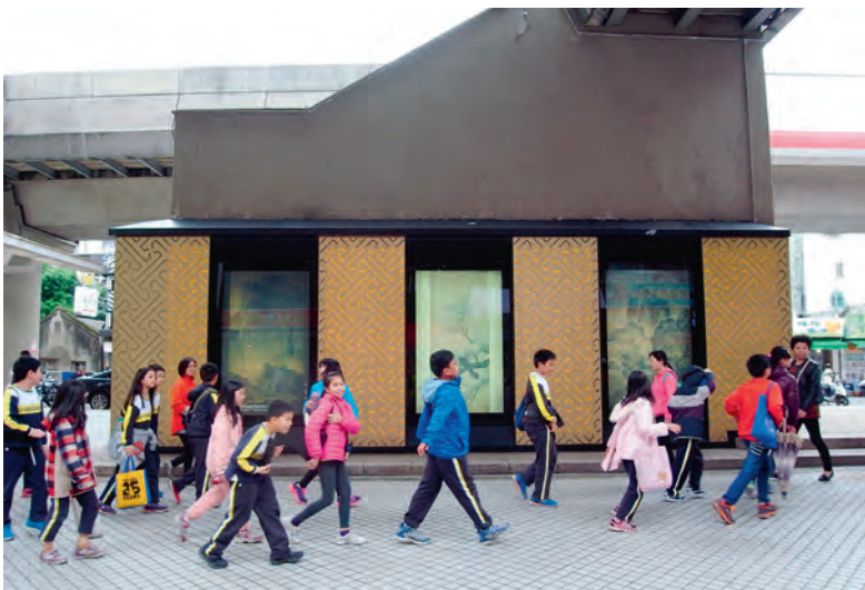
圖1 旅客行經士林捷運站燈箱展示