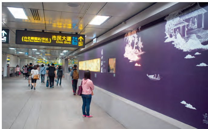
圖7 燈片展示、影片播放與聲光感應裝置

三、書畫複製品展示 在捷運通道的另一端，設立四個書畫獨立展櫃，可彈性展示書畫長卷或冊頁複製品。本次換展呼應「吉祥如意·生日快樂」主題，挑選二玄社精製宋元冊頁，分「仙萼長春」、「花卉」、「草蟲」、「禽鳥」等四單元，共計展出十二幅作品。(圖六)