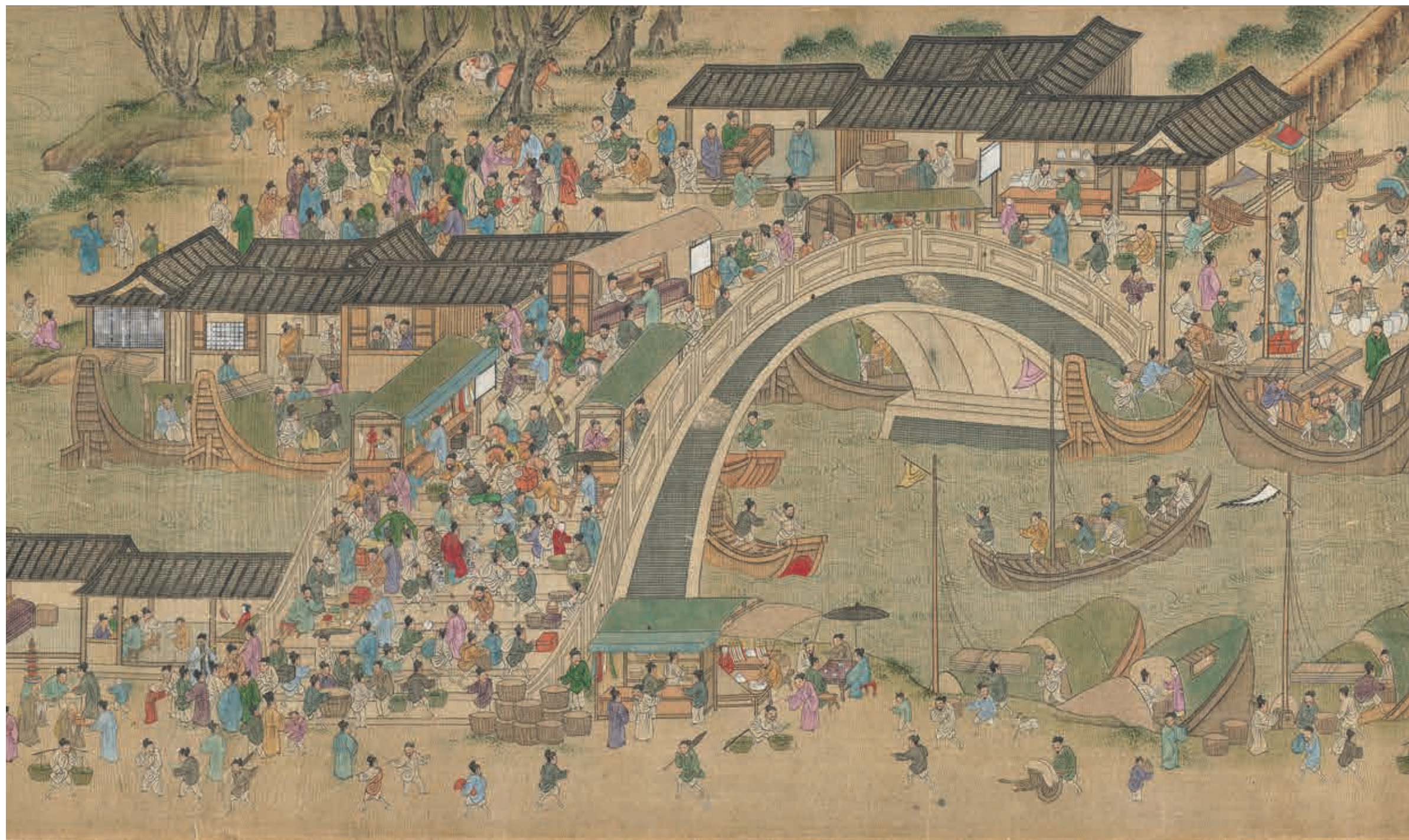
圖六 傅明 仇英 清明上河圖 局部 故畫1606 國立故宮博物院藏