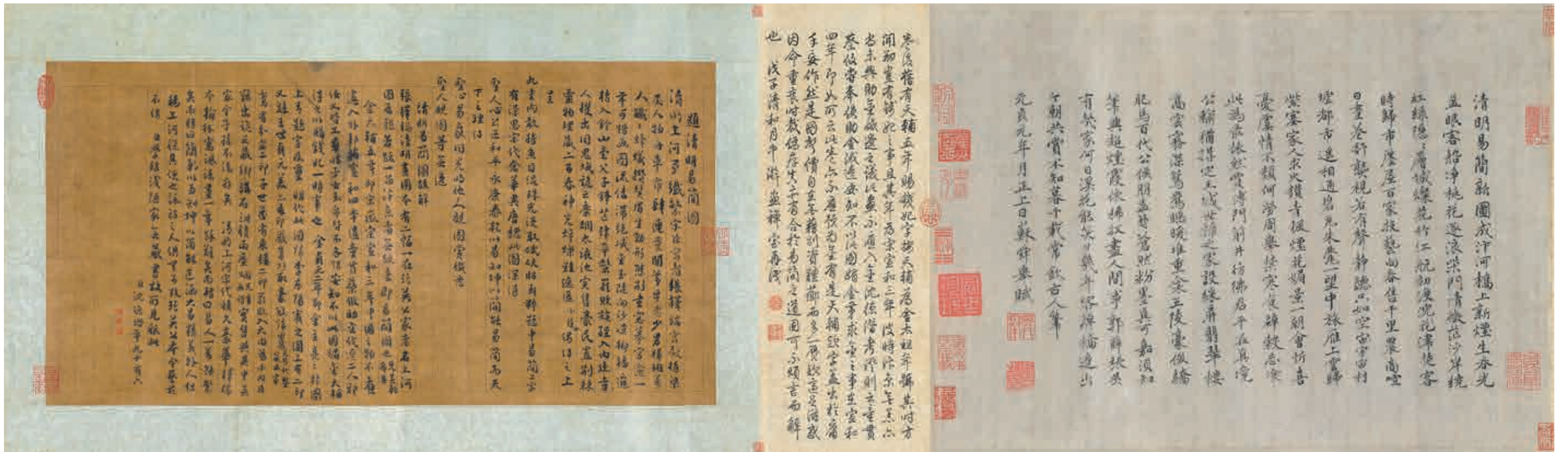
圖二 傳宋 張擇端 清明易簡圖 局部 國立故宮博物院藏