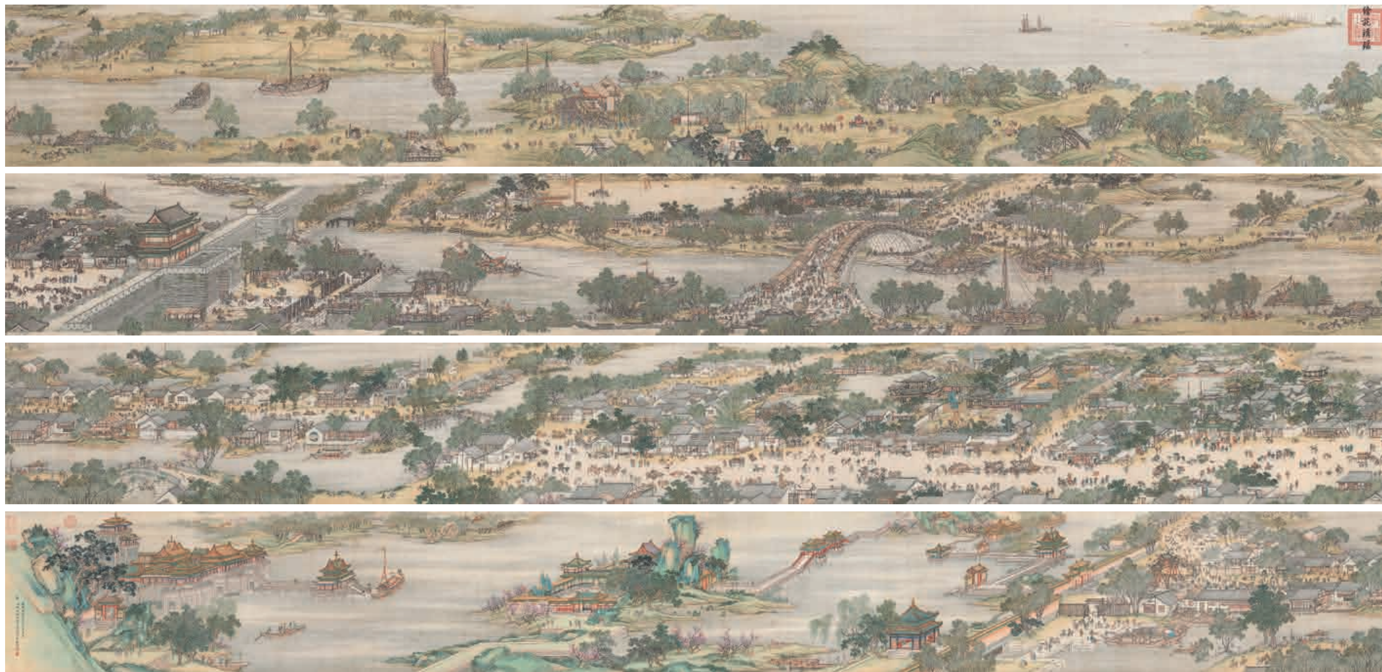
圖七-1 清院本清明上河圖 國立故宮博物院藏