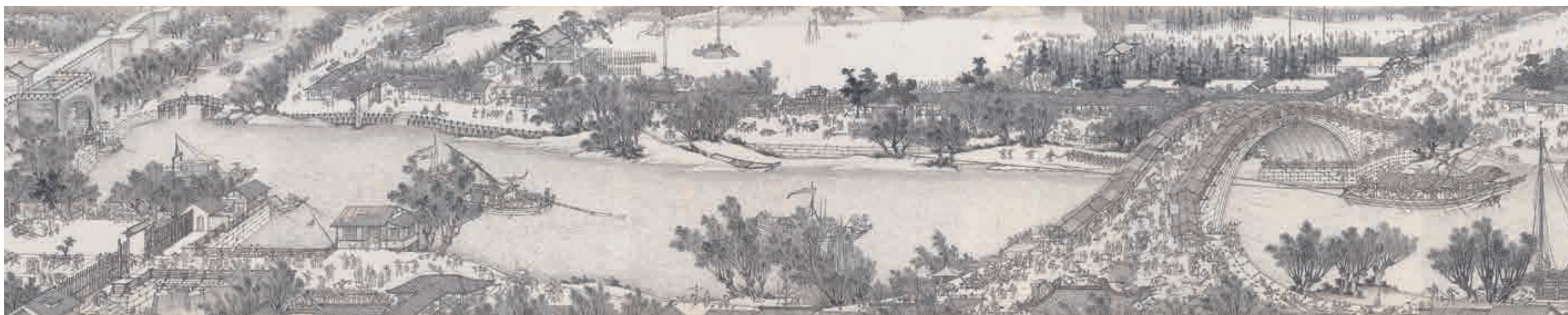
圖八 清 沈源 清明上河圖 局部 國立故宮博物院藏