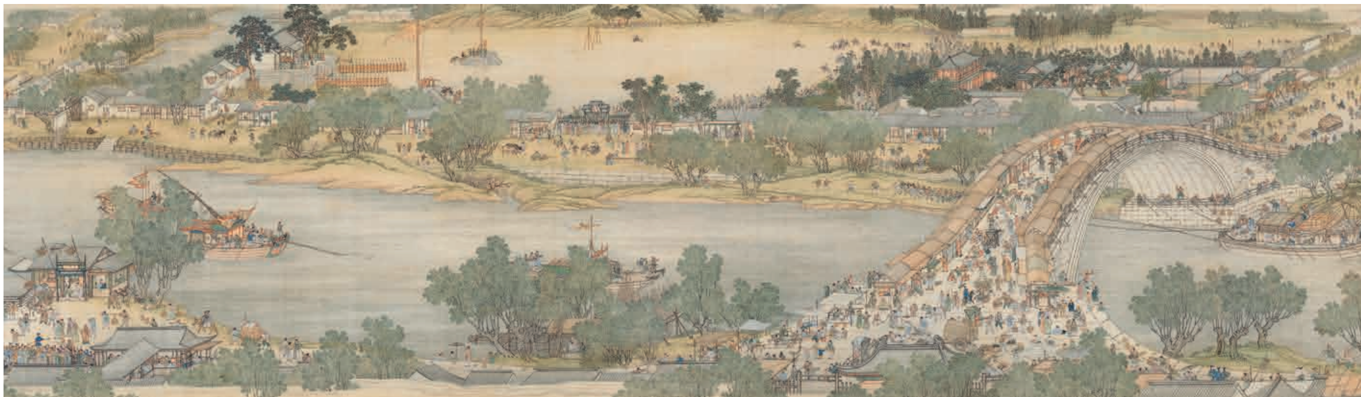
圖七-2 清 院本清明上河圖 局部 國立故宮博物院藏