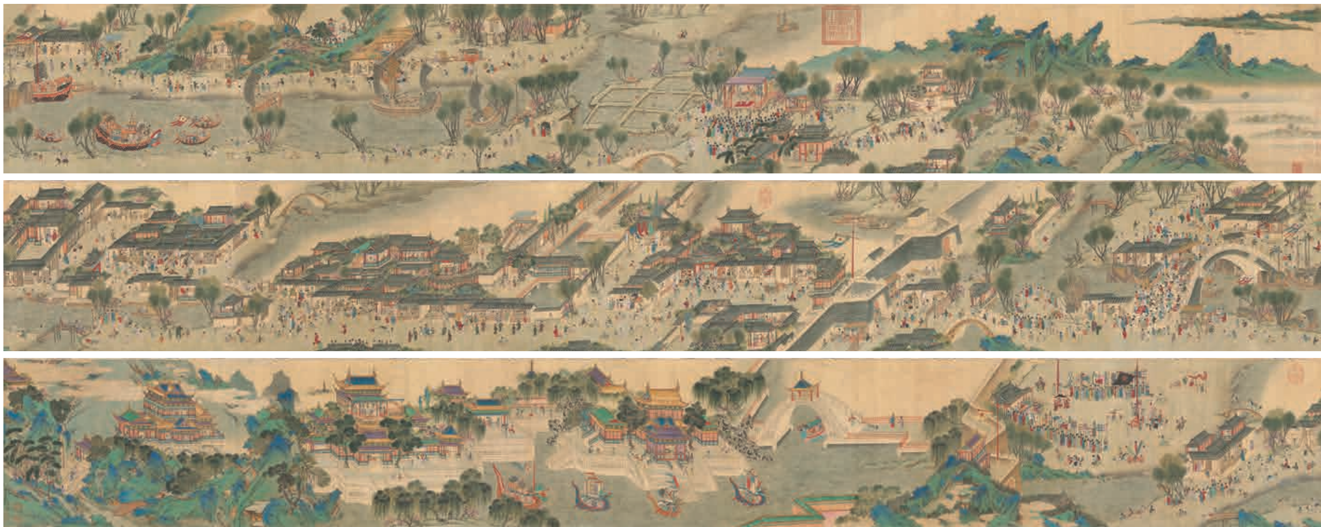
圖五 傳明 仇英 清明上河圖 故畫1605 國立故宮博物院藏