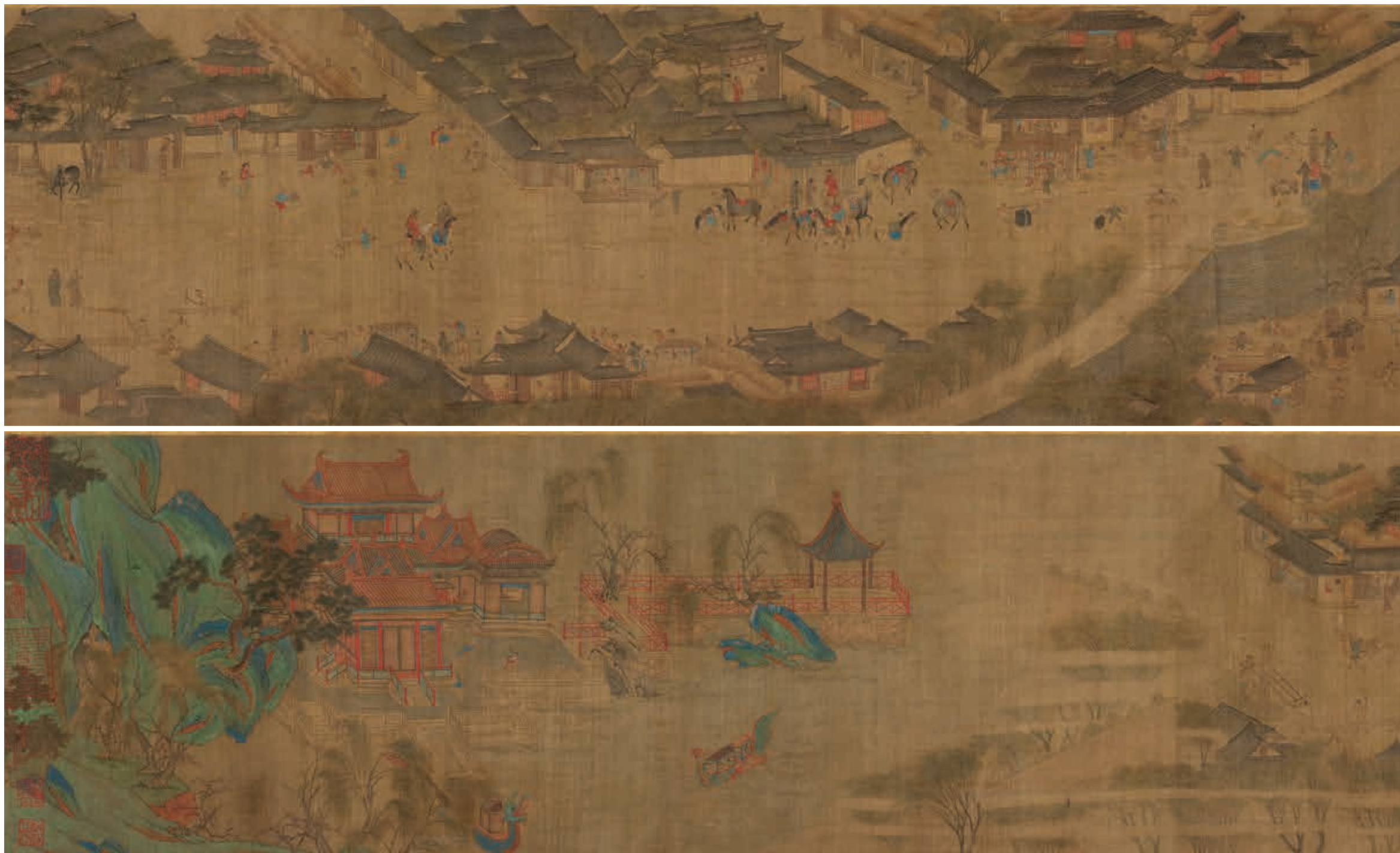
圖三 傳宋 張擇端 清明上河圖 局部 國立故宮博物院藏

跋。款、題書風相近，筆多偏鋒，鋒芒外顯，但結體鬆散，與文徵明精整穩健的用筆，差異極大。 故畫一六〇五的畫面場景多處與前兩者的版本不同，如戲台演出、射柳、雜耍特技、走索及校閱等場景的