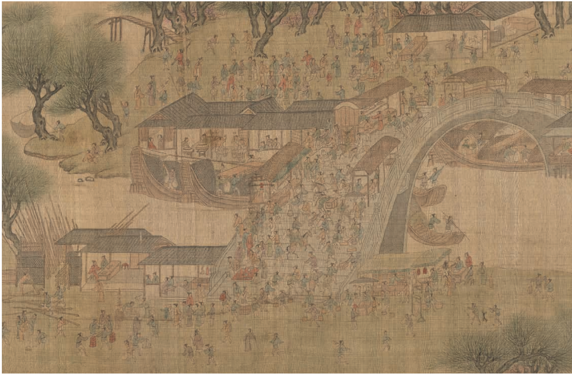
圖四 傳明 仇英 清明上河圖 局部 故畫1604 國立故宮博物院藏