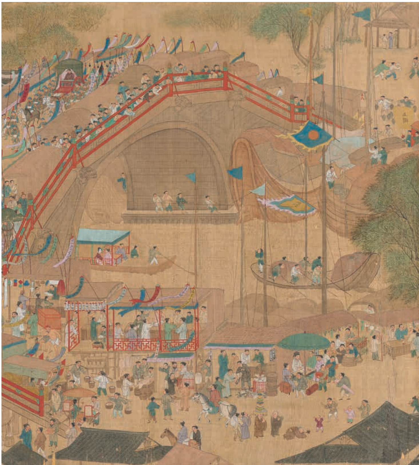
傳宋 張擇端 清明易簡圖 局部 國立故宮博物院藏