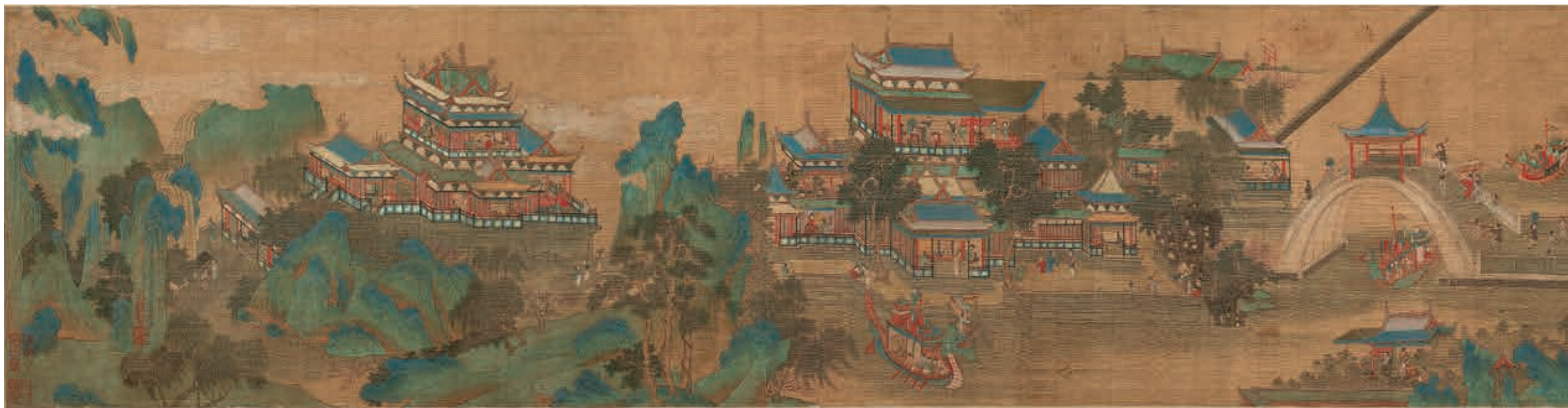
圖九 清人 清明上河圖 局部 國立故宮博物院藏

〈清院本〉在布局的取捨與人物的互動組合上，更為合理，加上受到西洋畫風的影響，街道房舍，均以透視原