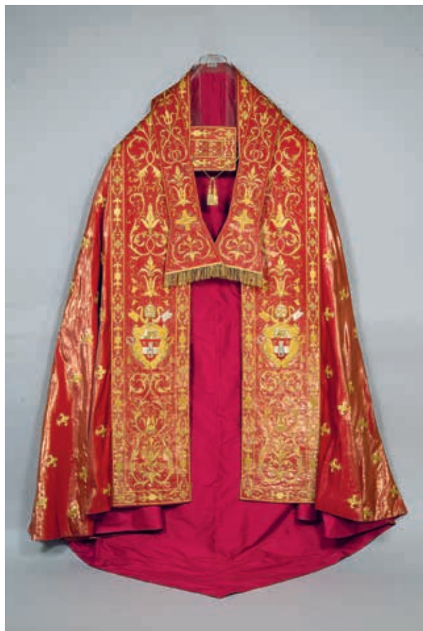
聖教宗若望23世的紅色大圓斂與領帶 1958-1963 布料、刺繡、珍珠 長250，寬250公分 梵蒂岡宗座禮儀聖器室藏