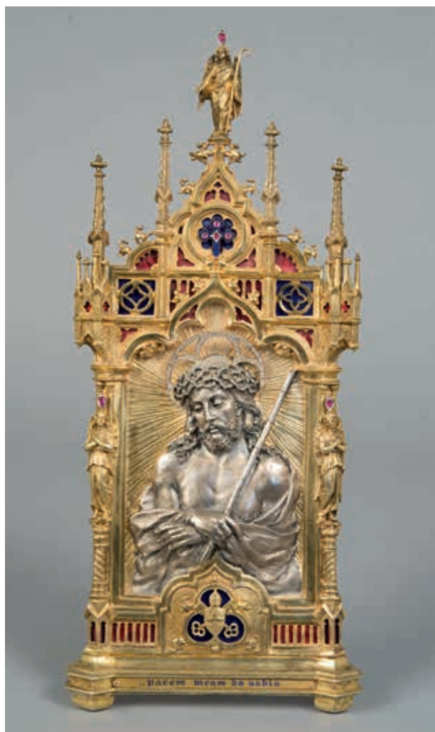
教宗良13世祭壇畫「看，這個人」 尤捷尼歐·貝羅西歐 (Eugenio Bellosio) 製作 1887 義大利米蘭 鍍金銀、紅寶石、鑽石、珉瑯 長29.5，寬13，高7.5公分 梵蒂岡宗座禮儀聖器室藏