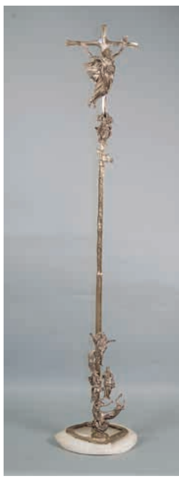
聖教宗若望保祿2世遊行禮十字架 馬力歐·托費提製作 (Mario Toffetti) 1996 義大利貝加摩 長210，寬43，高31公分 銀、鍍金銀、大理石 梵蒂岡宗座禮儀聖器室藏