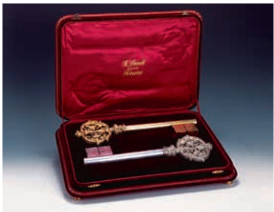
教宗良13世伯多祿鑰匙 南迪 (G. Landi) 製作 1903 義大利費拉拉 鍍金銀、銀 長37，寬12.5，高2.5公分 梵蒂岡宗座禮儀聖器室藏

昂第二次大公會議 (Second Council of Lyon, 1245) 後，教宗由樞機主教團 (Sacred College of Cardinals) 選舉產生，為終身職。自一四九二年起，固定於西斯汀教堂 (Sacellum