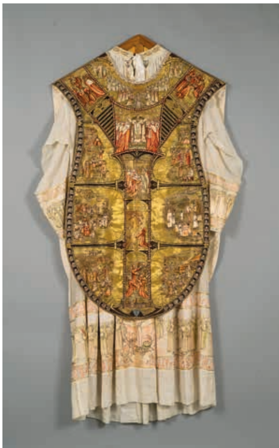
教宗碧岳11世祭披與領帶 聖心佳蘭隱修院方濟佳蘭修女會修女製作 1926 法國馬札梅 絲、金絲線 長105，寬61公分 梵蒂岡宗座禮儀聖器室藏

教宗是教廷的領袖，現任的教宗方濟各來自阿根廷，於二〇一三年就職，他選用了「方濟各」為其稱號，乃因尊崇亞西西的聖方濟（Saint Francis of Assisi, 1181-1226）的精神，希望世人予以效法，將天主創造的宇宙萬物視為自己手足，重視當今的環保問題。在本次展出教宗碧岳十一世（Pope Pius XI, 1922-1939在位）的祭披與領帶上，我們可以看出見聖方濟的行誼。