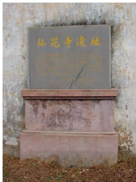
廣東肇慶蓮花寺遺址

相間，和銀色花窗的玻璃陶瓷外觀，由小磁磚環繞裝飾，這些小磁磚以浮雕的方式刻畫出聖方濟各的生活樣貌。全立體天使小雕像與花瓶相間裝飾著聖髑箱的四面邊緣。聖髑箱上方