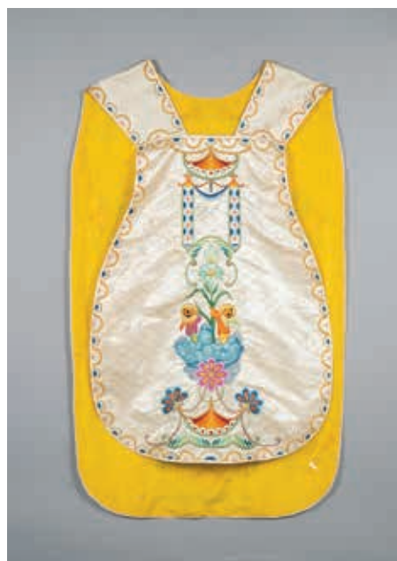
聖教宗若望保祿2世的中國風祭披與領帶 梵蒂岡宗座禮儀聖器室藏