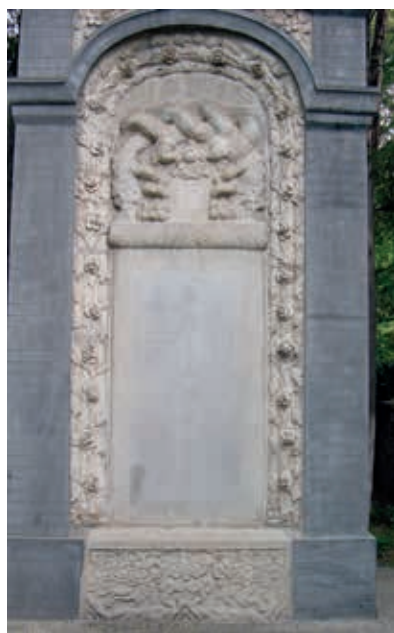
北京車公莊利瑪竇墓碑於2003年