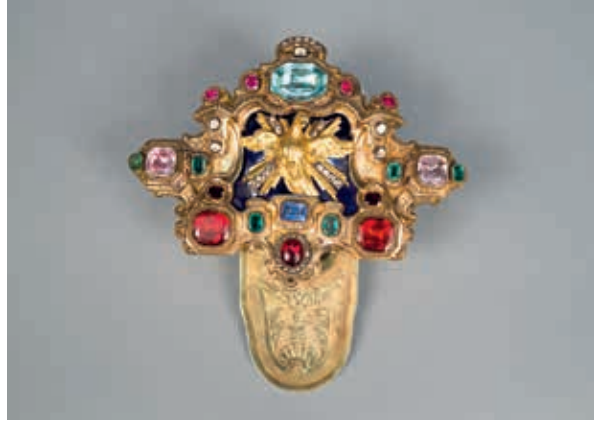
天主之僕教宗本篤13世寶石嵌飾胸牌 1729 義大利羅馬 金、銀、紫水晶、海藍寶石、祖母綠、藍寶石、石榴石、紅寶石和其他寶石 長14.5，寬15，高3.5公分 梵蒂岡宗座禮儀聖器室藏

Sixtinum) 舉行選舉至今。 十一世紀，教宗國瑞七世 (Gregorius VII, 1073-1085在位) 推動宗教改革，教廷開始積極參與國際事務和宣達理念，在國際關係上抱持