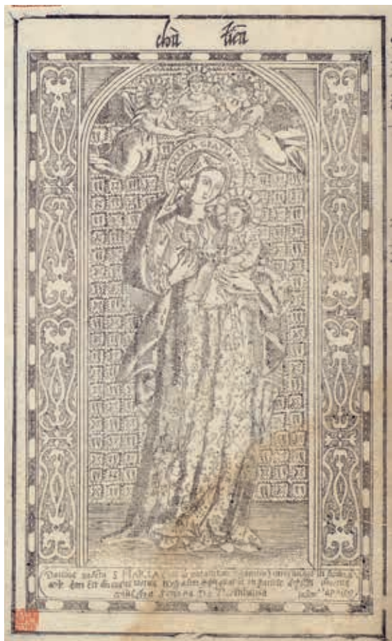
明 程大約 《程氏墨苑》聖母懷抱耶穌之像 明萬曆間滋蘭堂刊本 國立故宮博物院藏