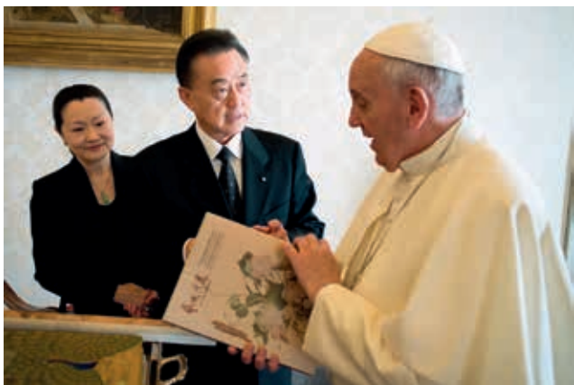
我國駐教廷王豫元大使曾見羅馬天主教教宗方濟各，並向教宗介紹國立故宮博物院和義大利佛羅倫斯聖十字教堂聯合舉辦之「藝域漫遊—郎世寧新媒體藝術展」。