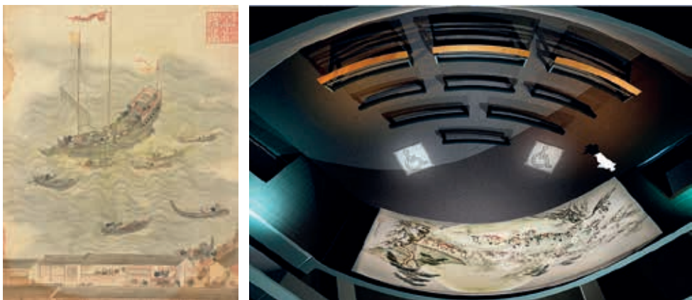
圖二 導覽廳內，播映認識亞洲主題影片。