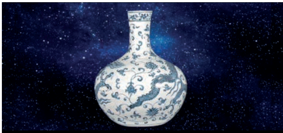
圖十一 「華夏文化圈」片段—青花瓷。

國、緬甸等國的文字多半屬於這類。(圖十)從日常生活的食物、服飾到精神層面的宗教藝術，都是印度文化傳播的實例。 華夏文化圈 人的往來，帶來了思想上的交流，由中國所發展形成的漢字便在中、日、韓、越等地扮演起溝通的媒介，即使我們不會說當地的語言，也可略知其代表的意義。正是如此，亞洲各區域間有了溝通的平台與管道，