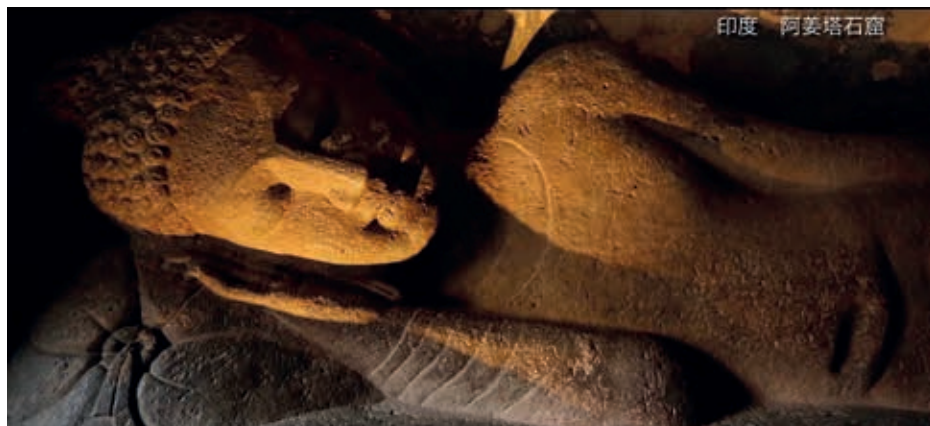
圖七 「印度文化圈」片段—佛教藝術。