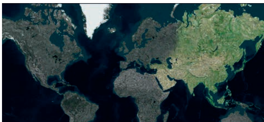
圖四 「認識亞洲」片段—亞洲地理。

提供認識亞洲藝術與文化所涉及的基礎知識，進而能對展示文物的歷史文化座標有宏觀的瞭解。傳統上，地圖及年表扮演了對空間及時間認識上的輔助角色，然而如上文所述，對國內民衆而言，亞洲藝術與文化仍是