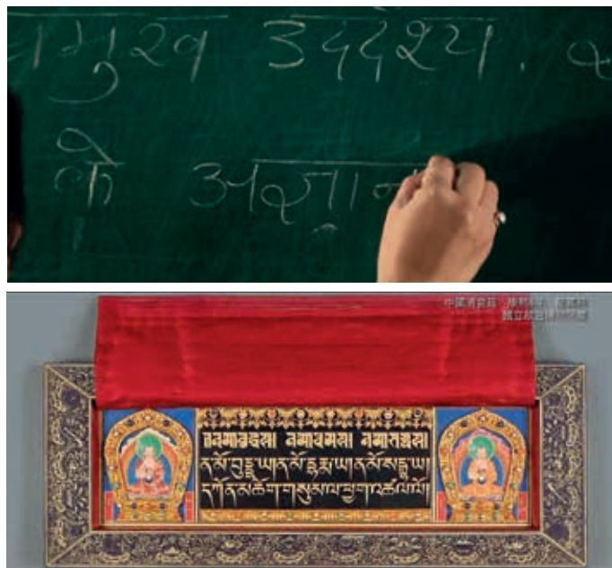
圖九 「印度文化圈」片段—北印度文字。

在交流的過程中，印度織品成為印度與東南亞十分重要貿易商品。(圖八)最後，影片以文字說明印度文化的傳播，由拼音所組成的婆羅米字母(Brahmi)是最早可辨認的印度文字之一，這套字母在印度次大陸的南北