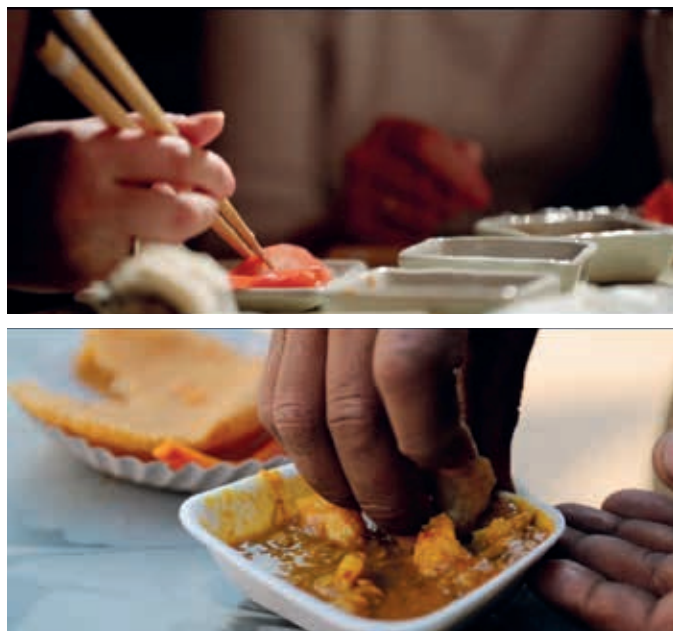
圖五 「認識亞洲」片段—飲食文化。

網絡關係。再從微觀的角度來看，日常生活中，其實亞洲的風景也常常與我們擦身而過：來自日本、泰國、印尼、越南等地形形色色的亞洲人，就經常出現在我們生活周遭。以上種種，皆說明了臺灣的亞洲論述有其獨特不凡的魅力。