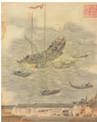
圖三 《長崎貿易圖冊》〈起貨〉局部 國立故宮博物院藏

有了共同的藝術因子，構成了講述亞洲藝術與文化的可能性，有趣的是，因為觀察視野的不同，各地所呈現的亞洲藝術也就有所差異，例如日本大阪歷史博物館透過遣唐使與遣唐使的途徑，接起由長安到西亞的絲路，呈現出日本與亞洲在藝術上的緊密關係。若從臺灣看亞洲，當然會出現不一樣的亞洲景觀，想像一下，站在臺灣的頂點玉山眺望，北方是東北亞，南方是東南亞，西邊則是往來密切的中國大陸，我們其實就在亞洲的樞紐上！早在十七世紀，荷蘭東印度公司便利用臺灣這個得天獨厚的位置，建立起貿易據點，在此轉運中國、日本與東南亞各國的貨物，除了歐洲商船，諸如本院《長崎貿易圖冊》〈起貨〉中的唐船（圖三），也擔任起東亞海上絲路的運輸要角，來自中國的絲綢、書畫；或者泰國的象牙、獸皮等，在日本長崎出售之後，商船再將購得的日本物資運至亞洲其他各地交易，正是這些往來於亞洲各個港市的船隻，串連起了亞洲藝術與文化，不僅加深了臺灣與亞洲各地的連結，同時反映出「立足臺灣、放眼亞洲」的