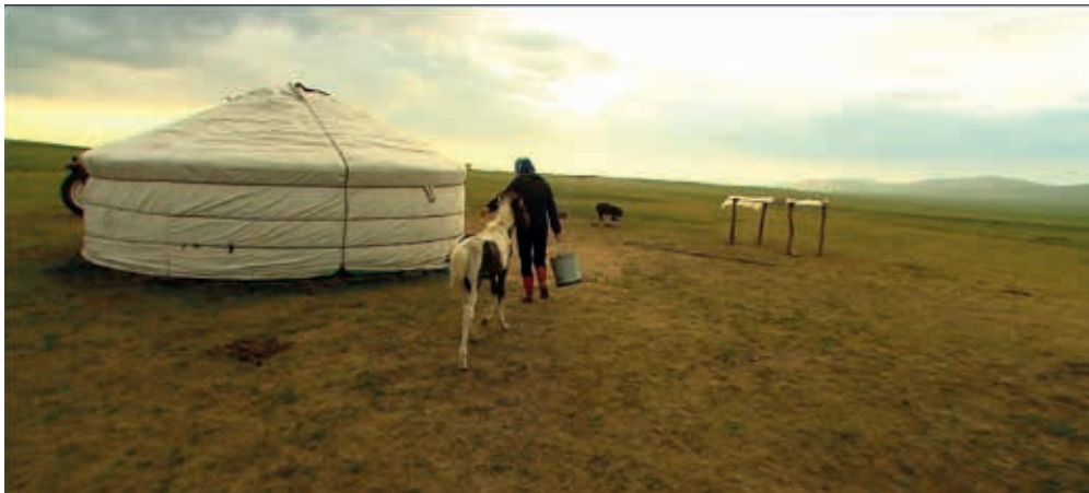
圖六 「認識亞洲」片段—居住文化。

傳播，或是為了適應當地的地理氣候，民衆的住所發展出各式各樣的風貌；例如，若將視線投向東南亞，在許多地方皆可見到稱為「高腳屋」的干欄式建築；人們用木材墊高樓板，