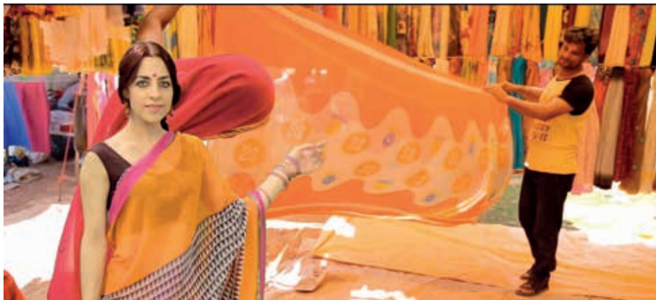
圖八 「印度文化圈」片段—印度服飾。

然而，值得特別注意的是，這些藝術品也在各個地區落地生根、開枝散葉，產生各異其趣的造型表現，使得亞洲藝術更見豐富，例如在白底畫上藍色圖案的青花瓷，於越南、韓國、日本等地都產生不小的迴響，發展出各具特色藍白輝映的青花瓷器(圖十一)，如此的審美品味更早已遠遠超過亞洲的疆域，傳遞到全世界。 綜合來說，藝術上的書法、繪畫、漆器、與瓷器，生活上的絲綢與茶文化，皆編織起華夏文化圈中的緊密網絡。