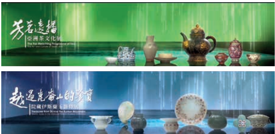
圖一 導覽廳外側的弧形牆上，以新穎的表現手法，投影陳列室中各項展覽的精彩選件。