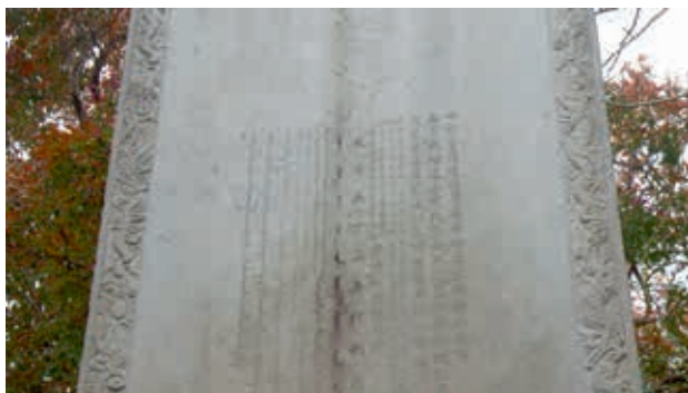
嘉義公園內福康安紀功碑（「奔流不息—嘉義發展史」影片截圖） 南院處提供