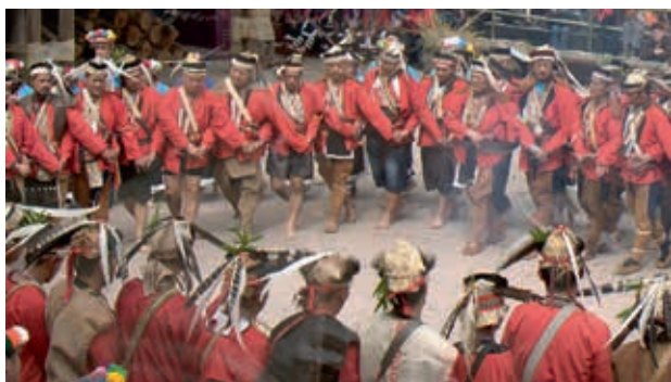
鄒族傳統Mayasvi祭典（「奔流不息—嘉義發展史」影片截圖） 南院處提供