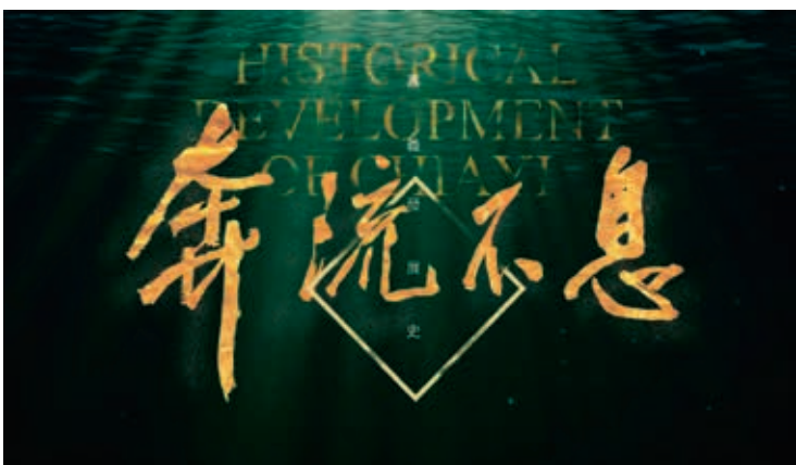
「奔流不息—嘉義發展史」影片片頭

配合嘉義地理空間的推展，發源中央山脈西側的北港溪、朴子溪、八掌溪提供豐沛水源，成為孕育嘉義文明、文化的生命之泉，另一方面河流的氾濫和改道，也讓嘉義的發展受到限制和挑戰。故宮南院基地和附近地表，受溪流沖刷、堆積作用，留存零星、細碎陶片遺物；阿里山山脈與平地交界處的觸口地層，則出土距今一百九十九萬年前到一萬年前海洋有脊椎動物、甲殼動物、棘皮動物、軟體動物化石，都反映嘉義地貌受河、海作用的發展特色。