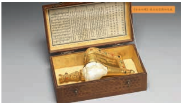
國立故宮博物院典藏〈右旋白螺〉（「奔流不息—嘉義發展史」影片截圖） 南院處提供