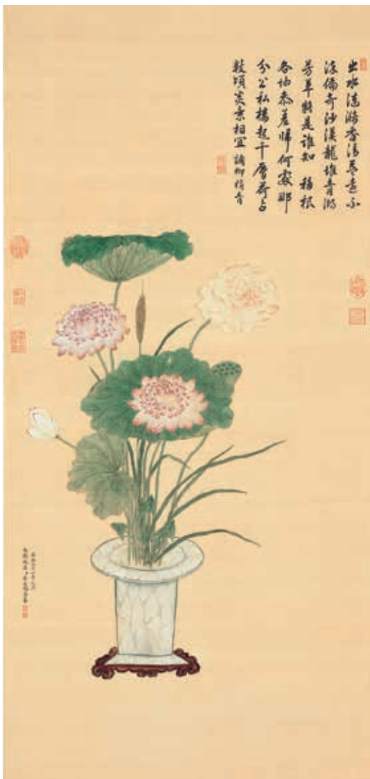
圖一 清 蔣廷錫 瓶蓮 國立故宮博物院藏

方鶩（一六二九—一六八二）、王士禎（一六三四—一七一—）等人，入值南書房；此後朱彝尊（一六二九—一七〇九）、徐乾學（一六三一—一六九四）、王鴻緒（一六四五—一七二三）、王原祁（一六四二—一七一五）等皆曾入值。這些詞臣們整理內府典籍，編纂《御製詩文集》，當中特具書畫才能者如高士奇善書，王原祁擅長山水畫。