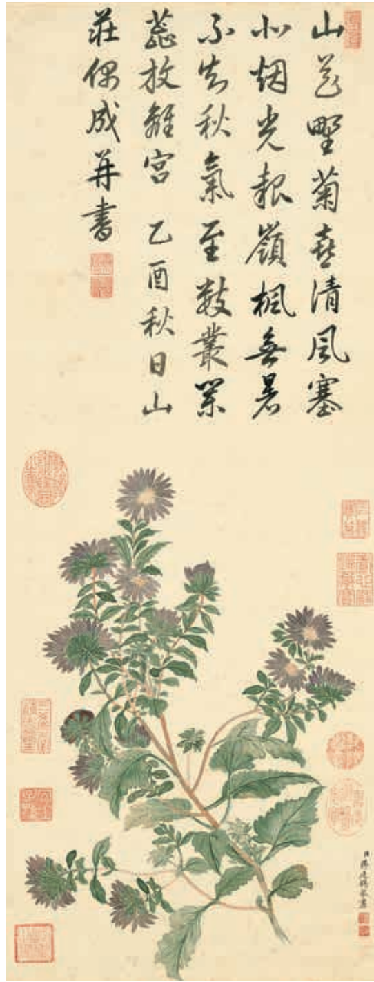
圖三 清 蔣廷錫 野菊 國立故宮博物院藏

而存留粉本。日後永理（一七五二）一八二三）在作品歸石渠貯藏時和詩：「內湖外湖波鱗鱗，教漢花葉留秋痕；當年供奉寫生處，芝逕雲堤多錦雲。一時侍從多題語，此日重歸石渠貯；更蒙酒輸出神工，祇覺餘篇皆刻楮。」（圖二-2）言明此畫為蔣廷錫供奉避暑山莊時的寫生作品。畫中花卉當為避暑山莊三十六景之一「香遠益清」中植於太液池之重臺、千葉名種。畫上張廷玉題詩：「太液池頭香遠亦清。冰銷留賞處，霞綺照窗明。」正為詠此。