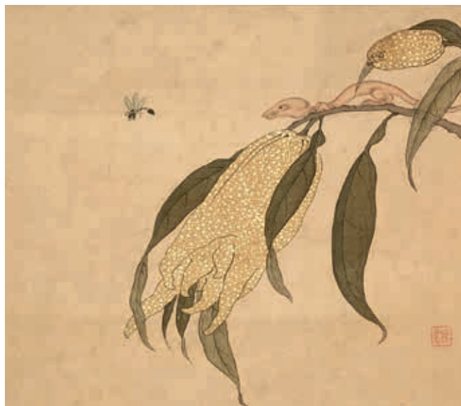
圖八 清 陳字 《文房集錦》冊 第十一開 佛手柑 國立故宮博物院藏