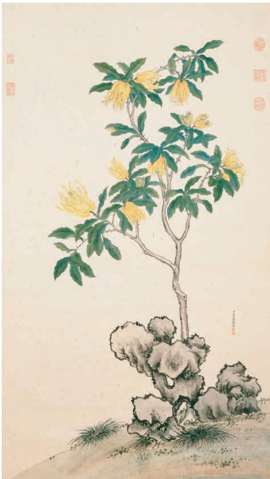
清 蔣廷錫 佛手寫生 局部 國立故宮博物院藏