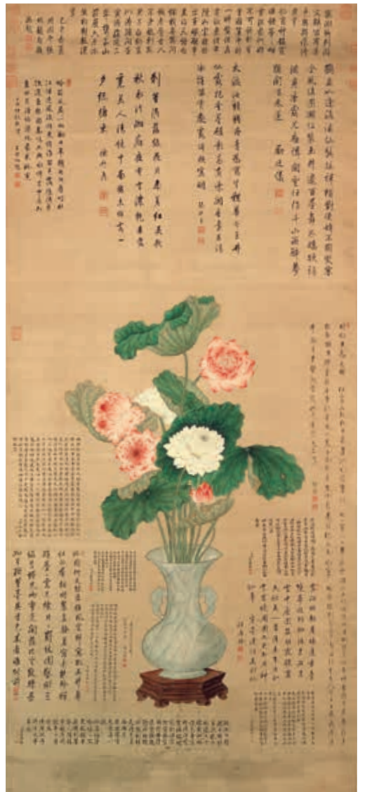
圖二-1 清 蔣廷錫 畫教漢千葉蓮 國立故宮博物院藏

蔣廷錫扈從北巡，可見於康熙四十四年（一七〇五）相關文獻。是年玄燁巡幸塞外，曾賜蔣廷錫馬、羊，《詞林典故》載： 上巡幸塞外，諭翰林張廷玉、勵廷儀、蔣廷錫、查慎行、錢名世等曰：「昔太宗皇帝謂此地宜立田牧，今果蕃息若此。因賜各官馬一匹、羊二頭。」 作為詞臣畫家，扈從北巡的蔣廷錫所繪花卉並不限於北京宮苑，塞外及離宮花卉亦是重要對象。〈野菊〉（圖三）作於是年秋天，款「臣蔣廷錫恭畫」，畫幅上半御題： 山花野菊喜清風，塞北煙光報嶺楓；無暑不知秋氣至，數叢蘭蕊放離宮。乙酉（一七〇五）秋日山莊偶成并書。 畫面以折枝構圖繪畫野菊，金