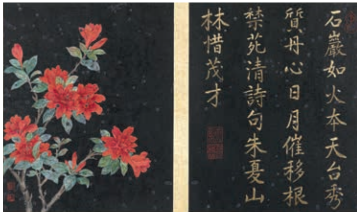
圖四-3 清 蔣廷錫 《畫群芳擷秀》冊 第十開 杜鵑 國立故宮博物院藏