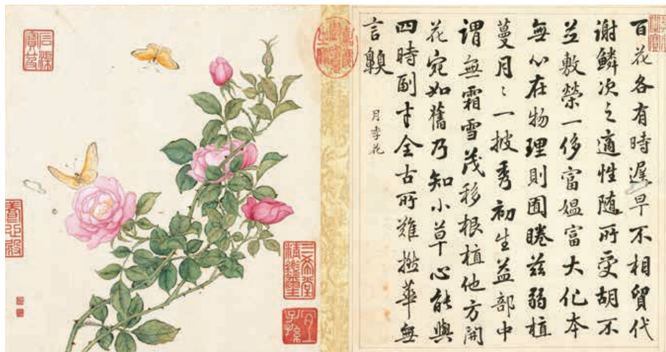
圖十一 清 蔣廷錫、張照 《書畫合璧》冊 第一開 月季披秀 國立故宮博物院藏