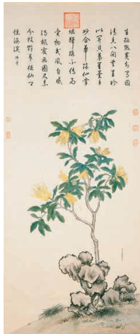
圖七 清 蔣廷錫 佛手寫生 國立故宮博物院藏

枸橼產閩廣間，木似朱欒而葉尖，長枝間有刺，植之近水乃生。其實狀如人手有指，俗呼為佛手柑。有長一尺四五寸者。皮如橙柚而厚皺，而光澤。其色如瓜，生綠熟黃。其核細，其味不甚佳，而清香襲人。南人雕鏤花鳥作蜜煎果食，置之几案，可供玩賞。若安芋片於蒂，而以濕紙圍護，經久不腐。或持蒜蘸其蒂上，則香更充溢。 可見佛手非以食味為重，而以香氣勝出，甚或作為玩賞之物。明代此種南方物產已深受北人重視。 蔣廷錫《佛手寫生》軸（圖七），繪坡石後佛手一株。《本草綱目》所述「長枝間有刺」、「皮如橙柚而厚皺，而光澤」等植物特徵，畫中清晰可見。黃色果實顯示畫中佛手已為熟果。先此佛手畫例實不多見，如明末清初陳字（一六三四？）《文房集錦冊》之《佛手柑》（圖八）帶有裝飾意趣，清初惲壽平《寫生》冊之《佛手朱橘》（圖九）富含暈染墨趣。相較之下，《佛手寫生》以立軸形式將全株入畫，忠實於植物