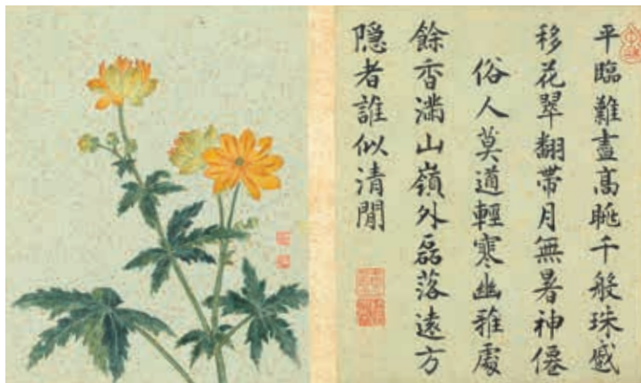
圖四-2 清 蔣廷錫 《畫群芳擷秀》冊 第七開 金蓮 國立故宮博物院藏