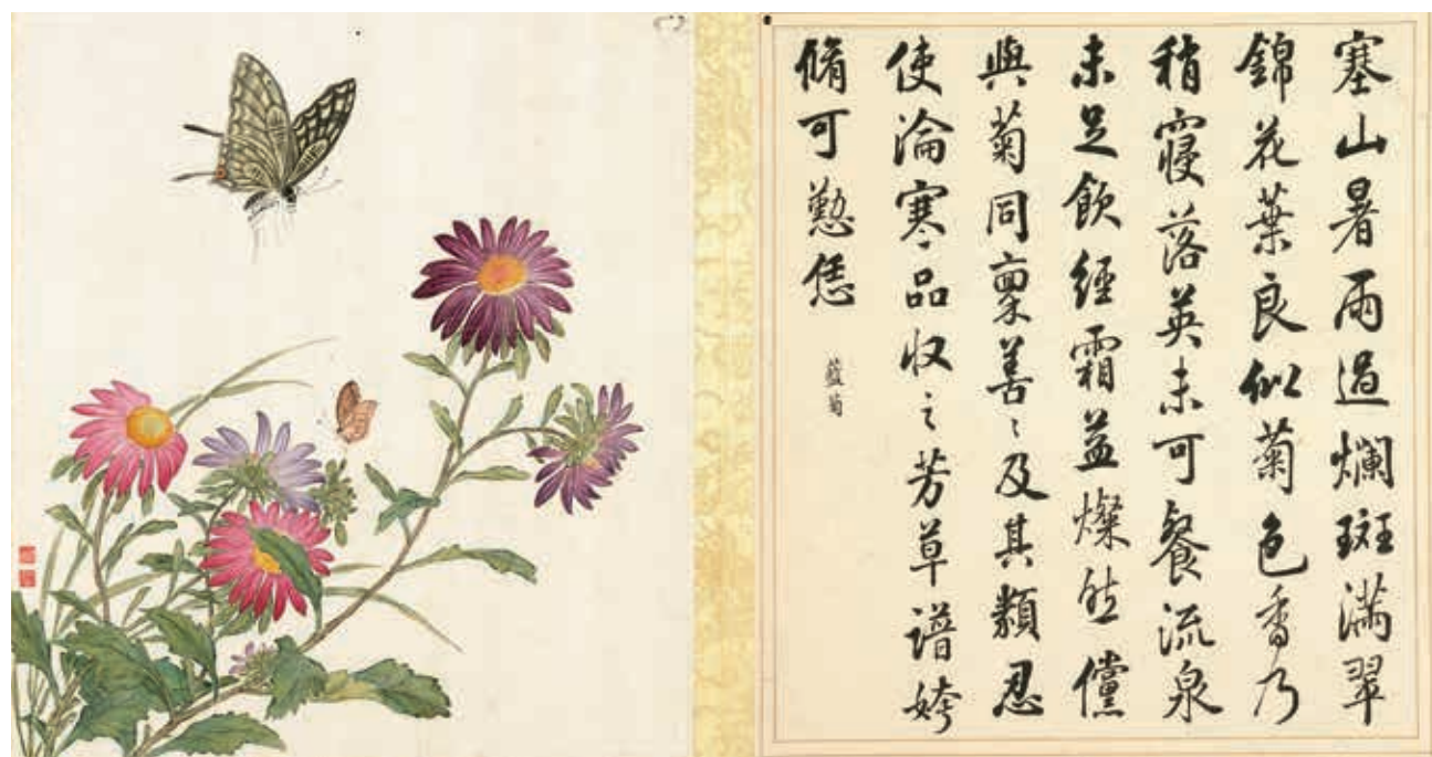
圖十二 清 蔣廷錫、張照 《書畫合璧》冊 第十一開 藍菊斑斕 國立故宮博物院藏