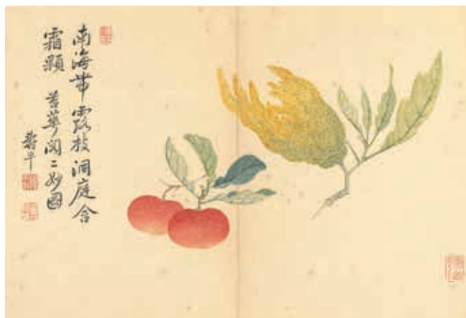
圖九 清 惲壽平 《寫生》冊 第五開 佛手朱橘 國立故宮博物院藏