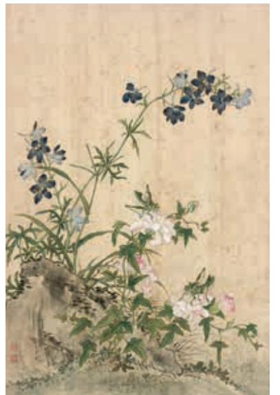
圖五-1 清 蔣廷錫〈寫生〉冊 藍雀花 國立故宮博物院藏