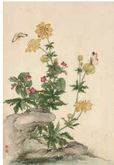
圖五-3 清 蔣廷錫〈寫生〉冊 金蓮 國立故宮博物院藏

此種花卉在《欽定熱河志》稱之為「翠雀花」，在中國主要生長於河北、山西以北地區。畫中以深藍、紫藍顏色暈染花瓣，花瓣如雀鳥開展雙翅身形，以黃色繪花心，描繪詳實並