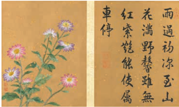
圖四-1 清 蔣廷錫 《畫群芳擷秀》冊 第四開 野菊 國立故宮博物院藏