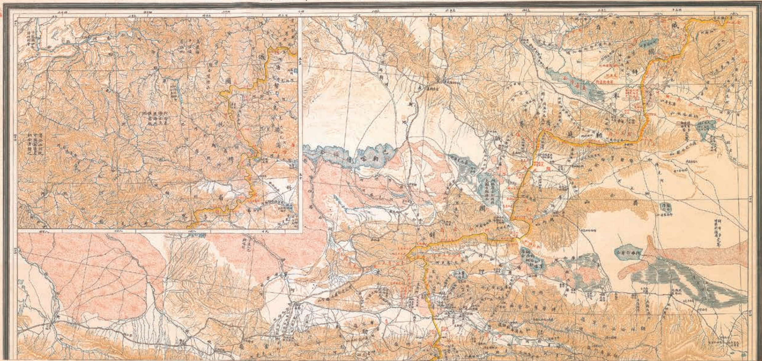
〈光緒勘定西北邊界俄文譯漢圖〉上幅 局部 國立故宮博物院藏

對於俄國派兵進入帕米爾並要求劃界一事，讓清廷頓時慌亂失措，因清廷對該地區不甚熟悉，亦找不到對帕米爾地區有詳細記載的地圖，能作為劃界的參考依據。