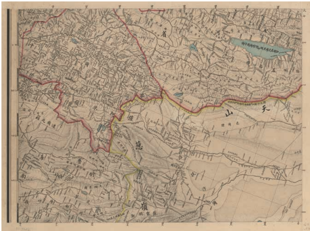
〈中俄交界全圖〉之分圖〈帕米爾地圖〉 原圖藏於美國國會圖書館

5. 阿爾(利)楚爾帕米爾 (Alichur Pamir)，位於大帕米爾北邊，薩雷茲帕米爾南邊，西至噴赤河。境內有阿爾楚爾河、伊西洱湖 (Yushil Kul)，此湖之水溢出西流入棍特河，在伊西洱湖北邊有蘇滿塔什，清廷在此設有卡倫。 6. 薩雷茲帕米爾 (Sarze Pamir)，位於和什庫珠克帕米爾(北邊)及阿爾楚爾帕米爾(南邊)之間，西界為噴赤河，東北邊為郎庫里帕米爾。境內有穆爾格阿甫河 (Murgab R.)，以及薩雷茲湖 (Sarze Kul)，在許景澄的圖裡此湖並未繪出，依據《新疆中俄國界研究》書內記載斯坦因 (Marc Aurel Stein) 的說法，此湖是在西元一九一二年當地發生大地震後形成的湖泊。 7. 和什庫珠克帕米爾 (Hashikuchuk Pamir)，位於阿賴嶺南邊，薩雷茲帕米爾北邊，境內有喀喇湖(即喀喇庫里湖 Khara Kul)，在此區域東側有條邊界線，此邊界線上有清廷與俄國在光緒十年劃定邊界所設