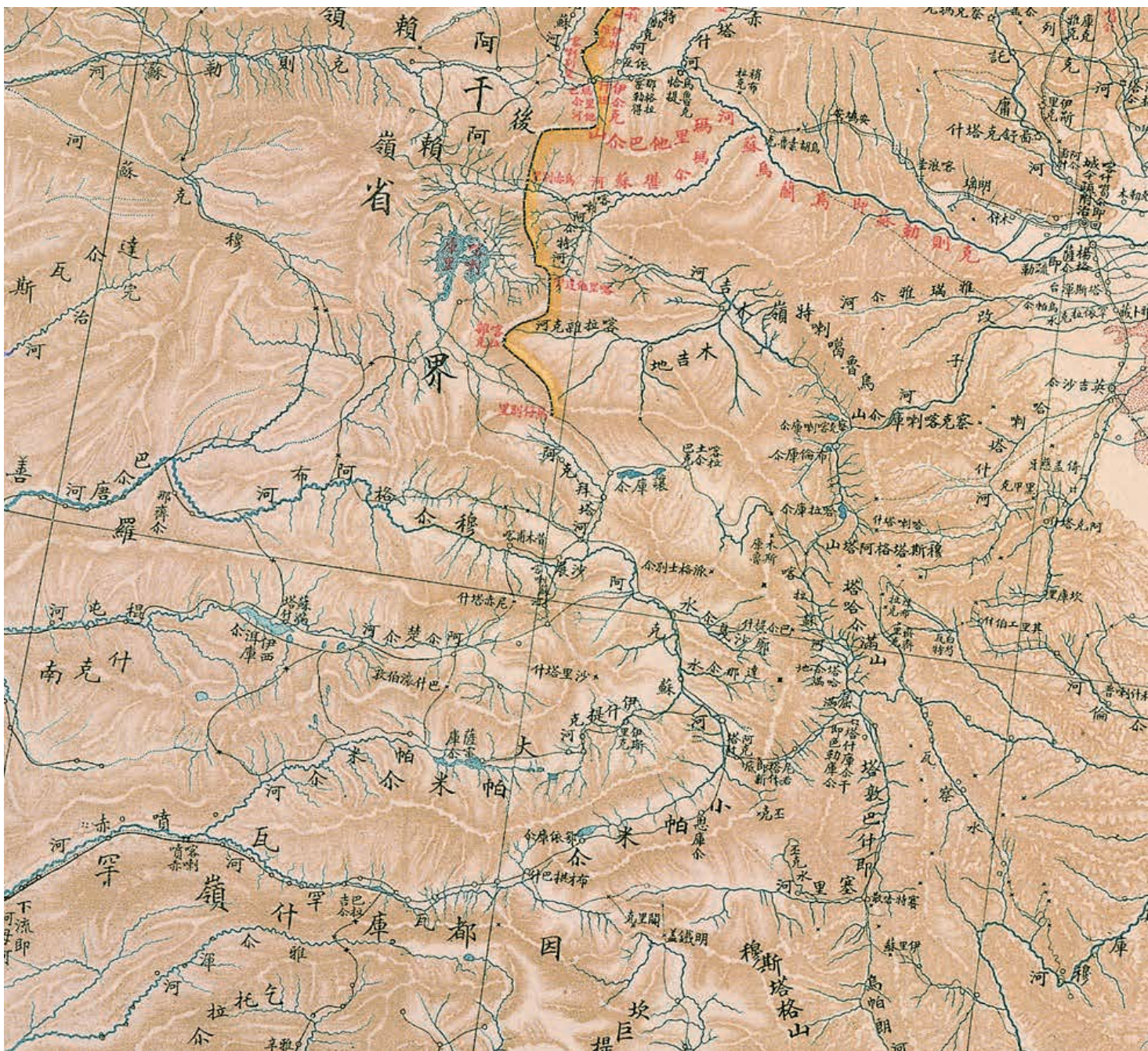
〈光緒勘定西北邊界俄文譯漢圖〉下幅 局部 國立故宮博物院藏

與清廷先後簽訂喀什噶爾東北及西北段界約後，清廷喪失天山南路部分土地，但由於當時邊界劃定未將帕米爾地區納入，讓俄國有可乘之機，意圖再染指帕米爾大片土地，並派兵佔領該地區，要求與清廷商議帕米爾劃界。