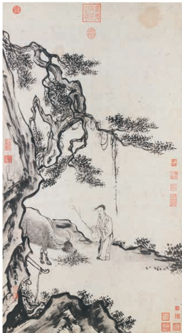
圖十四 明 周臣 甯戚飯牛圖 國立故宮博物院藏

此圈圍出林間空地，清幽小景中的二位主角，好似位於畫卷舞台中央。而唐寅正德己巳初夏（一五〇九）所繪〈竹籬圖〉（美國芝加哥藝術館藏），即是這種表現方式的創始。該圖卷首為僮僕汲水溪旁，隨手卷開展接續一林間空地，文士與僧人於梧桐樹叢下對坐品茗，另一僮僕對著竹籬煨火備茶。人物皆以細勁線條繪出五官、衣著、姿態，施以淡彩。展品院藏傳仇英〈換茶圖文徵明書心經合璧〉