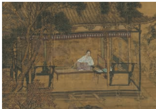
圖八 宋 趙伯驥 風櫺展卷 局部 國立故宮博物院藏