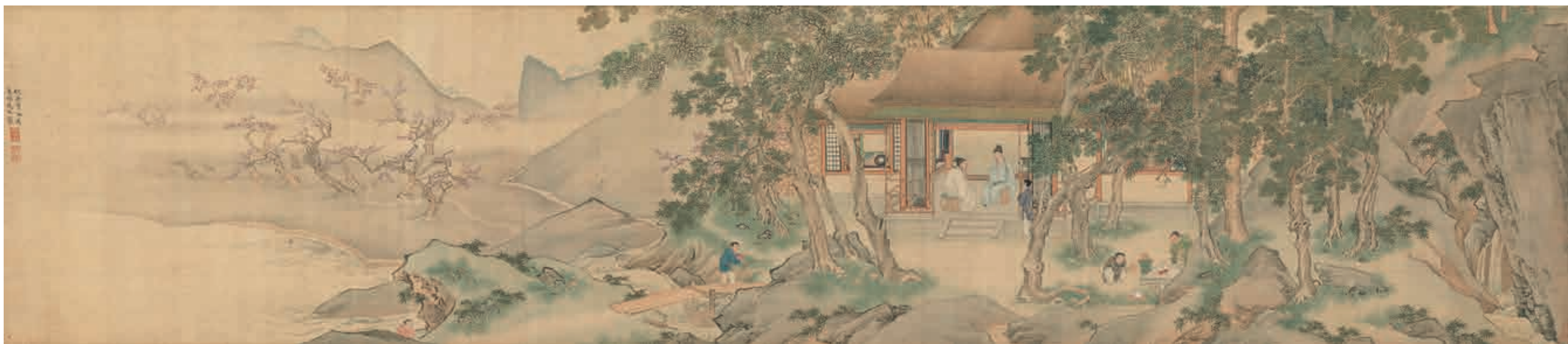
圖九 明 仇英 東林圖 國立故宮博物院藏