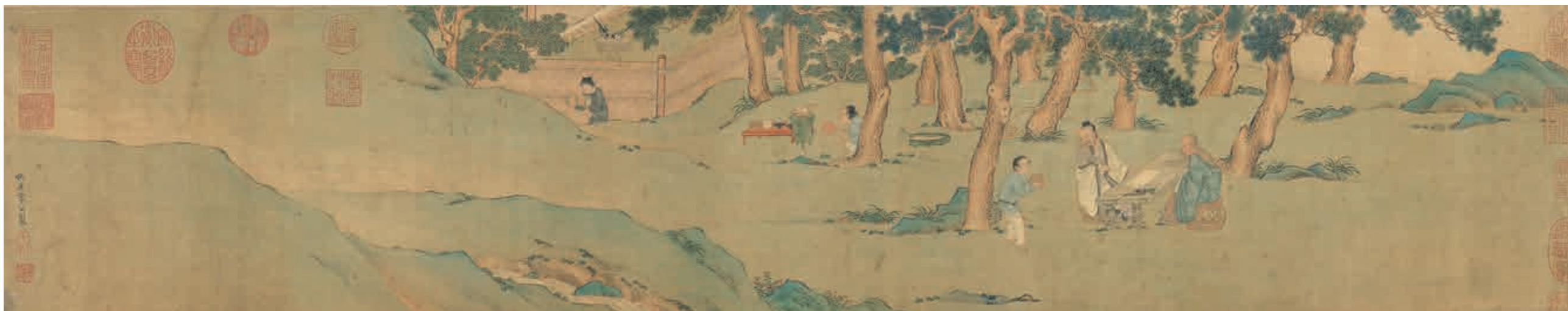
圖十 (傳) 明 仇英 換茶圖文徵明書心經合璧 國立故宮博物院藏

師法周臣近學唐寅 影響仇英繪事深遠第一人為周臣(約一四五〇~一五三五)。彭年說仇英「少師東邨周君臣，盡得其法」，王世貞(一五二六~一五九〇)《藝苑卮言》記載仇英「其所出微，常執事丹青，周臣異而教之。」都說明仇英深得周臣繪畫精要。 仇英《月下吹笛》(圖三)為扇面，畫中江面遼闊，波光粼粼，一漁人袒胸露背坐於舟上吹笛。漁父造型和開臉方式、方折的衣紋畫法，都與周臣《水亭清興》亭中人物(圖四)相近；扇面近緣處叢葉的點葉手法，也似周臣《水亭清興》及《畫間看兒童捉柳花句意》柳樹葉片(圖五)點葉方式。《月下吹笛》中主角—濯足橫笛的漁父不僅見於《水亭清興》(圖六)，唐寅《溪山漁隱》卷亦以這類形象作為畫面重點，足見仇英人物畫對周臣、唐寅畫風的延續。《松亭試泉》(圖二)以僮僕試泉，突顯文人講究茶事，周臣《煮茶圖》(美國密西根美術館藏)亦見類似手法。前景松石坡岸，藉石橋斜向延伸連結亭臺人