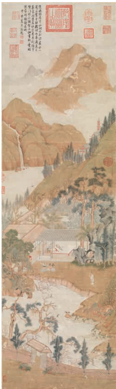
圖十五 明 仇英 林亭佳趣 國立故宮博物院藏