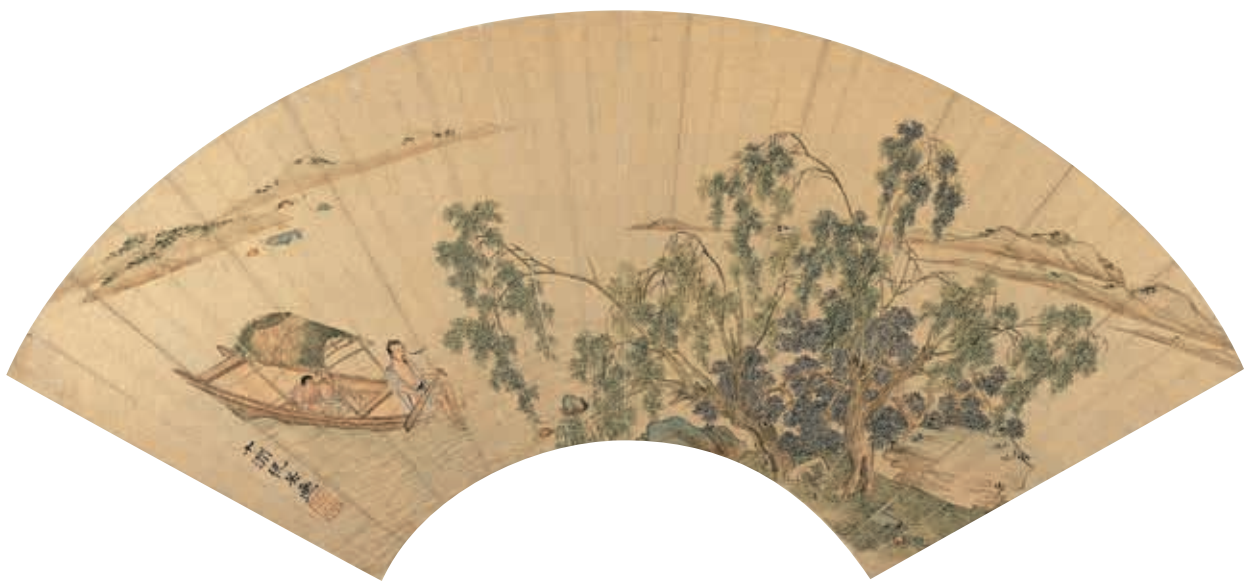
圖二十 明 仇英 柳溪泛舟 國立故宮博物院藏