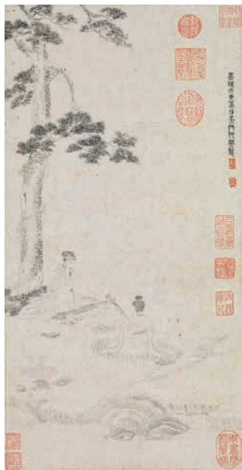
圖二十一 明 仇英 松陰琴阮 國立故宮博物院藏