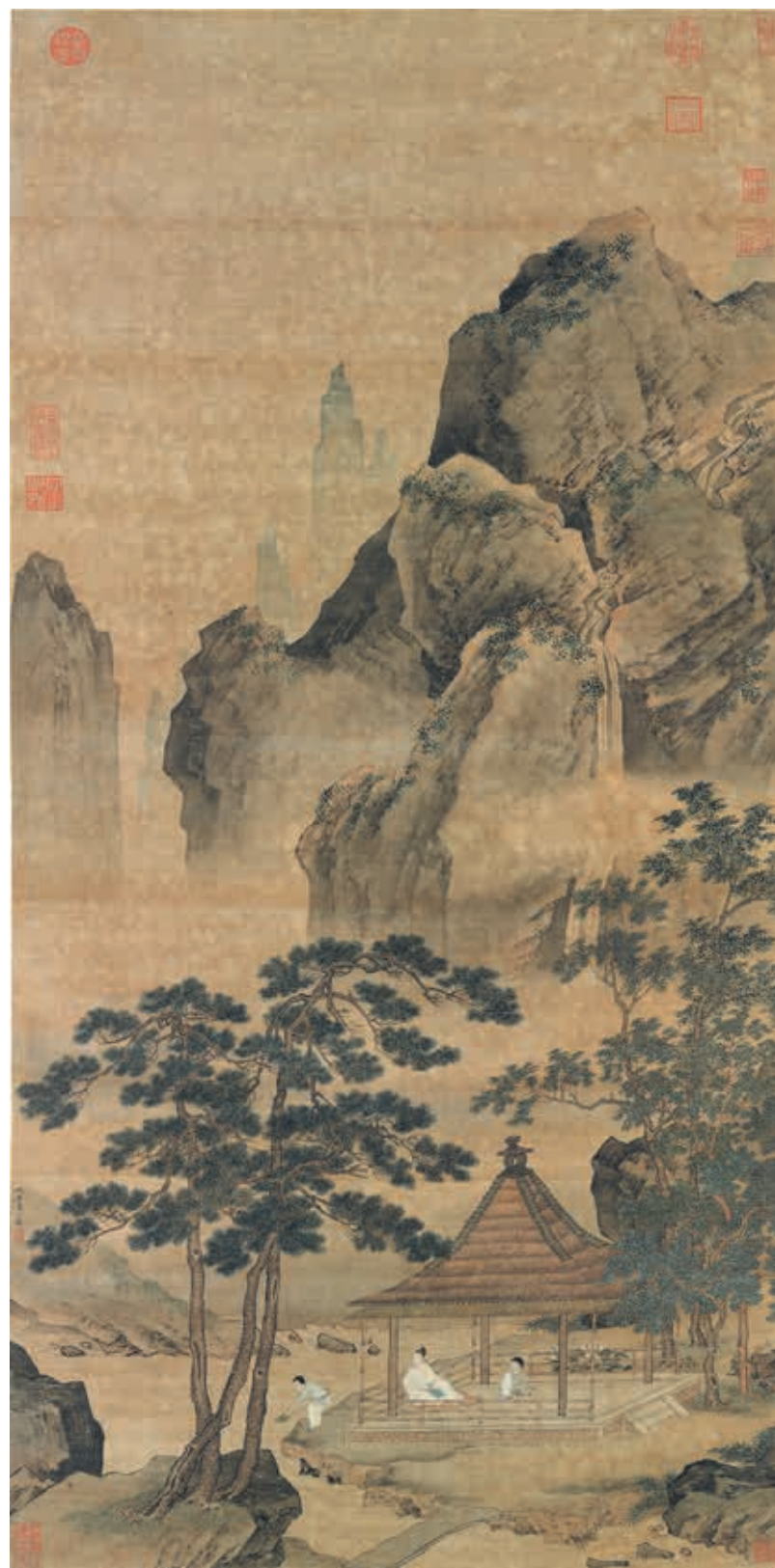
圖二 明 仇英 松亭試泉 國立故宮博物院藏

史文獻對其生卒年及生平亦無詳述。現代學者依據作品題識、著錄文獻等，勾勒仇英生平大要，並推測生卒年。卒年依據北京故宮博物院藏〈職貢圖〉卷後彭年（一五〇五—一五六六）嘉靖壬子（一五五二）臘月題跋「而今不可復得矣」，推測