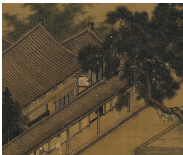
圖十七 宋人 松陰庭院 局部 國立故宮博物院藏

畫藝之文人氣息 清吳升《大觀錄》記載仇英：「初學畫，即見器於文太史，父子為之延譽。」早年「見器於文太史」事例可由文徵明正德十二年（一五一七）〈湘君湘夫人〉為證。畫幅王穉登題語：「少嘗侍文太史，談及此圖，云使仇實父設色。兩易鉅皆不滿意，乃自設之以贈王履吉先生。」〈湘君湘夫人〉畫贈王寵（一四九四—一五三三），原請仇英設色，文徵明不滿意乃自設之。文徵明對仇英畫風的影響，則可見於〈林亭佳趣〉。