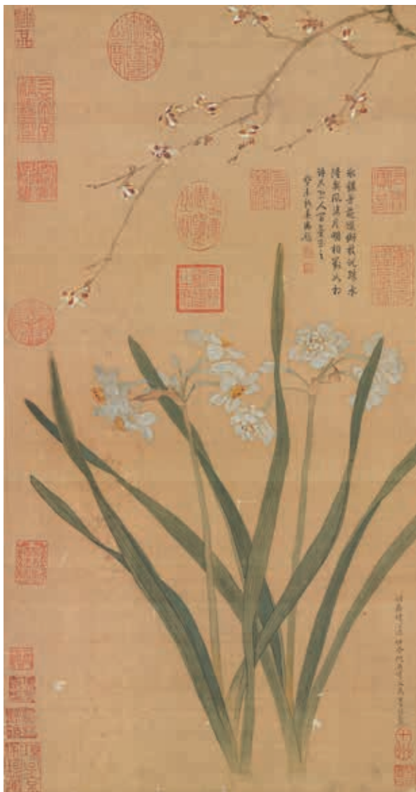
圖二七 明 仇英 水仙蠟梅 國立故宮博物院藏

仇英園林畫常見描繪細緻點景至於院藏〈漢宮春曉〉(故畫〇〇一〇三八)以苑囿構景，將傳世唐宋仕女畫豐富形象，集結於長度超過五百公分手卷，並融入明代人物畫常見琴棋書畫活動，可說是仇英奠基古畫創作佳例。《無聲詩史》評論仇英：「尤工士女，神采生動，雖周昉復起，未能過也。」《明畫錄》記仇英：「髮翠豪金，絲丹縷素，精麗豔逸，無慚古