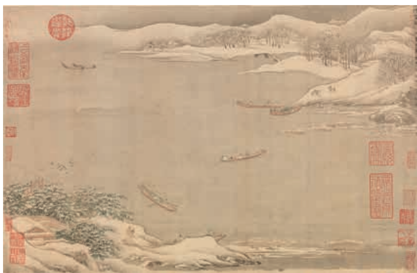
圖二五 明 仇英 臨宋元六景 第一、三、六開 國立故宮博物院藏