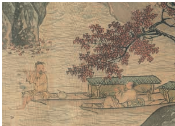
圖七 明 唐寅 溪山漁隱 局部 國立故宮博物院藏