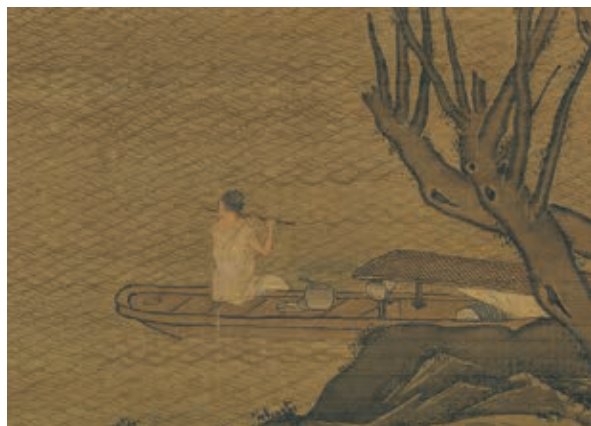
圖六 明 周臣 水亭清興 局部 國立故宮博物院藏