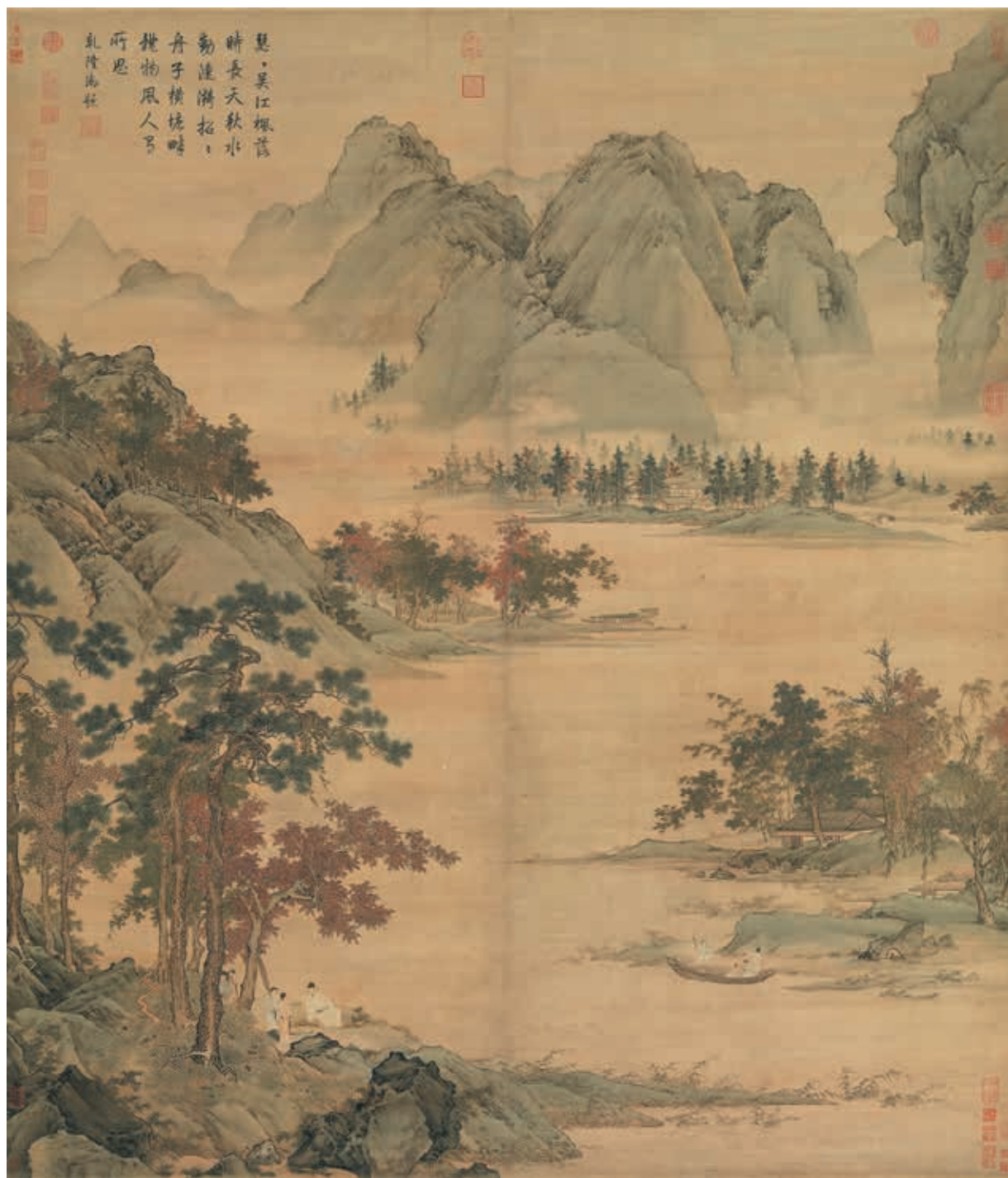
圖二四 明 仇英 秋江待渡 國立故宮博物院藏

布置設色，深淺得宜。冊頁手卷，愈小愈佳。」院藏〈臨宋元六景〉（圖二五）為現存佳例。後副葉項元汴題：「宋元六景，仇英十洲臨古名筆，墨林項元汴清玩。嘉靖二十六年（一五四七）春，摹於博雅堂。」