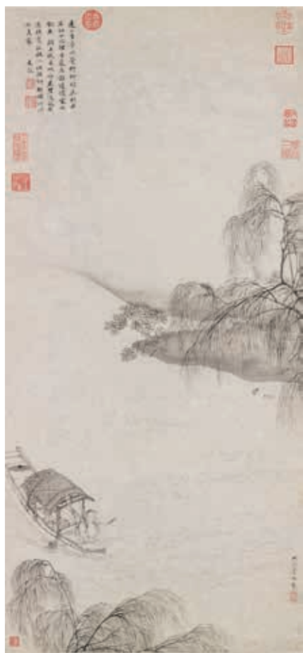
圖十九 明 仇英 柳塘漁艇 國立故宮博物院藏

與〈梧竹書堂圖〉雷同，畫工雖細，筆墨設色未若〈梧竹書堂圖〉具有雅趣，推測為摹本。