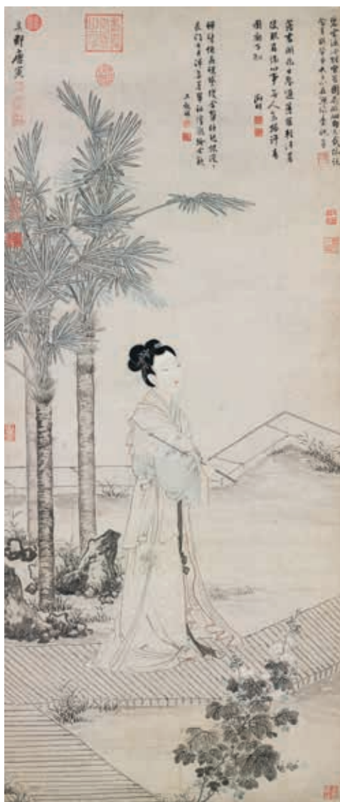
圖十三 明 唐寅 班姬團扇 國立故宮博物院藏

物，中景虛空霧氣，遠景則矗立巨岩飛瀑的三段式構圖，承襲周臣山水畫常見佈局。巨幅山水加上斧劈皴法，源流可上溯宋代李唐（約一〇七〇）一一五〇）風格。仇英坡石處理用筆輕快，再施加苔點，亦與周臣〈閒看兒童捉柳花句意〉相近。然整體而言，〈松亭試泉〉相當精工細緻，更具宋代院畫韻致。畫中文士手持藍色羽扇坐於獸皮墊上，姿態甚為閒適優雅，面部敷染細膩，衣紋線條轉折勁利，描繪方式更近南宋冊頁如趙伯驩〈風檐展卷〉（圖八）人物。畫中物