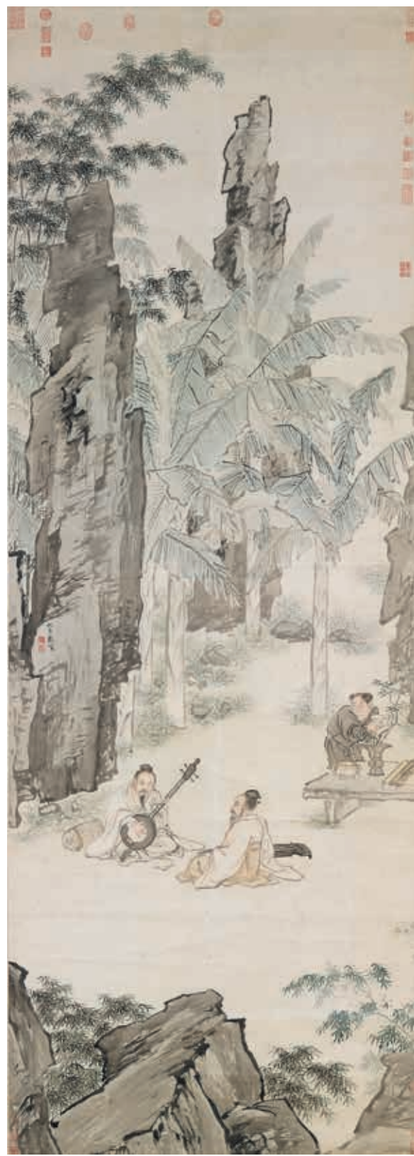
圖十一 明 仇英 蕉陰結夏 國立故宮博物院藏