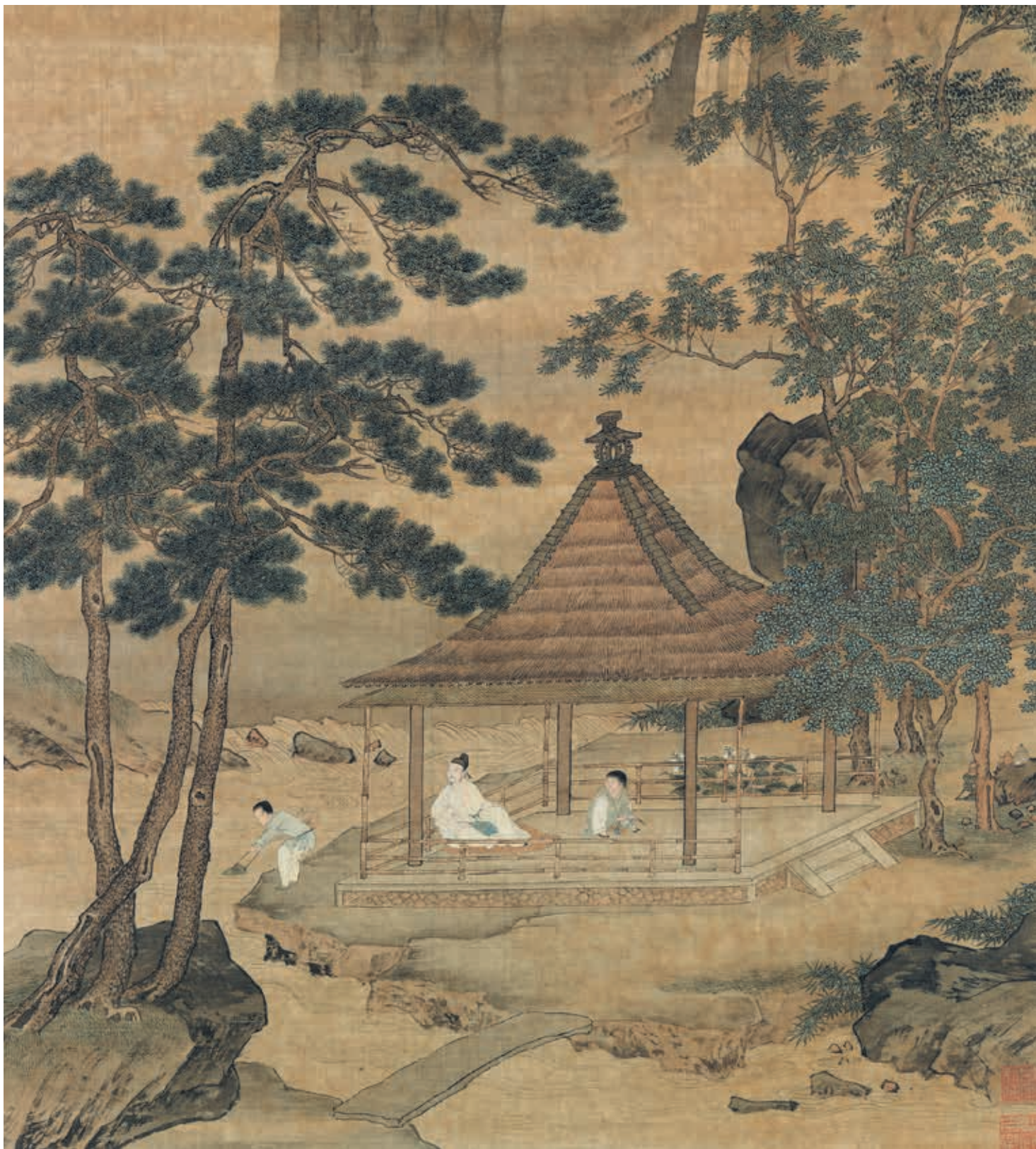
圖一 明 仇英 松亭試泉 局部 國立故宮博物院藏