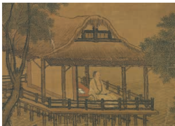
圖四 明 周臣 水亭清興 局部 國立故宮博物院藏