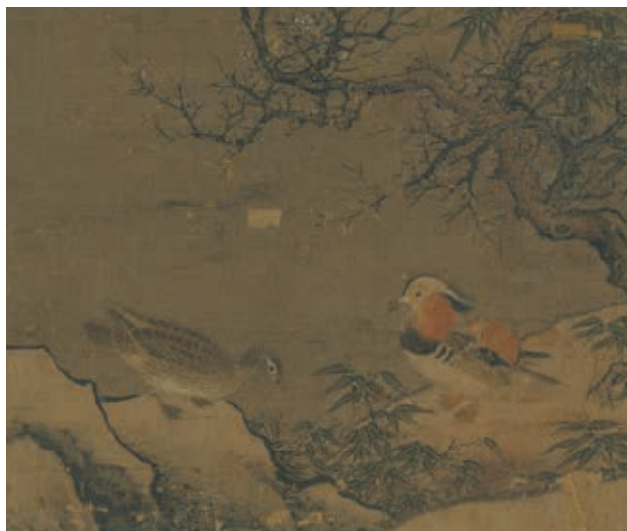
圖十六 宋 惠崇 寒林鷺鳥 局部 國立故宮博物院藏