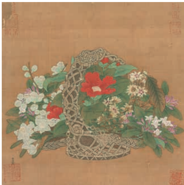
圖二八 宋 李嵩 花籃 國立故宮博物院藏