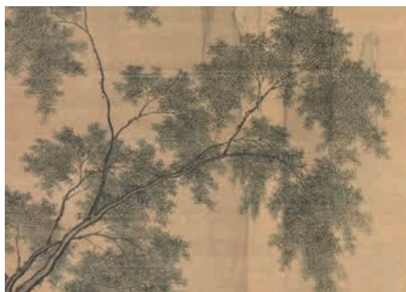
圖五 明 周臣 畫間看兒童捉柳花句意 國立故宮博物院藏