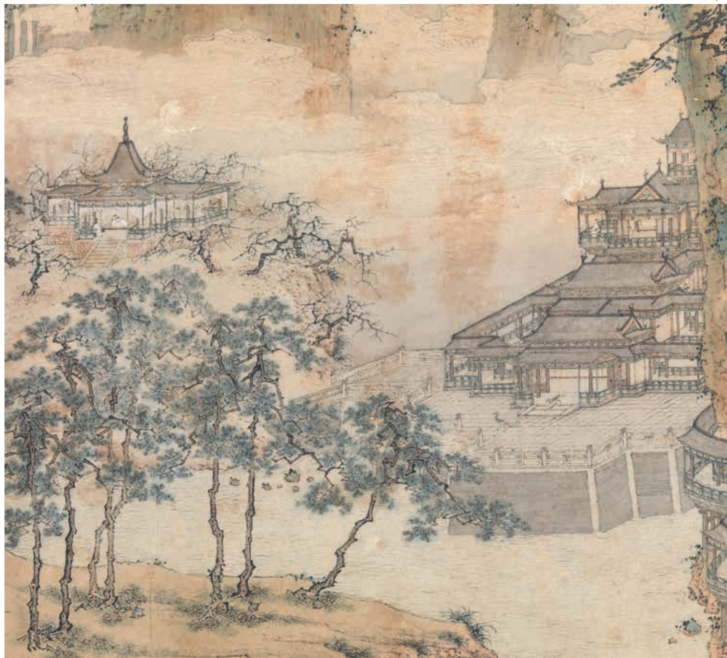
圖二三 明 仇英 仙山樓閣 局部 國立故宮博物院藏

仇英製」，為仇英晚年作品。畫中一人撥阮，一人停琴聆聽，除前景之坡岸松石外，背景空白，構景清曠簡賅。對坐二人坐於獸皮墊上，身形修長。停琴聆聽者背對觀者，姿態特殊，穿著古雅，長衣大袖，宛如由東晉顧愷之（約三四四～四〇五）《女史箴圖》（大英博物館藏）「人咸知脩其容，莫知飾其性」段落之對鏡仕女姿勢轉化而來。全幅特意營造高雅古典氣氛，可視為對顧愷之線描的重新詮釋。