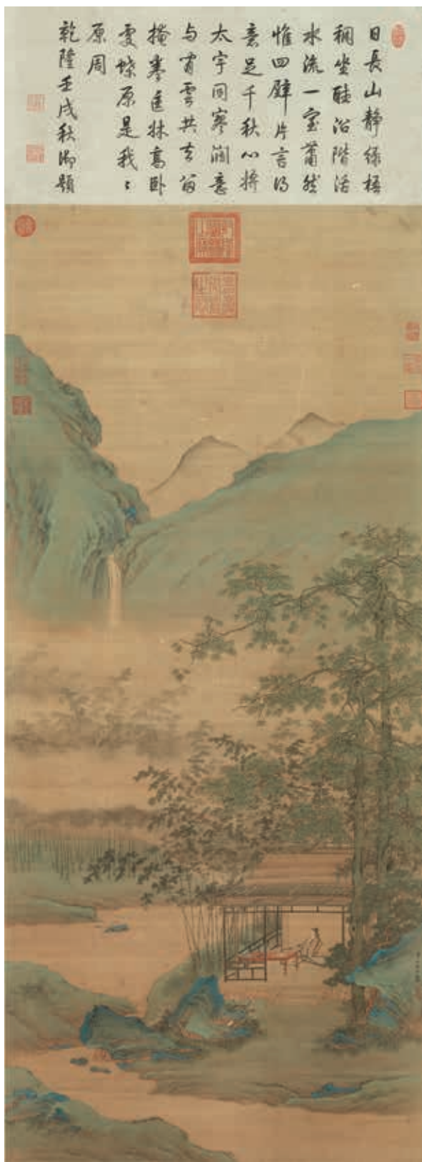
圖十八 (傳)明 仇英 桐陰畫靜圖 國立故宮博物院藏

近文徵明〈雨餘春樹〉清雅畫風。畫幅文徵明、王寵、彭年題詩，其中王寵「常侍風流鄴下遺，英英文采曜長離」及文徵明「年來無夢入京華，才盡文通敢漫誇」詩句，顯示畫中主角應為文徵明。由於文徵明於嘉靖五年（一五二六）十月致仕，次年春天回到家鄉，因此成畫年代可訂為一五二七年至王寵卒年一五三三年之間。（註五）此次展出院藏〈桐陰畫靜圖〉（圖十八）為絹本設色，構圖