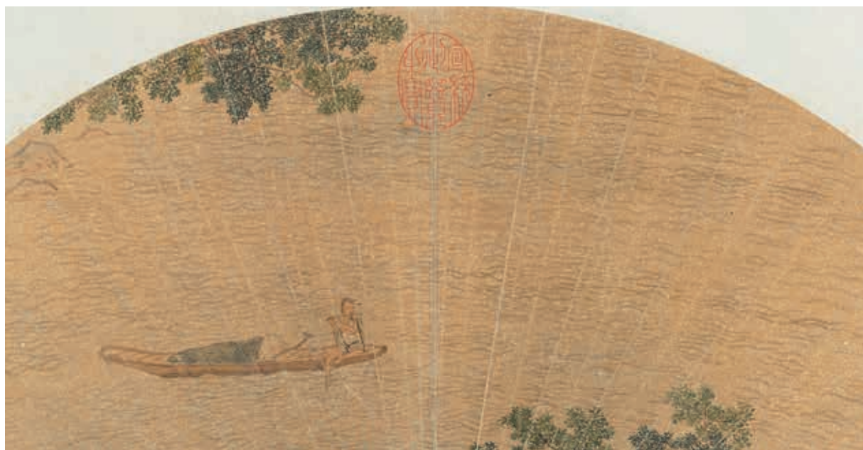
圖三 明 仇英 月下吹笛 局部 國立故宮博物院藏