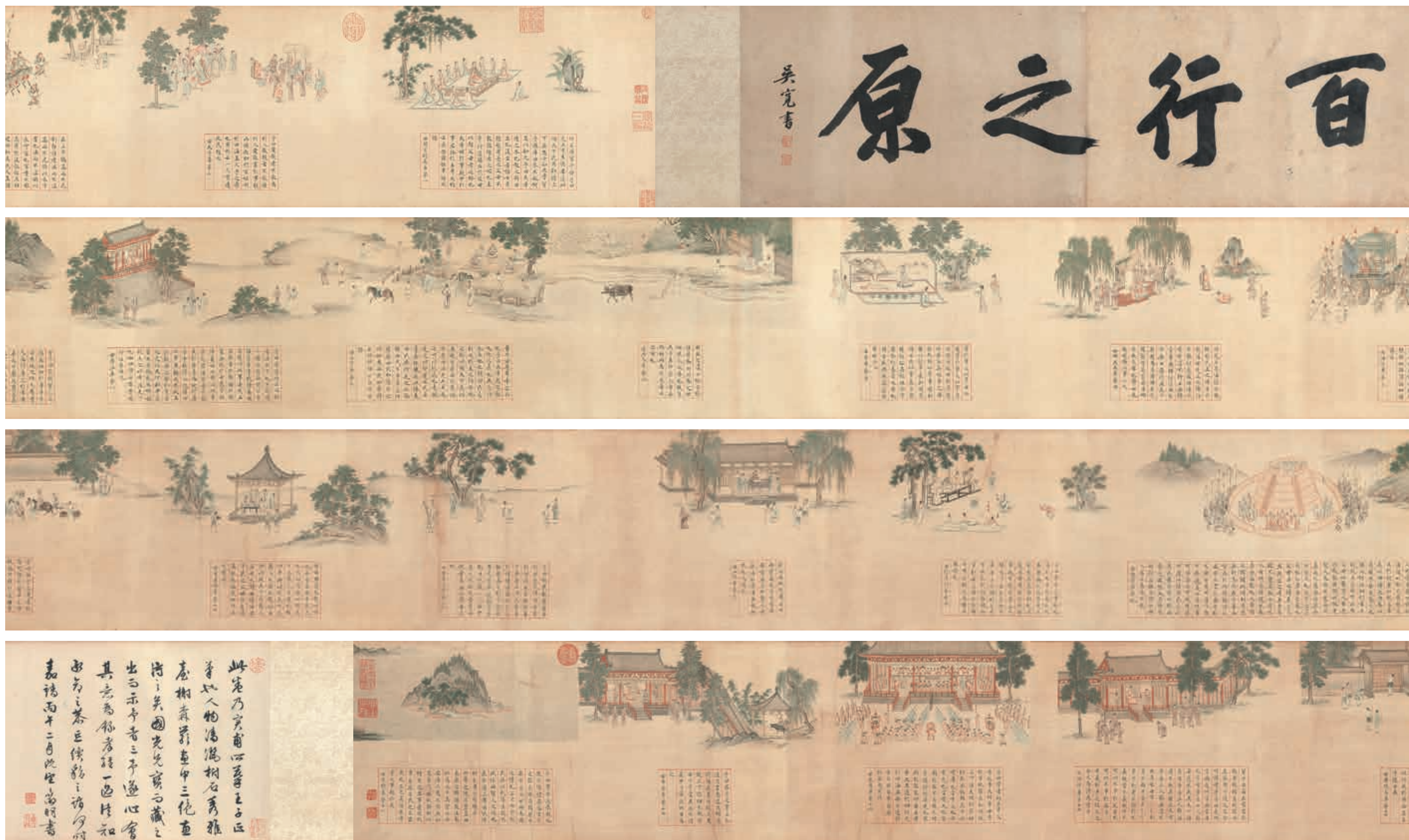
圖二二 明 文徵明 楷書孝經仇英畫 國立故宮博物院藏