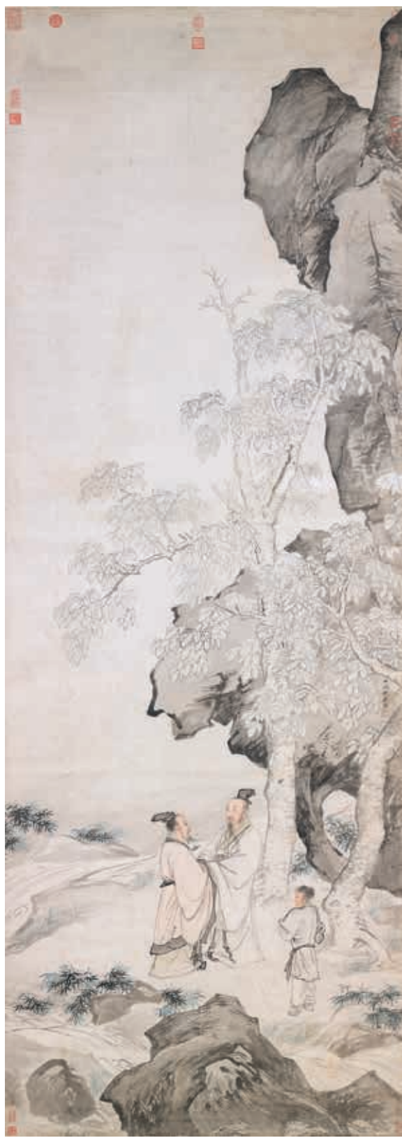
圖十二 明 仇英 桐陰清話 國立故宮博物院藏

現園林的隱蔽性，襯托主人翁寄情山林的隱逸心境，在院藏唐寅〈山水〉（故畫〇〇二五八四）已見。此畫卷首以陡壁水澗起始，接續高樹隱蔽下端坐屋舍中的文士，屋前巨岩高樹及遼闊水域隨手卷開展，遠處群山峰翠，江帆點點。〈東林圖〉延續這種模式，並融入仇英個人巧思，卷末以南宋冊頁常見邊角構圖，安排桃樹疏枝與煙嵐掩映，山水空間由實轉虛，近於馬麟（約一一八〇—一二五六後）的詩畫意境，藉桃源別境比喻園居之樂。 除了文人草堂圖的構圖模式取法唐寅外，仇英還有作品將人物如肖像畫般地描繪融入文人清雅小景，亦近學唐寅。具體畫例為美國克利夫蘭美術館藏仇英〈趙孟頫寫經換茶圖〉。此件作品創作緣由為崑山收藏家周鳳來（一一五二—一一五五）感於趙孟頫（一二五四—一三三二）為恭上人書寫心經換茶的藝林佳話，雖得到名公歌詠流傳，但趙孟頫心經原作已佚，於是請文徵明書寫〈摩訶般若波羅蜜多心經〉，其後並由仇英補圖，而成書畫合璧作品。文徵明〈心經〉