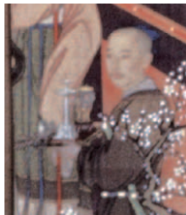
《歲朝行樂圖》畫中《金甌》、《玉燭》

園，其中銅鑲金一件（圖八），另一件黃金材質的《金甌》（圖九），做工與本院所藏相近，推測與院藏相同皆為乾隆五年所製，至於銅鑲金這件，研究指出，其外觀較為簡略樸拙，其中夔龍頂上未有嵌珠，與乾隆四年檔案記載相同，故製作年代可能最早，然而在材質及鑲嵌種類、數量