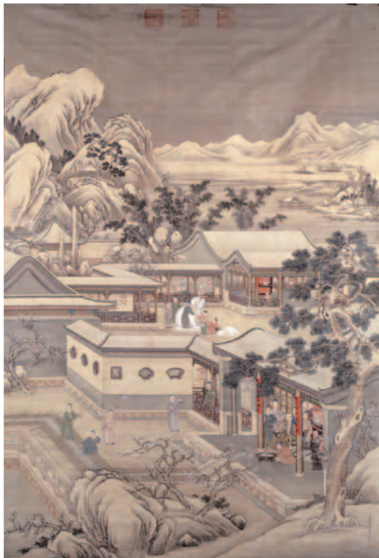
圖六 清 乾隆 歲朝行樂圖 北京故宮博物院藏