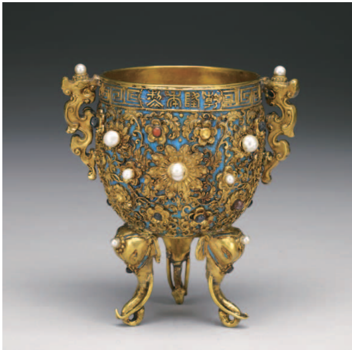
圖二 清 乾隆 金甌永固杯 國立故宮博物院藏

徵，應為乾隆五年所製；至於〈玉燭長調〉（圖三），高三〇·六公分，寬九·五公分，除了雕成花瓣形狀的大小承盤，大承盤的盤心刻有「乾隆年製、玉燭長調」（圖四），玉挺分成上下兩部分，上段刻弦紋，下段以淺浮雕連枝花葉紋（圖五），下方玉穩瓶固定於紫檀座，並有三個鏤刻花草玉插角做裝飾，外觀與上引乾隆四年檔案記載首次製作的〈玉燭〉不同，但對照乾隆早期的宮廷繪畫，如〈歲朝行樂圖〉（圖六）與〈弘曆古裝除夕行樂圖〉（圖七）圖中所出現的〈金甌〉與〈玉燭〉，皆與本院所藏極為相似，可見在乾隆五年下令將〈金甌〉、〈玉燭〉「另行往細緻裡收拾」，應是重製而非修改，〈金甌〉正是如此，而〈玉燭〉的重新定稿與製作也約當此時，故現存之〈玉燭〉與初次製作在外觀上有明顯出入。