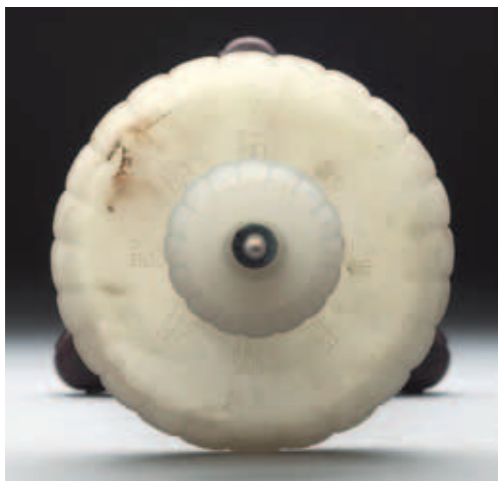
圖四 燭臺承盤「玉燭長調乾隆年製」刻款