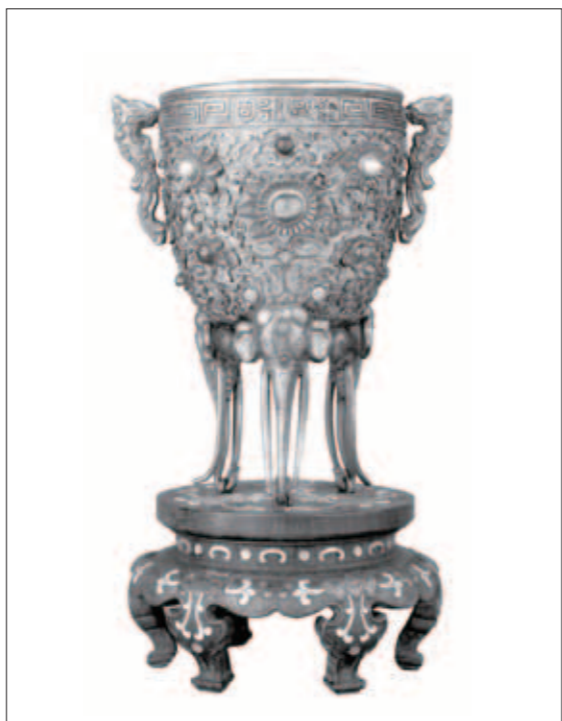
圖八 清 乾隆 銅鑲金甌永固 英國倫敦華萊士博物館 (Wallace Collection) 藏