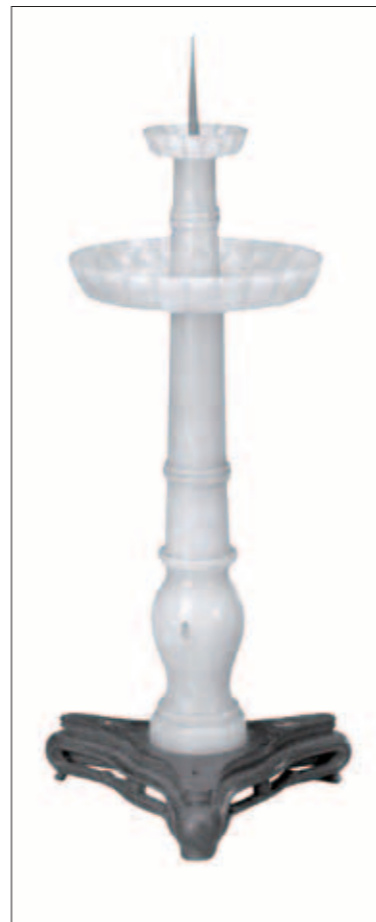
圖十一 清 乾隆 玉燭長調燭臺 北京故宮博物院藏

【お問い合わせ】090-3542-6900 (ホームページ) 午前9時～午後10時 【ホームページ】http://www.taipei2014.jp/ 【開館時間】午前9時30分～午後5時 ※入館は午後4時30分前まで 【休館日】10月27日(月)、11月4日(火)、11月10日(月)、11月17日(日) 【特別後援】日華議員懇談会 【主催】九州国立博物館・福岡県・東京国立博物館・國立故宮博物院・西日本新聞社・NHK福岡放送局・NHKプラネット九州・読売新聞社・東洋新聞社・朝日新聞社・毎日新聞社・RKB毎日放送・TVQ九州放送 【特別協力】九州朝日放送・PBS福岡放送・テレビ西日本 太宰府天満宮 【協力】チャイナエアライン 国旅(志まから) 雲石紅燈 朝野本荘 京都錦屋/京都錦屋粉引製菓文房製菓 京都錦屋/製菓別荘 京都錦屋/吉原福花園 京都/入土橋/京都米子/数式堂/肉形石/「書藝」美術写真展(部分) 他 他 他 ※すべては本館・國立故宮博物院謹