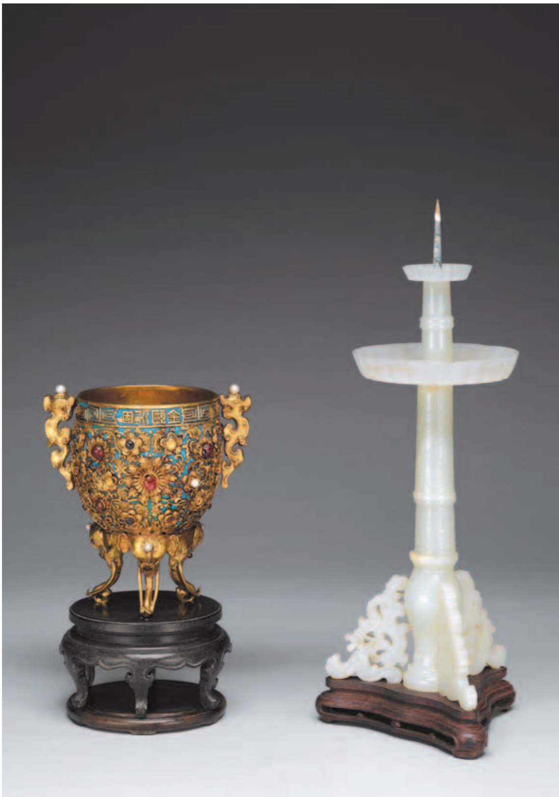
圖一 清 乾隆 金甌永固杯及玉燭長調燭臺 國立故宮博物院藏

根據《造辦處各作成做活計清檔》記載，乾隆四年（一七三九）十一月二十八日，乾隆皇帝授意製作〈玉燭長調〉燭臺與〈金甌永固〉金杯，於同年十二月三十日完成，《活計檔》記錄了大致的樣貌： 白玉托一件、白玉異獸一件配得法 椰挺銅鍍金座，玉托上刻玉燭長調 蠟杆一件。鑲嵌珠寶象鼻足金甌永 固一件，金重十六兩八錢，紅寶石 四顆，珍珠四顆，藍寶石四塊，碟 子二顆。