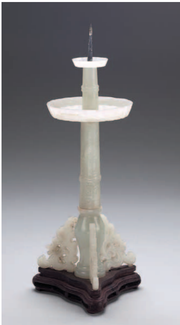
圖三 清 乾隆 玉燭長調燭臺 國立故宮博物院藏