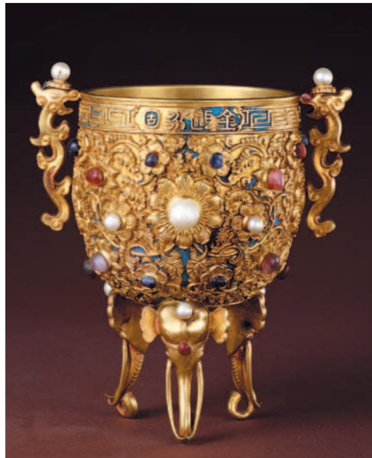
圖十 清 乾隆 金甌永固杯 北京故宮博物院藏

記載相同：而院藏之〈玉燭〉，根據《故宮物品點查報告》原貯放於養心殿西暖閣，極可能與陳設檔所記相同；至於〈金甌〉，若英國之金甌出自圓明園，那麼陳設檔所記，或許正是院藏〈金甌〉。 此次，本院首度展出〈金甌永固〉與〈玉燭長調〉，為乾隆授意製作的元旦開筆儀式用器，顯現乾隆初年金甌與玉器製作工藝與時代風格，不僅是一國之君期盼政權穩固與四時和暢的具體呈現，更承載著乾隆皇帝的新春祝願及對天下太平的願望。歷經歲月流轉、時空變遷竟得以重聚展出，真可謂「在在處處有神物護持」！ 作者任職於本院器物處