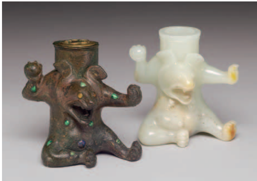
圖十一 漢銅熊尊與清乾隆玉熊尊合照 國立故宮博物院藏 攝影師如沒有表現出質感的差異，就無法給同一個主題但不同材質的熊尊，產生差異性的趣味。

銅器本身的紋飾線條更加明顯，不過攝影師也必須具備讓影子淡化的打光技巧才行，太過生硬的影子的確會影響我們對文物觀看時的心情，就和作畫一樣，影子幫助攝影師處理畫面空間的效果，也間接強化文物的立體造型，如同作畫時要細心刻劃細節，同時要顧全整體氣氛，兩者一樣重要，影子就是讓照片有細節又有氣氛的元素，我們能夠不用去背的方式拍攝就盡量不要，去背就等同把所有空間都去除了，這樣的照片似乎就缺少生命了。