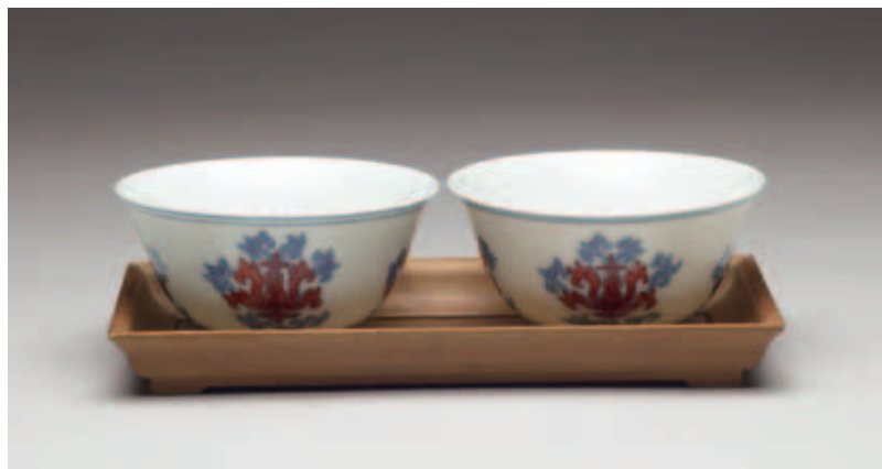
圖八 明成化 青花紅彩茶鐘一對附托 國立故宮博物院藏 合照可以就使用的習慣來表現出文物的實用性。

時看到兩件文物，還可以讓它們在一個時空畫面下互相比較，這就和看雙胞胎是一樣的道理，雙胞胎長得很像，但是我們總是想看出他們哪裡不同。此外，攝影師還要注意的是兩件文物的距離感，也就是讓兩件文物在同一个畫面上成爲一個主題，因此在