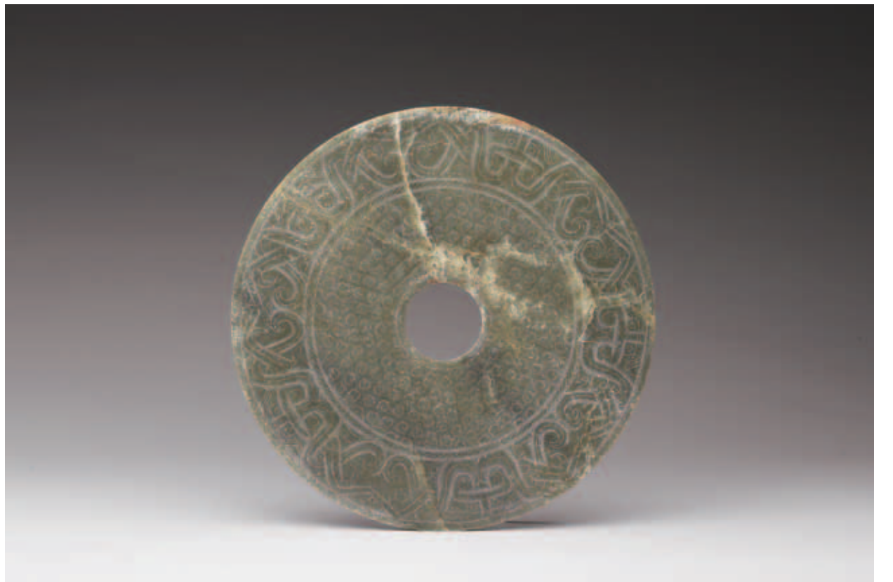
圖三 戰國至西漢早期 龍鳳紋璧 國立故宮博物院藏 圓形文物用橫幅拍攝是較安全的方法，在視覺經驗上橫幅的視野加上圓造型給人天空的聯想。

並且可以讓兩件文物產生差異性（圖七）；所謂公平的方式是指在打光與角度上面要力求一樣的條件，讓兩件文物放在同樣的基準點上，這樣文物自然可以呈現他們的不同，藉由這種方式兩件文物也自然會產生對話，說起來很玄其實並不難理解，因為古物是古人用手工的方式製造出來的，兩件物品絕對不可能完全一樣，藉著相同的基準點來拍攝，不但能讓人同