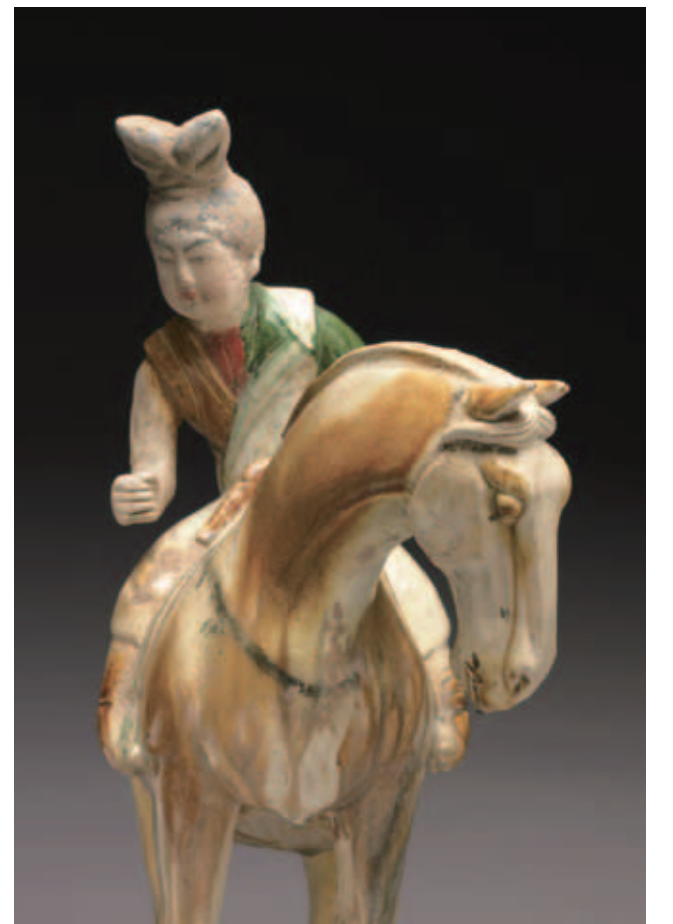
圖四 唐 三彩打馬球俑 國立故宮博物院藏 眼神是一條隱形的線，帶領觀者進入一個故事。

特寫 攝影常常會用到特寫的鏡頭，尤其在微觀的視野中我們會對文物有不一樣的詮釋，就文物研究而言，許多資訊就在文物本身的細節中，像是銘文、紋飾、鑄燒法、釉料、支釘、製作痕、使用痕、製造工具痕、銅鏽、裂璽等等，都是文物本身留下來的線索可提供研究人員研究的資訊，就研