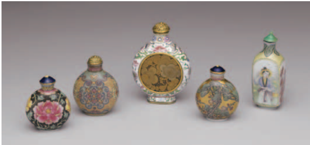
圖九 各式畫珐瑯鼻煙壺 六件 國立故宮博物院藏 以呈列的方式擺設文物可以讓每一件都清清楚楚的展現。

內有兩件藏品剛好給我們做了一個比較，〈清乾隆玉熊尊〉，為清朝仿古之作，另一件是〈漢銅熊尊〉，原本是漢代器物下方的器足，兩件不管神