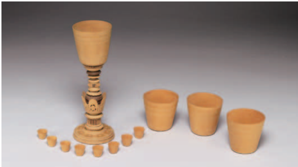
圖十 德國 木製多層套杯 國立故宮博物院藏 依據文物的造型來擺設有節奏感的合照，讓畫面增加很多趣味。

內有兩件藏品剛好給我們做了一個比較，〈清乾隆玉熊尊〉，為清朝仿古之作，另一件是〈漢銅熊尊〉，原本是漢代器物下方的器足，兩件不管神