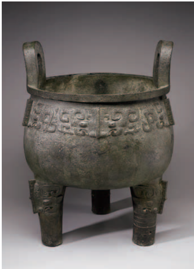
圖十三 商晚期 銅卣祖丁鼎 國立故宮博物院藏 少許的影子增加文物的重量感，也幫助刻畫紋飾的線條讓它更明顯。