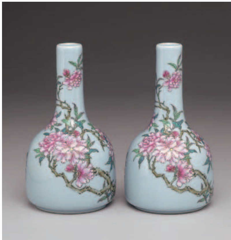
圖七 清 磁胎洋彩汝釉碧桃詩意雙陸瓶一對 國立故宮博物院藏 對件要以公平的方式呈現在照片上，才能讓兩件文物比較出差異點。

所謂光點是指文物質地因為完全反射了光線，而把攝影師打的光完全反射到相機鏡頭中，也就產生照片中所謂有反光點的效果了，文物攝影中光點常常是攝影師頭痛要解決的一個問題，就算不是問題攝影師一樣要先準備好消除的方法，因為你永遠不知道這件文物到底多會反光；反光意味著失去顏色的呈現，也干擾了造型