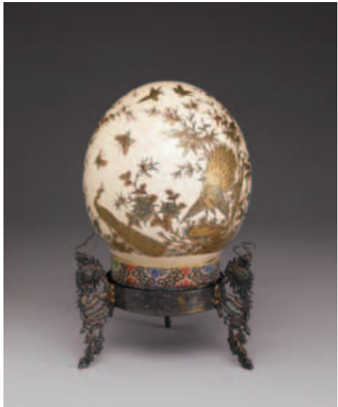
圖二 清 描金花鳥駝鳥卵 國立故宮博物院藏 直幅構圖讓觀者視線停留在金彩描繪的孔雀花鳥紋。

窗戶，左右的延伸可以給人想像的空間，而不管在繪畫或是攝影我們都可以在橫幅的構圖中，得到比主題更多的聯想（圖一），相反的，直幅的構圖最常運用在肖像，上下式的觀看方法可以幫助觀者來回關注畫面中的主題，強化被攝物的重要性（圖二）；了解這兩種不一樣的構圖方式，就算是一樣的主題我們也可以靈活的運用了。