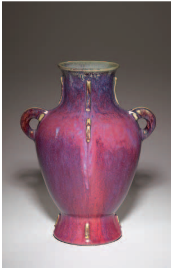
圖十二 清 雍正 爐鈞袖雙耳耳戟尊 國立故宮博物院藏 光點要隱藏在器物轉折處並縮小光點，就不會讓人感到干擾了。

本文試著說明文物攝影的影像語彙，藉由「構圖」與「光」這兩大觀點，說明雖然只是一張文物紀錄照片，但是其中所包含的用心與時間都是希望可以將文物最理想的一面呈現給大家，讓不能親臨現場觀看原件的人，可以透過網路或是印刷品看到文物之美，當然文物攝影的技巧與美感非本文三言二語可道盡，只希望本篇文章可以幫助大家對文物攝影有進一步的認識。