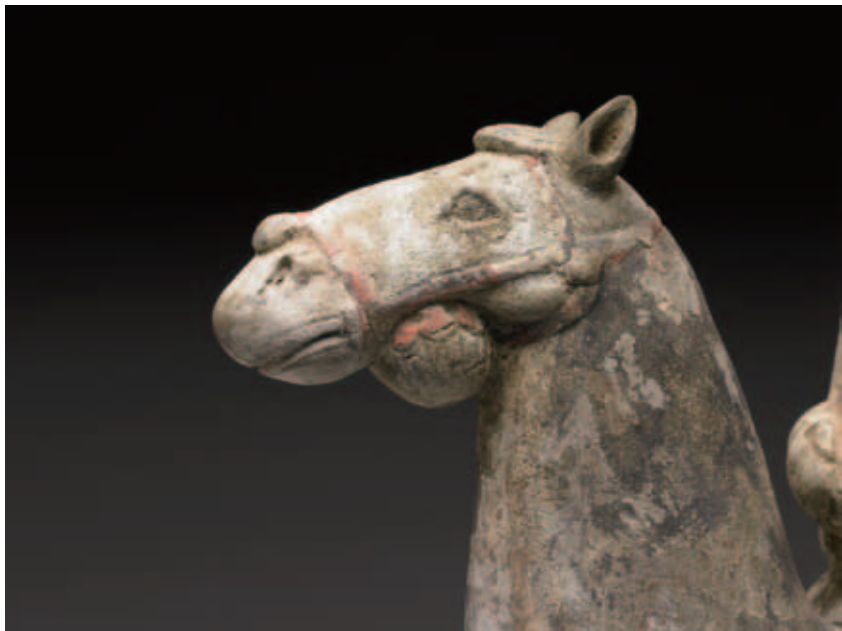
圖五 北齊 灰陶加彩陶騎士俑 國立故宮博物院藏 預留一些空間讓視線延伸可使作品更生動。