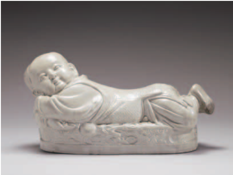
圖一 北宋 定窯 白瓷嬰兒枕 國立故宮博物院藏 橫式構圖給人平靜與想像的空間。

影像的構圖會直接影響觀者的想法，拍攝器物類文物尤其重要，因為攝影是用二度空間再現三度空間的視覺藝術，如何儘可能地表現出器物本身，構圖是非常重要的關鍵，像是直幅或是橫幅的構圖就會給人不一樣的感受，除了考量器物本身的形狀適合直幅或是橫幅外，構圖在先決上就會給人一種預先的心理設定。攝影的矩形構圖其實和繪畫相關，大多橫幅式構圖是運用在風景或是靜物的主題，因為這樣的構圖就好像是一扇