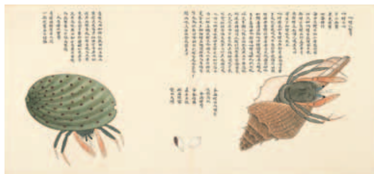
圖十七 清 聶璜 海錯圖 第四冊 響螺化蟹 國立故宮博物院藏