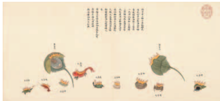
圖十六 清 聶璜 海錯圖 第四冊 繫負火 國立故宮博物院藏