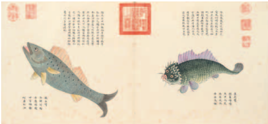
圖六 清 聶璜 海錯圖 第一冊 鱸魚、魚虎 北京故宮博物院藏