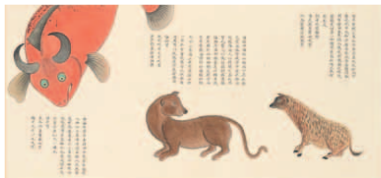
圖十九 清 聶璜 海錯圖 第二冊 潛牛 北京故宮博物院藏

（圖十五）、疑似管蟲的海鐵樹等珍奇物種，與繫負火（圖十六）、響螺化蟹（圖十七）、蝦化蜻蛉（圖十八）等圖繪傳說。