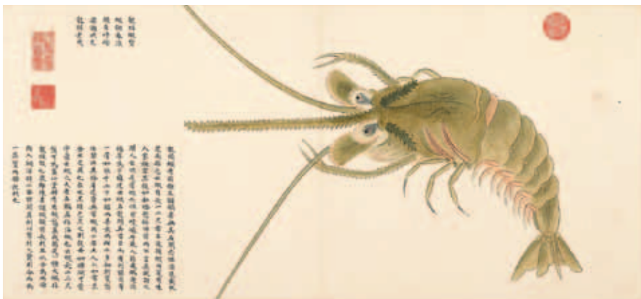
圖七 清 聶璜 海錯圖 第四冊 龍頭蝦 國立故宮博物院藏

聶璜以前的水中生物相關著作 「海錯」典故出自《尚書·禹貢》的「厥賦鹽絺，海物惟錯」，形容貢鹽和細葛布的青州海產錯雜紛陳，多種多樣。 其實在聶璜以前就有關於水族或海洋生物的書籍。明代孫鑛（一五四三～一六一三）據王世貞（一五二六～一五九〇）書畫題