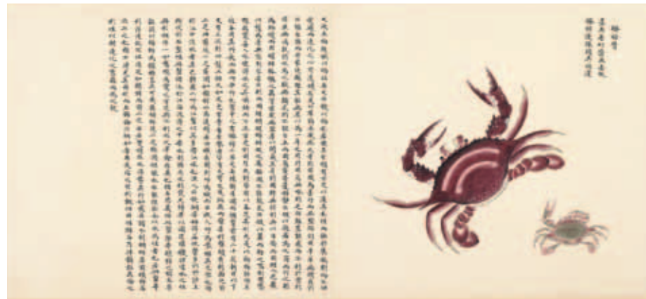
圖三 清 聶璜 海錯圖 第四冊 梭掉 國立故宮博物院藏

等傳說情節；第三冊的第一部分是魚雀互化、鸚鵡魚等魚類和鳥類相互變化的例子；接著有蚌、蛤、蝗、蚶等具有硬殼的軟體動物；紫菜、海藻、鹿角菜等海中植物、數種海中礁石和海龜；第四冊的物種則相對的品目單純，現身畫中的蟹、螺、貝、蟹、蝦都有帶甲殼的特色，產地包括澎湖、連江、閩中漳泉，甚至遠達琉球、呂宋，並且形貌相對寫實。尤其值得一提的是，第四冊畫蟹共計十七開三十四種，內容多述及聶璜客遊滇、閩東南沿海的親身見聞經歷，推測泰半與康熙丁卯所畫的〈蟹譜〉三十種重疊，是〈海錯圖〉中最早成形的部分。