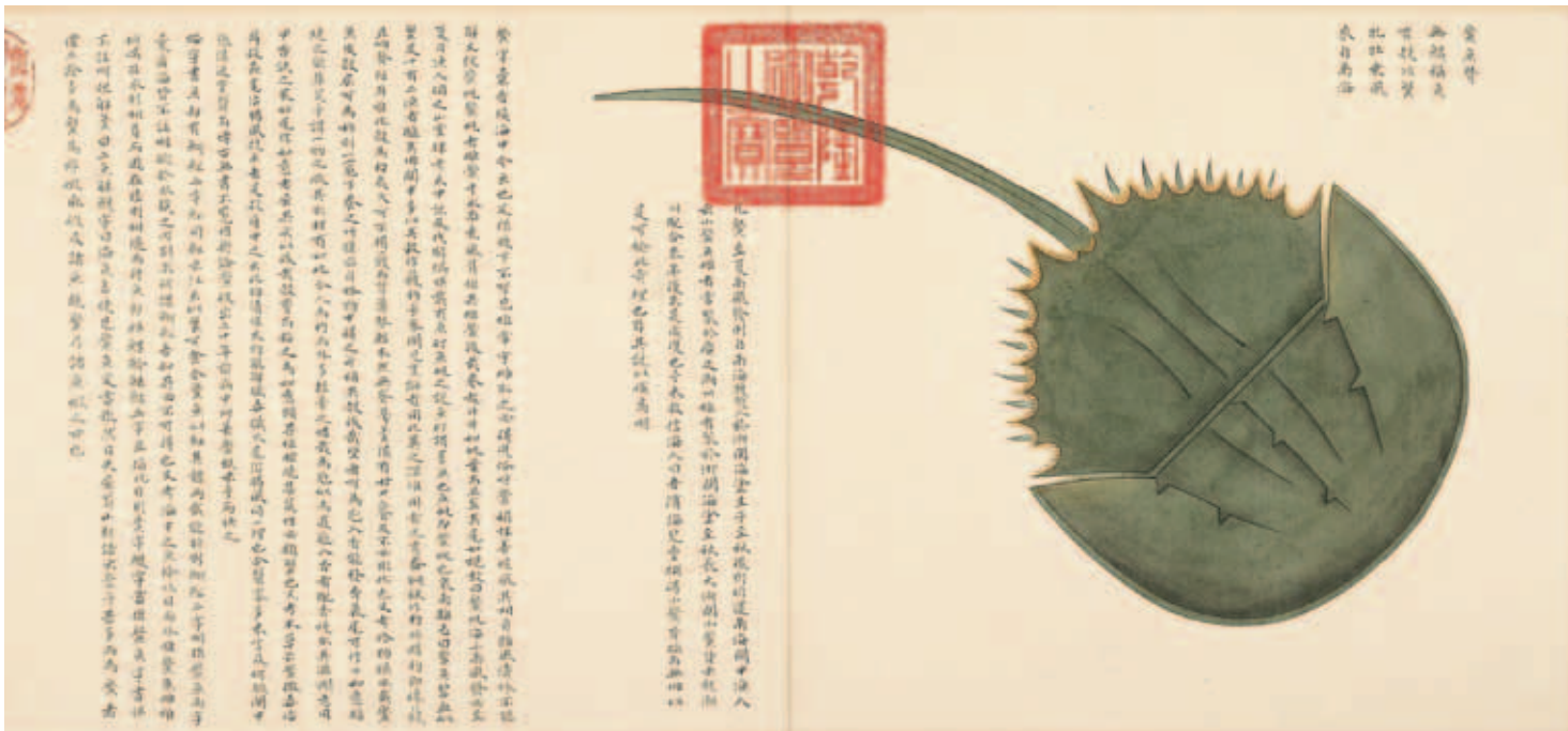
圖一 清 聶璜 海錯圖 第四冊 蠶

根據《石渠寶笈續編》記載，《海錯圖》一套四冊，第一冊共四十八葉、第二冊三十七葉、第三冊三十九葉、第四冊四十四葉，共畫海錯三百七十一種。在第一冊的序文末尾，有「時康熙戊寅（三十七年，一六九八）仲夏，閩客聶璜存庵氏題於海疆之釣鰲磯」文句，因此得知成畫年代與畫家姓字。聶璜在題字間，敘述自己是錢塘（今浙江杭州）人，客遊台甌近二十載，康熙丁卯