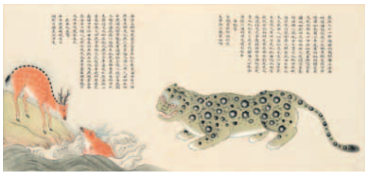
圖八 清 聶璜 海錯圖 第二冊 鹿魚化鹿、海豹 北京故宮博物院藏

聶璜在〈海錯圖〉序文開頭，闡明了自己製作這套海錯圖的宗旨。序文首先以《中庸》所言，天地生物繁多，水中生物的種類多過陸地，海是「浮天載地」最大的水體，生活於