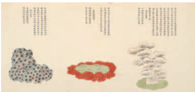
圖十三 清 聶璜 海錯圖 第三冊 松花石、荔枝盤石、海芝石 北京故宮博物院藏