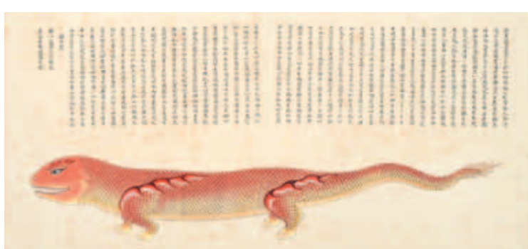
圖十一 清 聶璜 海錯圖 第一冊 鱷魚 北京故宮博物院藏