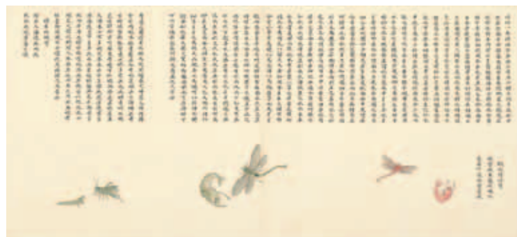
圖十八 清 聶璜 海錯圖 第四冊 蝦化蜻蛉 國立故宮博物院藏