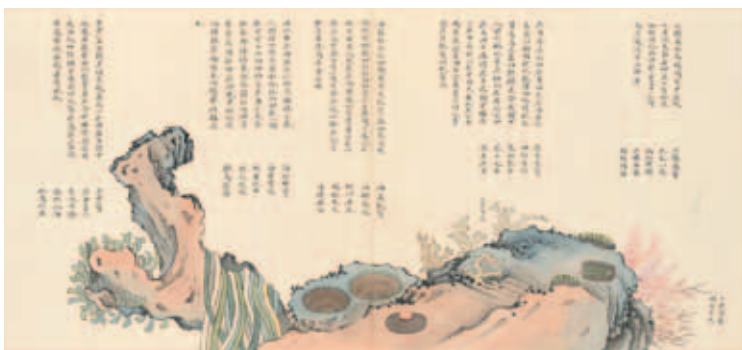
圖十二 清 聶璜 海錯圖 第三冊 昆布、海膽、鹿角菜、石鱉 北京故宮博物院藏