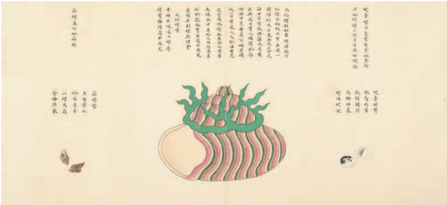
圖二 清 聶璜 海錯圖 第四冊 火焰螺 國立故宮博物院藏