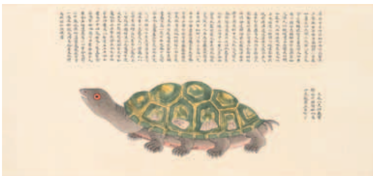
圖十五 清 聶璜 海錯圖 第三冊 三尾八足神龜 北京故宮博物院藏

其中的物種遠遠超過陸地所有。其次提到以往書籍並非不知道這些物種的存在，而是無法盡識盡載。像是《昭明文選》中郭璞（二七六～三二四）〈江賦〉中提到諸多「鯨鯨鯨」等魚字偏旁部首的水族名稱，雖然讀過該篇文章的儒士頗多，但是儒者也許認識字，卻未曾看過形狀；漁夫可能認識形狀，卻喊不出名稱。說文韻書和譜錄類書所載的水族名稱雖多，