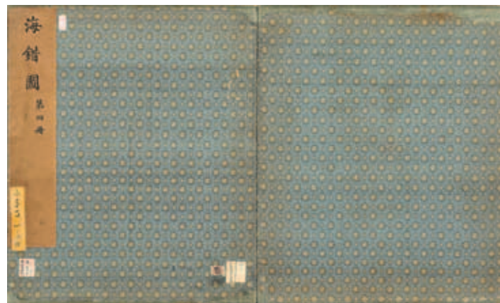
圖五 清 聶璜 海錯圖 第四冊 題籤 國立故宮博物院藏

詩，與習性、特色、產地、傳說記載甚至日常應用等相關說明，全以工整小楷寫於圖繪四周。