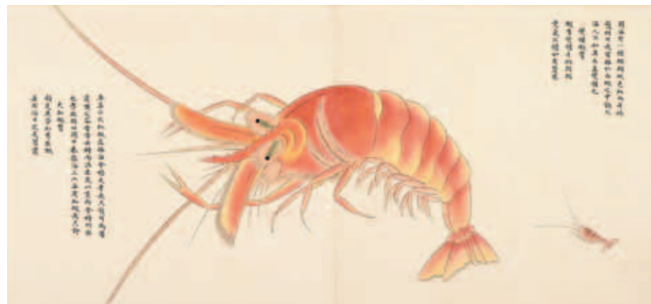
圖四 清 聶璜 海錯圖 第四冊 變種蝦 國立故宮博物院藏

（一六八七）曾畫〈蟹譜〉三十種。之後客居淮、揚，訪海物於河北、天津，遊滇、黔、荆、豫，之後客閩，決定以往所繪的〈蟹譜〉和往昔所聞