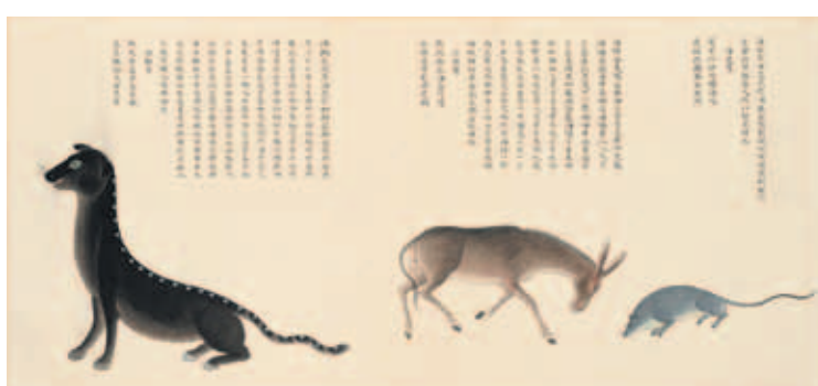
圖十 清 聶璜 海錯圖 第二冊 海獺、海驢、海鼠 北京故宮博物院藏