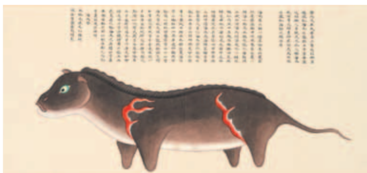
圖九 清 聶璜 海錯圖 第二冊 海馬 北京故宮博物院藏