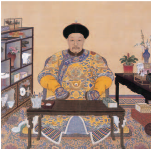
圖十九 清 無款 清仁宗嘉慶皇帝寫字像 北京故宮博物院藏

徵著吉祥如意。 小結 中國盆景的創意來自於大自然，以樹木、山石等為素材，經過藝術處理和精心培養，在盆中再現大自然神貌，其造型之美，可誘發欣賞者的共鳴。盆栽、盆景不佔空間可隨意搬動，以人工修整比例高矮，塑成美觀奇特的花葉形態，並配置古雅怪石，適宜佈置於庭院或室內，用以美化環