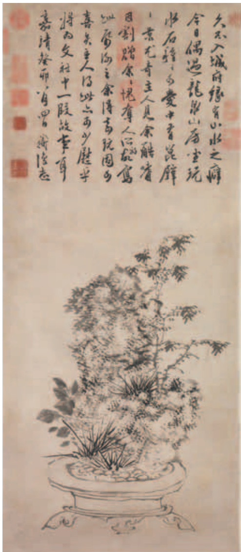
圖一 明 陳淳 崑壁圖 國立故宮博物院藏

木之類，輒謂之愛清。」當時也出現了衆多花木園藝和盆景專論，如高濂《遵生八箋·高子盆景說》、屠隆《考槃餘事·盆玩箋》，文震亨《長物志·盆玩篇》，以及王象晉《二如亭群芳譜·盆景》（初刻於天啓元年，一六二二）。明清時期用於製作盆景的花木種類較宋元時明顯增多，盆景造型技術更臻於成熟，表現形式更豐富多樣化，終於促成了清代盆景園藝的蓬勃發展。