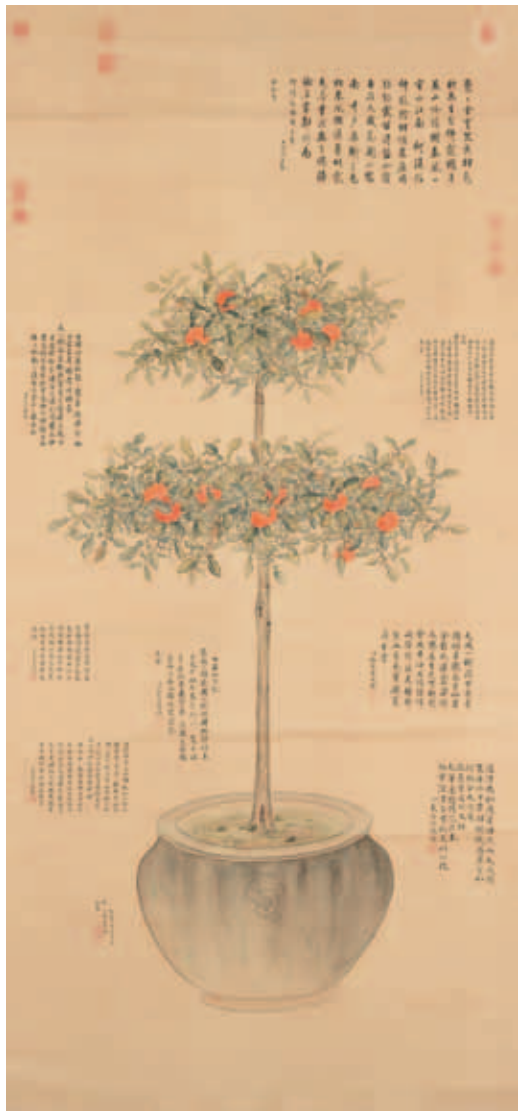
圖七 清 余省 仿御筆盆橘圖 國立故宮博物院藏