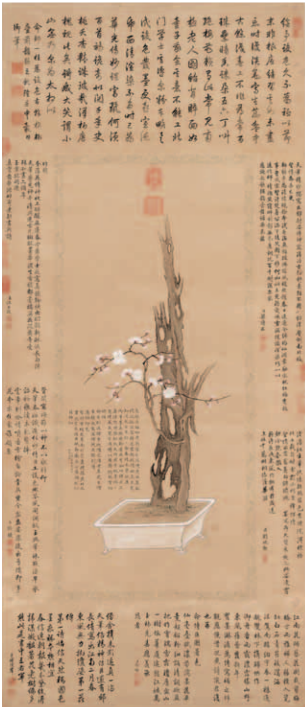
圖五 清 鄒一桂 畫古幹梅花 國立故宮博物院藏

淺盤中，敞口，直壁，四方足。槎桠枝幹橫斜抱石而偃，清香白梅吐蕊怒放，高雅脫俗。以寫意筆法繪拳石，曲幹回枝運用人工修剪整形技術，略施胭脂的梅花，呈現出造化之美。另一位宮廷畫家王圖炳（一六六八—一七四三）〈盆梅〉，選自〈冬景花卉詩畫冊〉第五開（圖四），繪拳石白梅盆栽，古色古香。梅花，薔薇科落葉喬木，利用整枝塑造成優美樹型，於冬季落葉後移植，上盆後以人工加以攀紮，使成株形矮化的盆栽。畫中梅幹虬枝曲折，單瓣白梅於早春先開