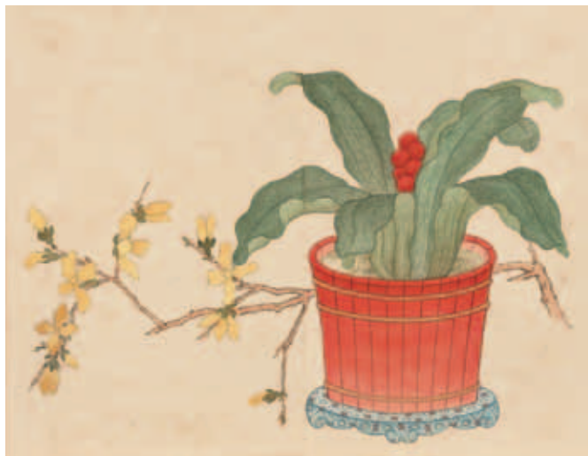
圖十八 清 沈煥 萬年青花盆 選自畫仙葩清供 第二開 國立故宮博物院藏

呈瑞，盛世昇平。此卷繪製目的正如題識所云：「今六蒞南邦，春祺普錫。白叟黃童，罔不翹首翠華，祝聖人萬萬壽。……因敬題曰萬年花甲，用昭茂對之隆，併效祝釐之盛。」另又有一筆《活計檔·行文》資料，乾隆四十九年（一七八四）「四月二十七日，首領呂進忠交萬年花甲手卷一卷……於九月十二日，蘇州送到玉鸞錦袱七分呈進交如意館。」（註二）與卷末