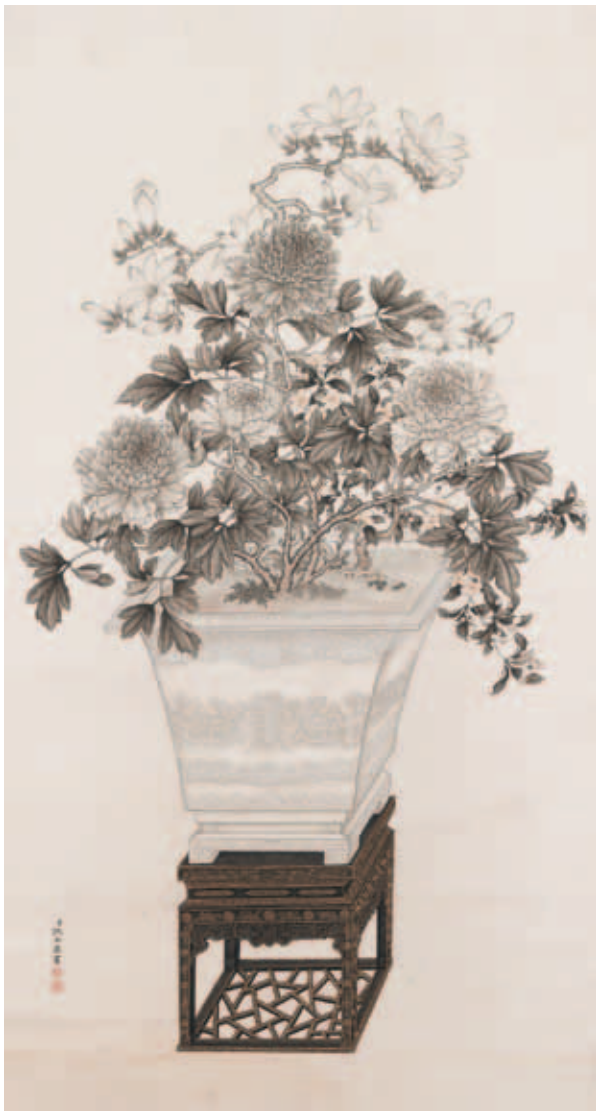
圖六 清 沈全 墨牡丹 國立故宮博物院藏

十九世紀），字璧如，江蘇人。善仕女、花鳥，為清代中、晚期如意館供職畫士「沈家」（以沈振麟為首）家族成員之一。（墨牡丹）（圖六）畫中盆景將牡丹、玉蘭、海棠三種花木移植瓷盆中，組合成一完整植株。牡丹芍藥科灌木，春至初夏開花，重瓣花特大，單生於枝頂。分枝粗壯，葉三至五裂，先端漸尖。木蘭，木蘭科落葉喬木，別名玉蘭，春季開花，未出葉先開花，花形碩大，花冠雪白，具芳香。另一種是木本海棠，畫中所繪為枝梗略堅，花色稍紅的西府海棠。三種花木互相搭配，取其諧音，具有「玉堂富貴」的吉祥寓意。全圖以水墨與淡赭細膩敷染，運筆精細熟練，墨色濃淡變化層次分明，花卉具有仿如光影般的立體感。花盆形制端整，廣口折沿平伸，深腹、上豐下斂，器腹飾以番蓮紋、圖案化龍紋與「壽」字、如意雲紋。黑漆描金方几盆架，高束腰，開有魚門洞透光，直根腿帶托泥，空缺處冰裂紋，製作考究，為典型清式宮廷家具。