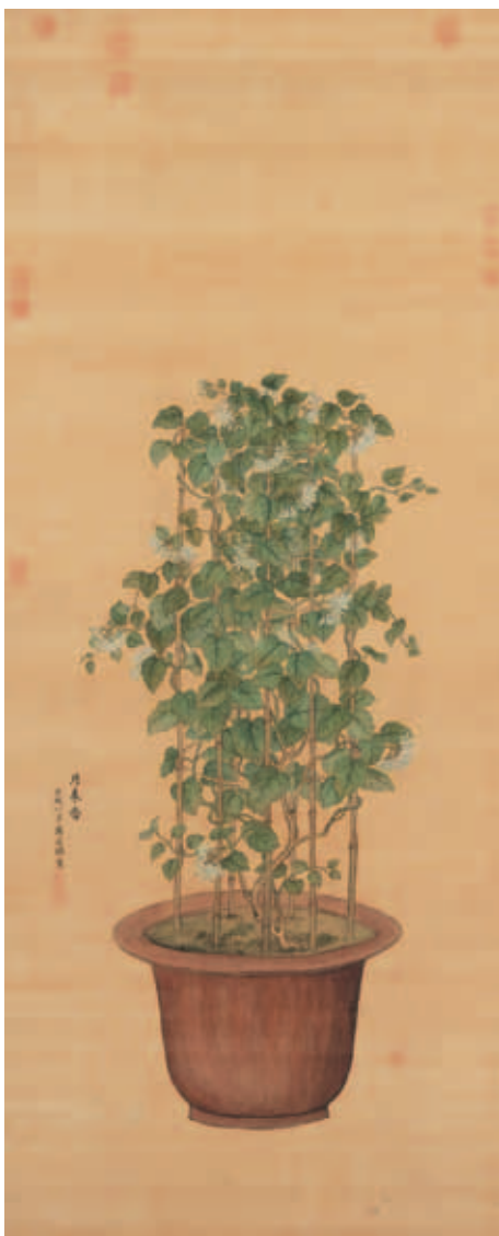
圖十三 清 蔣廷錫 月來香 國立故宮博物院藏

畫中共繪有十四枚，橙黃色果皮上繪有許多油腺點。搭配素燒陶缸，直徑較大，鼓腹下斂，兩側飾有獸面銜環。余省早年受業於蔣廷錫，善花鳥草蟲，與弟余穉曾協助郎世寧作畫，此圖筆墨設色具有深淺、濃淡、明暗變化，墨色與水分的交融效果仿如西洋水彩畫。