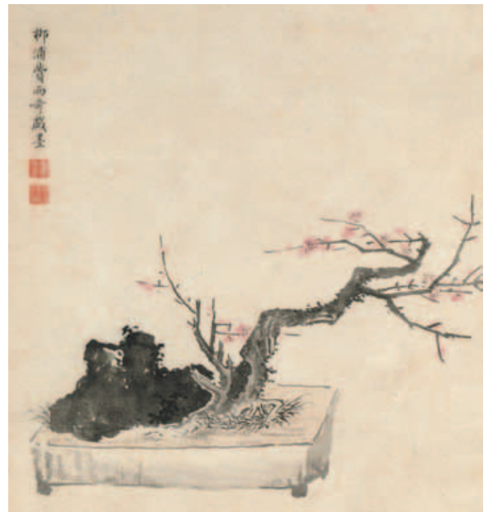
圖三 清 費而奇 盆梅 選自國朝名繪 第九開 國立故宮博物院藏

四季不同變化，枝幹、花葉各有其形態，觀賞之可產生愉悅心情，而盆器的組合更增添其藝術性。宋元時期花木栽培技術與山石造園的基礎，促成了明清時期盆玩藝術多樣化的發展。 康熙時期費而奇（活動於十七至十八世紀初）字葛陂，號柳浦，浙江杭州人。所作〈盆梅〉選自〈國朝名繪〉第九開（圖三），梅椿植於長方形