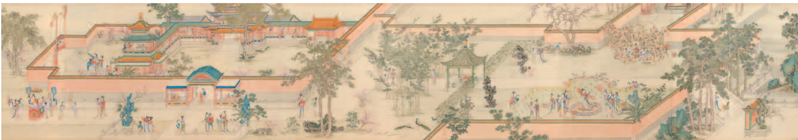
圖十六 清 丁觀鵬 仇英漢宮春曉圖 局部 國立故宮博物院藏