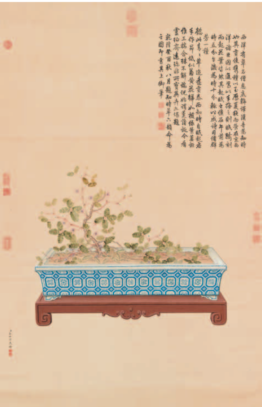
圖十五 清 郎世寧 畫海西知時草 國立故宮博物院藏