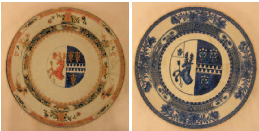
圖九 Decker花園裡的鳳梨(上) Fitzwilliam博物館藏 Decker瓷盤(下左右) 大英博物館藏