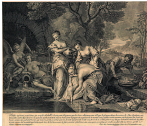
圖十八 French家族瓷盤底部及其紋章圖案 (上左) French家族瓷盤上希臘英雄阿基里斯的故事 (上右) Nicolas Vieughels繪製圖像 (下) 大英博物館藏 © Trustees of the British Museum