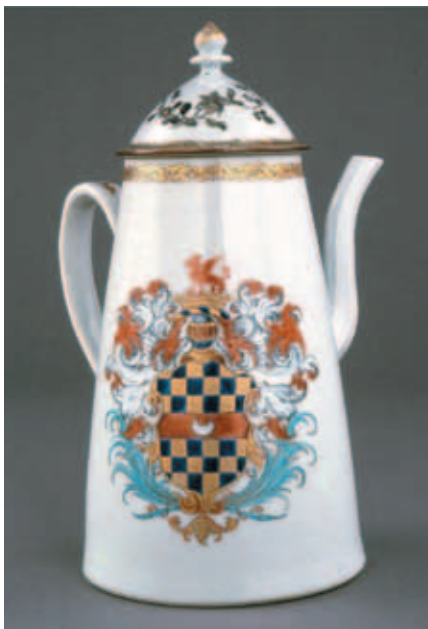
圖二十 Clifford咖啡壺 大英博物館藏