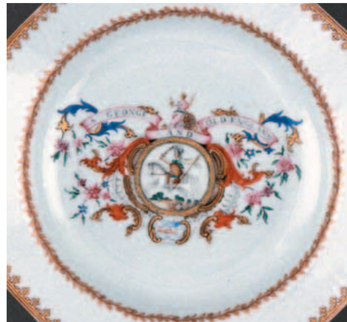
圖二一 英國「反高盧」團體盜盤 大英博物館藏