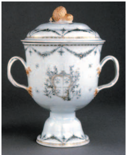
圖十九 Banks瓷杯 大英博物館藏