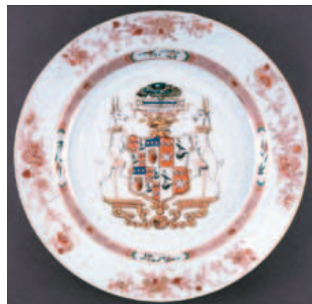
圖七 Hamilton瓷盤 大英博物館藏

火盆上燃燒的心臟、一對鴿子、弓箭袋，這個組合在西方文化中寓意為「愛的祭壇」(Altar of love)；麵包樹右方有五彩繽紛的鳥、兩隻狗、風笛、帽子、一對交叉的手杖、遠方有一群綿羊，意指「缺席的主人」(Absent Master)。盤子底部則有一個纏繞纜繩的船錨，整體構圖相當特殊。(圖八)