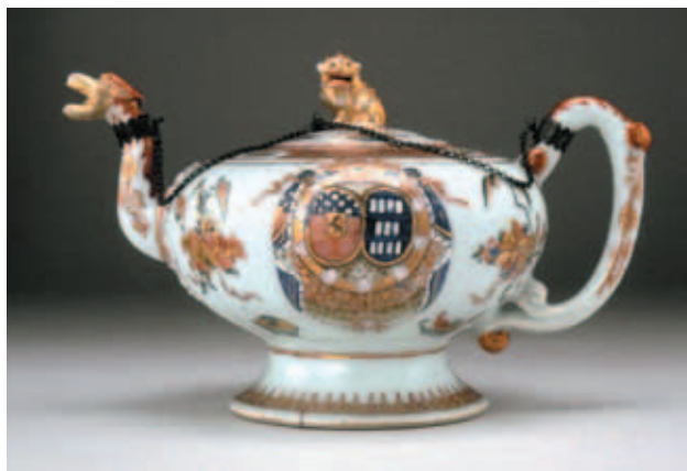
圖十一 Chalnes茶壺 大英博物館藏

滴血的屠刀。許多歐洲的城市、省份至今仍有專屬的類紋章圖案，如現今比利時的Loven市。根據傳說，代表該城的圖案中「紅白紅」交錯的顏色搭配象徵著八九一年與一七五〇年時因為戰爭而被血染紅的Dijle河岸。(圖十五) 東西方對話對製瓷業產生的影響 為了使西方的紋章圖案能融入中國瓷器的設計中，康熙朝的瓷器開始