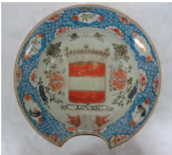
圖十五 比利時Loven市刮鬍盤 大英博物館藏