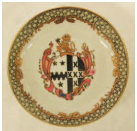
圖三 Blackburn瓷器 (左) Blackburn肖像畫 (右) 大英博物館藏

三種：其一，擁有專屬紋章圖案的個別客戶；其二，沒有專屬紋章圖案的個別客戶；其三，擁有類紋章圖案的團體或組織。