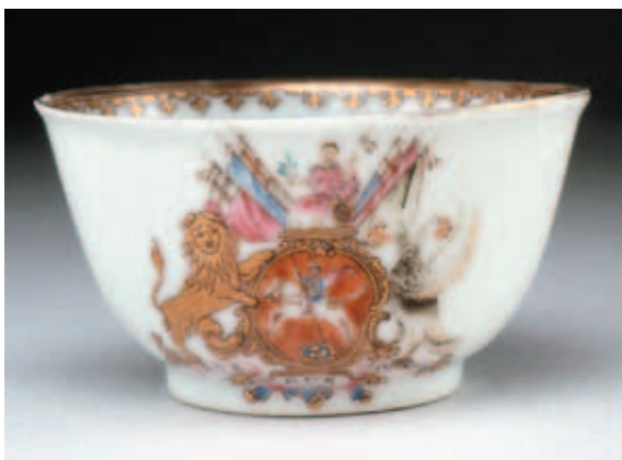
圖十四 英國「反高盧」團體瓷器 大英博物館藏 © Trustees of the British Museum