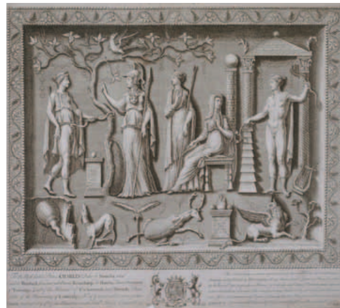
圖十七 銀托盤上的圖案 大英博物館藏