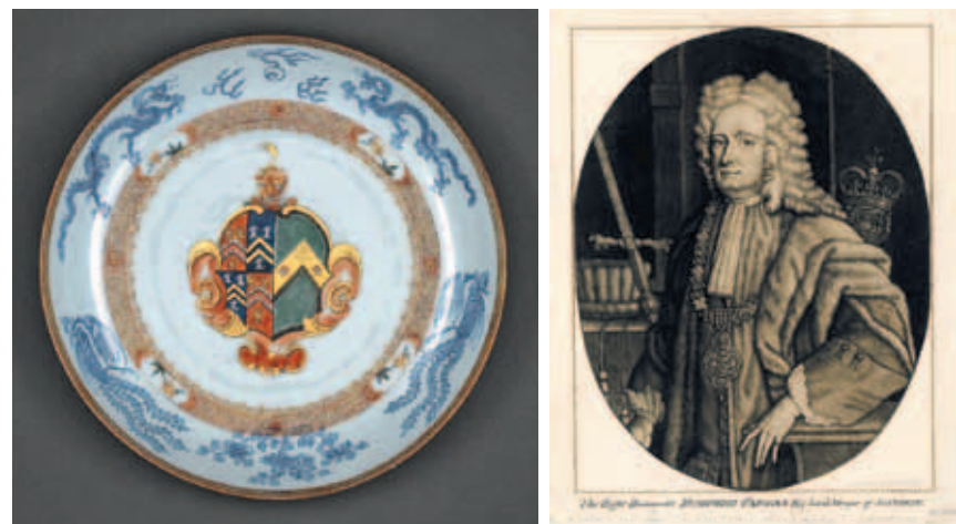
圖六 Parsons瓷盤(左) Parsons肖像畫(右) 大英博物館藏 © Trustees of the British Museum

份則被移到盤子最上方；盤子中央纏繞花冠的麵包樹圖案則是參考 Anson 屬下 Peircy Brett 的版畫，其紋樣在 Anson 於一七四八年出版的 Voyage around the World (譯作《環遊世界》) 中亦可看到。麵包樹左方有棕櫚樹、兩顆在