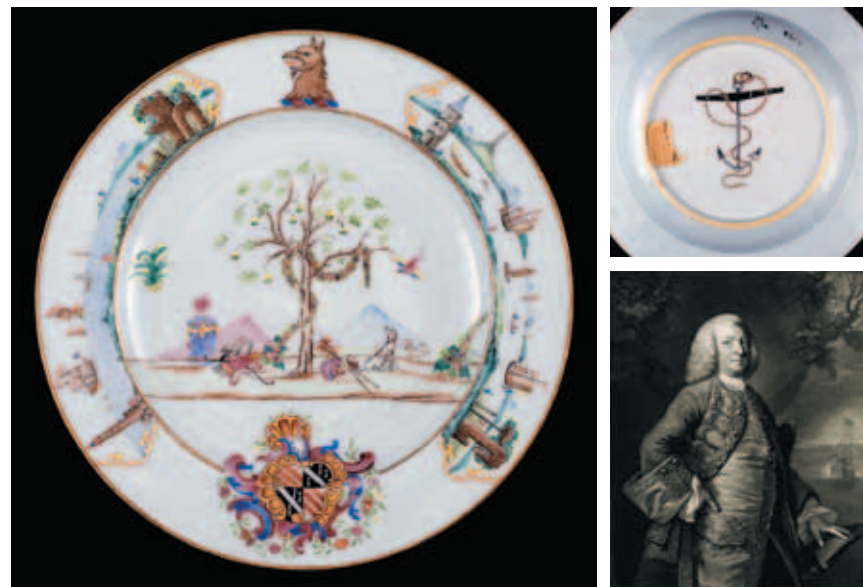
圖八 Anson瓷盤正面(左) Anson瓷盤底部(右上) Anson肖像畫(右下) 大英博物館藏

火盆上燃燒的心臟、一對鴿子、弓箭袋，這個組合在西方文化中寓意為「愛的祭壇」(Altar of love)；麵包樹右方有五彩繽紛的鳥、兩隻狗、風笛、帽子、一對交叉的手杖、遠方有一群綿羊，意指「缺席的主人」(Absent Master)。盤子底部則有一個纏繞纜繩的船錨，整體構圖相當特殊。(圖八)