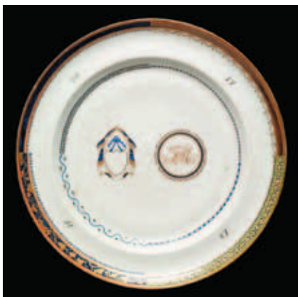
圖二十一 模型瓷盤 維多利亞與亞伯特博物館藏

訂製的咖啡壺造型則可追溯至安女皇 (Queen Anne) 統治時代 (一七〇二—一七一四) 流行的英國銀器形