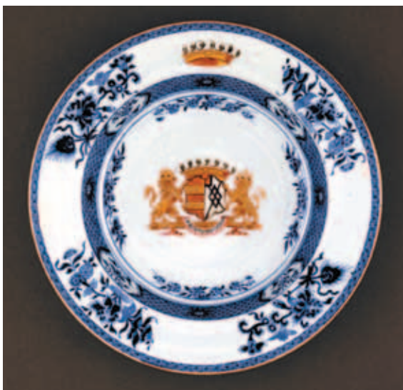
圖四 Harcourt瓷盤 (左) Harcourt及同行的肖像 (右) 大英博物館藏