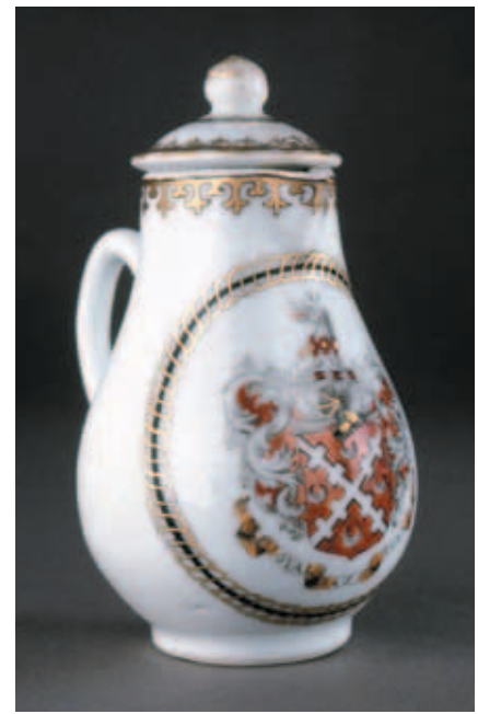
圖二二 Barnwell 牛奶壺（下） Barnwell 紋章圖案（上） 大英博物館藏 © Trustees of the British Museum

冠部份圖案。比利時 Anvers 家族的瓷盤下方飾邊可以見到一個與他們家族無關的紋章圖案，經過追查後，發現這個紋章屬於 Charles Boone，由此可見，這個圖案顯然是不小心誤加上去的。