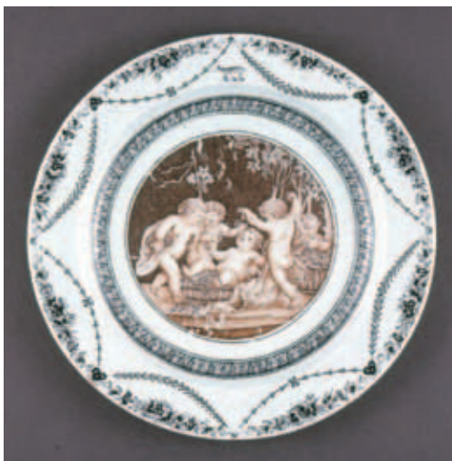
圖五 Martin家族瓷盤 (左) Francesco Bartolozzi繪製圖像 (右) 大英博物館藏 © Trustees of the British Museum