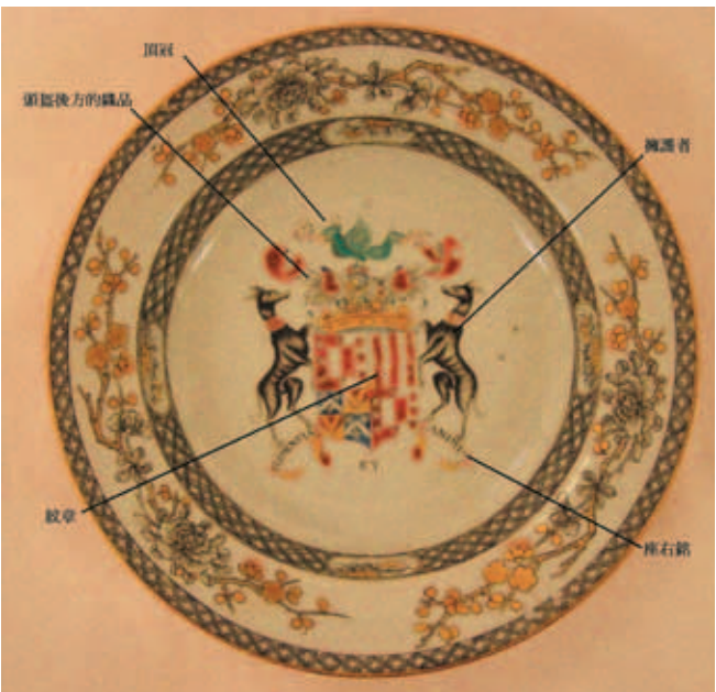
圖一 紋章圖案組成示意圖 大英博物館藏 © Trustees of the British Museum

現今歐洲仍有許多地方都可以找到紋章瓷的蹤跡。許多宅邸、莊園或博物館中仍保有相當完整的收藏，舊時的居住場所、酒吧、垃圾場或沉船遺址也常發現紋章瓷。當時的海運記錄及文獻、繪畫都可以作爲紋章瓷進