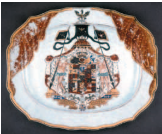
圖十 Prussian East India Company瓷盤 大英博物館藏

器賣掉，人們在瓷器受損處加繪深紅色簾幕型圖案，藉以遮掩缺陷。如今紅色顏料已經斑駁脫落。(圖十) 當時許多透過東印度公司向中國訂製瓷器的書面記錄至今仍然留存，讓我們可以從這些文件中追查出是哪些人訂製瓷器，與了解某些紋樣如何傳進中國。Okeover 家族曾分別於一七四〇年與一七四三年訂製瓷器，而第一筆訂單的紋章畫稿與帳單有被保存下來。帳單上註明一個盤子的價格約為當時的一英鎊，相當昂貴。Tower 家族的訂單中則詳細列出要求訂