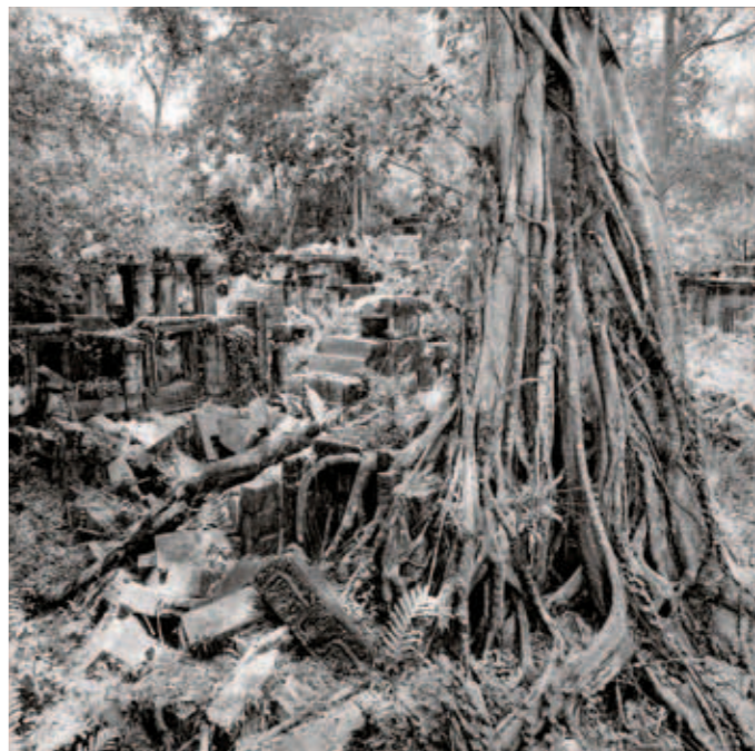
圖八 12世紀 班梅雷雅廟 24×36公分 1962~1966攝 榕樹緊圍著傾倒的小廟。

這座都城比先前任何首都更為易守難攻。蘇耶跋摩二世在位時還修建了其他同樣風格的建築，如班提桑雷廟、塔瑪儂廟和周薩神廟。然而人們不能肯定的是與其同時代的建築，即距吳哥三十公里的班梅雷雅廟（圖八）和孔蓬思維的聖劍寺，是否也是由他所建。