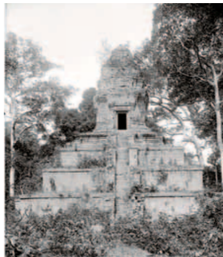
圖二 947年 巴塞增空寺廟 13×18公分 1927攝 植栽清理後的金字塔寺廟正面（東面）。