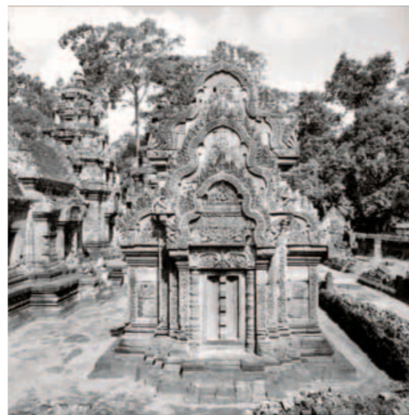
圖四 967年 女神廟 24×36公分 1962~1966攝 經「原物歸位法」工程重構後北藏經閣之東立面。