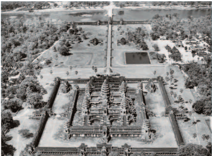
圖七 12世紀上半葉 吳哥廟 1963攝 18×24公分 面向西方的空照圖。

巴蓬廟建築淺浮雕是頗具特色的，它與其他寺廟不同，非由大場面的連環構圖描述故事場景，而是將故事情結拆解成數塊小雕版（圖六），每個雕版描述片段的故事。以圖六為例，該浮雕描述摩訶婆羅多的庫魯斯族與般度族的血親之戰，第一雕版描