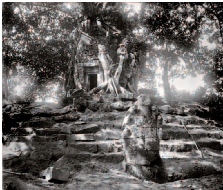
圖十 12世紀末至13世紀初 蟻蛇殿 10.7×4.5公分 1933攝 榕樹纏繞的聖殿。

閻耶跋摩七世 閻耶跋摩七世（一一八二—一二一九在位）生於約一一四五年，在佛教信仰及軍隊環境中成長。一一七七年起占婆攻擊吳哥，歷經多年的抗戰，他成功地將敵人擊退至邊境之外，並在一一八二年取得了王