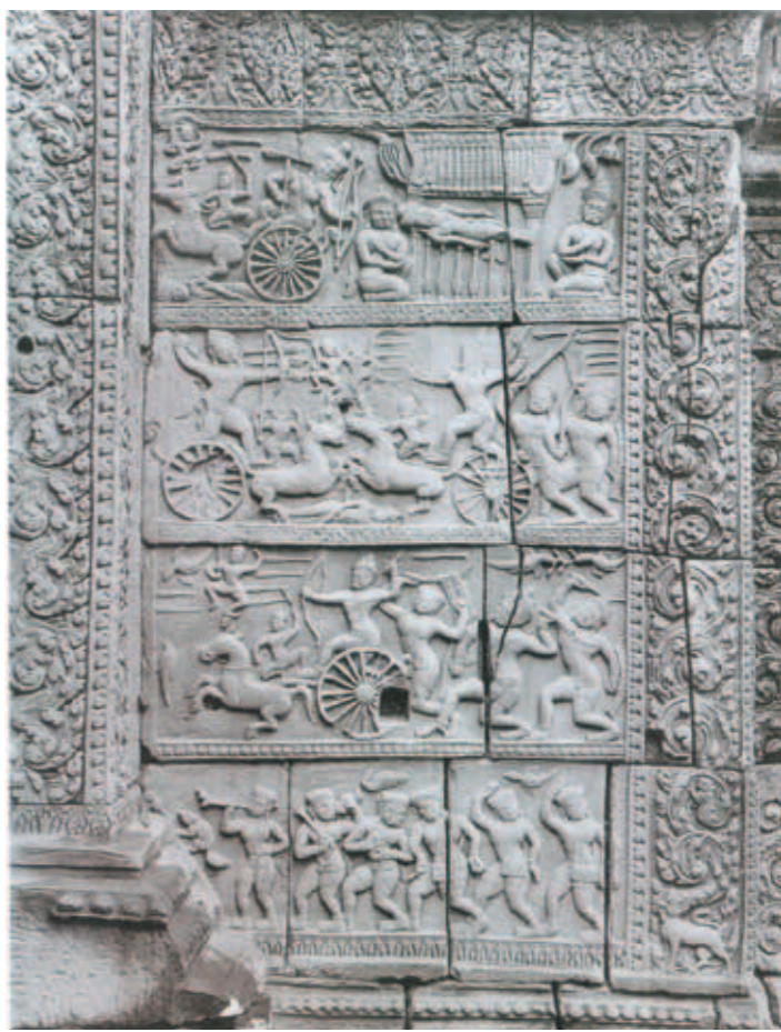
圖六 1060年 巴蓬廟 17×22.2公分 1938攝 第二層東廟門敘事性淺浮雕，庫魯斯特之役。