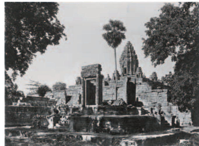
圖一 9世紀 巴孔廟 23.5×17.5公分 1941攝 修復後之東北邊。中央塔經「原物歸位法」修復後得到良好的結果，僅有紋飾末端上方的雙疊八瓣蓮花未被尋獲，部分已經損毀的構件，則已歸回其位。

築，象徵宇宙的中心須彌山，周圍由海洋環繞，通常以護城河代表海洋，高棉人透過建築的規劃體現印度教的宇宙觀。 高棉的寺廟與華人所理解的寺廟不同，通常指的是神祇的住處，而非信徒的聚會場所，因沒有考慮信徒禮拜的空間，且其階梯狀金字塔造型陡峭難行，也不利於信徒前往參拜，往昔也僅有婆羅門能參與儀式，因此神廟內部空間通常並不寬敞。 因陀羅跋摩一世之子耶輪跋摩一世（八八九～九一〇在位）承襲其偉大的建設，首先在羅雷蓄水池中間建造一座祠堂，以緬懷其雙親及祖父母。另外他創建吳哥地區第一個首都，除在其中建造巴肯山，還在王國內最重要的寺廟附近建造精舍。在其逝世後，傳位於其子曷利沙跋摩一世（九一〇～九二三在位），其建造巴塞增空廟（圖二），同樣也是典型的寺廟山建築，曷利沙跋摩一世建造此廟以追念其雙親。 西元九二八年，闍耶跋摩四世（九二八～九四一在位）取得「高棉