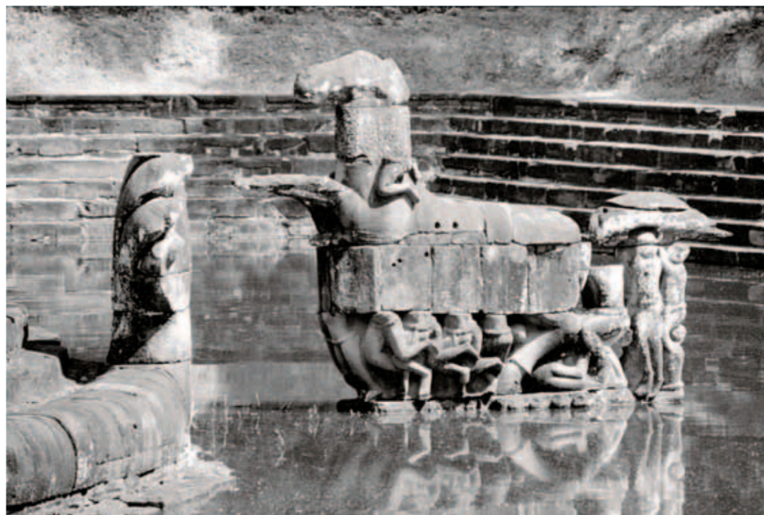
圖十二 12世紀末至13世紀初 蟠蛇殿 24×36公分 1962~1966攝

參考文獻：Pou-Lewitz. Le noms de monuments Khmers . Bulletin de l'École française d'Extrême-Orient. Tome 78, 1991. pp.203-227