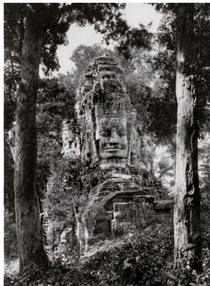
圖九 12世紀末至13世紀初 大吳哥城 23.5×16.8公分 1937攝 清理前西門北面的城牆。