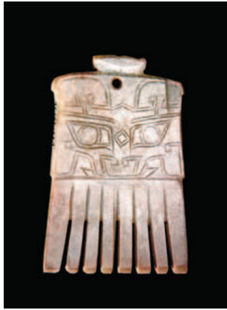
圖三 玉梳 高7.1公分 河南安陽殷墟婦好墓出土 中國社會科學院考古研究所藏

的祭祀方式來祭祀女性祖先。商人自詡為玄鳥後裔。《詩經·商頌·玄鳥》中便有「天命玄鳥，降而生商」之語。在甲骨文中，商人的始祖王亥也是以鳥為名。婦好墓及其他同時代的墓葬中，均可見大量以鳥為造型的玉雕，或許表達了對祖先的崇敬之意。（圖二）