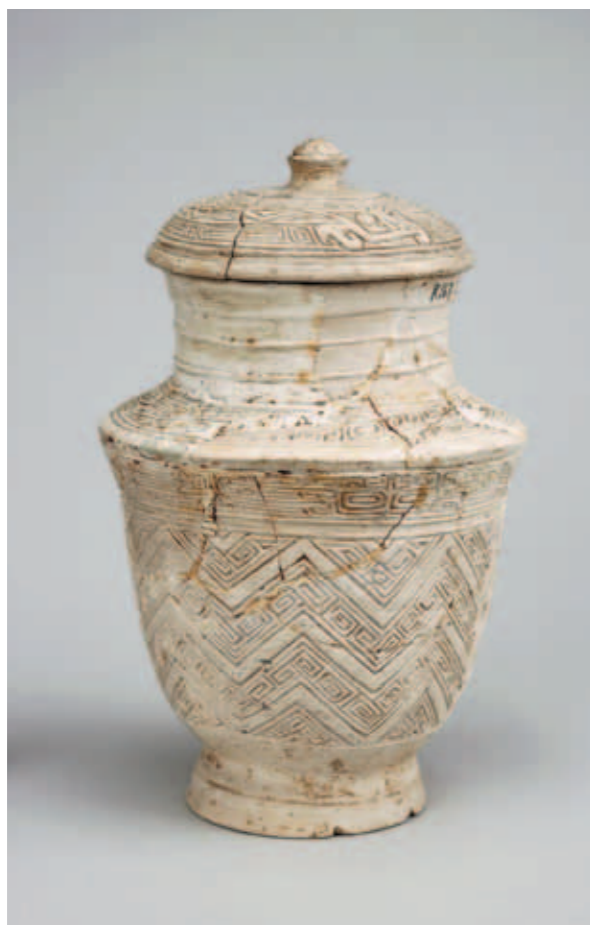
圖廿一 白陶雲雷紋帶蓋罐 高23.2公分 河南安陽小屯331號墓出土 中央研究院歷史語言研究所藏

派駐各地，負責控制當地居民，保障重要物資運送管道的暢通。駐紮於河南南部羅山後李的貴族息族、駐紮於河南濰縣小南張村一帶的徒族，都是著名的例子。這些地方貴族遵循著商王朝的禮儀規範，並擁有與王朝中心風格類型一致的精美禮器。本次選展的一件帶有華麗鴉鳥紋的徒族銅罍，不論在鑄造及設計上，均不亞於王室器用（圖一九）。