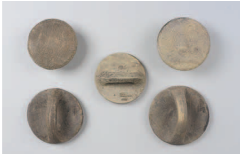
圖一五 陶碗 徑10.7-8.7公分 河南安陽西北岡1400號大墓出土 中央研究院歷史語言研究所藏

對神靈世界的畏懼與崇敬，則演繹出多樣的神禽異獸。從禮儀到日常各式器用，都可見到這些神秘獸面、多變夔龍、昂首鴉鳥及盤曲巨蛇的身影。商代王室與貴族的生活多姿多采，精緻的衣著與講究的日常用