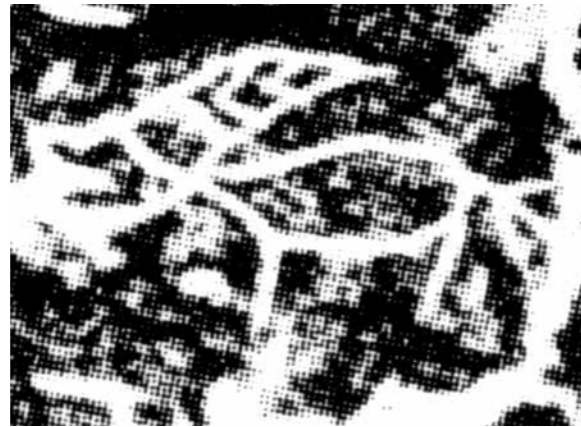
圖九 帶卜辭龜腹甲（《丙編》423）上的「兕」字拓片

有兵符大鉞的婦好更屢屢為武丁出征打下天下，可謂是中國第一女軍事家。甲骨記載婦好多次遠征，征戰過的地方至少有土方、尸方、巴方、龍方、