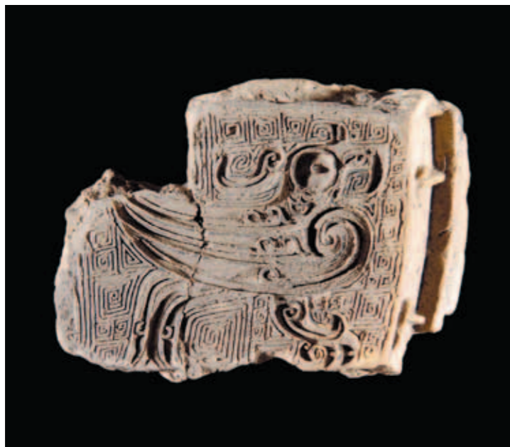
圖二十 銅卣外範 高10公分 河南安陽苗圃北地1號灰坑出土 中國社會科學院考古研究所藏

對內，除以宗教力量進行管理外，居住在都邑裡的人群，有著明確的身份差異。商代社會大體可以區分為貴族、平民（稱眾或人）與俘虜三個階層。此次展出的一組帶著枷鎖的陶俑，便具體呈現社會底層人犯的樣貌（圖一七），與身著華服安靜跪坐的貴族（圖一八）形成鮮明的對比。商王都以外，有許多族氏被王室