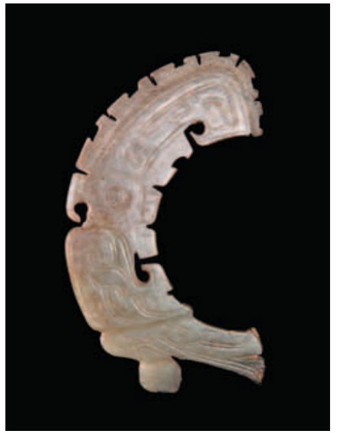
圖二 玉鳥 高9.2公分 河南安陽殷墟婦好墓出土 中國社會科學院考古研究所藏