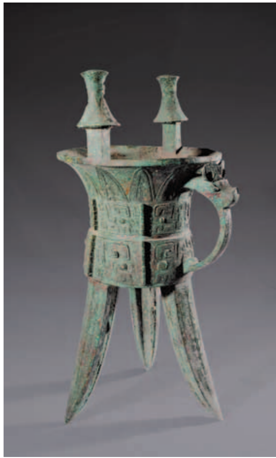
圖一一 司母戊圓盤 高65.7公分 河南安陽殷墟婦好墓出土 中國社會科學院考古研究所藏

適於野生水牛群聚的環境。（圖九）在殷墟發現多種來源的貝殼，則表示商人對貝類有豐富的認識及利用。武丁與婦好的生活瀟灑著濃重的宗教氣氛。據統計，武丁至少擁有三十名貞人為其進行占卜。無事不卜的習慣，將他們的生活細節記載於甲骨之上。此次展出的甲骨，即有表現武丁關心婦好分娩吉凶的卜辭（《丙編》二四七），也有武丁卜問婦好蛀牙的內容。在甲骨上，商人將蛀牙描繪為牙齒生蟲，十分生動。（圖十）