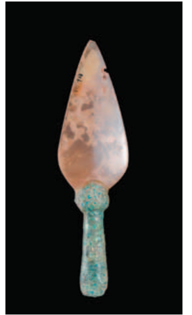
圖一二 銅柄玉矛 玉矛長10.5公分，銅柄長6.9公分 河南安陽殷墟婦好墓出土 中國社會科學院考古研究所藏