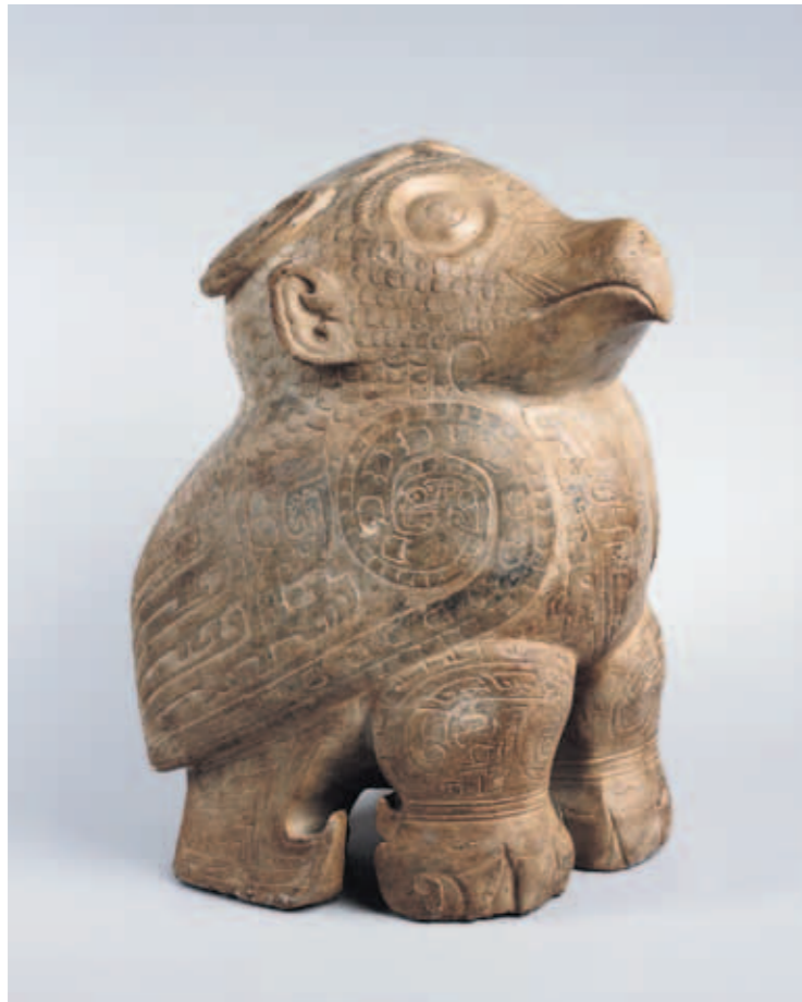
圖廿四 石立鼻 高34.1公分 河南安陽西北岡1001號大墓出土 中央研究院歷史語言研究所藏

層次的高浮雕紋飾。(圖二十)製陶工藝上，白陶禮器為殷墟陶器菁華，質地細緻，在器型與紋飾上都與銅器相呼應。(圖廿一)此外，新出現的釉陶工藝，表現瓷器的發軔階段。玉器製作方面，商人繼承了自新石器時代以來崇玉、愛玉的傳統，因此大量製作玉禮器及隨身配飾。繁複的雕琢