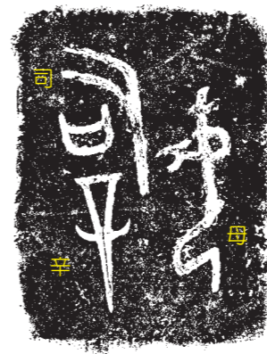
圖廿三 司母辛方鼎銘文拓片

極其華美繁麗，又富有神秘的宗教氣氛。不論是鑄造、作陶或雕琢玉、石、牙、骨上，皆展現殷商文化工藝與科技的成就。鑄造上，商人擁有獨步世界的塊範法青銅鑄造技術。武丁時，這一技術得到空前的發展。複雜的分範技巧，成就出多變的器形與多