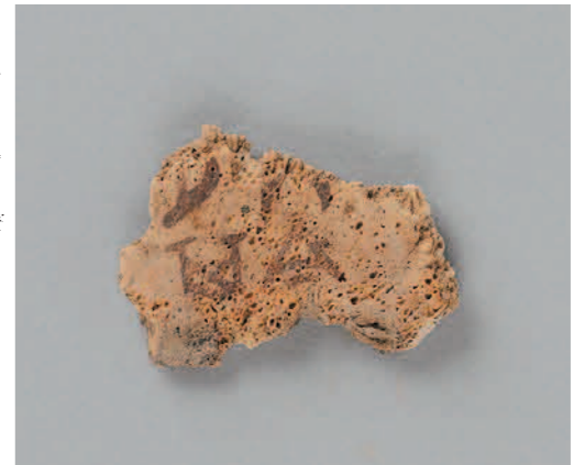
圖廿二 帶卜辭龜腹甲《乙編》566 長3.3公分 河南安陽小屯127號灰坑出土 中央研究院歷史語言研究所藏