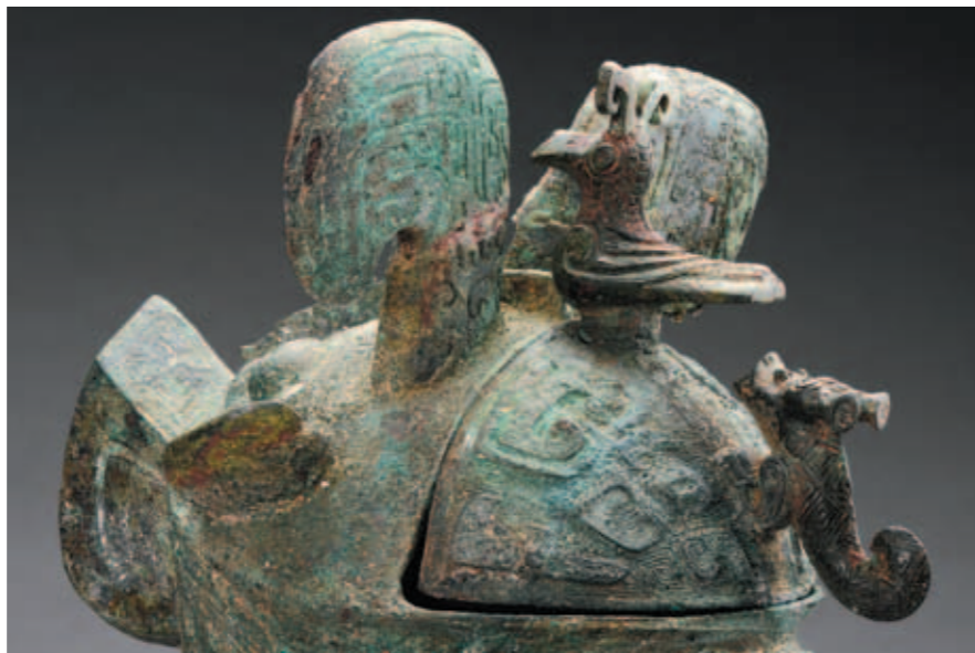
圖五 婦好鸞尊 高45.9公分 河南安陽殷墟婦好墓出土 中國社會科學院考古研究所藏，河南博物館借藏

提，甲骨文中卻保存了這方面的大量資訊。通過甲骨文中一系列祭祀卜辭的比對得知，武丁有三位受到子孫祭祀的法定配偶，分別為「妣辛」、「妣癸」、「妣戊」。與日常活動相關的卜辭中，也可見到許多冠有「婦」字的女性。據統計，殷商時期甲骨文中所見冠有「婦」頭銜的女