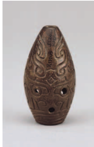
圖一三 獸面紋骨埙 高5.3公分 河南安陽西北岡1001號大墓出土 中央研究院歷史語言研究所藏

武丁通過頻繁且大規模的祭祀來與祖先溝通，希望得到他們的保佑，免致災禍。甲骨上記述許多向神靈虔誠問詢祭祀前各項準備適當與否的占卜，以祈願祭祀活動順利進行。祭典中，商王通過儀式請求祖先神靈降臨享用供奉。巨型酒器體現商人對神靈的敬畏(圖一一)，祭壇旁的玉兵儀仗營造肅穆威嚴的氣氛。(圖一二)