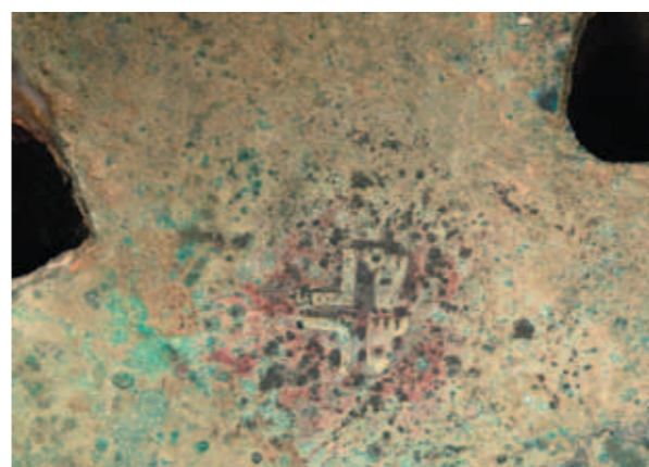
圖一九 徒罍及其銘文 高37.3公分 河南濰縣小南張出土 河南博物院藏

商代的軍隊，包括戰鬥主力戰士，以戈為兵器，身上披著護體的皮甲、頭盔（圖一六），手執盾牌。另有臨時徵召的基層士兵，手持長矛結成陣式，驅趕敵人，讓主力戰士攻擊敵人。馬車被用於征戰，強化了移動的速率與範圍，使部隊更快到達更遠的戰場，戰爭乃更加激烈。雄強的武力可穩固疆域，也確保重要物資，如銅、玉料的傳遞與貿易的順暢。