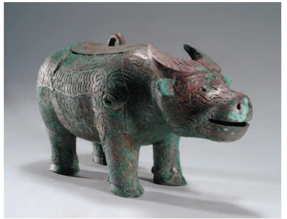
圖八 牛尊 長40公分，高22.2公分 河南安陽殷墟花園莊東地54號墓出土 中國社會科學院考古研究所藏