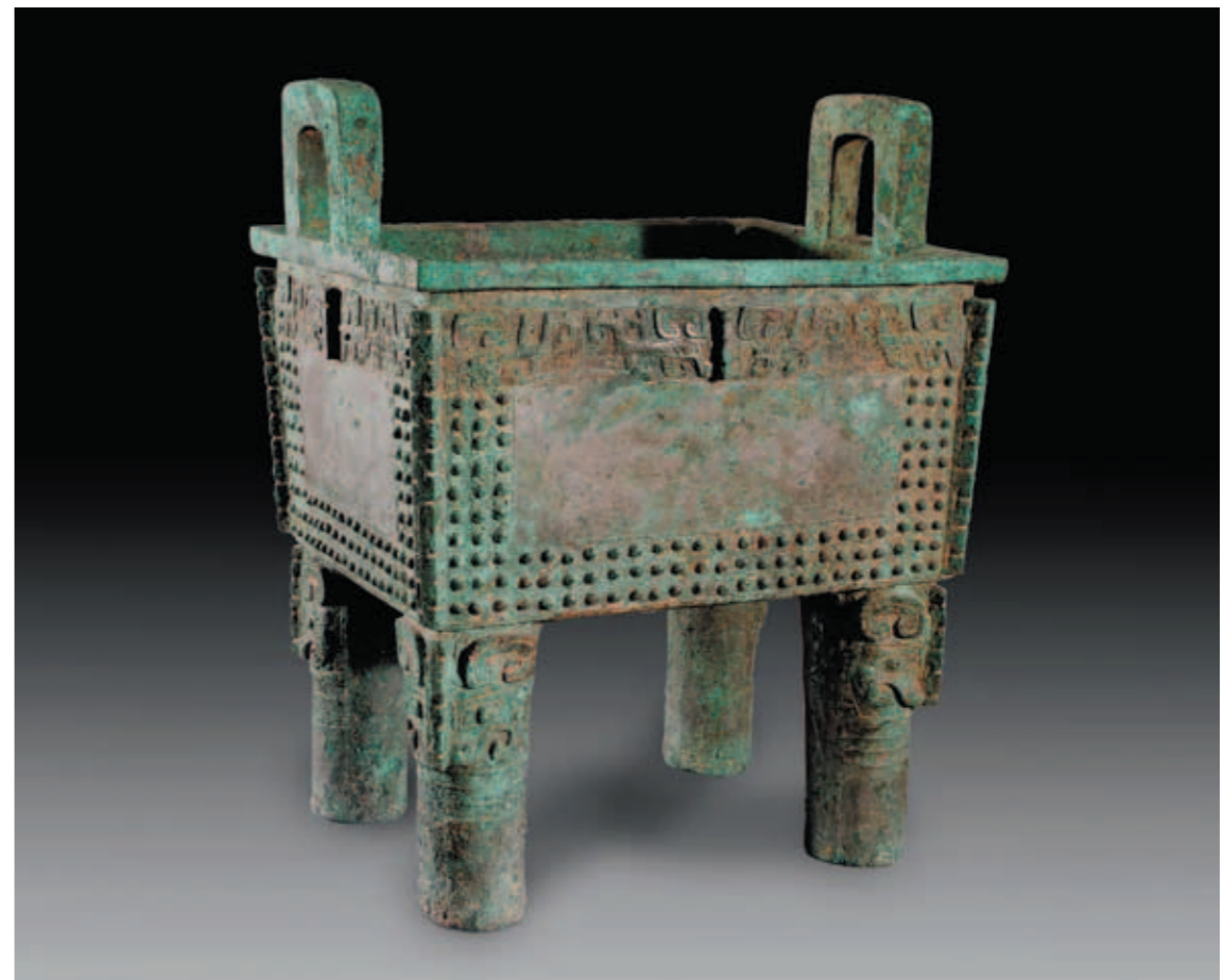
圖廿三 司母辛方鼎 高80公分，重128公斤 河南安陽殷墟婦好墓出土 中國社會科學院考古研究所藏