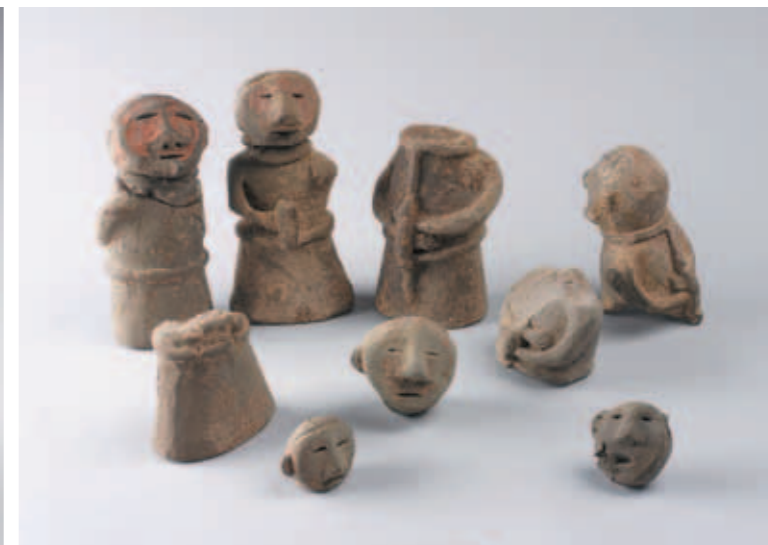
圖一七 陶俑 完整者高約15.4公分 河南安陽小屯358號灰坑、A14、A16號探溝出土 中央研究院歷史語言研究所藏