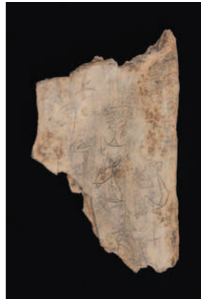
圖七 刻劃獸骨 《甲編》2336 長10公分，寬6.2公分 河南安陽小屯橫十三丙北支探坑出土 中央研究院歷史語言研究所藏

（圖四），這些器物除器類豐富外，多變的造型更突顯她獨特的身份、藝術品味及社會地位。婦好鴉尊便是其中最具有代表性的器物。（圖五）其整體造型乍看之下是一隻站立的鴉鳥，頭上攀附著一隻小鳥及一隻小夔龍。