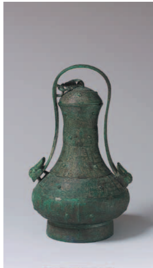
圖一四 三節提梁卣 通梁高28公分 河南安陽西北岡1022號墓出土 中央研究院歷史語言研究所藏