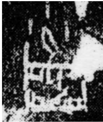
圖十 帶卜辭龜腹甲（《乙編》3661）上的「誥」字 河南安陽小屯127號灰坑出土