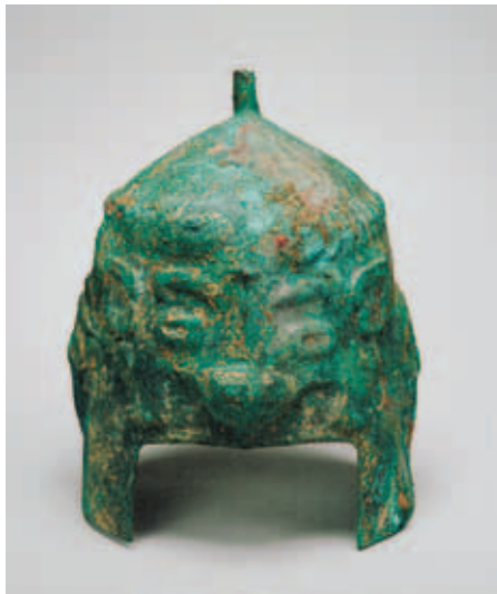
圖一六 頭盔 通管高26公分 河南安陽西北岡1400號大墓出土 中央研究院歷史語言研究所藏