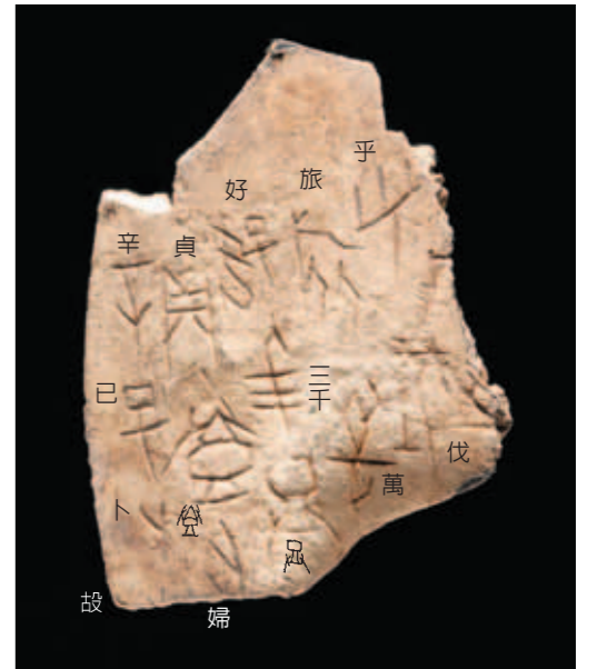
圖六 帶卜辭牛骨 長4.6公分，寬3.3公分 蘇格蘭國家博物館藏 (National Museum Scotland) 釋文：「辛巳卜，故貞：登婦好三千，旅萬乎（呼）伐。」

召方等地。蘇格蘭國家博物館所藏一片甲骨更有婦好一次率集一萬三千人出征的紀錄，是目前所知商代出兵規模最大的一次征戰。（圖六）