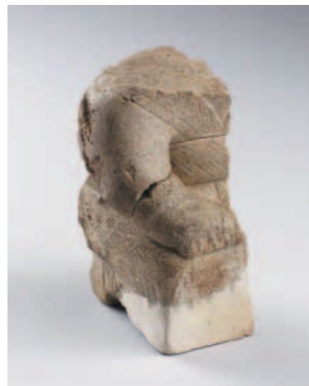
圖一八 跪坐石人俑 高12.7公分 河南安陽西北岡1004、1217號大墓出土 中央研究院歷史語言研究所藏

對內，除以宗教力量進行管理外，居住在都邑裡的人群，有著明確的身份差異。商代社會大體可以區分為貴族、平民（稱眾或人）與俘虜三個階層。此次展出的一組帶著枷鎖的陶俑，便具體呈現社會底層人犯的樣貌（圖一七），與身著華服安靜跪坐的貴族（圖一八）形成鮮明的對比。商王都以外，有許多族氏被王室