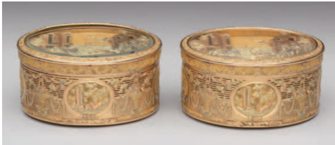
圖二 清 法國雕金機械自動音樂鼻煙盒（兩件） Joseph-Etienne Blerzy 製作 國立故宮博物院藏 舊名小八音盒。

院藏這件橢圓雙面掀蓋盒，一面有雙層掀蓋，為可上發條的音樂盒，第一層是透明玻璃掀蓋（圖八），掀開後第二層盒蓋蓋面（圖九），淺浮雕有如劇場舞臺般場景，兩側有古建築，前景為在湖邊野餐的男女，正逗弄著小狗，一旁有羊兒、狗兒趴著休