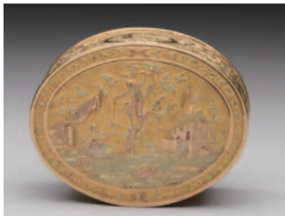
圖十二 底蓋上刻有嬉戲的男女，掀開即儲存鼻煙之空間。