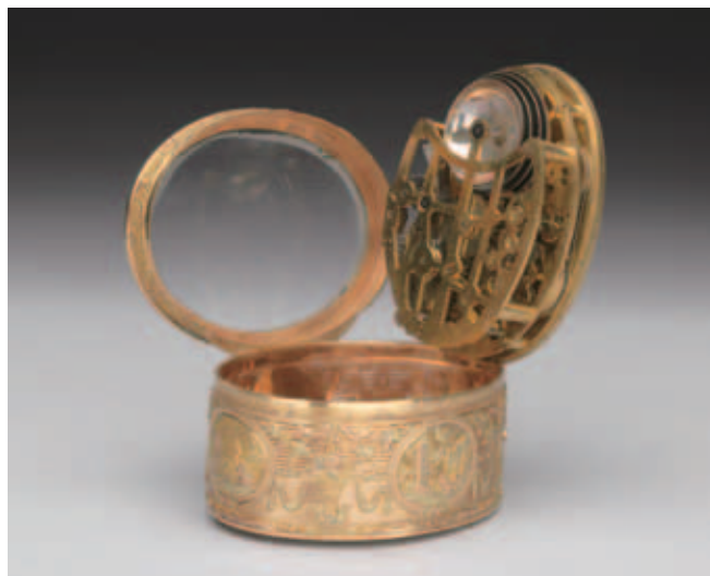
圖十 第二層蓋內連結天鵝的機械裝置與音樂機芯。