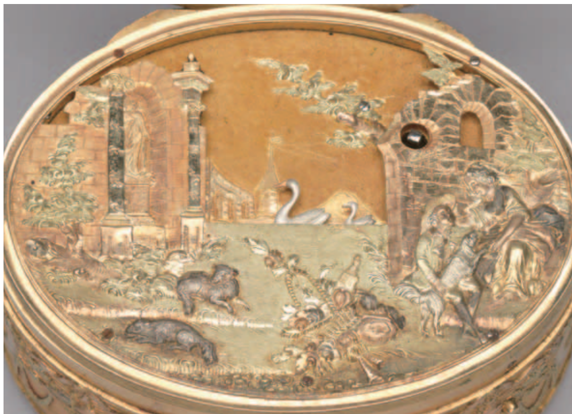
圖九 蓋面雕金風景，右上為發條孔。

息，遠景則淺刻屋宇天際；妥善運用金屬凹凸與顏色之差異，來表現立體空間與景深，刻工精緻細節考究，讓人宛如置身於悠閒地鄉間午後；古建築兩側則有溝槽，中間由鍊帶帶動之天鵝一前一後，旁有鎖孔，轉動發條後，看見湖上天鵝悠閒划過。第二層蓋內是連結天鵝的機械裝置與音樂機芯（圖十），盒側面有控制音樂之按鈕且盒壁鏤空，可讓音樂流洩，按下按鈕後會有音樂響起。（圖十一）另一面掀蓋上刻風景畫中有嬉戲的男女（圖十二），蓋內為儲存鼻煙之空間，這一部分的盒壁密實無鏤空。整體盒壁四面有開光，內雕風景畫，開光間雕飾花藍與花串。 這件法國雕金機械自動音樂鼻煙盒，運用珍貴的各色黃金，結合自動機械裝置與音樂盒，複合著多重功能且為名家製作，是十八世紀後半歐洲精緻鼻煙盒的代表，隨著鼻煙潮流遠渡來到清宮，儘管實用功能不再，卻轉化為皇帝的珍玩，收貯於多寶格中。於是，鼻煙盒不只是盒子，是珠寶配件，也是身分象徵，更是