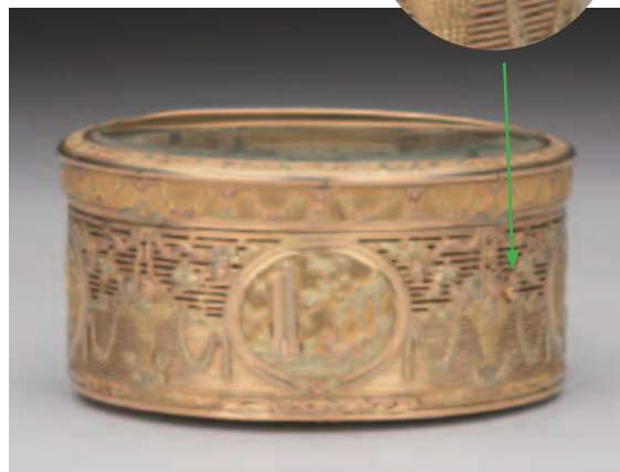
圖十一 盒側裝置音樂按鈕，盒壁上半段鏤空，可讓音樂流洩；下半段存放鼻煙空間，盒壁密合無鏤空。