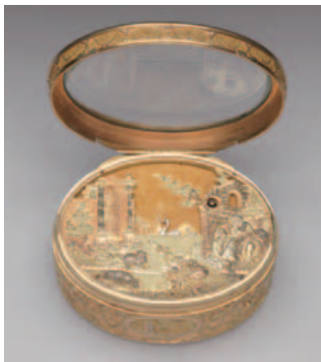
圖八 上層玻璃盒蓋掀起。