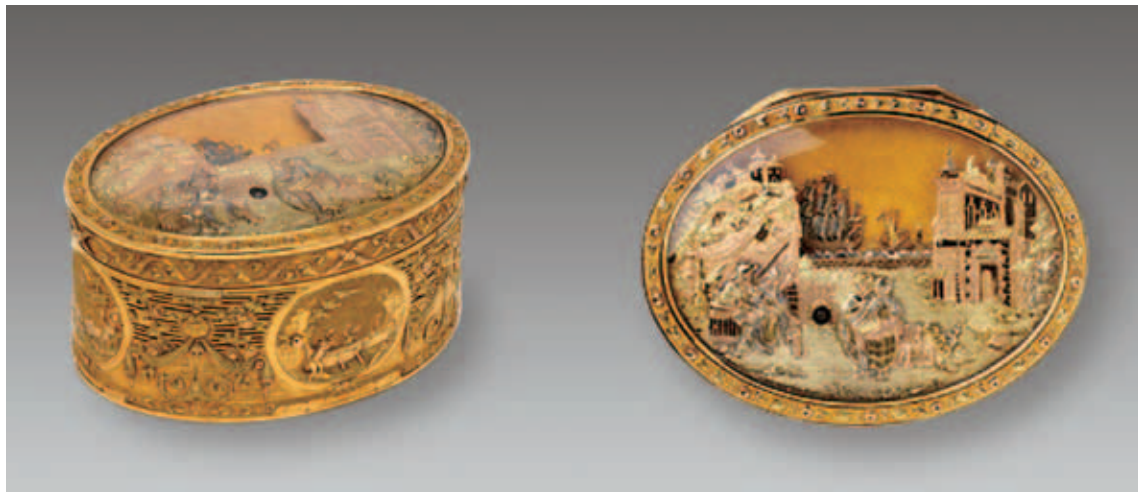
圖七 法國雕金機械自動音樂鼻煙盒 英國Victoria and Albert Museum藏