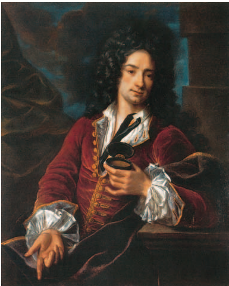
圖一 十七世紀末十八世紀初的紳士畫像