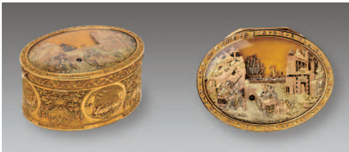
圖七 法國雕金機械自動音樂鼻煙盒 英國Victoria and Albert Museum藏