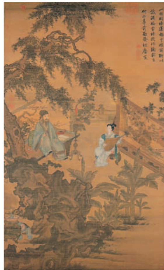
圖十二 明 唐寅〈陶穀贈詞〉 國立故宮博物院藏 畫中仕女畫法顯然承自杜堇的仕女形象

無論在北京，或是後來往來的南京、江蘇等地，都與當時著名的文人仕宦論交，而非被認為是個臨場負責繪像作紀錄的畫工；〈玩古圖〉的受畫者「東冕」推測應亦為文人仕宦之流。由畫作形式與效果，也可推測「東冕」的經濟實力頗為雄厚。因為〈玩古圖〉目前雖裱為立軸，但尺幅較大，原本可能安在如畫中文士身後雕飾華麗的屏風框座中。畫中描繪的低調而頗富細節的器用，也應代表「東冕」的好尚，或者直接反應了他家中器用的水準。杜堇沒有採用白描