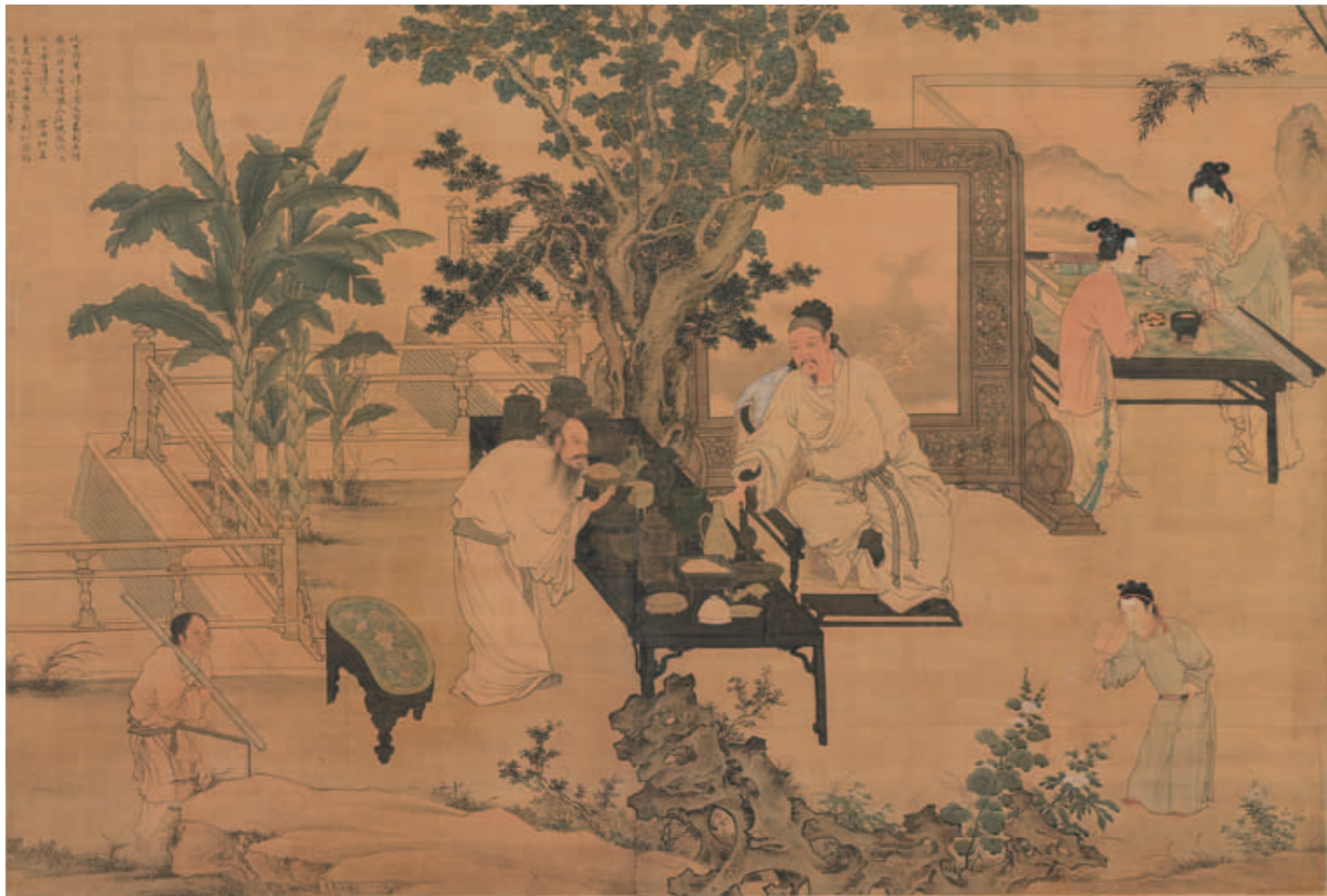
圖一 明 杜堇《玩古圖》國立故宮博物院藏

這類園苑場景的現存畫作，以國立故宮博物院典藏的北宋傳趙鼎《八達春遊》、宋徽宗《文會圖》、南宋《折檻圖》、《卻坐圖》、劉松年《羅漢》等最為有名。 隨著時間推移，這類畫作對於交代較大範圍的園苑場景興趣似乎較為消褪，畫家逐漸將取景的「鏡頭」朝人物推近。以劉松年《畫羅漢》（圖二）為例，雖然還可以看到園苑地表邊緣砌上的方正石磚，以及自屏風後透出來的翠綠蕉葉，但幾乎佔滿整個畫面的是人物及屏風。杜堇《玩古圖》亦傾向如《畫羅漢》將場景中人物比例放大處理，此外，在表現布料、器用裝飾性細節的興趣，亦有類於《畫羅漢》。 《畫羅漢》對衣料的描繪不遺餘力，在垂落的衣擺部分（圖三），更以數道裝飾帶描繪著寶珠、雙雁、卷雲等各種圖案。至於畫中器用的部分，即使是不起眼屏風的木紋，亦不厭其煩地一縷縷刻畫。羅漢所坐的藤椅，更呈現豐富精巧的編製圖案。反觀杜堇《玩古圖》，畫中華麗布料