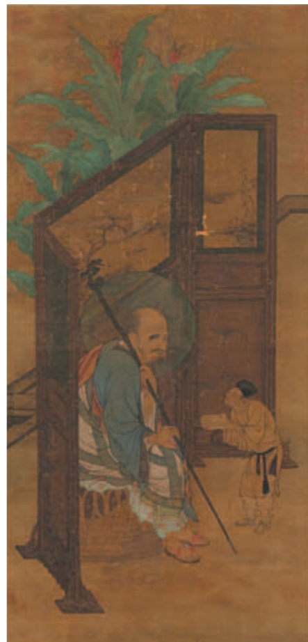
圖二 宋 劉松年《畫羅漢》國立故宮博物院藏

八種花卉枝葉組成的繽紛圖樣。主人身後的雲水屏風，雖不似前述〈畫羅漢〉的屏風畫出木紋，卻細心表現著屏框部分鏤雕的寶相花紋。（圖六）透過右方雕花鏤空的部分，還能窺見後方漆桌及其上鋪放的玉石紋路。 而就五官的處理上，對比起主人沈穩的表情（圖七），〈玩古圖〉最令人印象深刻的是正掀開蓋子的文士臉孔（圖八），他微蹙著眉，像是一面專注地品鑑這些器物，一面尋思它們的來歷；揚起的臉頰與嘴角，以及開張得露出舌頭的雙唇，宛若正見獵心喜地吟哦讚歎。為了表現這些