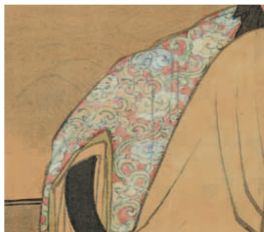
圖四 《玩古圖》椅狀局部