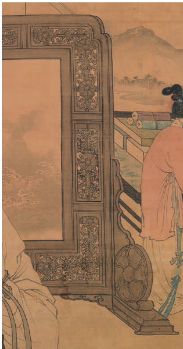
圖六 《玩古圖》屏風鏤雕花紋局部，亦可透過鏤空處，看到後方黑色漆案及玉石紋路