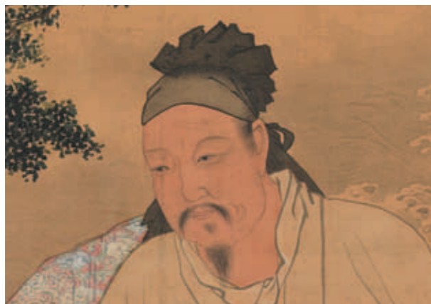
圖七 《玩古圖》主人面容局部