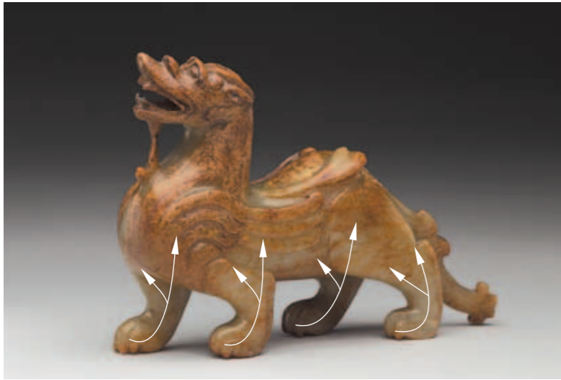
圖五 玉辟邪相壯四足所形成的穩定感以及視覺方向