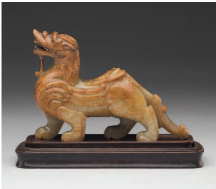
圖一 漢代 玉辟邪 國立故宮博物院藏