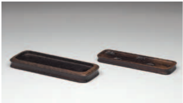
圖七 將上下套疊的木座拆離後的樣貌