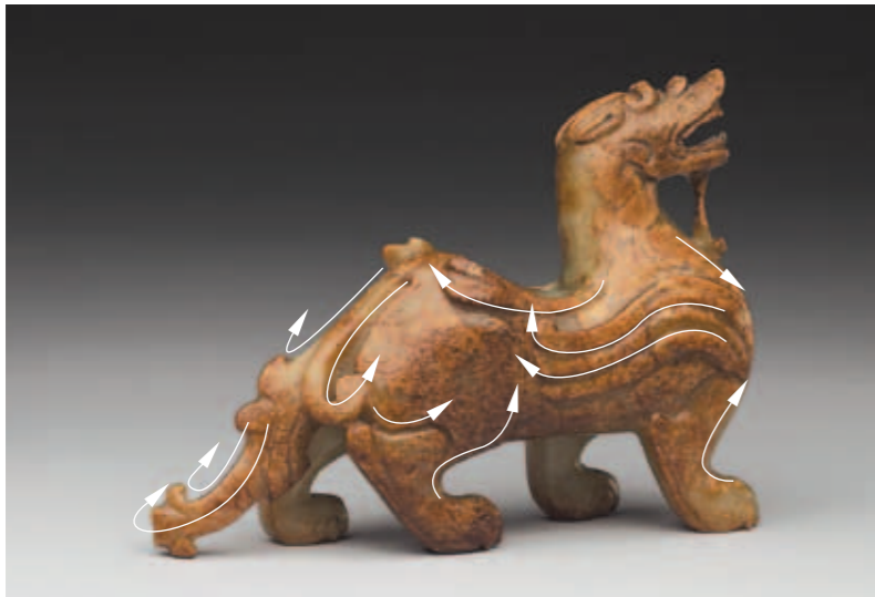
圖六 玉辟邪身尾各部曲線所形成的視覺方向和動態感受

部、厚實的腰腹、粗壯的頸項以及圓闊的胸膛雖然不符合自然界走獸真實的比例，但在特殊的觀看角度下，卻會組合出氣勢萬鈞的威儀。例如視點自正側面向辟邪的左前方微微移動（圖五），神獸各部比例將取得和諧，全身重量被四隻厚實的腳爪撐起，雄立顧盼的辟邪自然躍然而出。而若將觀看的角度移至辟邪的右後方