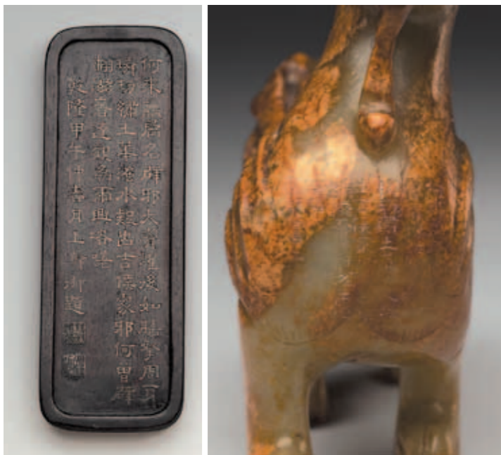
圖二-2 玉辟邪木底座部題詞，內容和圖二-1相同。