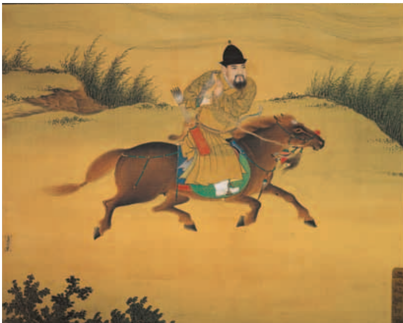
圖三 明宣宗馬上像 國立故宮博物院藏

妙運用墨色濃淡乾溼營造皮毛質感，並以留白區隔猿猴四肢與軀體的不同量塊。畫家的不凡技藝還展現在猿猴手指結構姿態的自然柔軟，以及內蘊於攀緣動作的靈活矯健上，此外，襯景的荊棘、竹叢、蘆葦、水紋也相當自然流利。（圖四）