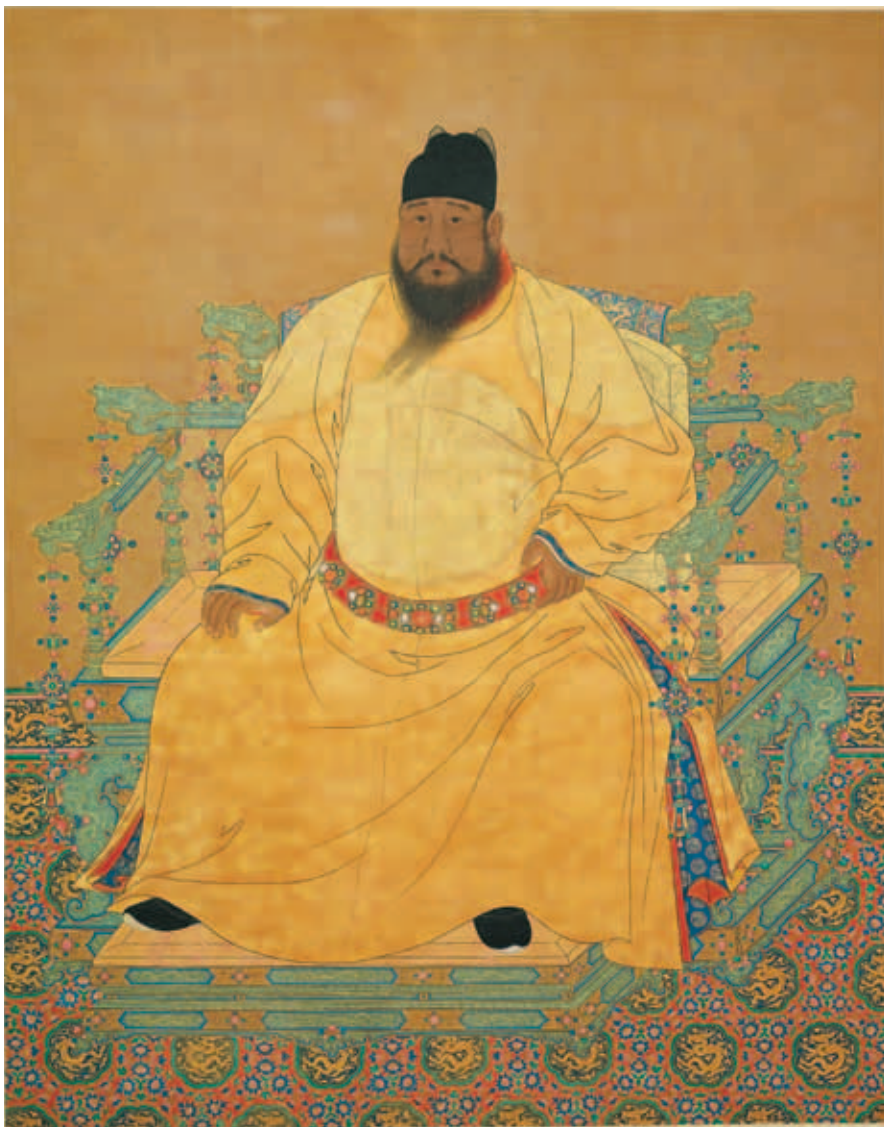
圖一 明宣宗坐像 軸 國立故宮博物院藏

明宣宗肖像 中國歷史上有名的藝術家皇帝，除了《水滸傳》中建立宣和畫院的浪子皇帝宋徽宗（一一〇一—一一二五在位）以外，就屬明宣宗朱瞻基的藝術評價最高；而治國有術的明宣宗在政治上的成就，還遠遠超過招致北宋覆亡靖康國難的宋徽宗。歷代宮廷均有詔命畫家圖寫「御容」的慣例，因此本院藏有為數不少的古代帝王肖像畫。本次選展的畫家肖像，除了《明宣宗坐像軸》（圖一）、《宣宗章皇帝與孝恭章皇后半身像》（圖二）等兩件全身、半身正面寫真性質的宣宗御容，還有具生活紀念意味的《明宣宗馬上像》（圖三）。《明宣宗坐像》是一巨幅立軸全身肖像，全作畫風寫實，主角