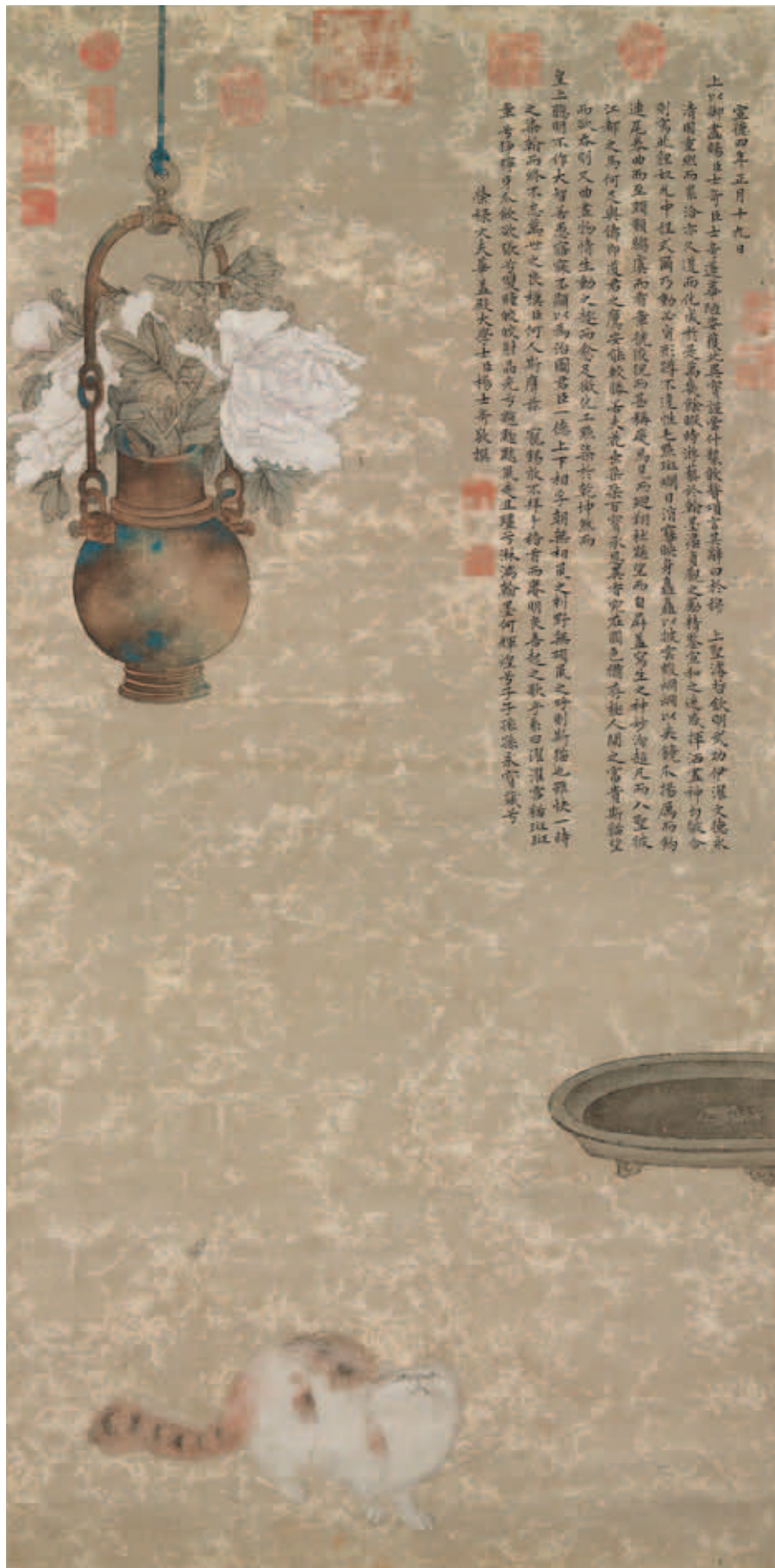
圖五 明宣宗畫中富貴圖 軸 國立故宮博物院藏

六—一七九五在位)拿來作為臨仿古畫的範本，本次展出的〈清高宗御筆開泰說並仿明宣宗開泰圖〉(圖七)就是乾隆老爺按照明宣宗畫作，參照供奉內廷的義大利畫家郎世寧(一六八八—一七六六)〈開泰圖〉