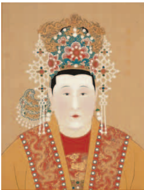
圖二 明宣宗章皇帝與孝恭章皇后半身像 國立故宮博物院藏

妙運用墨色濃淡乾溼營造皮毛質感，並以留白區隔猿猴四肢與軀體的不同量塊。畫家的不凡技藝還展現在猿猴手指結構姿態的自然柔軟，以及內蘊於攀緣動作的靈活矯健上，此外，襯景的荊棘、竹叢、蘆葦、水紋也相當自然流利。（圖四）