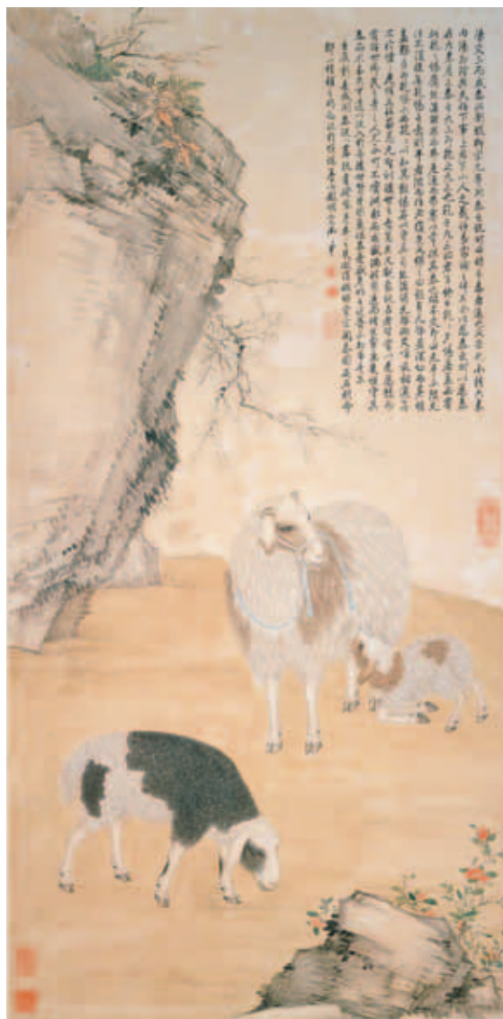
圖八 清高宗御筆開泰說並仿明宣宗開泰圖 軸 國立故宮博物院藏

本院所藏，對幅為清仁宗（一七六〇～一八二〇）嘉慶戊辰（一八〇八）楷書御題，上有作於宣德三年（一四二八），賜臣邢寬（？～一四五四）之款的傳〈明宣宗夏果寫生冊頁〉（圖十），構圖題材與北京故宮所藏〈明宣宗三鼠圖卷〉第三幅（圖十一）完全一樣，主角是一隻紅眼大白鼠正大快朵頤的啃食帶葉楊梅，兩畫外觀上最大的差異，是台北故宮的〈明宣宗夏果寫生〉白底方幅，北京故宮的黑底而圓幅。其次不同在台北故宮〈明宣宗夏果寫生〉的題簽下方，與最小那片楊梅葉子旁