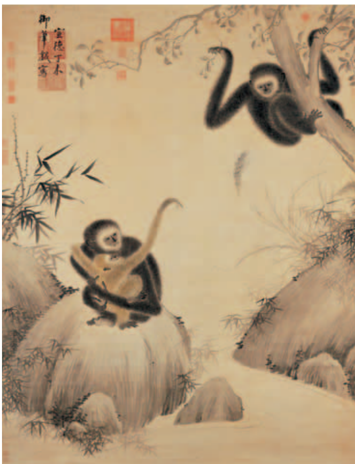
圖四 明宣宗戲猿圖 軸 國立故宮博物院藏

史冊記載宣宗重視弓馬，精於騎射。〈明宣宗馬上像〉的畫幅左方浮貼一行書小籤，上書「宣宗行樂」四字。描繪宣宗騎馬出獵，臂上架鷹，奔馳於河邊，驚起雁群的情景。圖中宣宗面容飽滿，鬚眉濃密，穿著薄底白靴與胸、肩、膝蓋處織繡紋飾的交