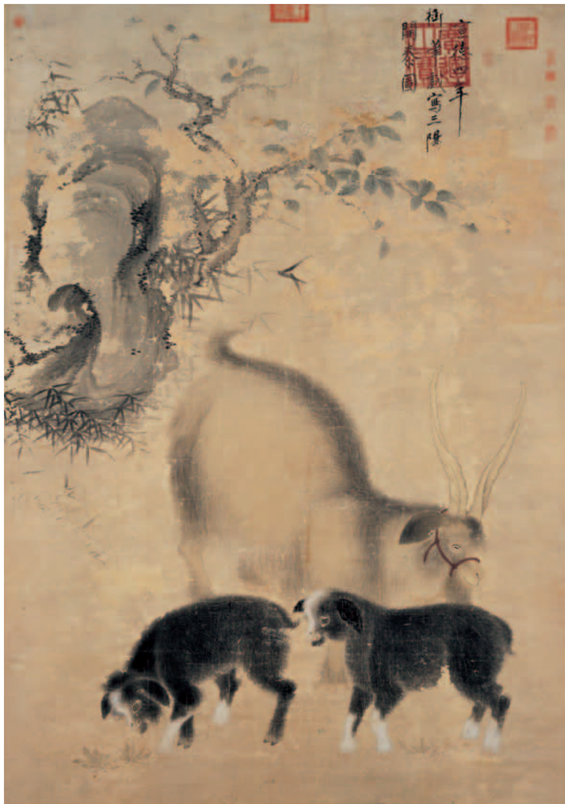
圖六 明宣宗畫三陽開泰圖 軸 國立故宮博物院藏

「地天泰」，卦象乾下坤上，以寓天地上下交通同泰。一年十二個月中以泰卦居於正月，取其冬去春來，陰消陽長的吉亨之象。筆觸恰到好處的展現了羊毛的質感，十分寫實生動，襯景竹石則如文人畫般注重線條和墨韻