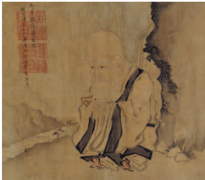
圖十三 明宣宗畫壽星 卷 本幅橫29.3公分 橫35.6公分 絹本設色 北京故宮博物院藏

能力與造形創意似乎略遜，並且對於人物面部表情與神態情緒的掌控，顯得比較欠缺表現力。並且和明宣宗其他畫作相差甚遠，應為他人託名之作。 儘管現存在明宣宗名下的作品偽作很多，但明宣宗無疑是一位富有個人特色的帝王畫家，本次特展將宣宗的代表作標準品與他人託名之作同展，希望有助於今人更進一步的認識宣宗畫作。