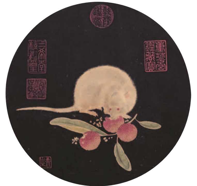
圖十一 明宣宗三鼠圖卷 第三幅 明朱瞻基荔枝鼠圖 卷 北京故宮博物院藏 圖見《中國美術全集·繪畫編6·明代繪畫上》圖七七之二

構圖安排均不相同。院藏本的壽星腦後有一小髻，面向觀者右邊，雙手攏在袖中，從腿腳動作似在行進；北京本壽星則頭上似乎毫毛不生，面左靜立，雙手握於胸前。構圖方面，院藏本背景空白，北京本的壽星身後還石壁、瀑布和溪流、短草。從用筆、畫技、字跡、印章，和書先印後的疊壓模式等方面推斷，兩畫並非出自一人之手，其中台北本壽星圖的畫家控筆