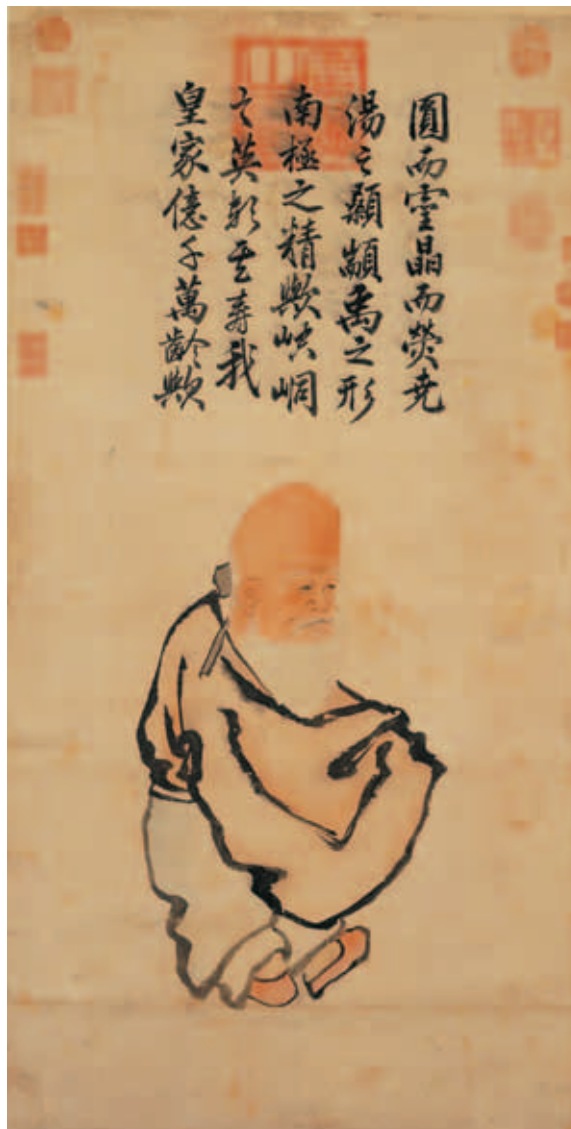
圖十二 明宣宗畫壽星 軸 國立故宮博物院藏