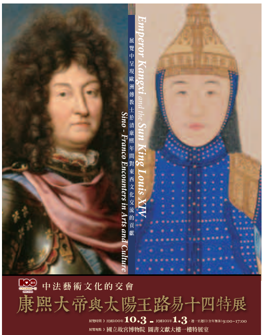
康熙大帝與太陽王路易十四特展海報

主題的感受及期待，進而對展示預期目標做一整體檢測，確保正式展示時達到一定之展示與學習效果。國立故宮博物院在二〇〇九年規劃「文藝紹興——南宋藝術與文化特展」時，首次進行展示前置評量，邀請藝術、歷史等相關科系學生於展示