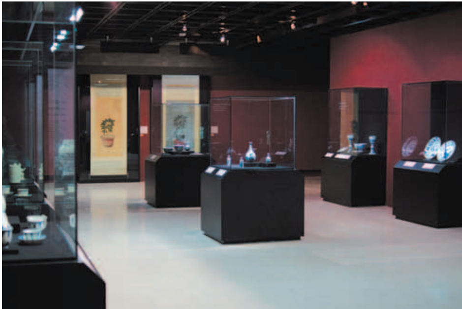
「交會的燦爛火花」物件展示

發學習的興趣。也有部份受訪者可以直接說出兩位君王為同一時期東西方盛世代表。對於兩者之間交流情形及交流媒介為何，少數歷史相關背景學生可提及傳教士為兩位君王交流之