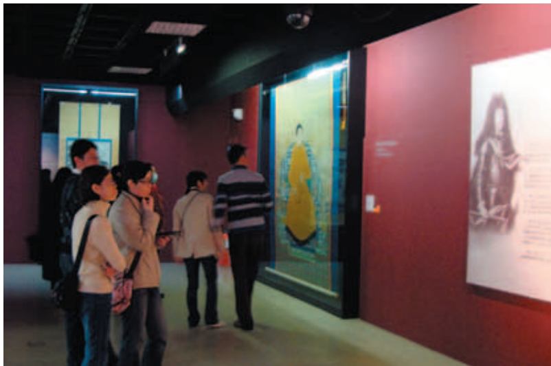
康熙大帝與皇室家族展廳