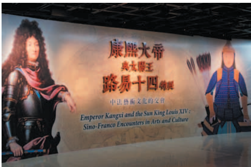
展廳主視覺牆

博物館被視為開放學習的重要實踐場域，如何滿足各種不同屬性觀眾的學習需求，一直是博物館從業人員的重大挑戰。有鑑於此，在焦點團體訪談規劃時，為瞭解不同屬性的觀眾對於康熙大帝與路易十四的概念及認識以及對展示內容的期待，選取對象除了邀請藝術史與歷史相關背景的學生，另針對一般觀眾進行座談，受訪者包含博物館學、歷史、藝術史背景