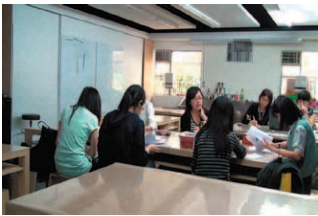
博物館系所學生參與座談