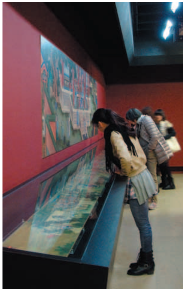
交會的燦爛火花—創新製作展廳

發學習的興趣。也有部份受訪者可以直接說出兩位君王為同一時期東西方盛世代表。對於兩者之間交流情形及交流媒介為何，少數歷史相關背景學生可提及傳教士為兩位君王交流之