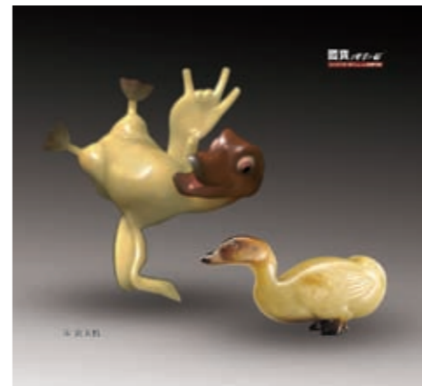
圖四 國寶總動員主角—宋至元玉鴨

所需，需有專屬的暗房遮蔽外來的光線，以達最佳的展示效果。（圖七） 本裝置首先展示毛公鼎的正面圖，觀眾可欣賞其造型之美，具三個壯碩的獸足，鼎腹接近口緣處有重環紋，造型厚重樸實，是青銅器中的佳作。接著展示文物的俯視圖，及青銅器上的銘文拓印，這也是在展場中較難得見到的視角，藉著文物的數位化之便，我們可以更清楚地欣賞銘文。 因多數人對於銘文並不熟悉，互動裝置接續會出現黃色放大解析框，將青銅器上的銘文隸定為現今使用的文字，其展示手法宛如現今的翻譯機，透過黃色的圓框，可快速轉譯為日常使用的漢字（圖八）。結束古今文字對照後，進入互動畫面，螢幕上反黃的文字，共計二十三字可由民眾自行點選。點選完成後，自動播放漢字演變的歷程，舉例而言，「立」字的原型是描繪人的正面，兩隻腳跨於地平線上的立姿（圖九），再逐漸演變而成今日所使用的漢字。本裝置不僅是在螢幕展示漢字演變歷程，整個環境空間亦呈現立體的動畫投影，以滿足觀眾視覺的多重體驗。（圖十）