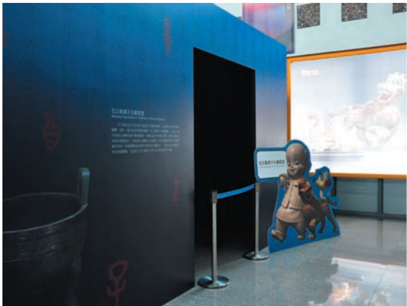
圖六 毛公鼎互動裝置入口處