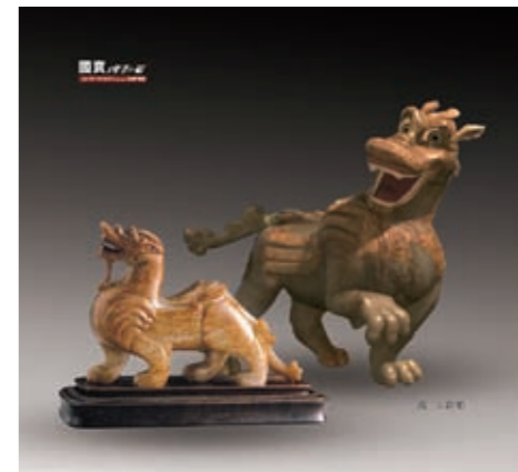
圖三 國寶總動員主角—漢玉辟邪

皇帝寶愛的器物，其胸前刻有御製詩，在宮中亦配有雙層紫檀木座，上層刻有「乾隆御玩」，下層刻有與玉辟邪胸前相同的御製詩。辟邪，造型