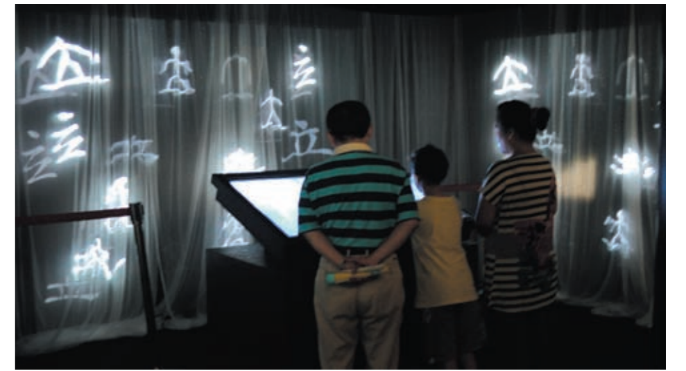
圖十 整個環境氛圍皆展示漢字演變歷程

區也設置了兩處漢字趣味體驗區，使民眾從遊戲中獲得知識。第一區為漢字轉軸區（圖十一），選取的文字仍是從毛公鼎的銘文延伸而來，主要以「人」字作為主題。透過轉軸區的互動，可驗證在毛公鼎裝置互動後所獲得的知識，也鑑賞不同文字的造型美感。在漢字轉軸區旁，也播放本院三