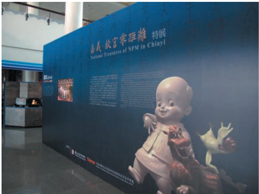
圖一 國寶總動員主視覺