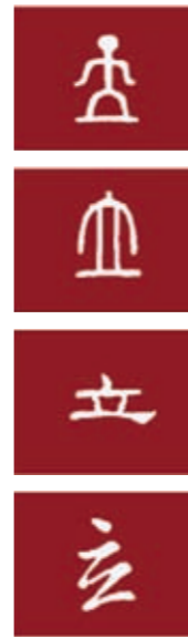
圖九 「立」字的演變過程（黃瓊儀整理）

觸摸是人類的天性，人類的好奇心透過觸摸獲得滿足，也經由觸摸加深學習印象。除數位的體驗區外，此