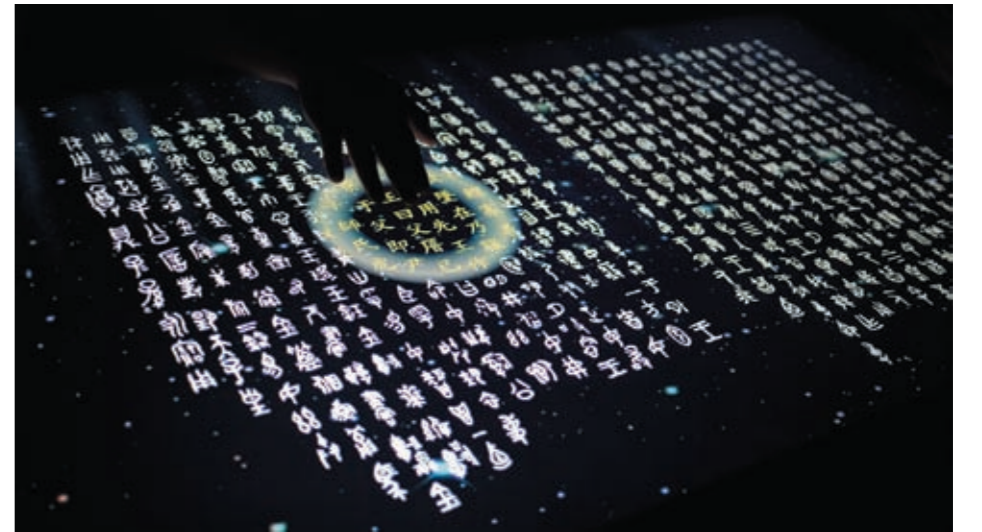
圖八 透過移動黃色圓框可將銘文隸定為現今使用的漢字