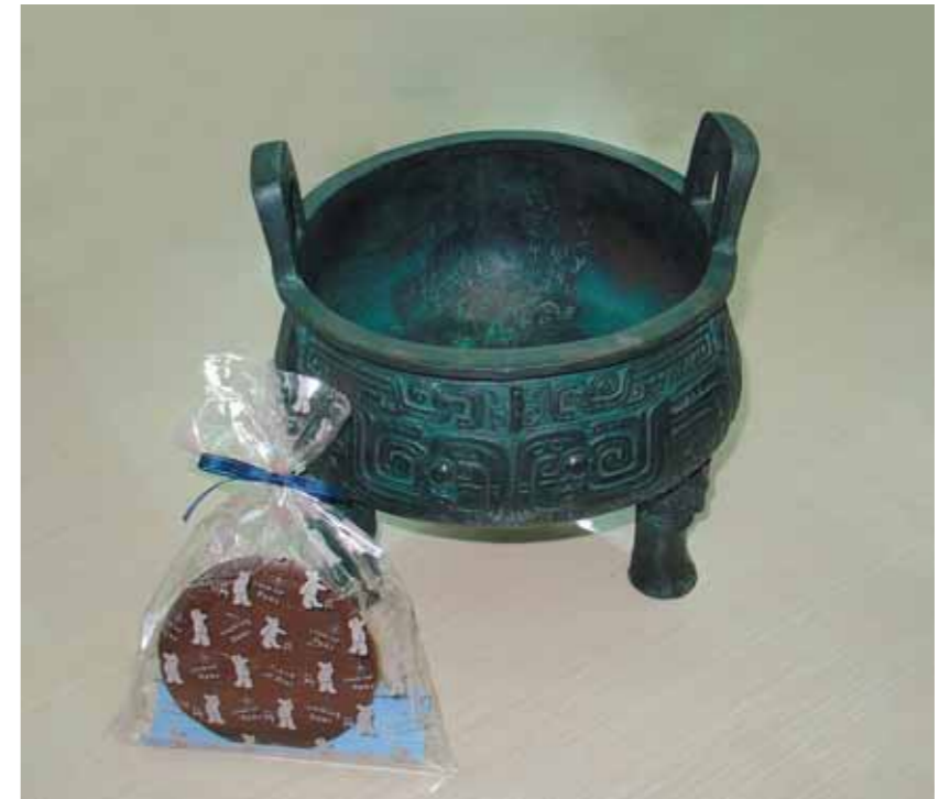
圖十七 漢字巧克力DIY

家長能親身體會青銅器的鑄字歷程，並且認識青銅工藝的工序及製作方法(圖十七)。此活動不僅滿足觀眾手感體驗的需求，亦是一種結合嗅覺、觸覺、味覺的多重感官體驗。後續則是由學員自行拓印本院典藏的重要法帖，或是青銅器上的銘文，藉此了解