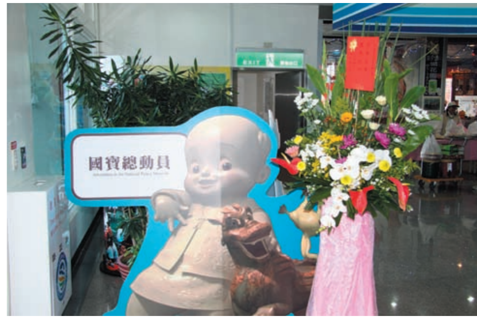
圖五 展場中人型立牌

似虎又似馬，昂首張口，尾巴貼地，身有雙翼，非現實中的動物，是想像中的神話動物，取其意乃是避除邪惡之意，其造型可能是源自西亞。常以