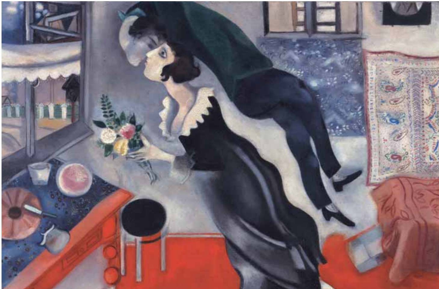
生日 / 1923年 / 油畫 / 日本 Marc Chagall, L'anniversaire(detail), 1923, Huile sur toile, 81x100.3cm, Japon © Marc Chagall / ADAGP, Paris - SACK, Seoul, 2011 Chagall (R)