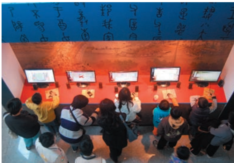
圖十六 兒童使用多媒體光碟區

長或祖父母帶領參觀，在展覽未開幕前已經有許多小朋友興趣盎然地在多媒體區的電腦前探索文物的世界（圖十六）。令人意外的是最受歡迎的竟是「皇城聚珍—殿本圖書欣賞」殿本遊戲，許多年齡層較低的小朋友對於猜部首的闖關小遊戲著迷不已，父母