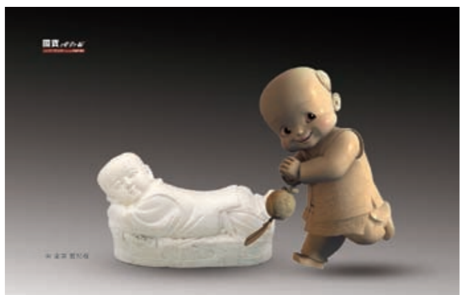
圖二 國寶總動員主角—宋定窯嬰兒枕