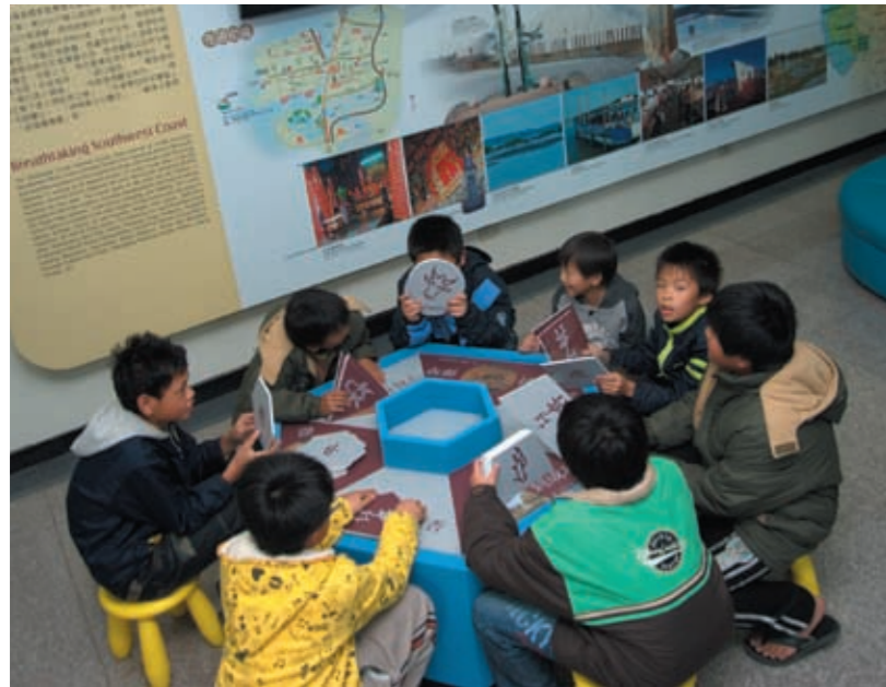
圖十二 漢字成語動物園