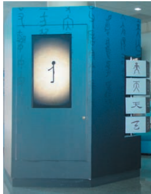
圖十一 漢字轉軸區