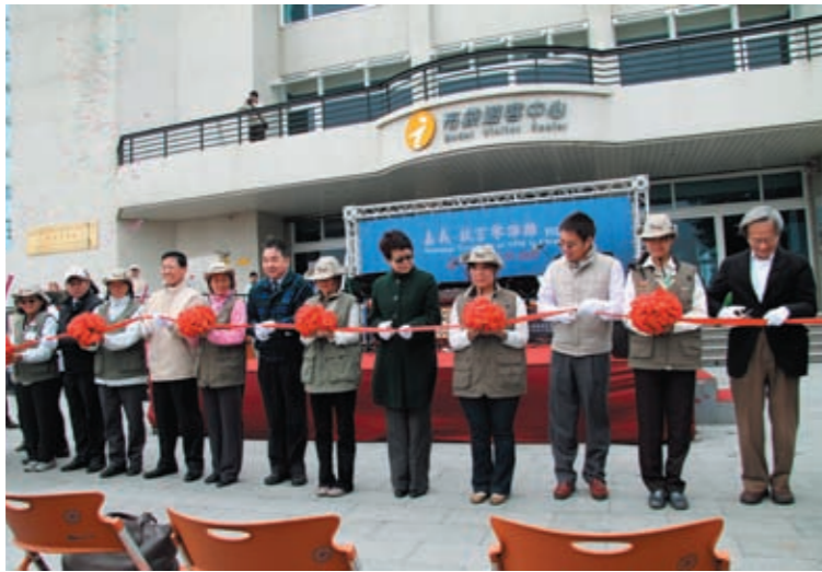
圖十五 「嘉義·故宮零距離特展」開幕剪綵