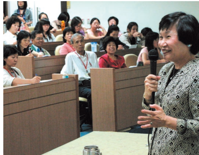
圖一 第一期志工培訓開訓典禮 周功鑫院長致詞