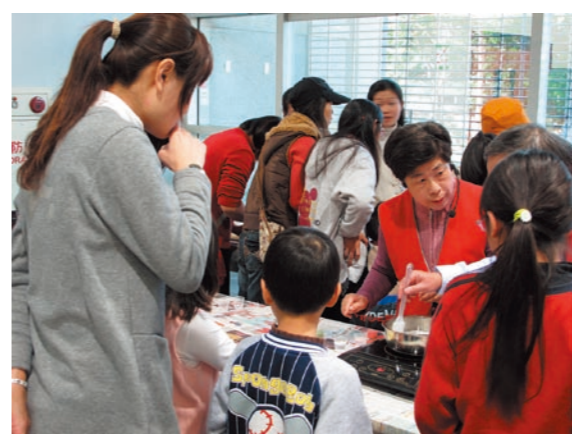
圖五 故宮南院志工協助「佛陀的故事——亞洲佛像之美特展」親子活動

可培養志工們對於造形、風格特色的觀察，更能親身貼近文物，以瞭解宗教造像工藝的鬼斧神工。另一方面，