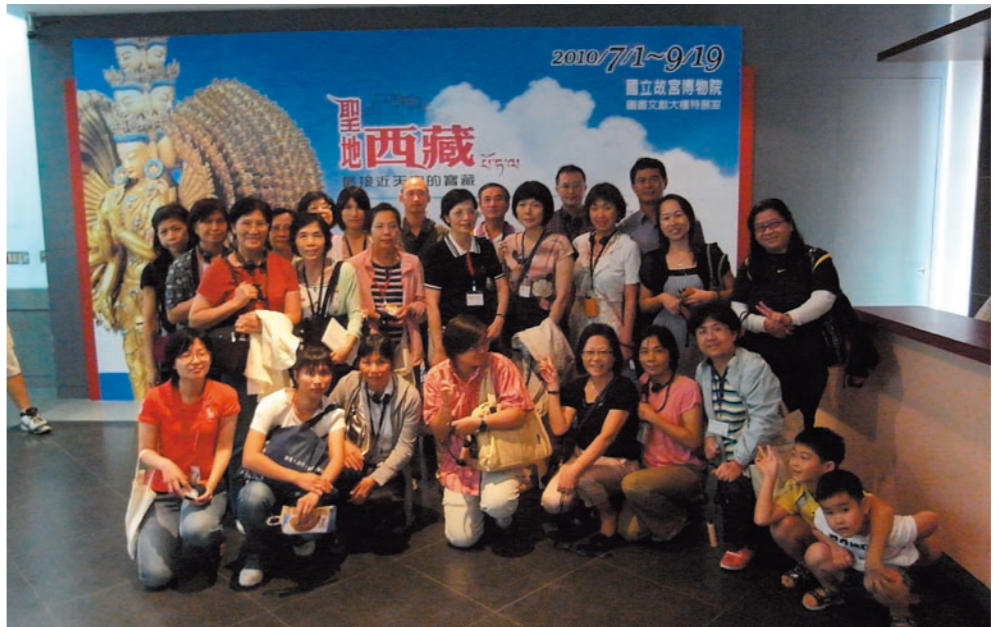
圖三 故宮南院志工北上參觀「最接近天空的寶藏——聖地西藏特展」

此外，由於亞洲歷史及地理在台灣的小學教育甚至是高等教育甚少被提及，一般民眾往往甚為陌生，因此課