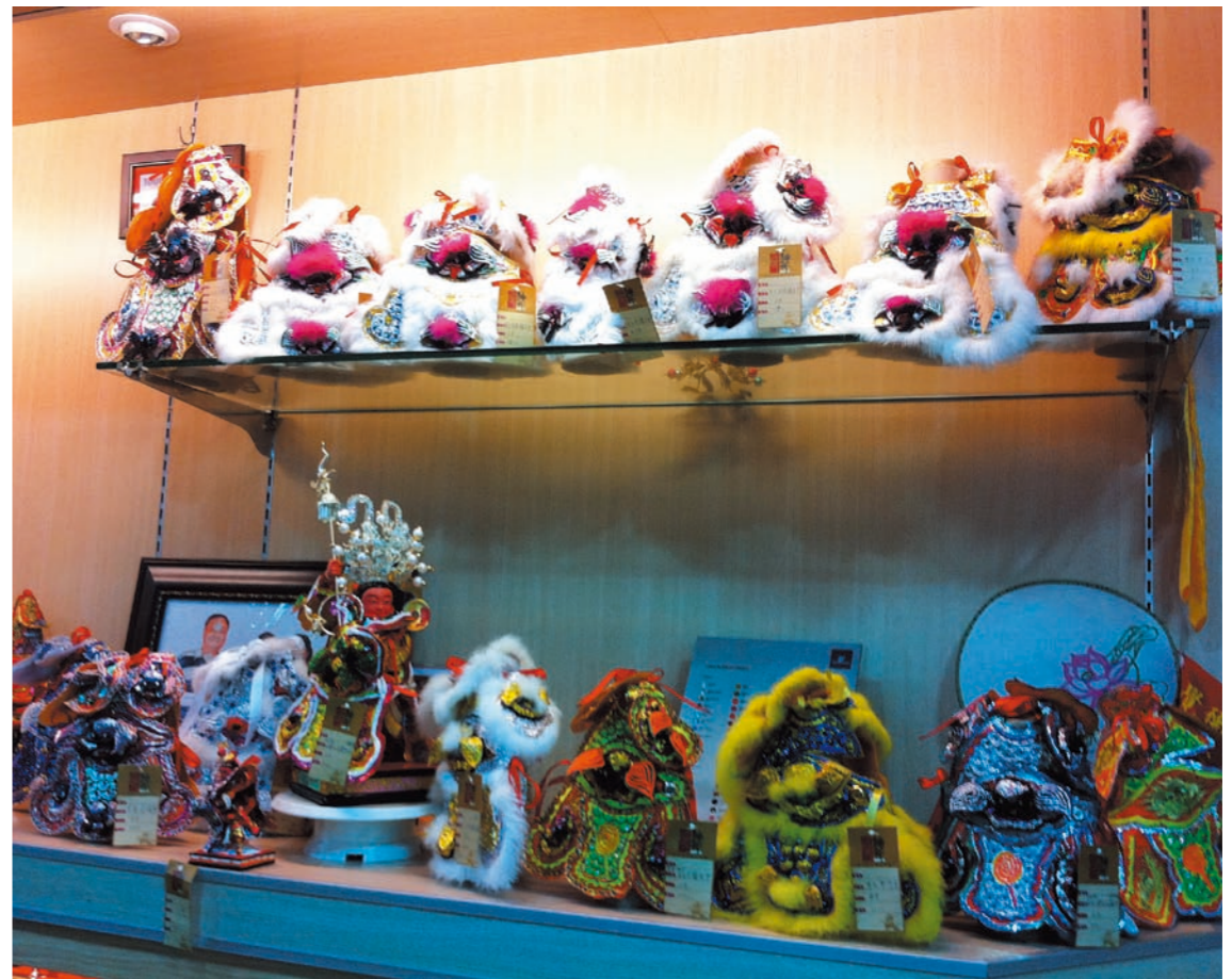
圖八 神明刺繡聖衣製作工廠一隅

品項則是神明的聖衣(圖八)、八仙彩等宗教禮俗用品。由於現今婚嫁用品國人品味已朝向西化，再加上不敵中國的低價競爭，該項產品已退出市場，如今只剩生產宗教禮俗的相關產品，近期在高雄世界運動會讓世界看見台灣生命力而著名的電音三太子服飾(圖九)則是由此地生產。