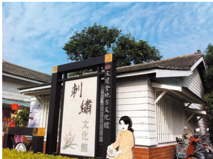
圖七 朴子刺繡文化館

關課程，尚有許多志工仍深感不足，因此希望能提供更多參考資料供其進修研讀。經由實際的導覽，並與民眾互動，一方面可增進其導覽解說技巧的實務訓練，另一方面透過民眾提出的各類問題中，志工可藉此省視自身對文物的了解程度，並進而更深入的學習以補充不足的文物知識。