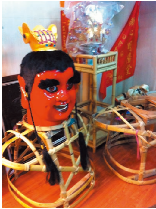
圖九 電音三太子模型

因為參與其中的工作者不單是為了生計，更是為了一種理想而來」(Peter F. Drucker, 1990, 引自劉佳琦, 2005)。因此志工對於組織的要求通常較具理想性，再以志工背景組成相當多元，志工管理越顯困難。所以博物館須將志工視為工作團隊的成員，而非可任意支配的勞力，應多傾聽志工的需求，務必使其能發揮所長，並適時的透過激勵的方式給予志工成就感，如此才能促進博物館與志工團體達成雙贏的局面。