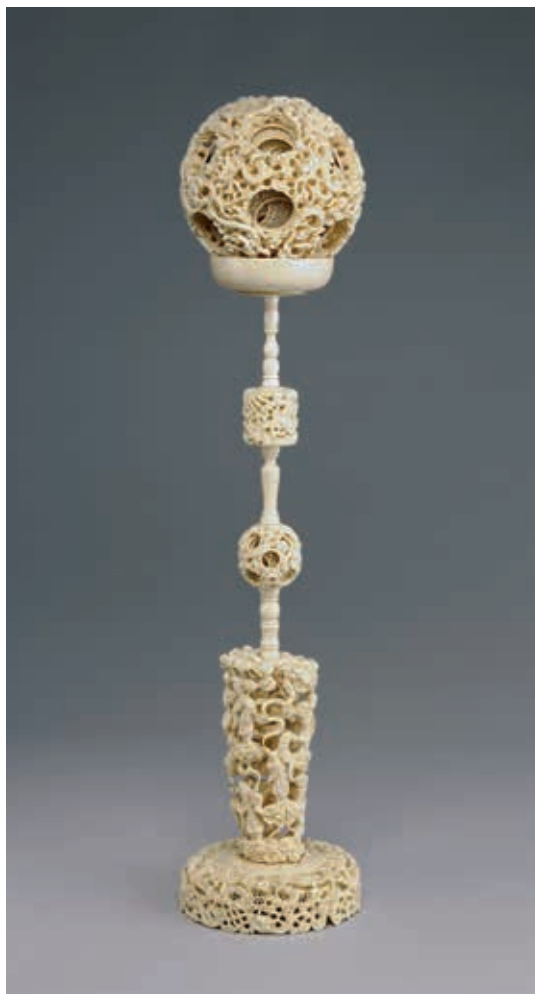
圖 16 清 19 世紀 廣東 鑲雕象牙雲龍紋套球 國立故宮博物院藏 中日雕 000005