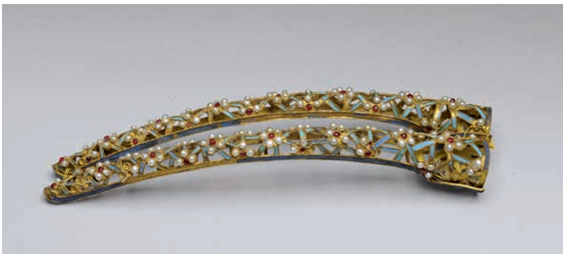
圖 12 清 鏤空點翠鑲珠冰梅紋指甲套 國立故宮博物院藏 故雜 003606

人們愛美的天性古今皆同，竭盡所能地在身體上裝飾，讓自己更美麗耀眼。裝假睫毛、畫眼線、戴放大片讓眼睛更大更有神，那麼使用水晶指甲、戴指甲套則讓手更纖細修長，讓自己的整體形象更為加分，誠如所謂的「手如柔荑」。古代女子留長指甲表現身份地位，清代后妃除了注重指甲的長短，更在護甲的指甲套上爭奇鬥艷，彰顯在皇帝心中的榮寵份量。