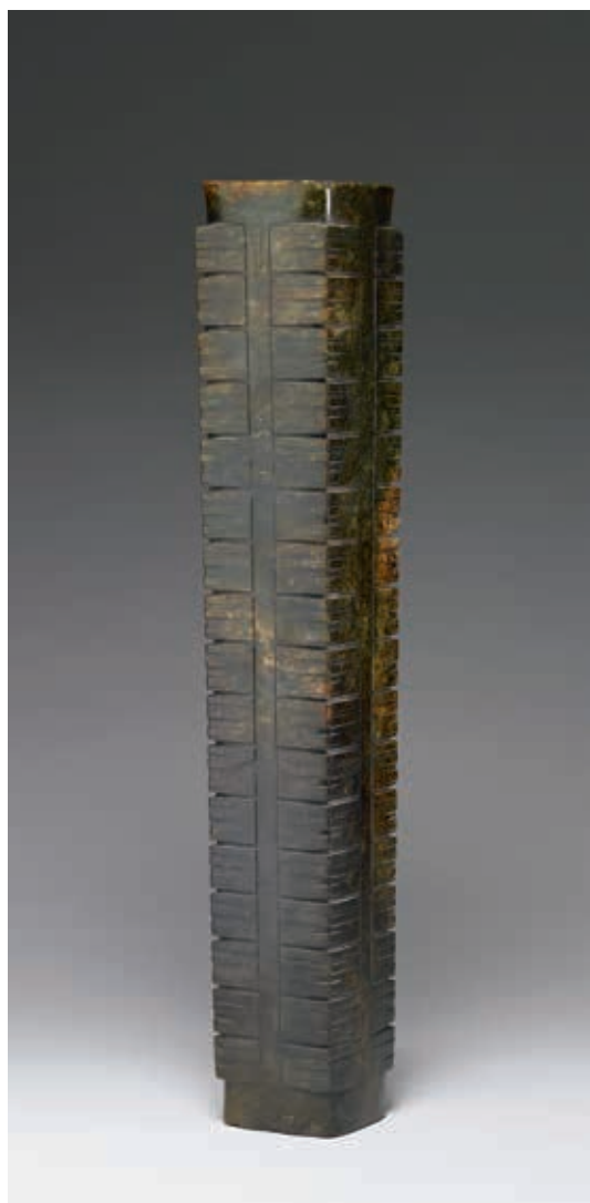
圖8 良渚文化晚期 玉琮 國立故宮博物院藏 故玉 002037

天圓地方是古代中國人的宇宙觀，當時的人使用圓圓的玉璧來祭天，而用方方的玉琮來禮地。這件玉琮外方內圓，外壁共有十七節，除了每節有四個「面紋」外，中間的孔道可能是與上天溝通的通道。指著文物問觀眾會想到什麼時，約有九成以上的人都會不約而同地說「101大樓」，可見101大樓高聳的形象深植人