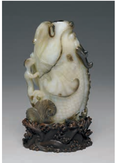
圖4 明 玉鯉魚花插 國立故宮博物院藏 故玉 002171