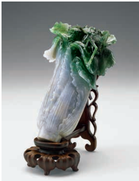
圖 14 清 翠玉白菜 國立故宮博物院藏 故玉 002103