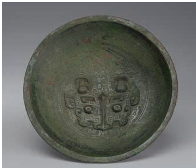
圖 18 商後期 蟠龍紋盤 國立故宮博物院藏 中銅 001513