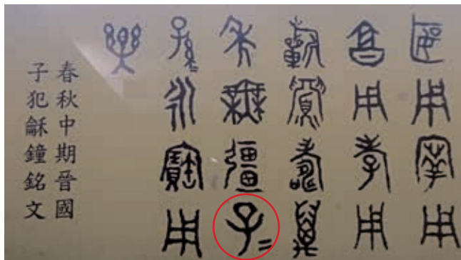
圖 20 春秋中期 子犯蘇鐘銘文 局部 作者攝於故宮青銅器展間