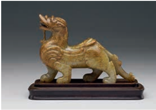
圖 5 西漢晚期至東漢 玉辟邪 國立故宮博物院藏 故玉 002789

相信國人到日本參拜神社、佛寺時，多會購買「御守り」，也就是護身符。辟邪也有「辟邪」之意，雖然形式不同，但是趨吉避凶之意都是一樣的。