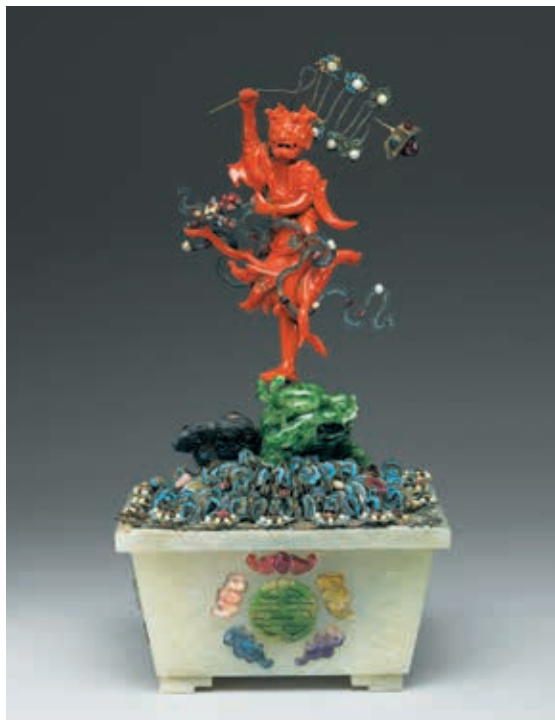
圖 13 清 珊瑚魁星點斗盆景 國立故宮博物院藏 故雜 001375

此件作品原本陳設於永和宮中，清末光緒皇帝（1875-1908 在位）的瑾妃（1873-1927）曾在此居住，因此便推測，此白菜可能為瑾妃的