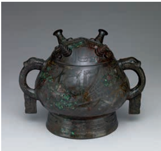
圖 9 西周早期 雙龍紋簋 國立故宮博物院藏 故銅 002388

清代中晚期皇室婦女多把指甲留長，並戴上美麗的指甲套。尖錐形的套管質地高貴，再搭配各式寶石點綴，讓女子在舉手投足之間更增添許