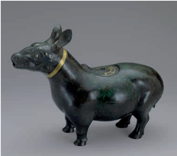
圖3 戰國中期 嵌綠松石金屬絲織尊 國立故宮博物院藏 故銅 002382