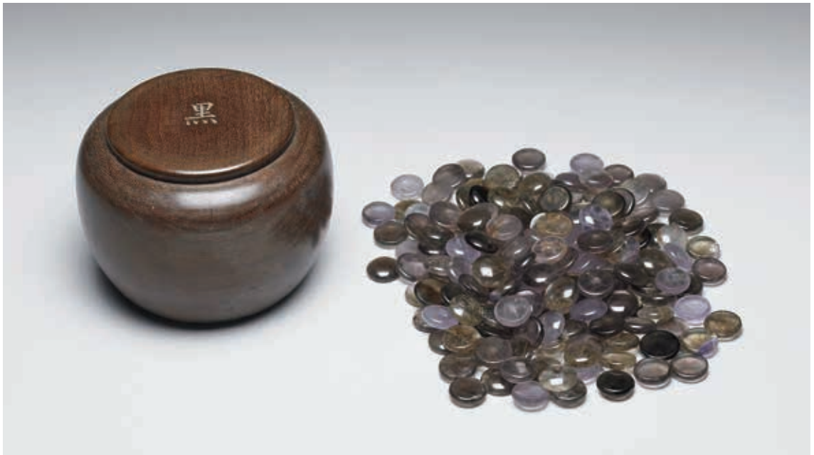
圖 7 清 紫晶與煙晶圍棋子 國立故宮博物院藏 故雜 000132