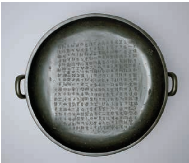
圖1 西周晚期 散盤 國立故宮博物院藏 故銅 002376

盤爲水器，作爲沃盥之禮中的水盤。這件器物以鑄在盤面上350個字的銘文聞名，銘文內容主要記載散國與矢國之間割地劃界的立約實景。西周晚期，由於矢國侵略散國，造成雙方的紛爭，經周王調停，矢國答應割地賠償，並將所割之地繪圖，雙方於豆新宮在史正仲農的見證下，矢人立誓並完成割地契約。散盤因其上銘文的書法非常精彩、典雅，而備受推崇。