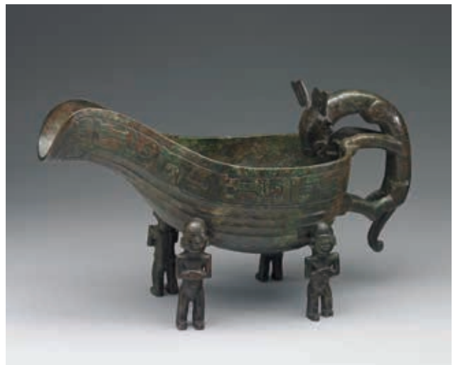
圖 10 西周晚期 人足獸鬃匜 國立故宮博物院藏 故銅 002392