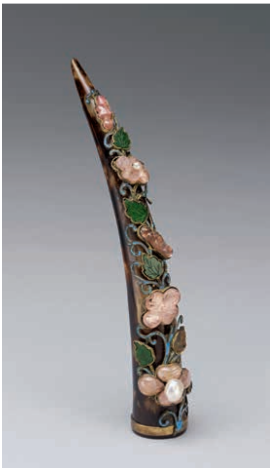
圖 11 清 玳瑁嵌珠寶花卉指甲套 國立故宮博物院藏 故雜 003631

多嫵媚。〈玳瑁嵌珠寶花卉指甲套〉（圖 11）以玳瑁製成套管，玳瑁是海龜的甲殼，經過處理後上面再以粉紅碧璽、點翠與翠玉裝飾成花朵與枝葉點綴。〈鏤空點翠鑲珠冰梅紋指甲套〉（圖 12）則是將外壁鏤空冰梅紋，更以鑲嵌珍珠與紅色玉石的梅花作為裝飾。