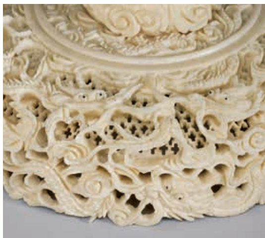
圖 17 清 19 世紀 廣東 鑲雕象牙雲龍紋套球 局部