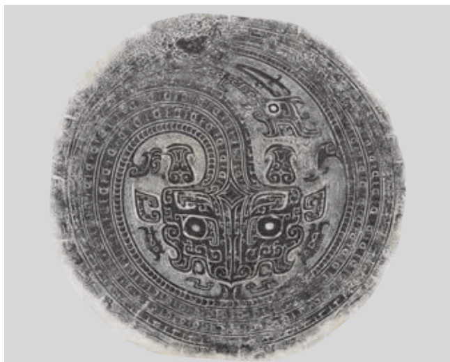
圖 19 商後期 蟠龍紋盤 拓片 國立故宮博物院藏 中銅 001513