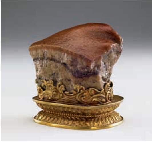
圖 15 清 肉形石 國立故宮博物院藏 故雜 000178

嫁妝。以綠葉白梗意寓清清白白、純潔之意；葉子上的螽斯與蝗蟲則表示多產，祈願新嫁娘為皇室帶來多子多孫，吉祥的含意，讓作品的內涵更趨圓滿。因為多數的觀眾都會指名要看〈翠玉白菜〉，上述內容想必導覽者都能倒背如流。很多人觀光客不知道的是，這件〈翠玉白菜〉原本是「寶石盆景」的一部份，與靈芝一起立在花形的掐絲琺瑯盆中，因為當時策展人有不同的考量，才另配木座呈現在大家面前。