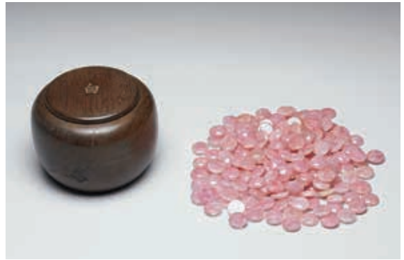
圖 6 清 粉晶圍棋子 國立故宮博物院藏 故雜 000131