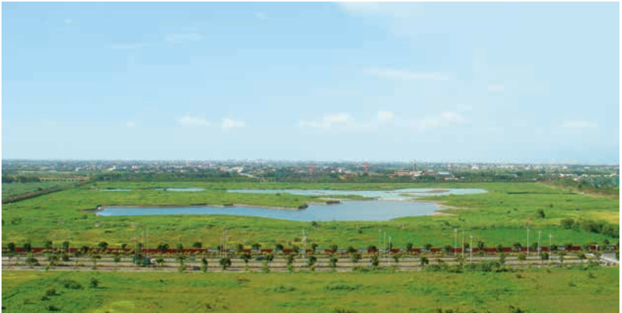
圖 1 故宮南院於選址確認後，上下湖完工情景。 攝於 2012 年 8 月 13 日。