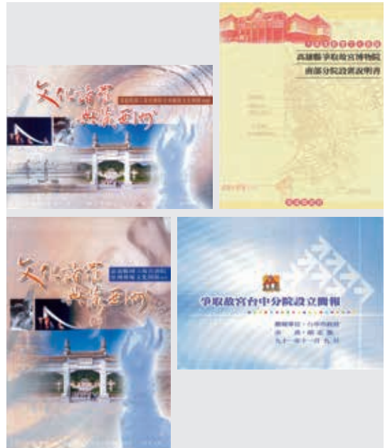
圖 6 優先基地之相關報告資料

左營等 8 案。會後，故宮另函通知入選之機關來院簡報，未能入選之機關，採以通則性說明通知其未入選之理由。11 月 9 日，召開第六次評估委員小組會議，會中決定將 8 案全列入實地勘查對象，並於同月 16、17 日勘查；實地勘查後，將召開會議討論並複選 4～5 案，以呈報行政院。12 月 20 日，召開第七次評估委員小組會議，決議採投票淘汰方式，並複選優先及次優等 5 案呈報行政院。第一輪，先淘汰 3 處，計有苗栗後龍、臺中西屯、雲林斗南、臺南玉井，其中因臺中西屯與臺南玉井同票，第二輪投票淘汰臺南玉井；第三輪，採圈選次優 2 處，結果分別為高雄橋頭、高雄鼓山；第四輪，則將剩餘 3 處列為優先基地，分別為臺中西屯、