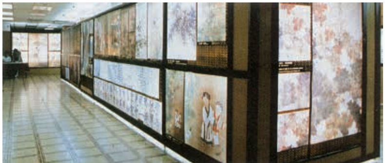
圖 3 華夏中古文物英華展覽現場 取自周功鑫，〈華夏中古文物英華展覽特輯——由香港「華夏中古文物英華展覽」談複製文物巡迴展覽〉，《故宮文物月刊》，30 期，1985 年 9 月，頁 19。

建設計畫」，其中包含於中南部籌設分院之規畫， 2 以平衡南北文化發展。計畫內載：「過去中南部民眾擬來本院參觀，往往受限於舟車勞頓，往返耗時；而故宮雖已積極推動下鄉巡展，以『百品』巡展於各縣市，然因展期及數量有限，無法滿足於中南部民眾對文物藝術之需求，如能籌設分院，提供中南部民眾親近藝文所需的空間及軟硬體設備，故宮