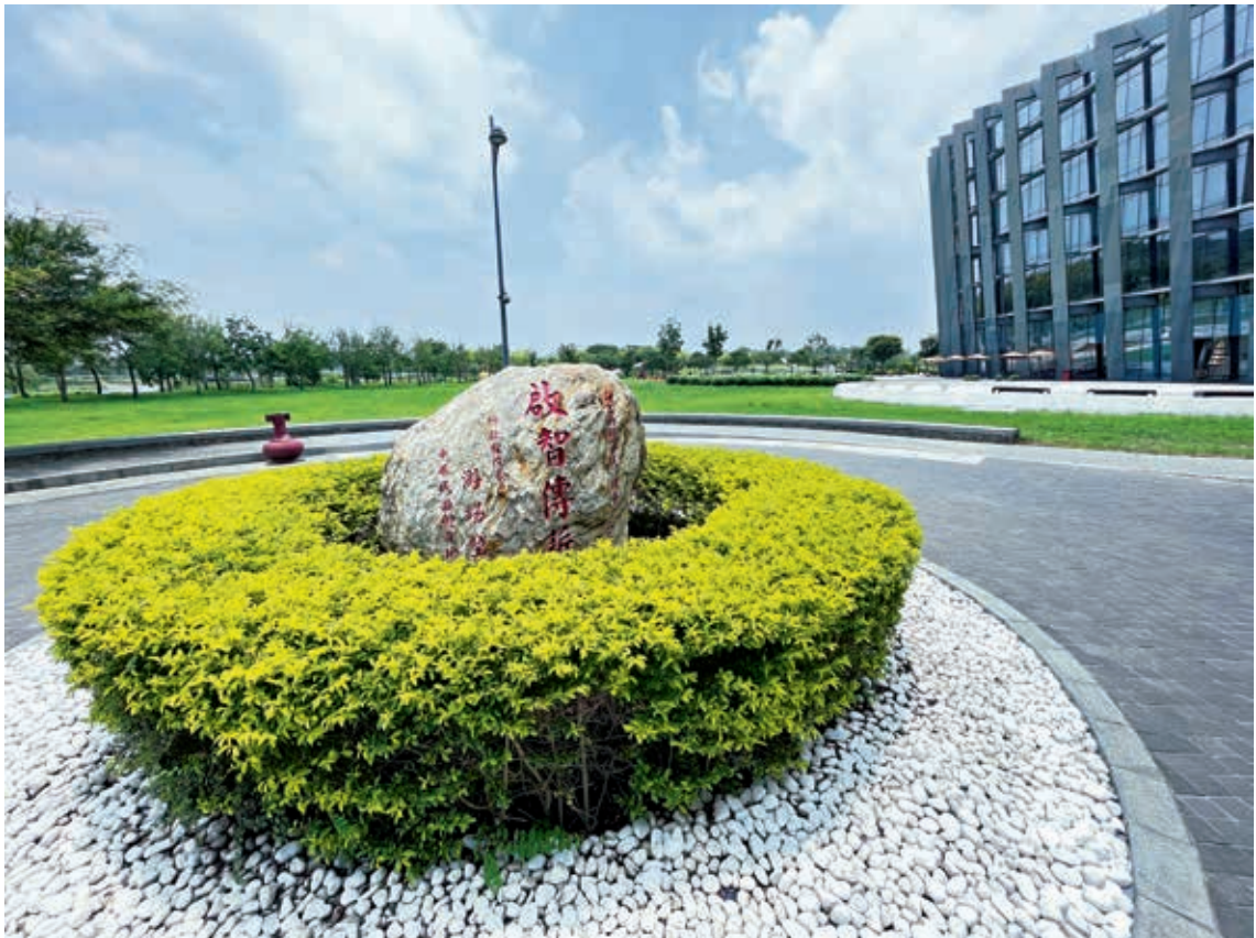
圖 7 故宮南院願景石