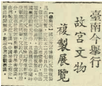
圖 2 臺灣民聲日報於 1974 年 2 月 7 日報載「臺南今舉行故宮文物複製展覽」。 取自《國立公共資訊圖書館·數位典藏服務網》： https://das.nipi.edu.tw/handle/3bzj ，檢索日期：2023 年 8 月 16 日。