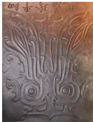
玉圭中刻有乾隆認為是熊紋的一面及熊紋特寫