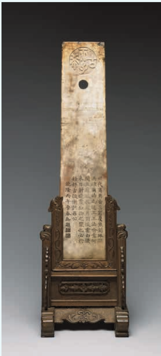
山東龍山文化 玉圭 置於乾隆所設計木架中 國立故宮博物院藏 故玉 001856