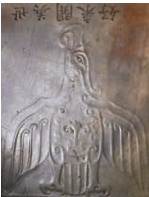
玉圭中刻有鷹紋的一面及鷹紋特寫