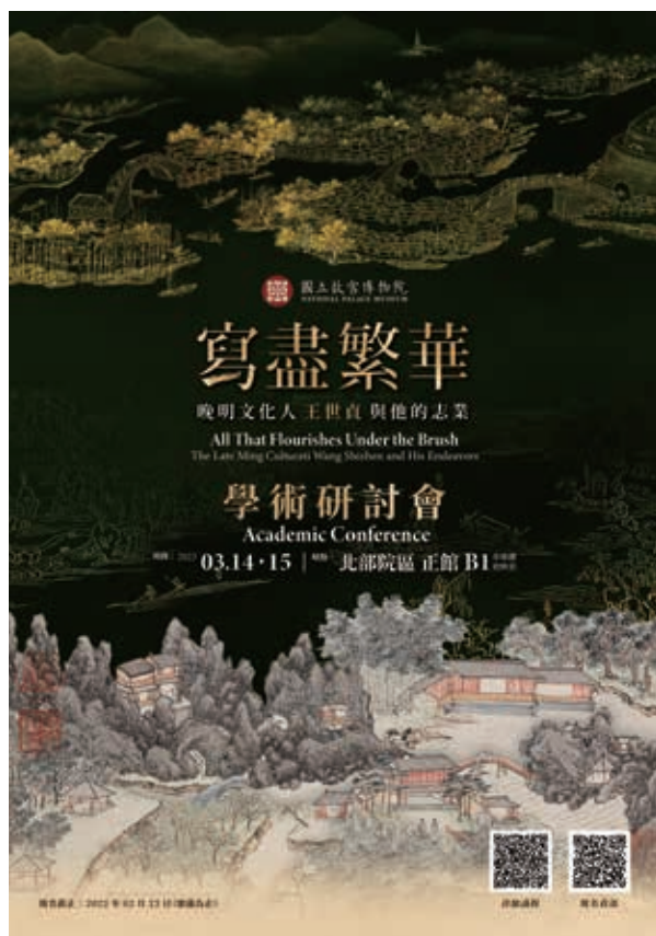
圖 1 研討會海報

研討會首日第一場「文化與歷史」由中央研究院歷史語言研究所陳國棟研究員主持。（圖 2-1）首先由中央研究院歷史語言研究所王鴻泰研究員發表〈游藝·繁華·名——明清的文酒之會與成名藝苑〉，探討的重點是明代中期的詩酒文會活動。明代中期以來因商品經濟發達，聲色犬馬的娛樂氣氛與文藝活動逐漸結合。繁華的城市生活讓文人經常舉辦文酒之會，又加入求文名的富商贊助，使詩酒活動日益熱絡，成為士商之間名與利互相轉換的平臺，形成流動性的文藝社會。