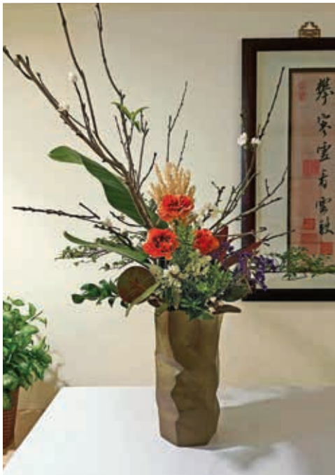
圖 12 研討會迎賓盆景