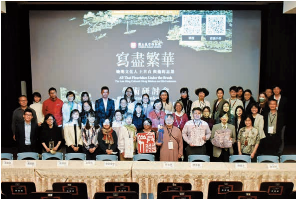
圖 11 研討會次日以全體與會者的大合照，圓滿結束。