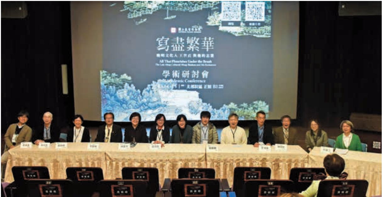
圖6 首日研討會以全體發表者的綜合討論，畫下句點。