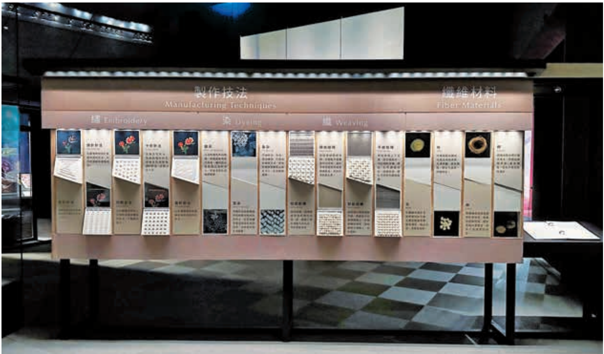
圖 9 故宮南院織品展廳內的教育展示