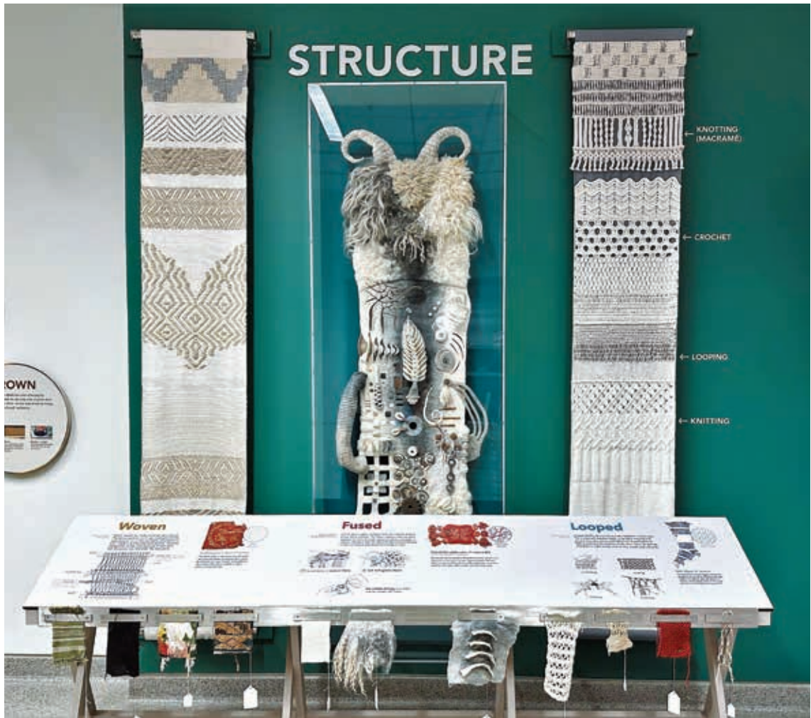
圖4 展廳內呈現各式各樣的織品結構

模擬織布機的互動裝置「經線與緯線」，觀眾可以在預先繃好垂直方向經線的框架內，使用水平方向的彩色繩索——也就是緯線——前後穿梭，透過經緯線的變化組合，就能創造出不同的組織與紋理，在體驗織布樂趣的過程中，也能加深對於各種織品結構的印象。（圖5）