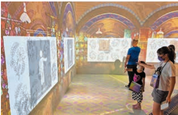
圖 10 數位體驗空間內的「織品小工坊」裝置