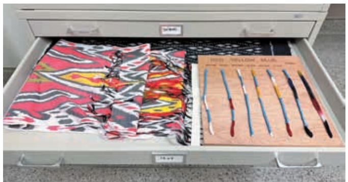
圖7 展廳內的教育研究用織品，開放觀眾取出觀察與觸摸。