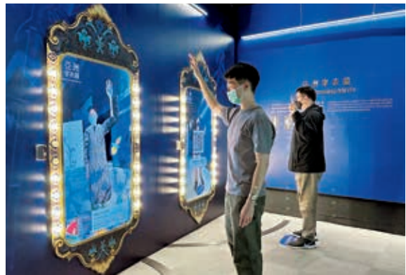
圖 11 觀眾體驗「亞洲穿衣鏡」互動裝置