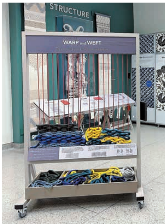
圖5 「經線與緯線」互動裝置，讓觀眾體驗織布的樂趣。