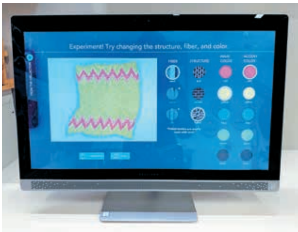
圖6 觀眾透過數位方式設計織品，可以嘗試不同的結構、纖維與色彩。

驗，並嘗試思考：如果我要製作一件織品——可能是包包、毯子、上衣，哪種纖維適合使用？哪種組織結構符合功能需求？哪些色彩能夠相互搭配？哪種裝飾技法可以達成理想效果？（圖6）觀眾在進行體驗的過程中，會發現這些基本元素的不同選擇，可以形成各種排列組合，進而創造出無窮無盡的可能，而這正是織品有趣迷人的地方，值得我們不斷地探索。館方也在數位體驗區旁邊，設置各式各樣的織品主題書籍，以及染織工藝所使用的工具，讓有興趣的觀眾自由參考使用。