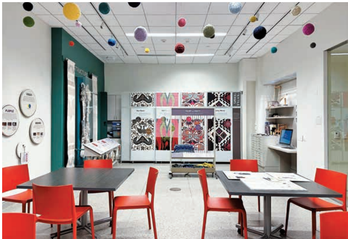
圖8 展廳可以變身為多功能教室，用於舉辦各種教育活動。

相較於本文討論之美國喬治華盛頓大學織品博物館的「織品101」展廳，故宮南院的織品教育展示同樣以對於織品藝術感到陌生的一般大眾為目標觀眾，使用簡單明瞭的語言和圖像，力求傳達織品的基本知識，包括纖維類型、組織結構、裝飾技法等等。二者也都相當重視參觀體驗的互動性，設置各種多媒體與互動裝置，鼓勵觀眾透過多感官且充滿趣味的方式，增進