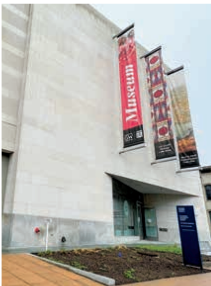
圖1 美國喬治華盛頓大學織品博物館外觀

現場設置了一座寬闊的檯面，高度大約是多數觀眾雙手可及的位置，用以展示上述三大纖維