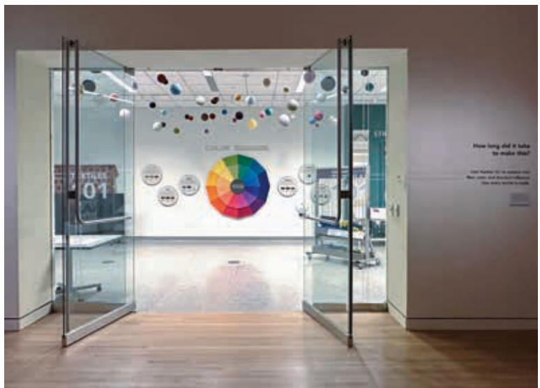
圖2 「織品101」展廳入口處