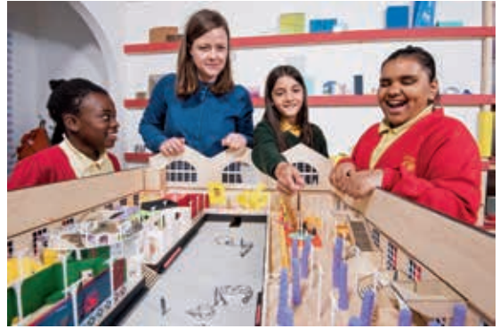
圖 13 與兒童協作的參與式工作坊 Children's Forum co-design workshop activity, mapping display spaces (pre closure, 2018)

臺。 13 由當地 8 ~ 14 歲中小學兒童，與建築師經由多次會議的反覆討論，以典藏品為探究觸媒 (Object-based enquiry)，開發展示主題及陳設手法的原型。(圖 13) 兒童一開始所提的想法不一定可行，通常需要經過一段歷程的精修。鼓勵兒童參與並貢獻創意與想法，從中認識與學習「博物館製作」的方法，也經由參與這些設計背後的过程，逐漸體會並培養創造能力。