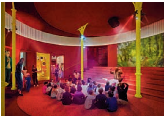
圖 8 Young V&A 想像廳的大舞臺區 View within The Stage area of the Imagine Gallery at Young V&A.