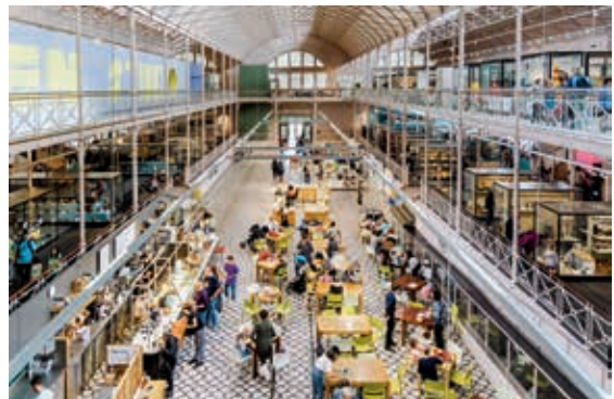
圖 3 Young V&A 整修前中庭，拱形棚頂與鐵架結構建築源自 1851 年萬國博覽會。