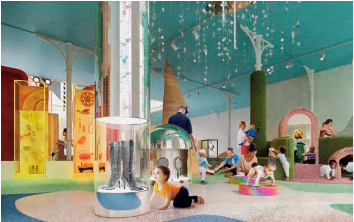
圖 6 Young V&A 遊戲廳給幼兒的學習空間 View of the pre-walker and toddler zone of the Play Gallery at Young V&A.

艦計畫。坐擁舉世聞名的藝術、設計、表演類收藏，以培養國家下一代的藝術家、設計師、表演藝術家與實務工作者為使命，Young V&A 不僅要回應世界脈動，更要連結在地社群。由倫敦在地建築師事務所 De Matos Ryan（簡稱 DMR）負責博物館建築改造基礎工程，Agents of Change（簡稱 AOC）負責室內設計裝修。改造計畫導入「設計思考」及「協作設計」的核心概念，不僅是「為」（for）兒童而設計，更倡議「與」（with）兒童一起設計（圖 5），以確保博物館的製作能與目標觀眾的需求、興趣及期待相符合。