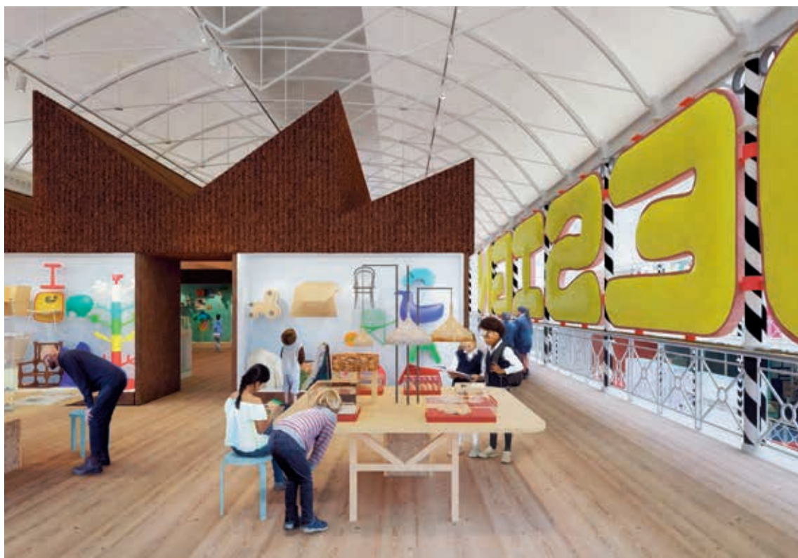
圖 11 Young V&A 設計廳邀請兒童學習像設計師一樣思考 View across the Design Gallery at Young V&A.

案計畫本身很重要，同時也影響了整體團隊的工作文化、實踐策略與方案。為真正落實傾聽、代理、迅速回應觀眾需求的承諾，博物館從計畫初始、願景形塑、概念設計到細部設計等各階段，嘗試以協作設計的實踐流程，邀請兒童、家庭觀眾、教師、社區居民等不同利害關係人，透過一連串的論壇或參與式工作坊，與建築設計師及館員一起工作，共同探索對博物館建築空間轉型與改造的想像與期待。在願景的支撐下，每次會議都是建立在前次參與式會議的基礎上，經由層層交織與對話，逐漸於歷程中形成想法的交集與共通性，並轉化成計畫的主題和目標，協助團隊進一步發展設計。整個博物館好比一個學習的工具，化身為實踐與涵養想