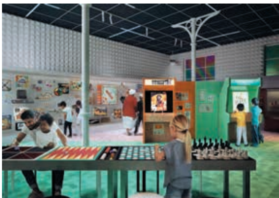
圖 7 Young V&A 遊戲廳給大孩子的學習空間 View of The Arcade room in the Play Gallery at Young V&A.