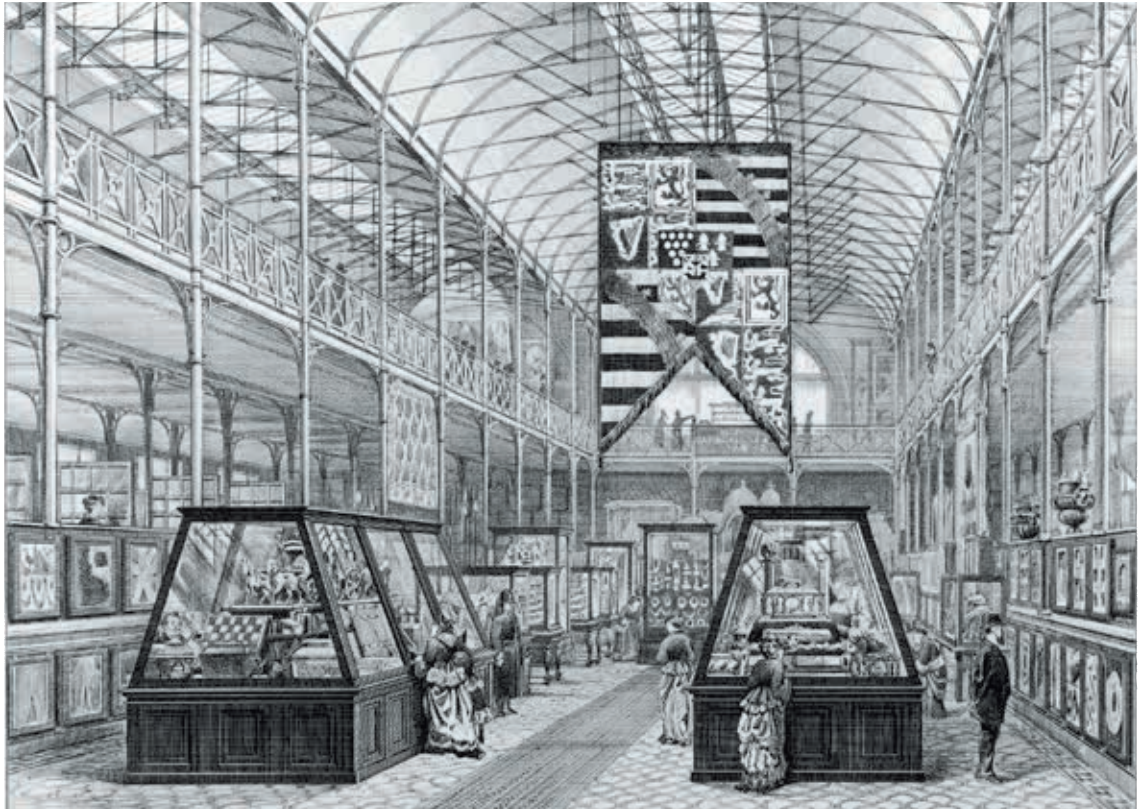
圖 1 Young V&A 前身貝斯納爾格林博物館十九世紀開幕時場景 The Prince of Wales opening the Bethnal Green Museum (now Young V&A) on 24 June 1872.