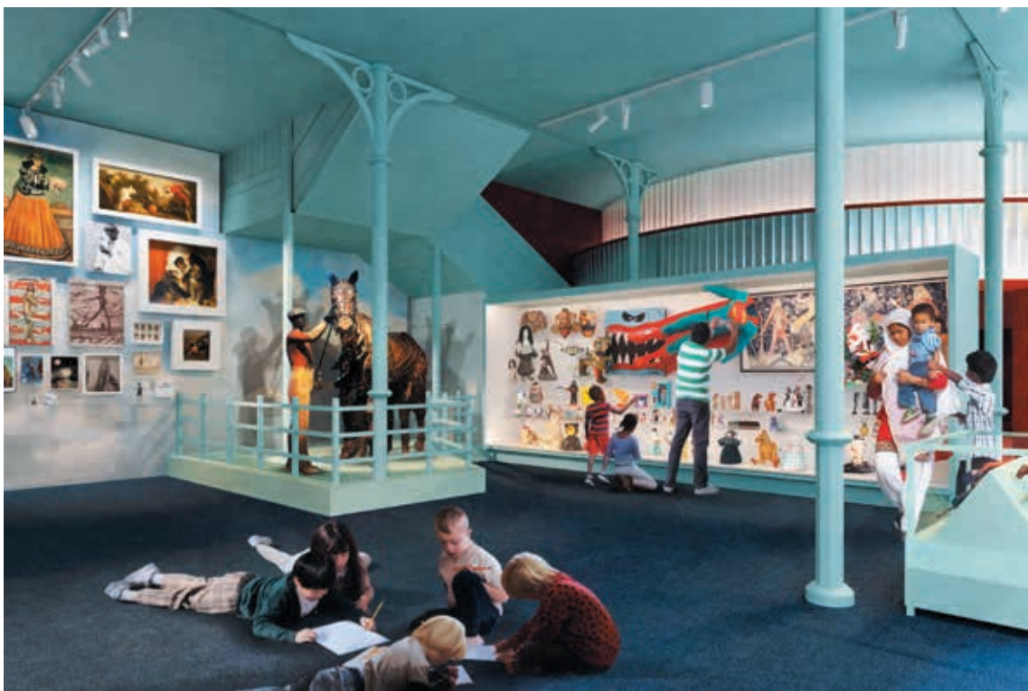
圖 9 Young V&A 想像廳以冒險主題的展間 View across the Adventure display in the Imagine Gallery at Young V&A.

音、材質等主題，提供爬行與學步階段的幼兒發展上所需的感官刺激環境。給大孩子的展間（圖 7）則以遊戲設計為主題，10～14 歲的兒童不僅玩遊戲，還可了解遊戲是怎麼設計出來的、