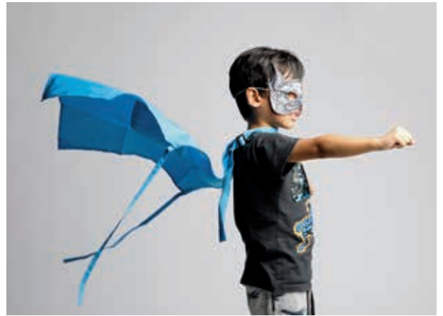
圖 4 Young V&A 以培養國家下一代的創造力自信為使命 This is Me, a photography display featuring local young people and their creativity at Oxford House community arts centre. Co-curated by Young V&A, young people from the Mile End Community Project and photographer Rehan Jamil.

有鑑於博物館內以成排的玻璃櫃展陳童年物質文化，懷舊的氛圍對當代兒童已失去吸引力且不合時宜，V&A 斥資 1,300 萬英鎊（約 5 億新臺幣），著手打造國家級兒童博物館的旗