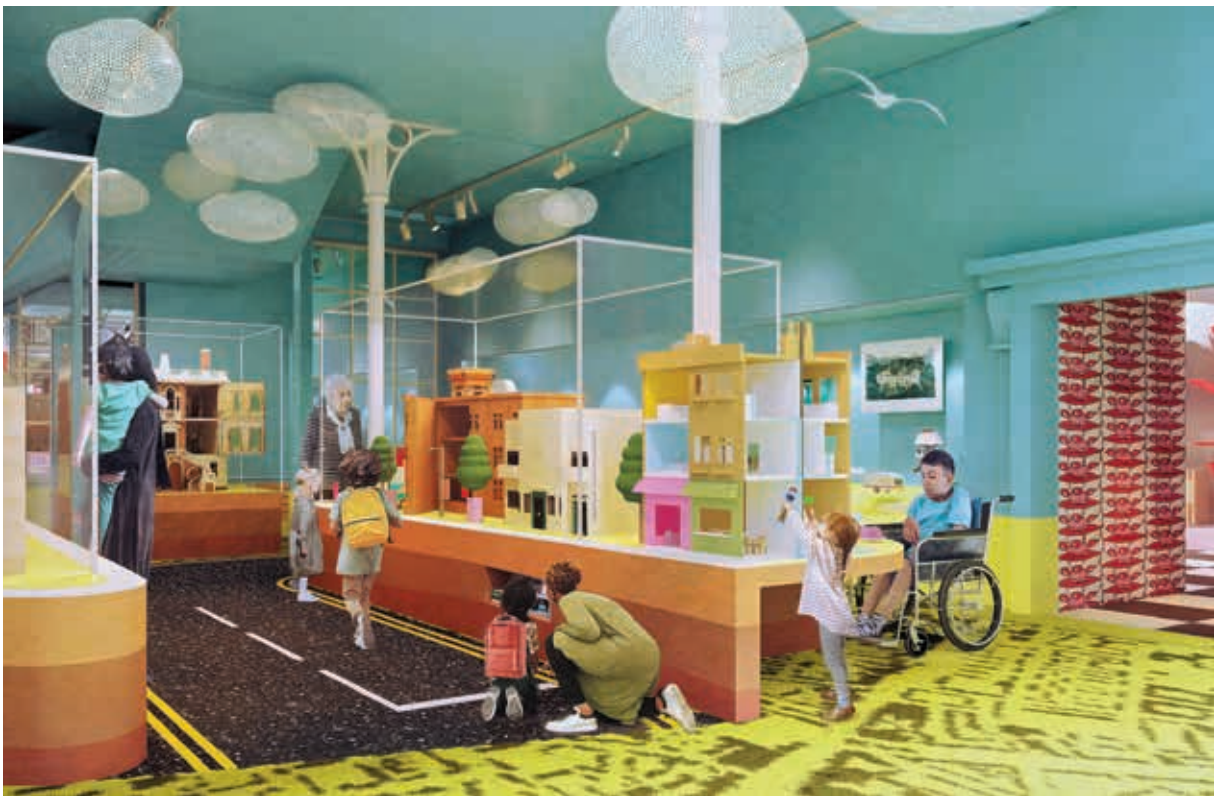
圖 10 Young V&A 想像廳以社區的生活情境佈置陳列娃娃屋 View into the Living Together display in the Imagine Gallery at Young V&A.

博物館若要成為「真正的」公共空間，那麼公眾對於它的成形是否應該要有一定的發言權？ 9 秉此問題意識，Young V&A 以「協作設計」 10 做為驅動其轉型重塑的的核心理念，這不僅對專