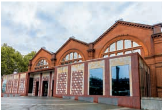
圖 2 Young V&A 整修前入口外觀，為維多利亞式紅磚倉庫歷史建築。