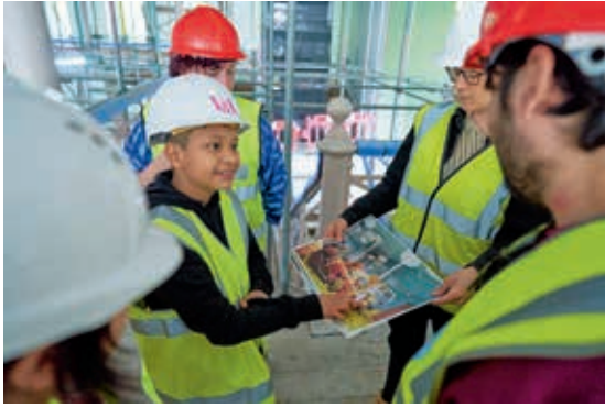
圖 12 兒少代表成員與建築師一起巡迴工地現場 Young V&A Youth Collective members have a tour of the Young V&A construction site.