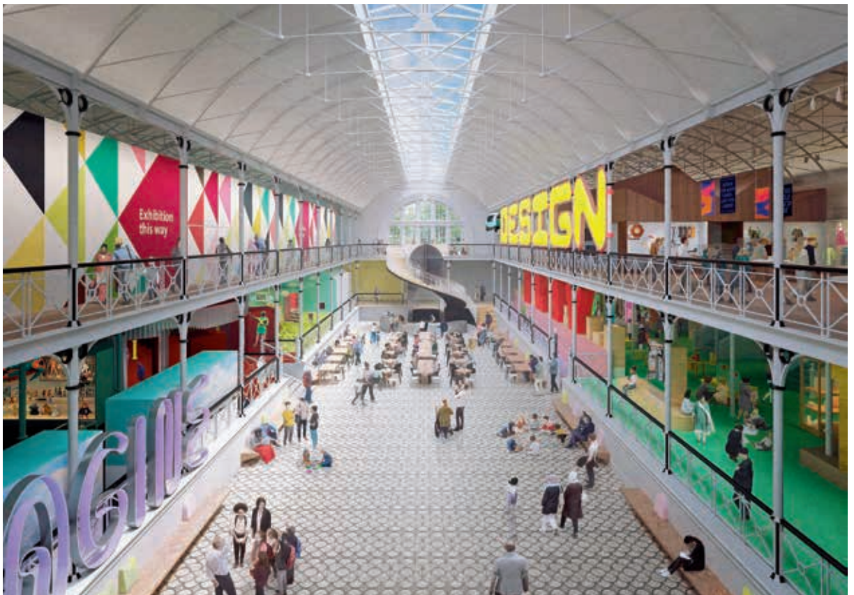
圖 5 Young V&A 改裝後中庭，底端螺旋梯為與兒童協作設計。 View across the Town Square at Young V&A.