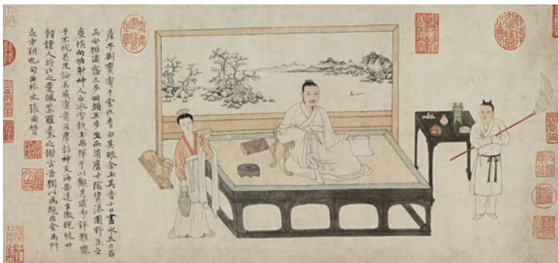
元 張雨題倪瓚像 卷 國立故宮博物院藏 故畫 001103

背屏的山水畫也值得注意。它採一河兩岸構圖，前、後景斜斜相對，低矮坡石、沙渚、遠山連綿不絕，顯出湖面空疏開闊。間有小橋、水榭、小舟，並「久違」地畫上了兩個人物，增添悠閒氣氛。畫面筆力孱弱，卻仿倪瓚、黃公望（1269-1354）的風格，有模有樣。所以它可能就是畫倪瓚家裡的屏風，並模仿屏風上倪瓚的原作，見證倪瓚早年受黃公望影響的畫風。