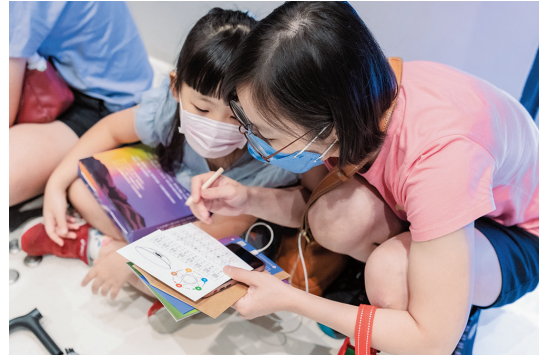
圖5 家長在遊戲過程中扮演「鷹架」角色，支持兒童學習與完成任務。

觀眾透過文字及道具提示，可找到「中國瓷器」以及「上下交疊的多彩圖樣」雙重線索，從而找到答案。（圖4）本活動以教育為目標，因此不同於設計給專業玩家之實境解謎，除將關卡一設定為暖身題，其他各題以一般親子觀眾經過思考可達成之挑戰難度為限外，並透過聊天機器人等解密提示之設計，讓家長扮演「鷹架」（scaffolding）角色，支持兒童學習與完成任務。 11 （圖5）