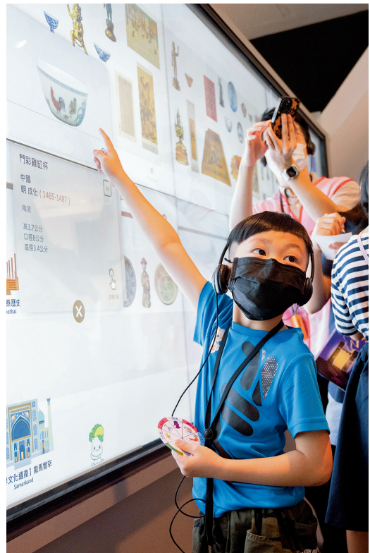
圖4 展廳實境解謎關卡一，觀眾透過文字及道具提示可推理出答案，並認識「鬥彩」技法特徵。

親愛的 哈哈 ，你好 你操縱金、木、水、火、土等自然之力的魔法潛能已獲得王國初步認證，在此恭喜你獲選加入正式魔法師的培訓行