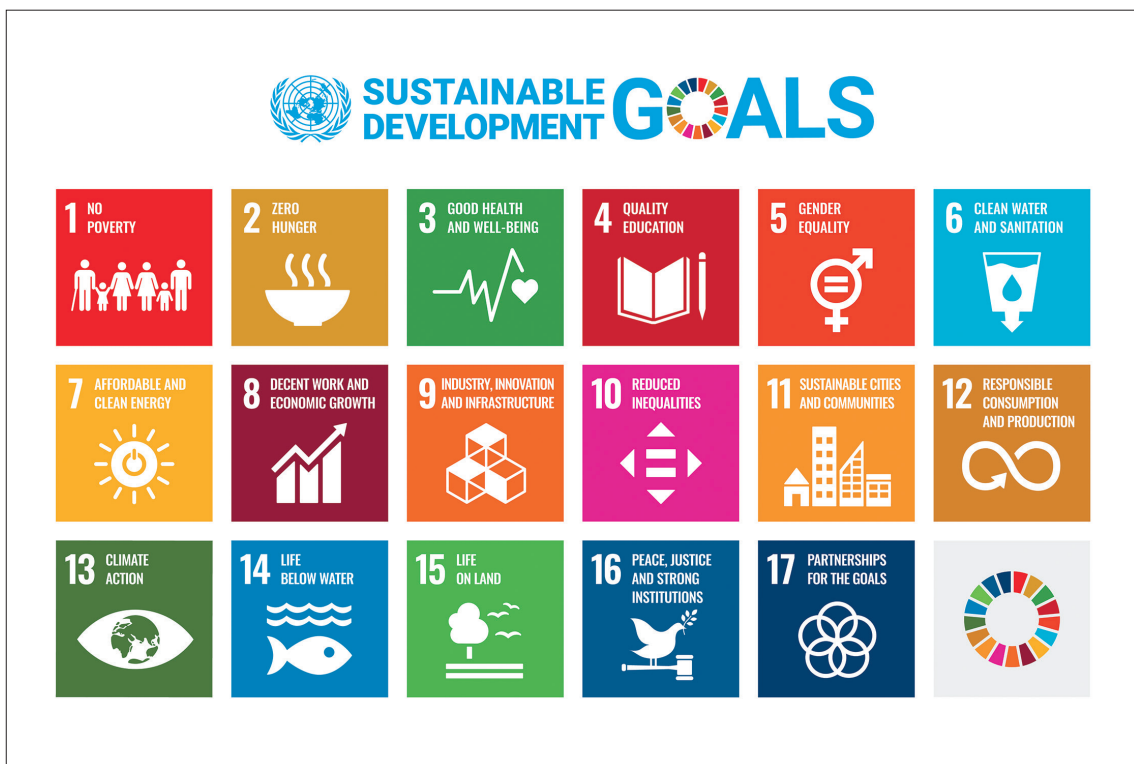
圖 2 聯合國 17 項永續發展目標 取自聯合國 (United Nations) 官網： https://www.un.org/sustainabledevelopment/news/communications-material/ ，檢索日期：2023 年 4 月 15 日。

不平等所造成的失學或停學，因而提倡在 2030 年以前，希望確保所有男女童均完成免費、公平和優質的中小學教育，能獲得優質的學前教育，男女均能獲得可負擔且優質的技職和高等教育等。此外，「優質教育」目標強調排除一切歧視，消除性別差距，並要確保身心障礙者、原住民及弱勢兒童均能平等獲得受教機會。在終身學習層面，期盼 2030 年之前，所有學習者均能獲得永續發展所需的知識和技能，包含永續生活方式、人權和性別平等教育、發揚和平及非暴力文化、提升全球公民意識、肯定文化多樣性及文化對永續發展的貢獻等， 5 而這些議題及面向，已是近年許多博物館透過展覽及教育推廣活動，致力倡議或開啓對話思辨的課題。 6