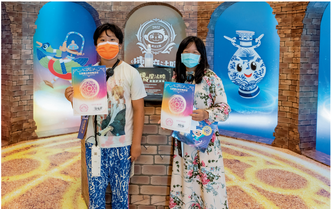
圖 7 實境解謎能創造主動探索與合作學習體驗，值得博物館持續探索其應用在教育上的可能性。圖為觀眾完成闖關取得修煉證書。