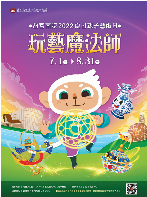
圖3 「故宮南院 2022 夏日親子藝術月」活動主視覺，將院藏文物化身擬人化角色，陪同親子觀眾展開博物館探索旅程。 南院處提供

以 2022 年活動為例，去年度搭配「謎樣景泰藍」及「花樣何處來：一位道教皇帝對瓷器製作的影響」兩檔展覽，將院藏文物清乾隆〈招絲琺瑯甕尊〉、清乾隆〈招絲琺瑯番蓮紋扁蓋鉢〉及明嘉靖〈青花四靈圖雙耳瓶〉化身為擬人化角色「鴨鴨」、「扁扁」及「靈兒」，陪觀眾一同展開博物館探索旅程。（圖3）