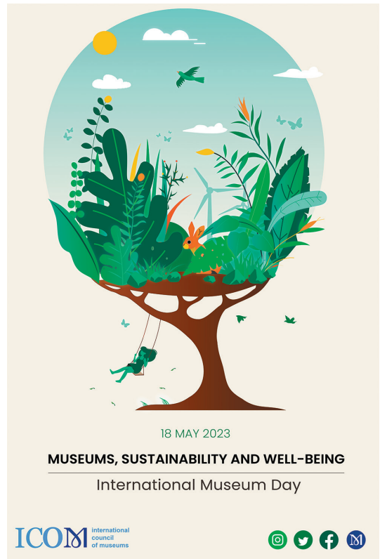
圖 1 2023 年國際博物館日主題海報 取自 ICOM 官網： https://imd.icom.museum/international-museum-day-2023/the-poster/ ，檢索日期：2023 年 4 月 15 日。

博物館作為社會教育機構，長期致力提供優質、寓教於樂的學習經驗，以展覽或教育推廣活動等方式，鼓勵參與者親近多元文化、環