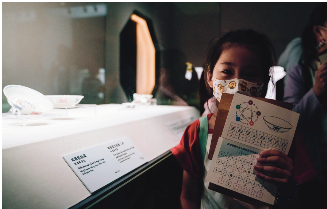
圖6 關卡三融入簡易的五行八卦概念，加上四則運算及圖像特徵觀察，是較具挑戰性的一題。

公益活動方面，呼應2021年「遠方的戰爭——清宮銅版戰圖特展」之戰爭主題，「夏日親子藝術月」在系列活動中特別規劃與國際人