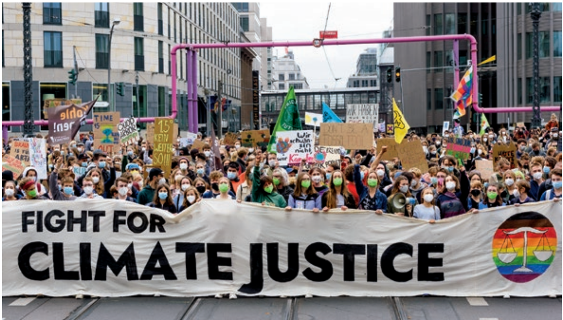
圖 2 2021 年 9 月 24 日葛莉塔·通貝里（站在擴音器旁，身穿白衣）參與德國柏林「氣候罷課」抗議活動。

菲格雷斯曾任《聯合國氣候變遷綱要公約》（United Nations Framework Convention on Climate Change, UNFCCC）執行秘書，任職期間邀請里維特—卡納克，擘畫了巴黎協定，並在 2015 年第廿一屆締約方會議（The 21 st Conference of Parties, COP 21），經由 195 個國家簽署，順利通過。該協定被譽為是第一個能夠真正規範全球暖化幅度的氣候協議，強調「將全球平均氣溫上升控制在工業革命前的 2 度以內，並限制溫度上升 1.5 度以下」為目標。