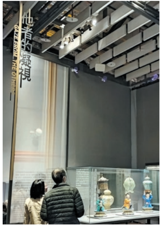
圖8 「看見藏品裡的原、民、官：故宮、臺博、臺史博三館聯合特展」 展場一隅 陳怡夔 2023年攝於臺史博

事實上，每個館所都面臨獨一無二的情境（正如本院正館與南部院區，前者興建於近六十年前，後者才開館不到八年，其展示空間的設計思維，大有不同），館內策展人無不絞盡腦汁，期待為觀眾帶來驚艷的視覺經驗。就如同本院近期與國立臺灣博物館、歷史博物館（以下分別簡稱臺博、臺史博）共同策畫「看見藏品裡的原、民、官：故宮、臺博、臺史博三館聯合特展」，分別於臺博和臺史博巡迴時，因兩館特有的情境與條件，為觀眾成就了迥然不同的視覺效果。（圖7、8）