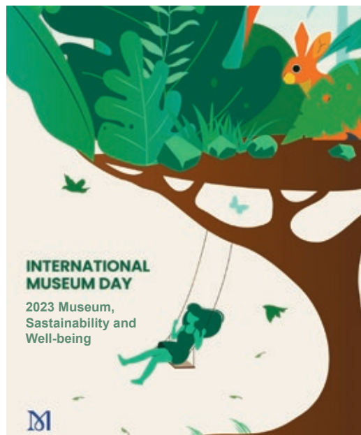
圖 1 國際博物館日 2023 年主題海報（原圖並無 2023 IMD 主題文字，後加使其更完整。） 取自 ICOM：https://bit.ly/427AvAu，檢索日期：2023 年 4 月 23 日。

則像是個烏托邦，透過年輕人主導的氣候變遷行動，敲響警鐘；這個未來應是人類與大自然共同繁榮的世界，唯有靠「巴黎協定」（Paris Agreement） 4 的真正落實，始能成真。