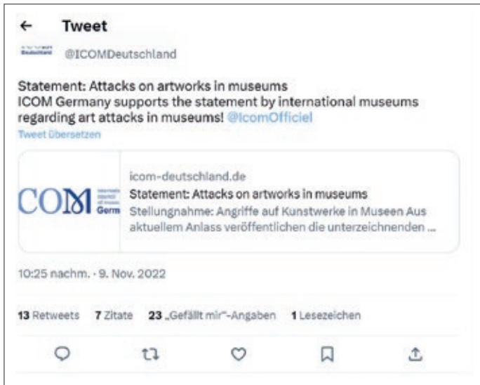
圖 3 ICOM「博物館藝術品攻擊」聲明 取自 Twitter @ICOM Deutschland : https://twitter.com/ICOMDeutschland/status/1590349831297708032?ctx=HHwWgMDRsdvuh5IsAAAA ，檢索日期：2023 年 4 月 23 日。