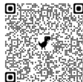
圖6 「宮說宮有理——博物館搶救環境大作戰」podcast 專題 QR code (2022年12月15日上架) 收聽網址： https://apple.co/3NI12pv

回到《我們可以選擇的未來》一書，雖沒有提到任何與博物館有關的內容，薩特強調：這並不表示博物館可以置身事外；相反地，當以青年主導的氣候行動，選擇以博物館明星作品為攻擊對象，如此高調的表演手段，確實受到媒體的關注和博物館界的譴責。其實更突顯了：面對氣候正義，博物館必須為改變而戰，一個由「實然」到「應然」的心態調整。回到該書所列的〔行動1〕放下舊世界、〔行動2〕勇敢面對悲傷，但更要展望未來、〔行動3〕捍衛真相、〔行動4〕把自己視為公民，而非消費者、〔行動5〕超越化石燃料、〔行動6〕為地球復育森林、〔行動7〕投資「清潔經濟」(Clean Economy)、〔行動8〕盡責使用科技、〔行動9〕營造性別平等、〔行動10〕參與政治等的「十項行動」，足以提供博物館「為改變而戰」具體可行的行動方針(有關本院相關作法，請參考：本期林姿吟專文及「宮說宮有理——博物館搶救環境大作戰」podcast 專題，圖6)。 15