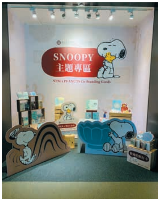
圖7 故宮禮品店之主題專區

造衍生價值的重要角色。但產業發展日新月異，總體環境也持續不斷變化，能夠配合市場脈動及趨勢演變的新模式，亦需同步構思，才能持續在授權產業中保持領先。授權代理在授權產業已發展良久，在異業結合及跨區合作蓬勃發