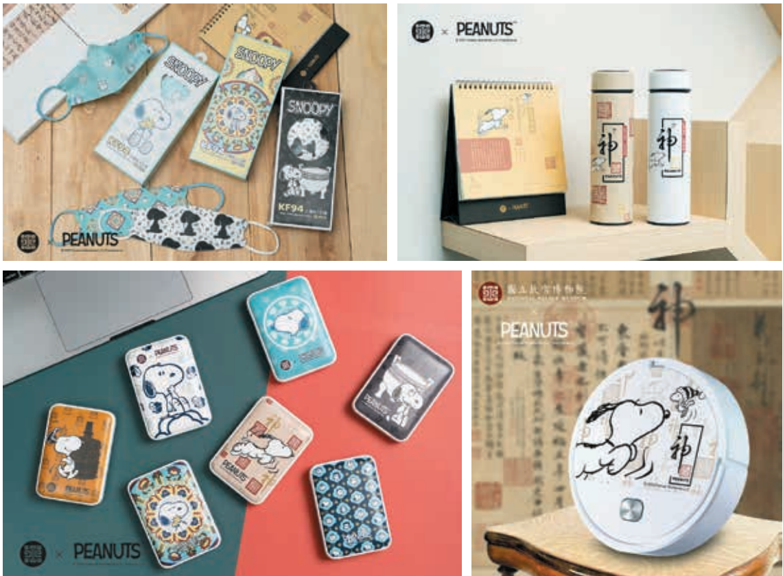
圖 3 聯名商品示例：立體口罩、保溫瓶、行動電源、掃地機器人。

增加選擇與此博物館合作的機會，此有荷蘭國家博物館（Rijksmuseum）之成功案例可稽。 11