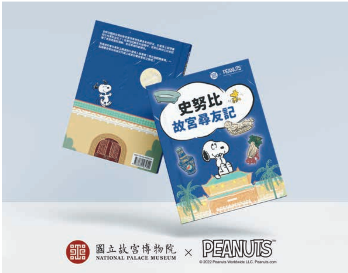
圖 4 敘事型導覽書《史努比故宮尋友記》

能接受的聯名圖樣只是第一步，還要同時找到願意合作的產品製造商及銷售通路，才能整合出商品生命週期的全貌，實現聯名商品化。（如表一）由此不難發現，與國際 IP 或品牌的合作成果，是各方磨合下互相妥協而成，因為國際市場中的授權行規已相沿成習，知名 IP 及品牌之授權規範須被圖 2 之第三方遵守，因此主要商業模式趨於一致，一如故宮及史努比都有自己的授權原則與底線，雙方都需要在彼此的底線之內提出要求，這樣的要求才有可能被接受，進而轉化為商品設計的一部分，若過度堅持自身立場，則難以達成強強聯手的效果。