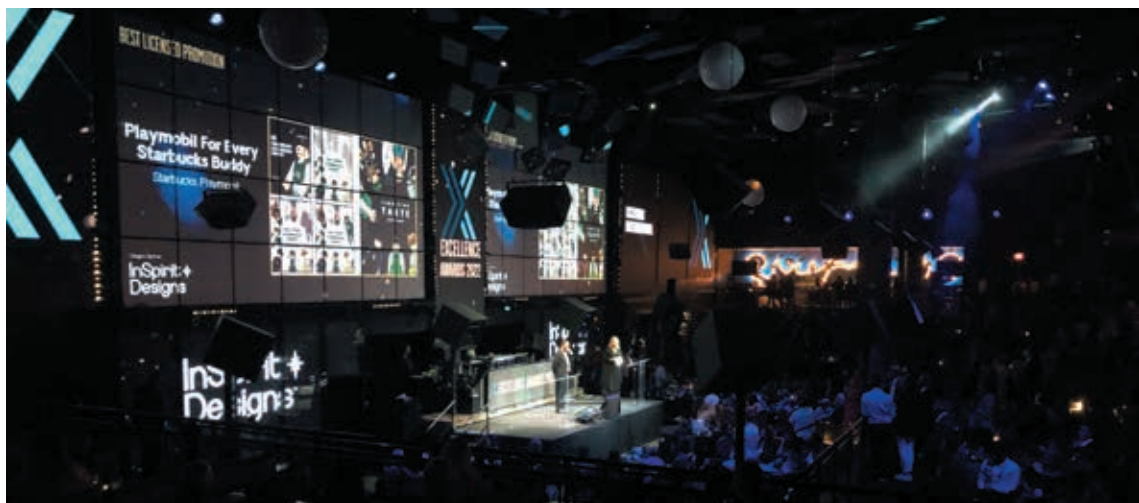
圖8 國際授權卓越獎頒獎典禮現場

不諱言地，新模式有其挑戰：其一、博物館本身需投入大量時間對代理商進行博物館及典藏品轉化設計之教育工作，使代理商對博物館品牌有足夠了解，一來可確保代理商在知識和認知層面足以成為博物館品牌的代理人，二來也確保其所設計出來的新圖樣可充分反應典藏品特色與重點；其二，博物館在專業上需結合藝術、商業、法律及授權實務經驗，體察市場變化，並對市場趨勢有所了解，態度上不堅持絕對最佳解，而願意和代理商互動出相對最佳解，以達國際行銷及大量商品化目的；因為代理商背後還有為數極大的製造商和通路商，尤其海外合作方洽談過程複雜，此時博物館需經常換位思考，以不同角度判斷考量，以促成多方合作順利進行。