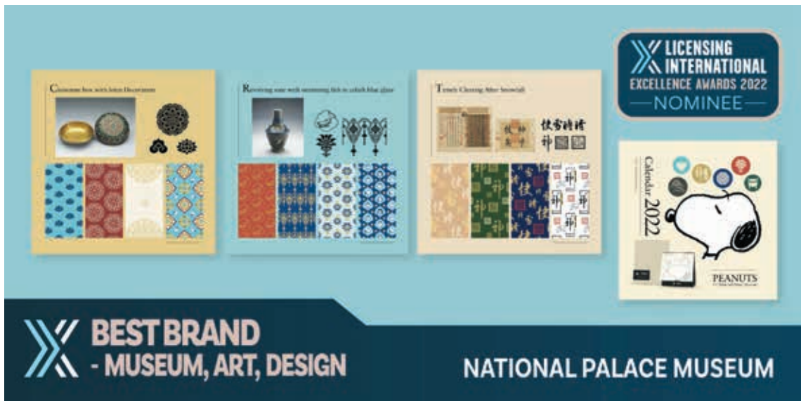
圖 5 國際授權卓越獎被提名者專屬行銷圖片（最佳品牌獎）

而不是厚重知識的消化過程。另一件和傳統博物館導覽書不同之處在於，此本書的導覽範圍不只典藏品，而是從故宮戶外園區就開始把種種有趣的陳設和特殊的造景都納入書中，讀者可以跟著史努比的步伐，由大門牌坊、到展覽廳、最後到至善園松風閣，由外而內再外，全面探索故宮，讓對故宮的認識不只停留在典藏品，能夠進一步認識戶外空間的陳設與巧思。