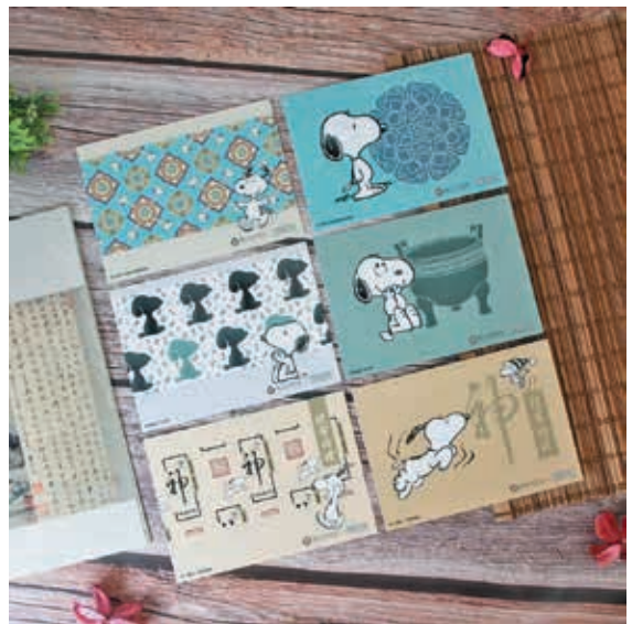
圖 6 國際授權卓越獎「最佳商品獎」被提名品項：桌曆、出版品、紙質品。