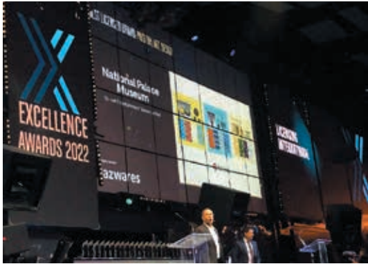
圖9 故宮受「最佳授權品牌」提名

本文相信，授權代理模式值得嘗試，因為代理商的跨國行銷不但能擴大博物館品牌能見度，其深耕特定區域的銷售專業，更可以在國際市場拓展消費客群；如此一來，上述對收入造成衝擊的 Open Data 政策及圖像免費釋出，反