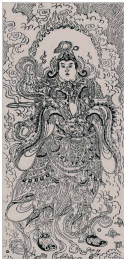
圖9 展場尾端安排輸出 2.5 公尺護經天神〈韋馱天〉