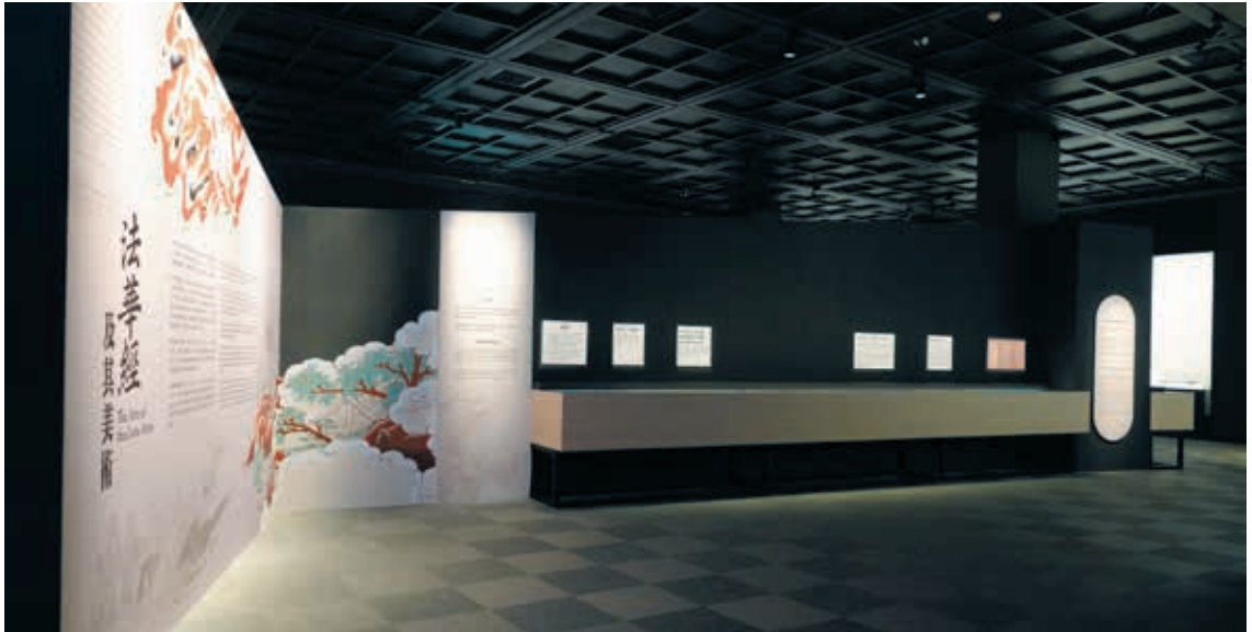
圖 10 牆面造型與轉折呈現經摺裝意象

存狀況良好，銅鑲金的外觀成為觀眾注目焦點。背光背面細緻雕刻，釋迦牟尼佛與多寶佛並坐於塔龕中，兩側有維摩詰居士與文殊菩薩對談。一旁的巨幅佛像背面輸出說明，為觀眾及具有導覽需求的志工，提供清楚解說。