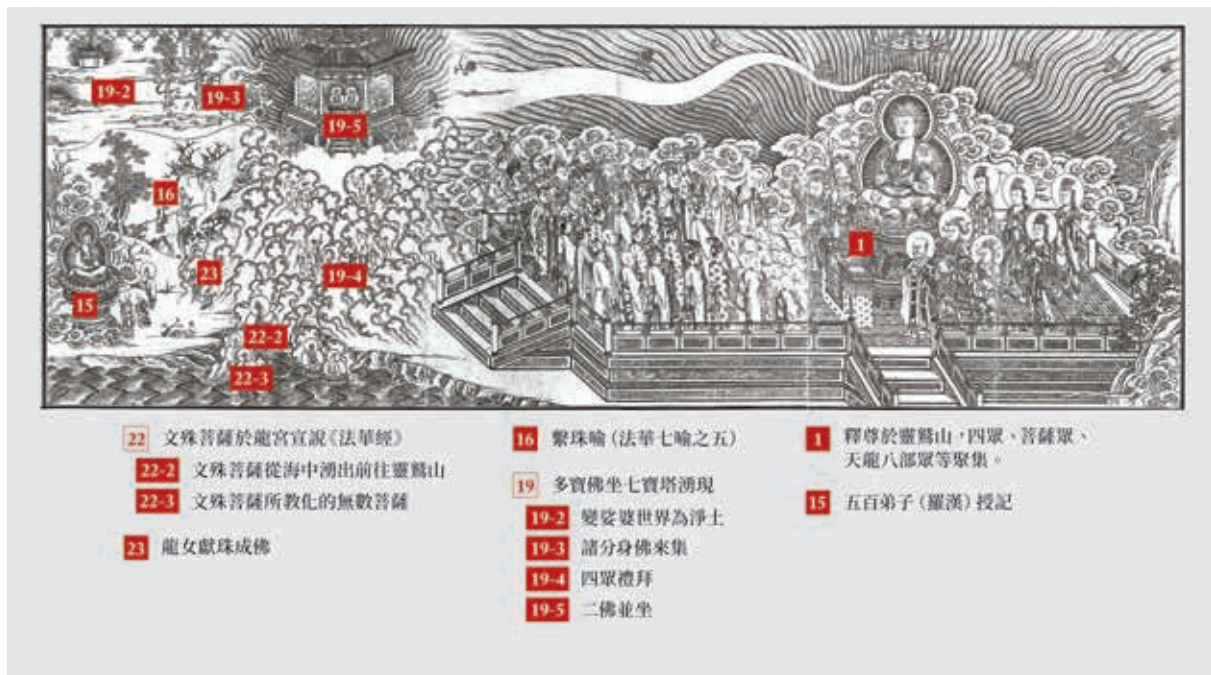
圖 7 美術主題標示系統應用於磁青紙展件標示