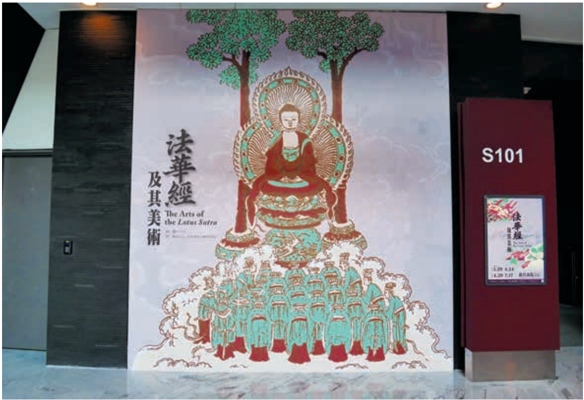
圖8 展場外形象牆面以〈佛說法圖〉為視覺焦點

達到參觀展覽就有如同「閱讀」《法華經》的策展理念，空間設計的整體概念即是將展場視為一本經書。其主要手法如下：