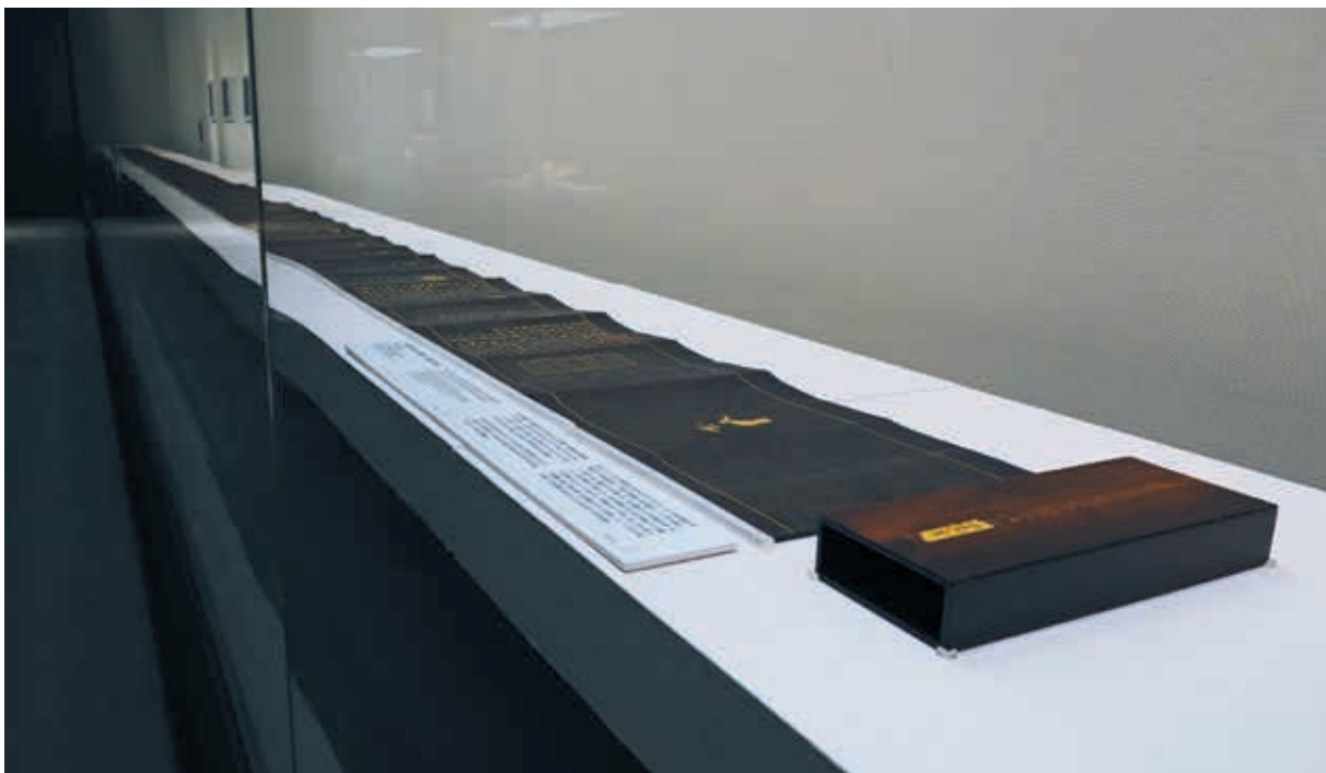
圖 13 全幅展出明宣德七年（1432）內府泥金寫本《觀世音菩薩普門品》

人。在數位投影帶領下，觀眾得以一覽敦煌石窟中的《法華經》美術圖像的發展，擴展觀眾視野，提供不同的視覺體驗。（圖 12）