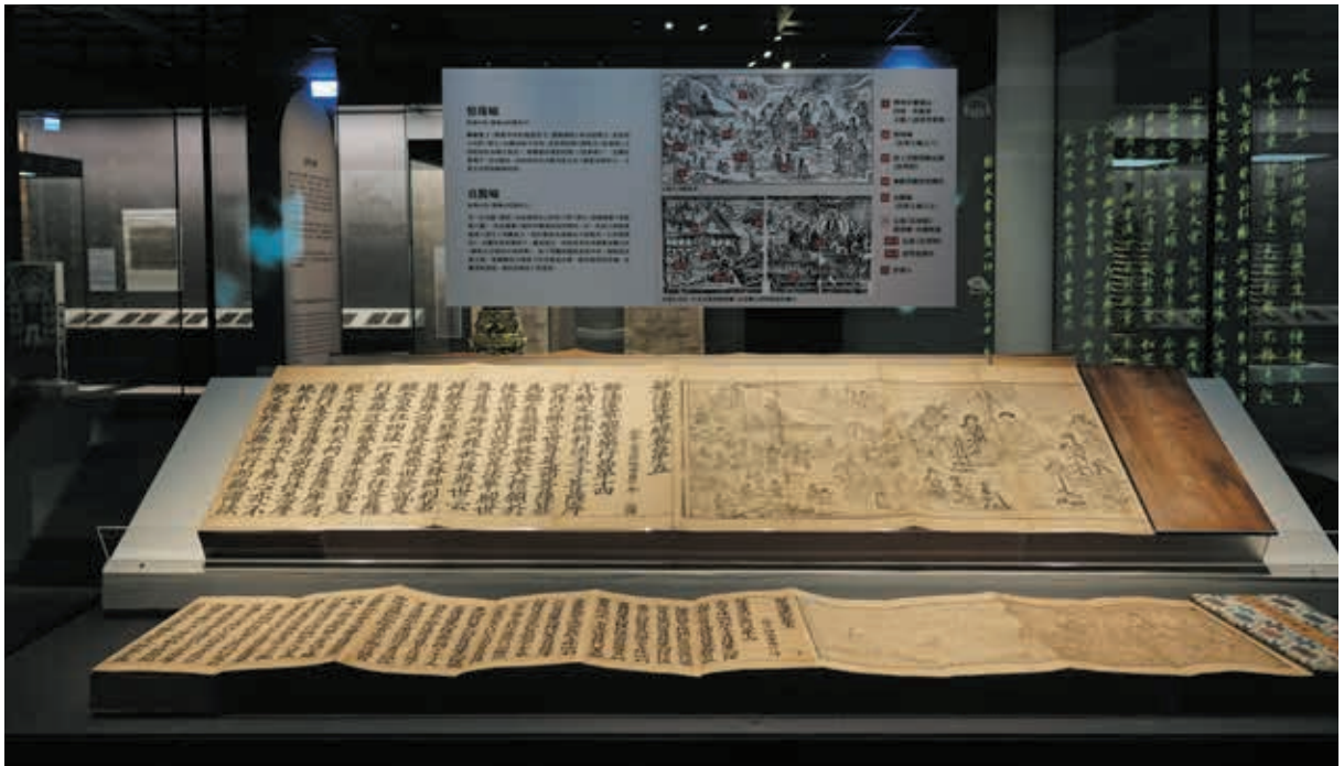
圖 6-1 美術主題標示系統的應用