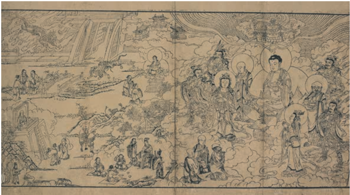
圖3 《妙法蓮華經》卷三扉畫 十六國鳩摩羅什譯 元浙江刊蘇寫本 國立故宮博物院藏 故佛 000203

非佛教徒的潛在觀眾形成排斥感。另一方面，由於展名已明確標舉《法華經》，作為核心觀眾的佛教徒的黏著度高，彼此口耳相傳，實也毋需在視覺第一印象上強化「佛教」意象。