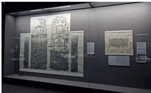
圖 11-3 二佛並坐與經塔信仰區，兩側直立櫃櫃深及展示高度皆考慮以觀眾舒適度為優先。

法華變相展區主要展示敦煌莫高窟第 61 窟數位投影、及院藏宋元明各版本《法華經》。較為特別的是莫高窟第 61 窟數位投影，此件作品是與國立臺灣大學影像與視覺實驗室合作製作。洞窟內實體神像皆損毀，此次以 3D 投影技術重現洞窟內的虛擬場景，介紹洞窟內〈法華