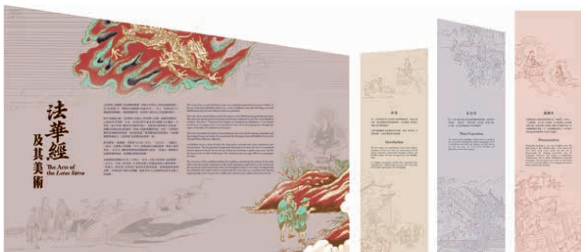
圖5 展場空間輸出配色，由左至右依序為總說、單元一、單元二、單元三。