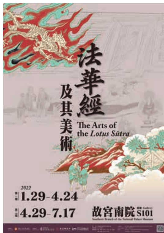
圖4 海報設計 南院處提供

為色彩鮮明的主要視覺意象，而「化城喻」（城門、老虎等）與其他圖像則作為次要的淺灰色背景設計。以海報為例，「藥草喻」呈現顯眼的對角式布局，「化城喻」以及更次要的大通