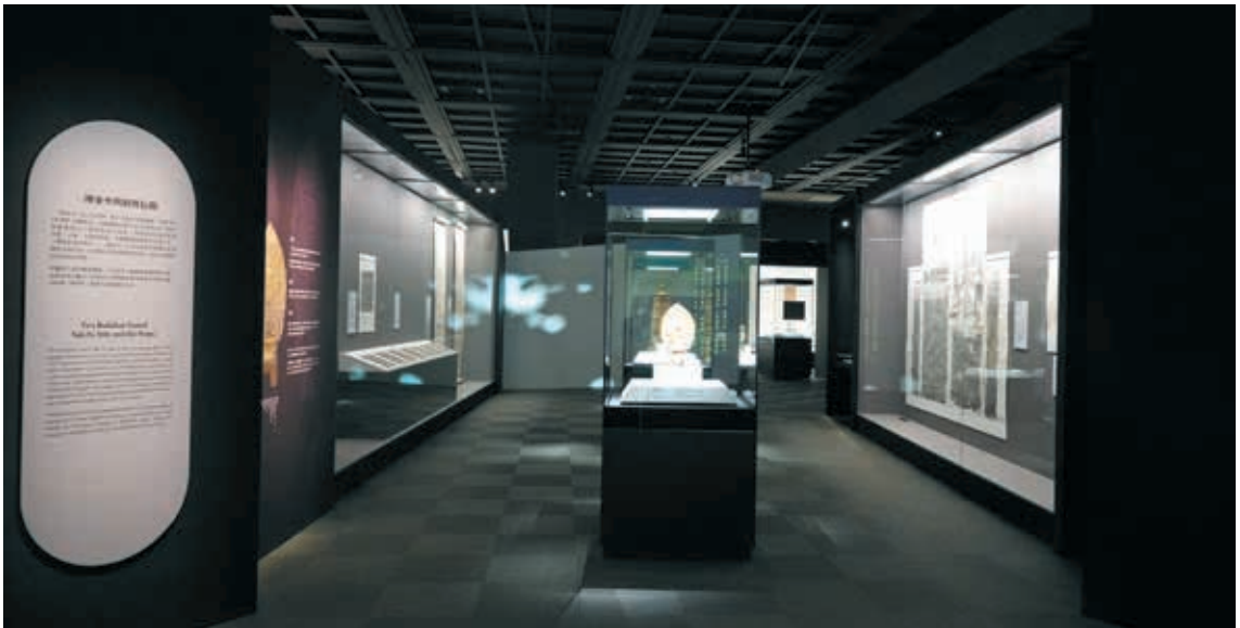
圖 11-1 二佛並坐與經塔信仰區，展示空間採對稱型，中央展示器物，兩側展示拓片、書畫，走道底端設有一面經文光牆。