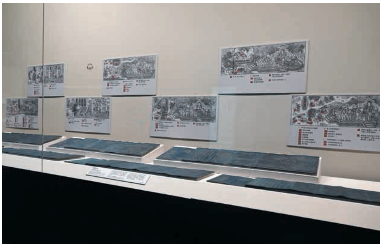
圖 6-2 美術主題標示系統的應用