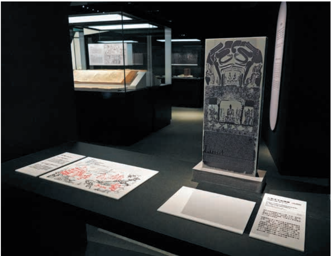
圖 15-1 提供無障礙點字觸摸區，以〈巨始光等造像碑拓本〉模型與元浙江刊蘇寫本之「窮子喻」為主題，採用點字、圖示的雙視設計，幫助視障觀眾及一般觀眾認識這兩件作品。

在新作矮櫃設計上亦考慮輪椅觀眾的視覺高度，如第一單元的兩個矮櫃高度設為 98 公分，輪椅觀眾可側向接近觀看。而其他展陳策略上，除了掛軸、拓片外，大部分文物展示高度約 90 至 100 公分，普遍使用斜墩增加文物觀賞舒適性，或使文物陳列位置更靠近觀者，如第三單元全幅展出的《觀世音菩薩普門品》。另外，櫃內的說明圖板及品名卡的位置與比例，亦考量一般觀眾及輪椅觀眾閱讀的舒適性，提供排版乾淨、清楚易讀的版面設計，或將展件局部放大，提高其可讀性。