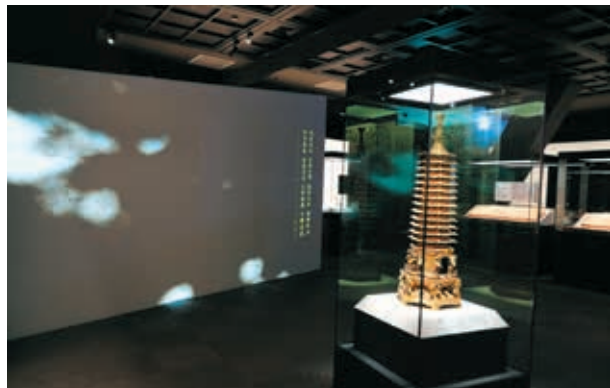
圖 14 導入自然、光元素設計經文光牆，在展場中作為視覺端點、同時轉換觀眾心情。

文，如佛陀正在說法。而這經文牆實質上破除展場實體界線，於走道尾端形成虛空間，把自然遐想、時間流動帶進空間裡。虛實交替地營造神秘感、自然感，也為觀眾帶來驚奇，透過觀看隨即轉換不同心情感受。（圖 14）