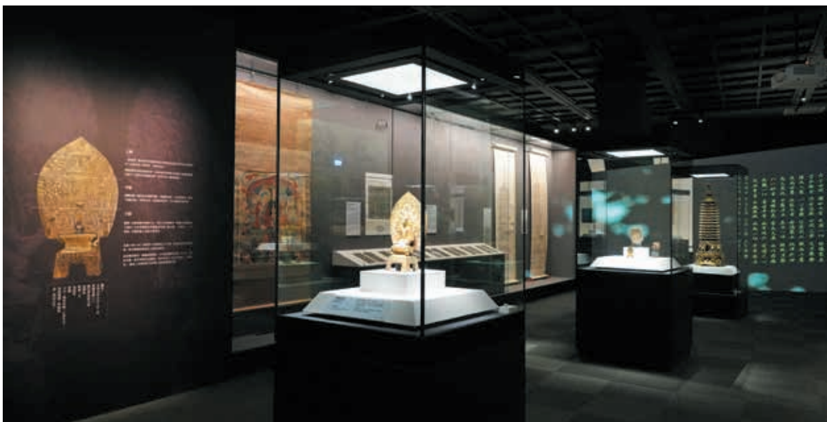
圖 11-2 二佛並坐與經塔信仰區，〈釋迦牟尼佛〉旁輸出佛像背光說明，提供清楚解說。

在〈釋迦牟尼佛〉像兩側設有直立展櫃，為拉近觀眾觀展距離，展櫃深度僅設計為 50 公分。直立櫃陳列的是二佛並坐主題作品，如第一檔展出西魏大統六年（540）〈巨始光等造像碑拓本〉、西魏大統十三年（547）〈陳神姜等造像碑拓本〉。