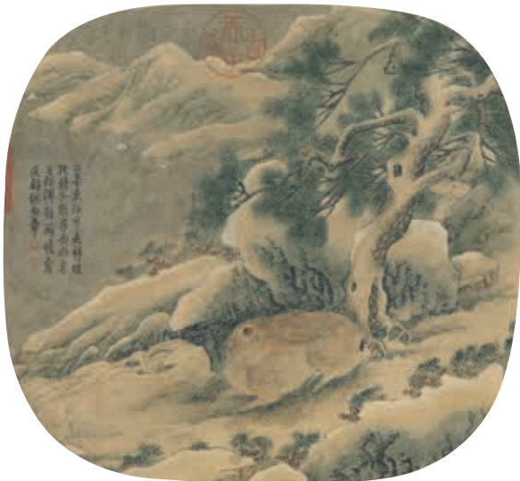
圖4 唐 刁光胤 喬松臥兔 冊 國立故宮博物院藏 故畫 001113