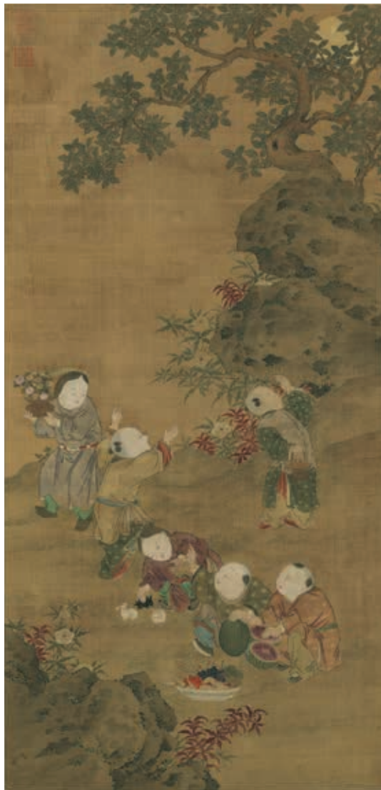
圖6 元 元人 秋景戲嬰 軸 國立故宮博物院藏 故畫 002095 本次展覽選件

〈秋景戲嬰〉畫面前方果盤內，盛裝了桃子、蓮藕、蓮蓬、葡萄、菱角等各式蔬果，旁亦有剖好的西瓜。桃實能延年益壽，蓮子為連生貴子，西瓜多子，或也可再加上兔兒多產、諧音之意，整幅作品充滿多子多壽的吉祥寓意。