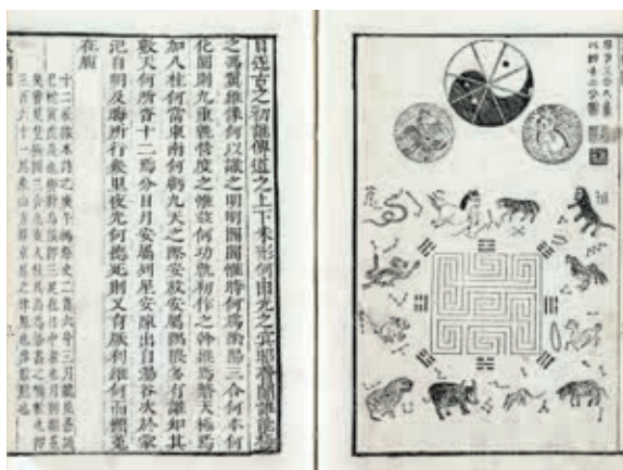
圖 13 清 蕭雲從《離騷圖》清順治二年（1645）刻本 國立故宮博物院藏 贈書 004159

本次展出的是門應兆本〈天問〉第一開，文本相傳是戰國時期楚國詩人屈原（約西元前 340-278）所做，全詩是對宇宙天地、自然、神話、歷史等各項事物的一連串疑問。作品左文右圖，蕭氏清初刻本上有標示圖名〈日月三合九重八柱十二分圖〉（圖 13），並以小字加注插圖的創作緣由與概念。 19 門應兆本則無錄圖名，並省略注解。全幅以白描墨筆描繪，再以淡墨暈染。畫面上方有三個圓輪，中間是象徵陰陽兩極的太極圖，左邊的圓輪代表太陽，內有三足金烏，右邊的圓輪代表月亮，內有兔子。月