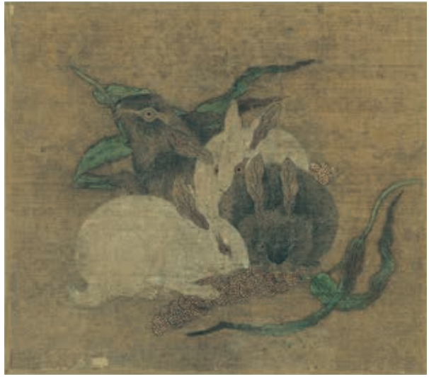
圖3 傳宋 崔白 四瑞圖 冊 國立故宮博物院藏 故畫 001244