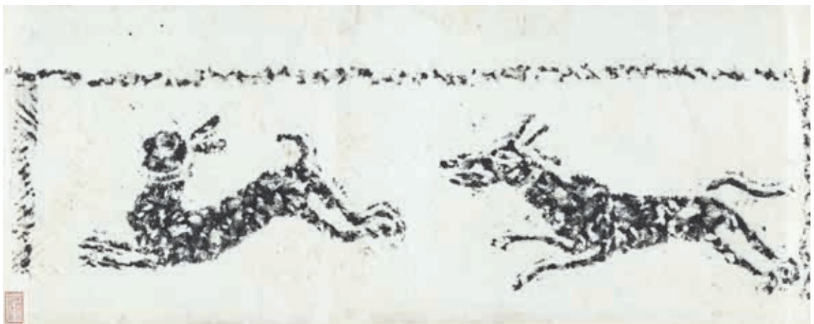
圖1 漢 狗追兔畫像石拓片 國立故宮博物院藏 購拓 000435 本次展覽選件

古代人認為兔子是長壽、祥瑞的動物。 3 東晉葛洪（283-343）《抱朴子》云：「虎及鹿兔，皆壽千歲，壽滿五百歲者，其毛色白。」 4 視兔為長生瑞獸。《宋書》〈符瑞志〉提及：「赤兔，王者德盛則至」、「白兔，王者敬耆老則見」， 5 則將紅、白兔的現身與帝王的德行相關聯。《唐六典》〈尚書禮部〉亦有赤兔上瑞、白兔中瑞之說法， 6 以兔子的毛色來界定吉兆的程度。史書中多有赤兔、白兔現身、地方獻兔的紀錄，如東漢光武帝建武十三年（37）九月南越獻白兔；漢章帝元和年間（84-87）有白兔現身，晉武帝在位年間（265-290），郡國也多次進獻白兔； 7 唐玄宗開元年間（713-741），有赤兔於祭壇附近出現等， 8 顯見兔子現身被視為天示瑞徵。