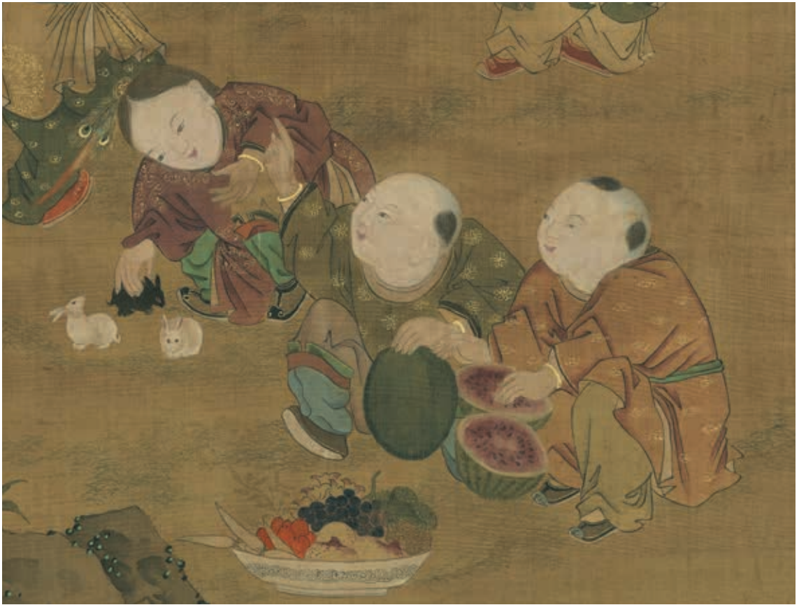
圖7 秋景戲嬰 局部