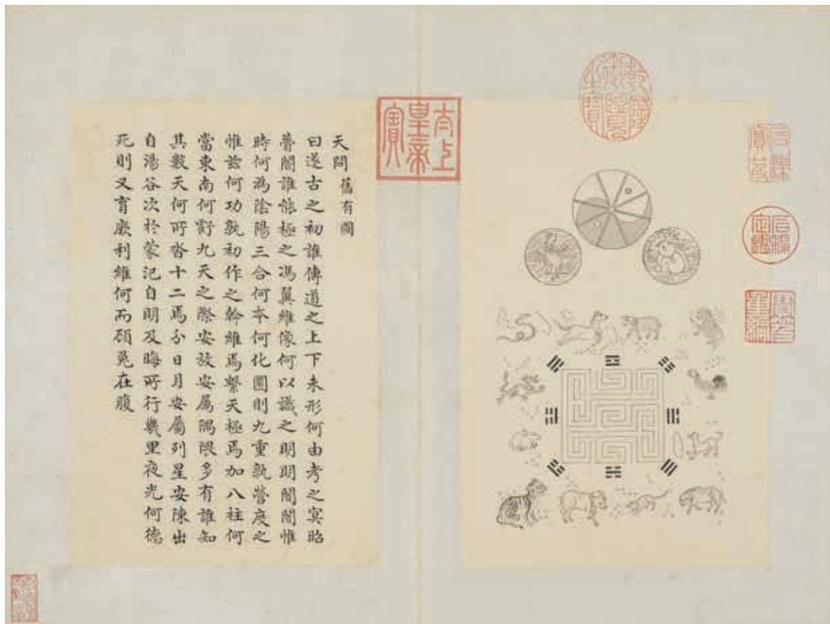
圖 12 清 門應兆 補繪蕭雲從《離騷圖》 天問（第一開） 冊 國立故宮博物院藏 故畫 003390 本次展覽選件

而後乾隆皇帝於編輯《四庫全書》時，從進呈書籍中見此《離騷圖》，甚為喜愛，有感「今書中所存各圖，已缺略不全……雲從本未為圖，自應一併繪入，以彰稱物芳」，便命南書房翰林學士逐一考訂，將應補齊者酌定稿本，並令四庫館繪圖分校官門應兆，仿照蕭氏刊本臨摹、補畫插圖。門應兆曾作《西清硯譜》，