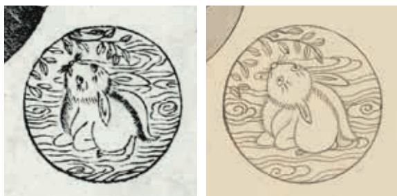
圖 14 天問 局部 左圖蕭雲從本、右圖門應兆本