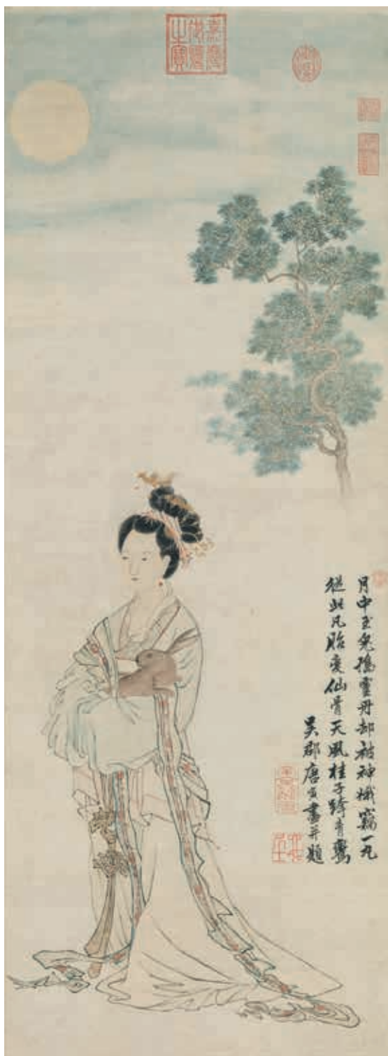
圖 10 傳 明 唐寅 畫嫦娥奔月 軸 國立故宮博物院藏 故畫 001323 本次展覽選件