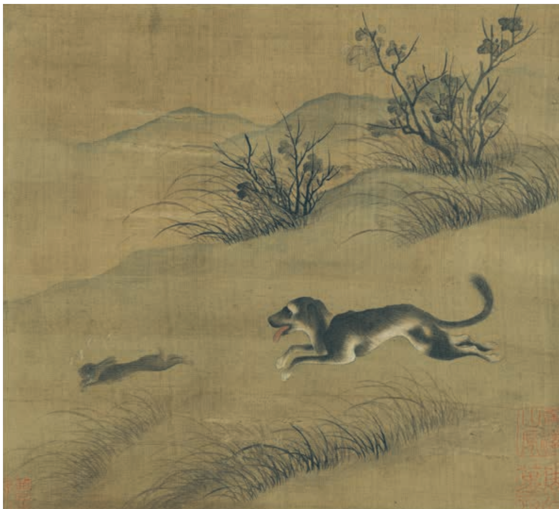
圖2 宋 陳善 畫犬兔 冊 國立故宮博物院藏 故畫 003472

臥兔〉亦被認為有相同寓意。（圖4）刁光胤，一作光引，唐末雍京（今西安）人。黃巢之亂，隨僖宗（873-888 在位）避難至四川，後於成都居住。刁氏善繪花卉竹石、鳥獸魚龍，據稱五代花鳥畫名手黃筌（活動於 903-965），也曾親受其指導。這件作品描繪冬季白雪覆蓋大地，兔子瑟縮地坐臥於大石後，暫避寒冷的景象。全幅景致層次分明，遠景坡石往左側後方推移，增加了畫面空間的深度。臥兔、常綠松樹，以