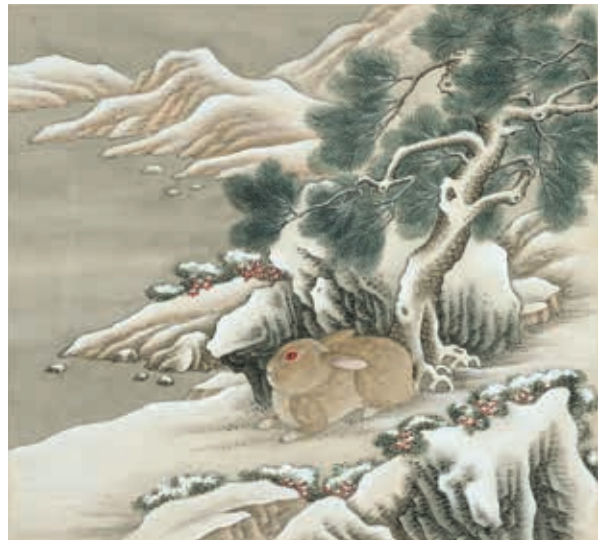
圖5 清 楊大章 喬松臥兔 冊 國立故宮博物院藏 故畫 003396 本次展覽選件

及坡石上些許紅葉，為畫面妝點色彩，也為寒日帶來一絲生機。畫面左側有乾隆皇帝（1736-1796 在位）題跋，首句「二麥東阡早兆祥」，點出這幅冬雪臥兔為五穀豐收之吉兆先聲。此畫收錄於刁光胤的《寫生花卉》套冊，經清代鑑藏家高士奇（1645-1703）收藏、重新裝裱，