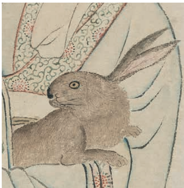
圖 11 畫嫦娥奔月 局部

漢長沙馬王堆一號墓的T形帛畫（1972年出土）（圖 8），左袖上方畫有一眉月，月亮上有蟾蜍和白兔，月下另有一位飛昇女子，現被認為應為嫦娥， 15 因而嫦娥與兔相伴的畫面，或許至遲於西漢時期便已出現。至唐代，嫦娥與兔的月宮圖像也能見於銅鏡紋飾上。（圖 9）