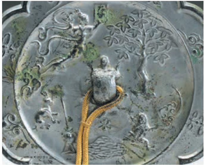
圖9 (右) 中唐 月魄菱花鏡 局部 國立故宮博物院藏 中銅 000386