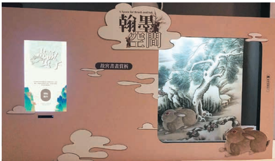
圖 15 展覽兔年拍照互動打卡區