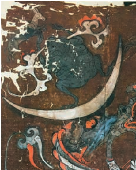
圖8 (左) 湖南長沙馬王堆一號墓的T形帛畫 局部 湖南博物院藏 取自湖南省博物館、中國科學院考古研究所編，《長沙馬王堆一號漢墓·下集》，北京：文物出版社，1973，頁57。