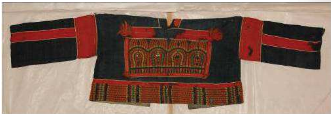
圖 3 推測為西鄉從道獲贈的原住民上衣

此外，西鄉從道與原住民談判會面的過程當中，獲得鹿皮兩枚，後連同在竹社口所獲得的蕃衣，一同送回日本。長崎支部收取物件後，隨即將物品以紙包裝，裝入箱內，送往東京。而物品於 7 月下旬抵達橫濱港稅關，後送往宮內。8 月，上陳天皇御覽，閱覽完畢後，將鹿皮與蕃衣各裝一箱，共計兩箱歸還予蕃地事務局。 31