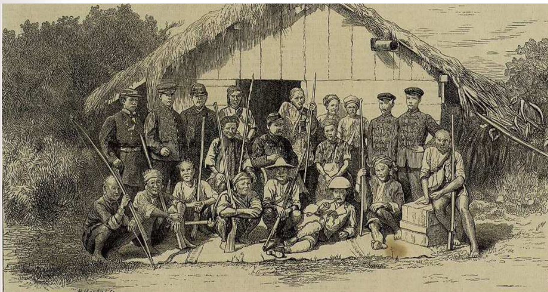
圖 1 西鄉從道與原住民合影

另在 12 月事件結束、日軍離臺之際，除了先前已經送往日本的排灣族少女，尚有一名原住民潘阿春，及連同擔任翻譯的清國浙江人黃慶發，一同離臺，另待安排。