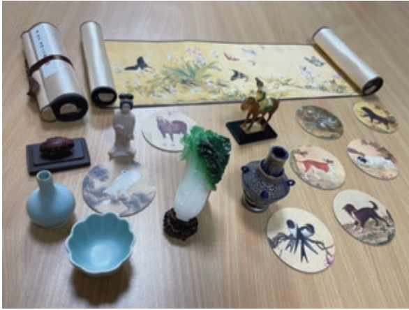
圖 3 運用本院已開發之迷你複製文物及圖卡等教材作為教保人員應用於到宅活動的素材。