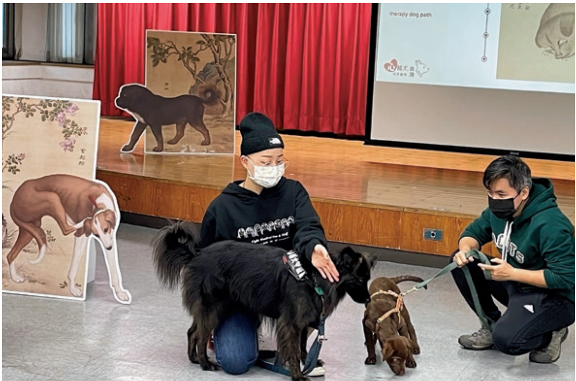
圖2 與培訓流浪狗陪伴身心障礙者的「臺灣心輔犬培育團隊」合作，觀察畫作圖像、解說犬隻動作可能代表的身體訊息，引導教育犬與學員遊戲互動，增進特殊幼兒認知、情緒與社交等能力。

學員障別有語言障礙、動作協調障礙、自閉症、發展遲緩及合併多重障礙等，由於口語表達及動作發展能力有限，故課程重心設定為促進動作發展及多元感官體驗，包括文物圖像姿態觀察、動作模仿、複製文物觸摸與藝術材料探索等，如：讓幼兒騎乘在教師背上，模仿唐韓幹（八世紀）〈牧馬圖〉中奚官騎馬姿態，訓練身體肌力與平衡力；觀察清中期〈白玉錦荔枝〉圖像，觸摸複製文物與真實苦瓜，嗅聞苦瓜剝開後的氣味，增加多元感官體驗；觀察民國丁衍庸（1902-1978）〈鬱金香與青蛙〉的