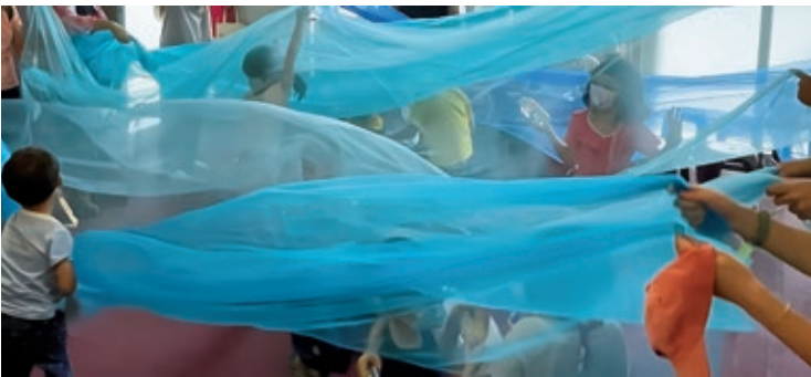
圖 15 肢體遊戲：帶著自己創作的魚兒，與家人一起在海洋裡悠遊。