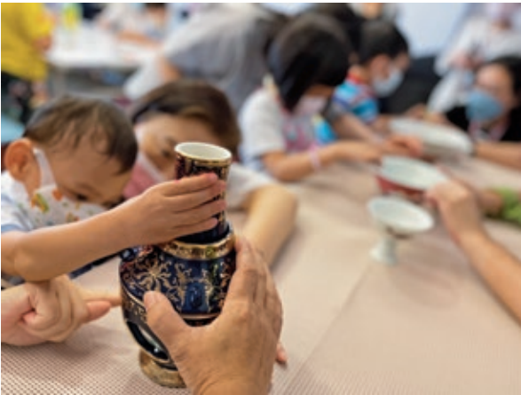
圖 13 複製文物觸摸：觀察魚的顏色、形狀、數量及表達觸摸感受。

以學前特教老師巡迴輔導的2至6歲特殊幼兒、家長及學校為主的活動設計，則注重與生活經驗的連結。除了幼兒生理能力與家長親職功能的提升，並包含學校融合教育的教案規