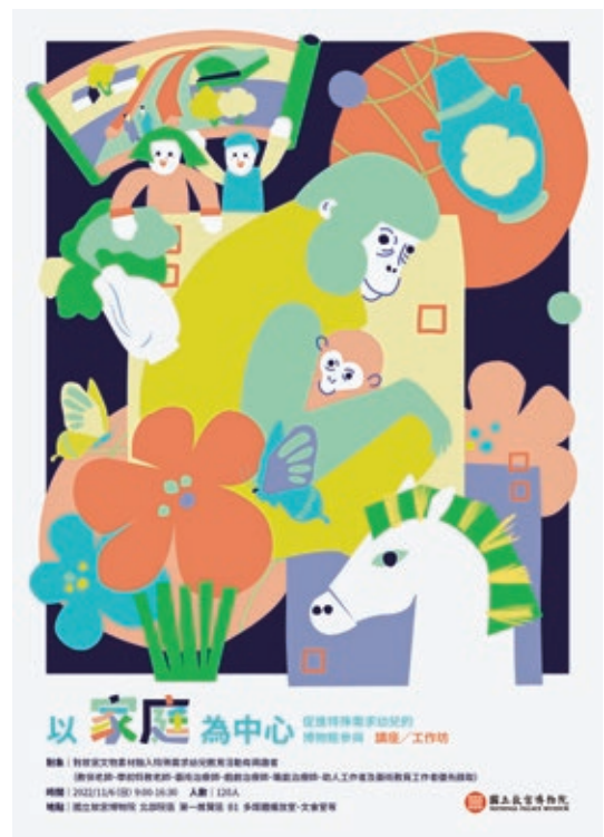
圖1 本院舉辦「以家庭為中心——促進特殊需求幼兒的博物館參與」講座/工作坊，促進故宮文物跨域應用及早期療育社群交流。

2021年起，故宮邀請教保人員、學前特教老師、藝術統合教師、藝術治療師、戲劇治療師、職能治療師、諮商心理師及本院導覽志工，組成課程設計與服務團隊，至早療日照機構、家內、社區資源中心舉辦療育活動。2022年中，故宮統整前述外展服務經驗後，邀請特殊需求家庭走入故宮，於館內舉辦展場探索與藝術體驗活動，並辦理課程培訓與實務工作坊（圖1）， 11