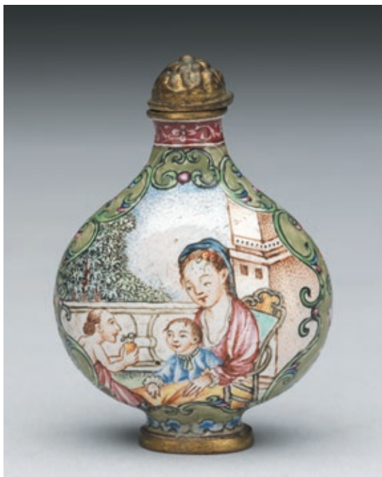
圖 8 清 乾隆 銅胎畫珐瑯西洋母子鼻煙壺 國立故宮博物院藏 故珐 000873 從具生活感的文物圖像回望親子日常的身體互動經驗

互動（圖 7、8）與藝術材料創作，觸摸複製文物與藝術材料質地表達感受（如：青銅器摸起來冰冰的、毛根摸起來刺刺的），或觀察與討論文物圖像主角喜怒哀樂的表情或動作，增進學員對情緒的辨識覺察，並向家長示範如何運用肢體互動或多元藝術材料安撫與調節幼兒情緒。