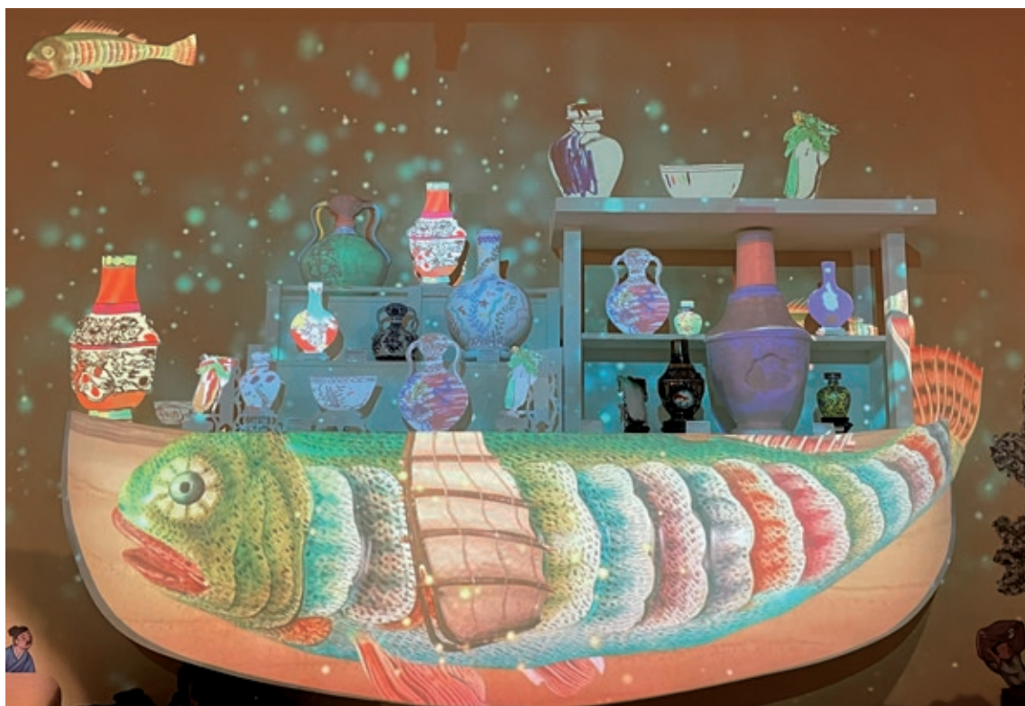
圖 17 數位體驗：帶著作品到兒童學藝中心餵魚（掃描上傳投影），原來彩色怪魚在這裡！