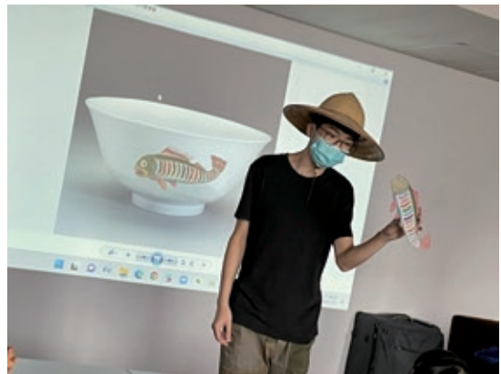
圖 10 揭開故事線：有怪魚闖入故宮，把文物上的魚兒們趕跑了，請大家幫忙把游走的魚找回來！