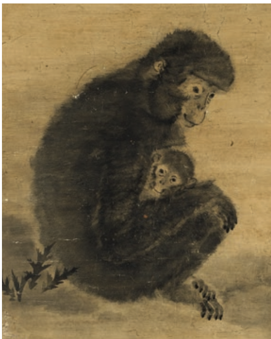
圖 7 宋 易元吉 子母猴 軸 局部 國立故宮博物院藏 贈畫 000311 從動物的母嬰擁抱引發親子共感，鼓勵照顧者與幼兒擁抱與道愛，建立親子安全依附感。