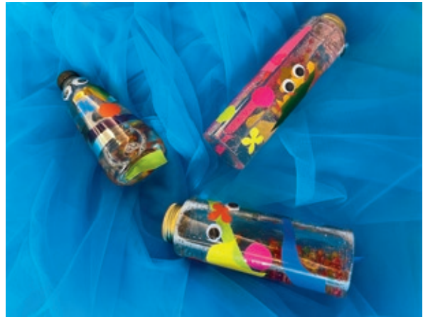
圖 14 手作活動：透過擠壓膠水瓶、倒入亮粉、抓取水晶寶寶、剝黏貼紙與眼珠等活動訓練手部精細動作，並發揮創造力，創作一條屬於自己的魚（具舒緩功能的靜心瓶）。