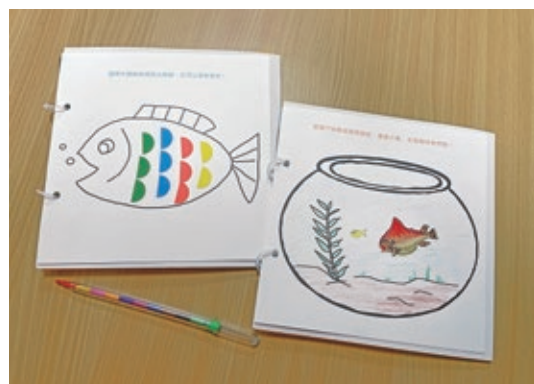
圖 18 遊戲手冊：除了搭配展廳任務，亦包含自由創作頁面，於活動中作為幼兒情緒緩衝或返家後延續運用的資源。

本案運用博物館物件學習導向結合早期療育專業師資，除了發揮藝術療育潛能，並彰顯社會互動為博物館重要功能之一。故宮規劃外展活動接觸多元社群，實踐文化平權，邀請發