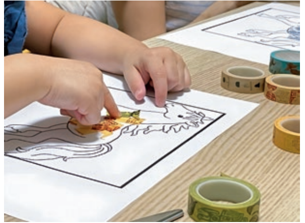
圖 4 運用紙膠帶為圖案上色的素材，鼓勵撕貼或剪下交由幼兒黏貼，可訓練手部精細動作。