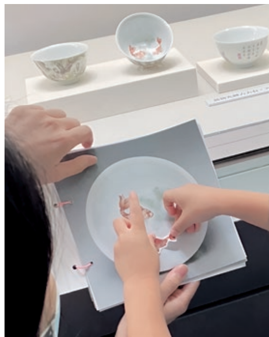
圖 12 展品觀察：找找看是哪隻魚跑出來了，選擇同樣圖案的貼紙，讓魚兒回家。