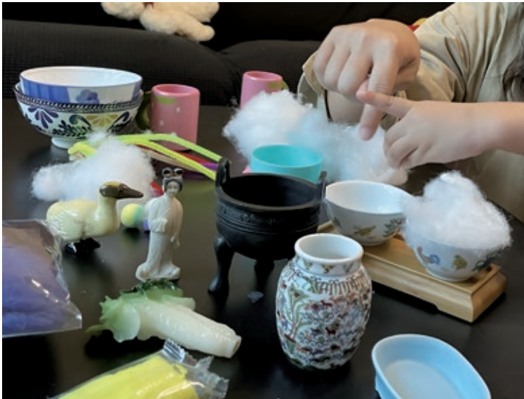
圖5 結合故宮迷你複製文物、家中的餐具與玩具，引導幼兒在扮演遊戲中探索物件及藝術材料的形狀與觸感。

到宅療育專案進行之際，士林北投、信義南港及中正萬華早期療育社區資源中心同步邀請故宮課程團隊至社區舉辦早療親子課程。以在地4至6歲早療需求兒童及家庭成員為對象，選擇貼近日常生活經驗的主題，以及促進社會情緒發展為目標，結合故宮導覽志工與藝術治療師，將動物母子及清代課子圖題材等故宮文物圖像融入活動設計。內容包含引導親子肢體