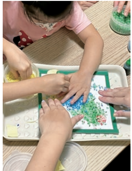
圖6 到宅活動尾聲，藝術治療師引導家庭成員共同創作，促進家人之間非語言的情感交流。