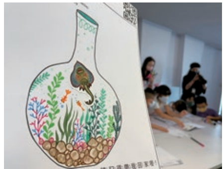
圖 16 表達與交流：幼兒、手足與照顧者在紙上天球瓶裡畫下魚和水草，完成後與其他學員分享。