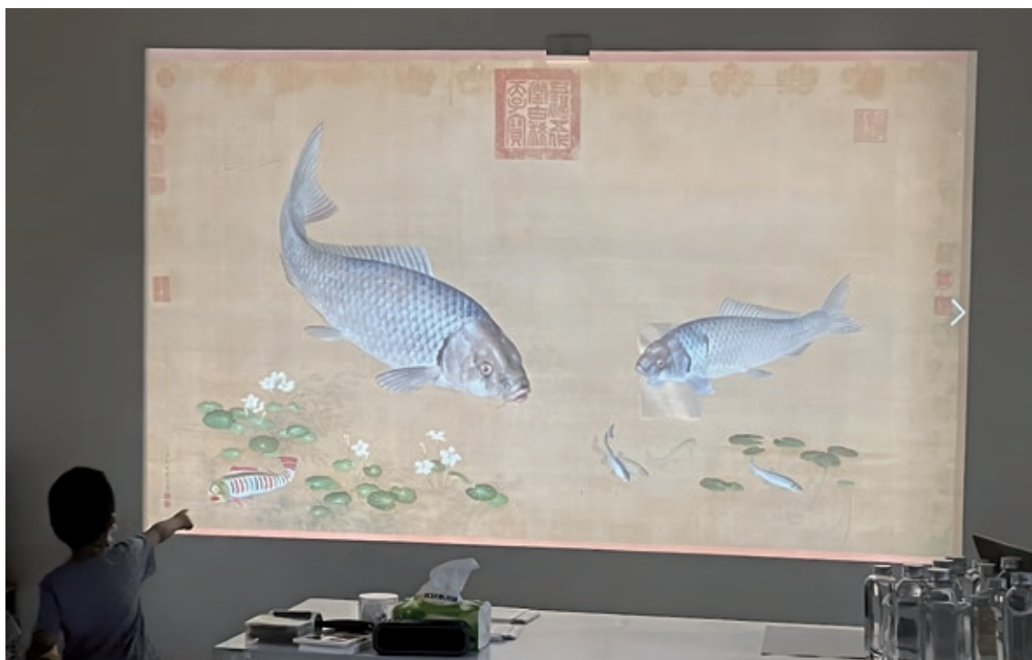
圖 11 視知覺遊戲：進展場前先訓練觀察力，找找怪魚躲在哪裡？

的區域。活動結束後，多數家長回饋認為透過遊戲可提升孩子對文物的興趣，並對導覽老師的貼心照顧與引導感到印象深刻，整體活動創造了親子正向互動體驗。部分家庭於活動結束後，選擇再回到展場中觀看其他文物與體驗數位互動設施，多位家長並表示，過去不敢帶孩子進博物館，在參與本系列活動後，開始比較有動機和勇氣嘗試。